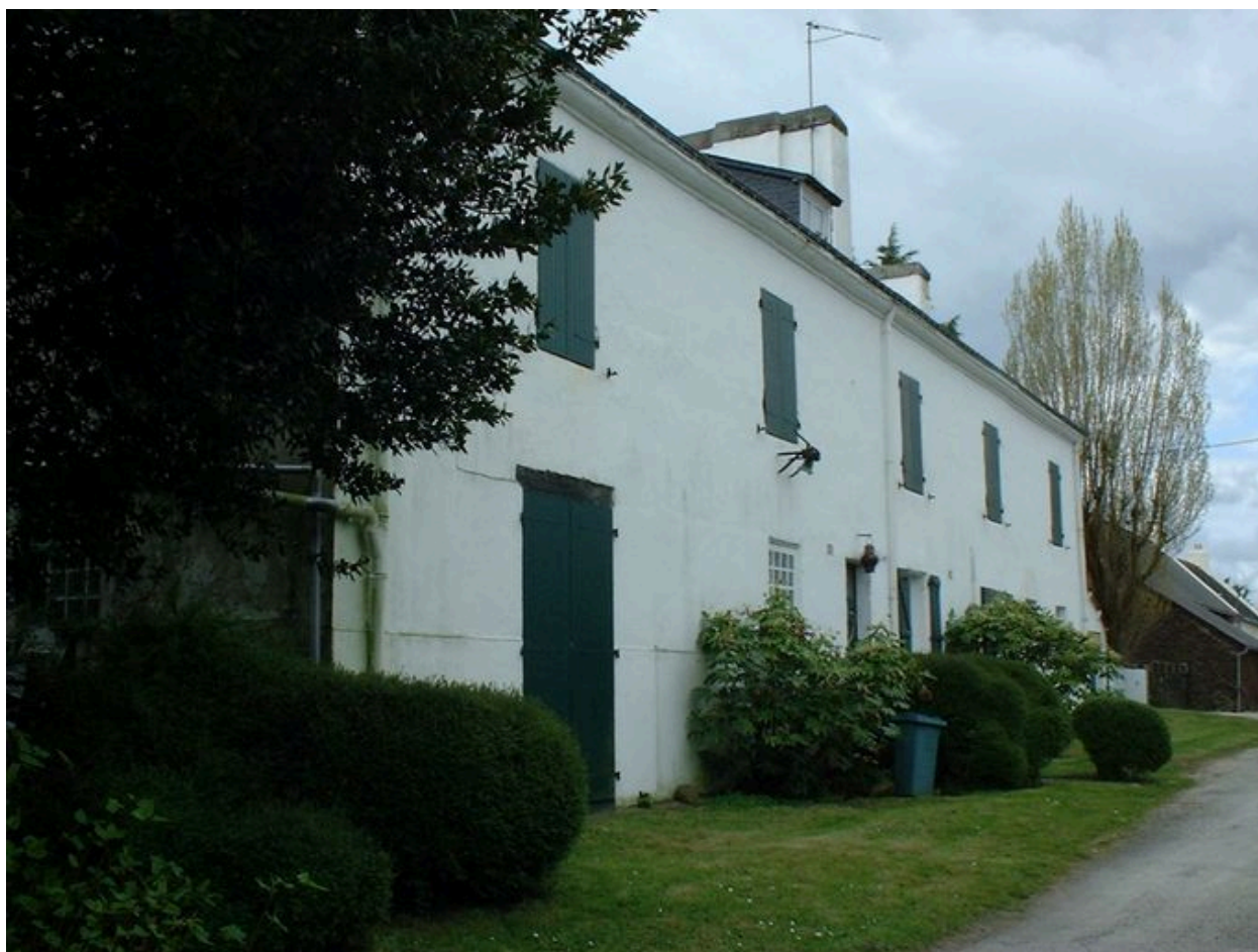
Ancienne caserne des douaniers des Quatre-Vents, devenue colonie de vacances puis maison d'habitation