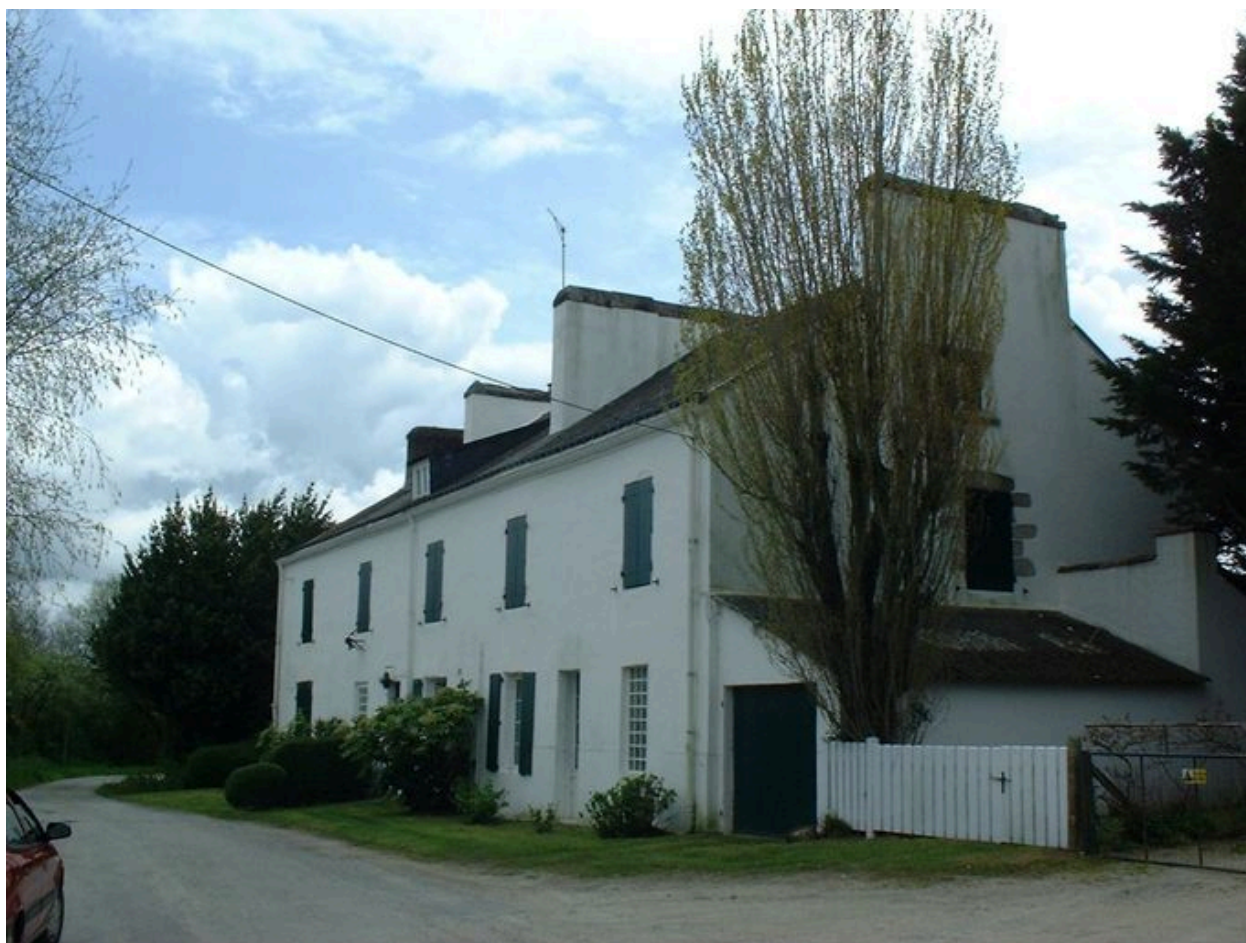
Vue générale de la caserne des douaniers des Quatre-Vents, devenue colonie de vacances puis maison d'habitation