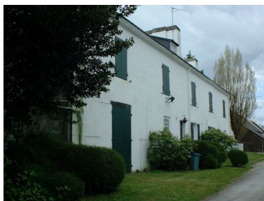
Ancienne caserne des douaniers des Quatre-Vents, devenue colonie de vacances puis maison d'habitation