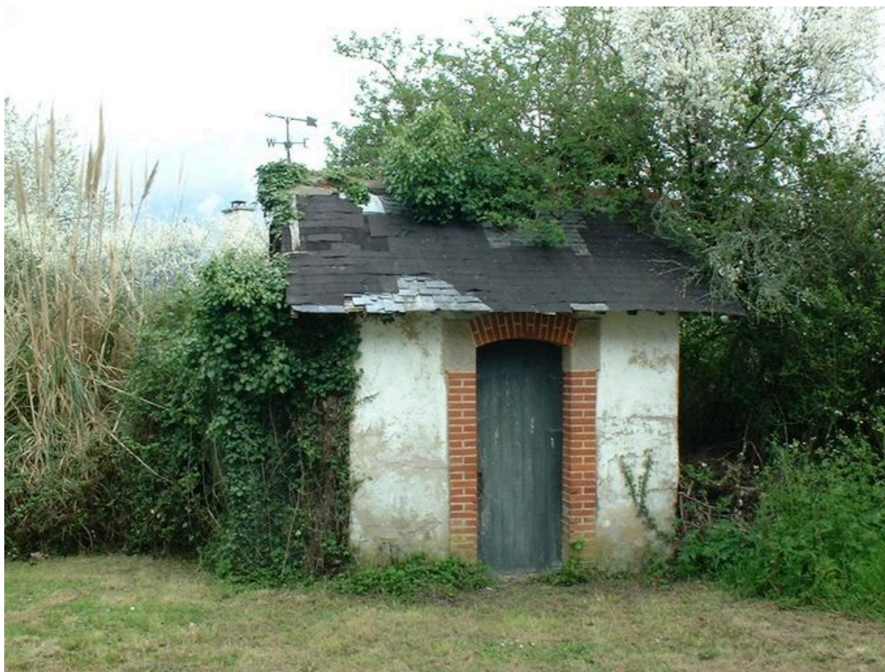
Dépendance de l'ancienne caserne des douaniers des Quatre-Vents