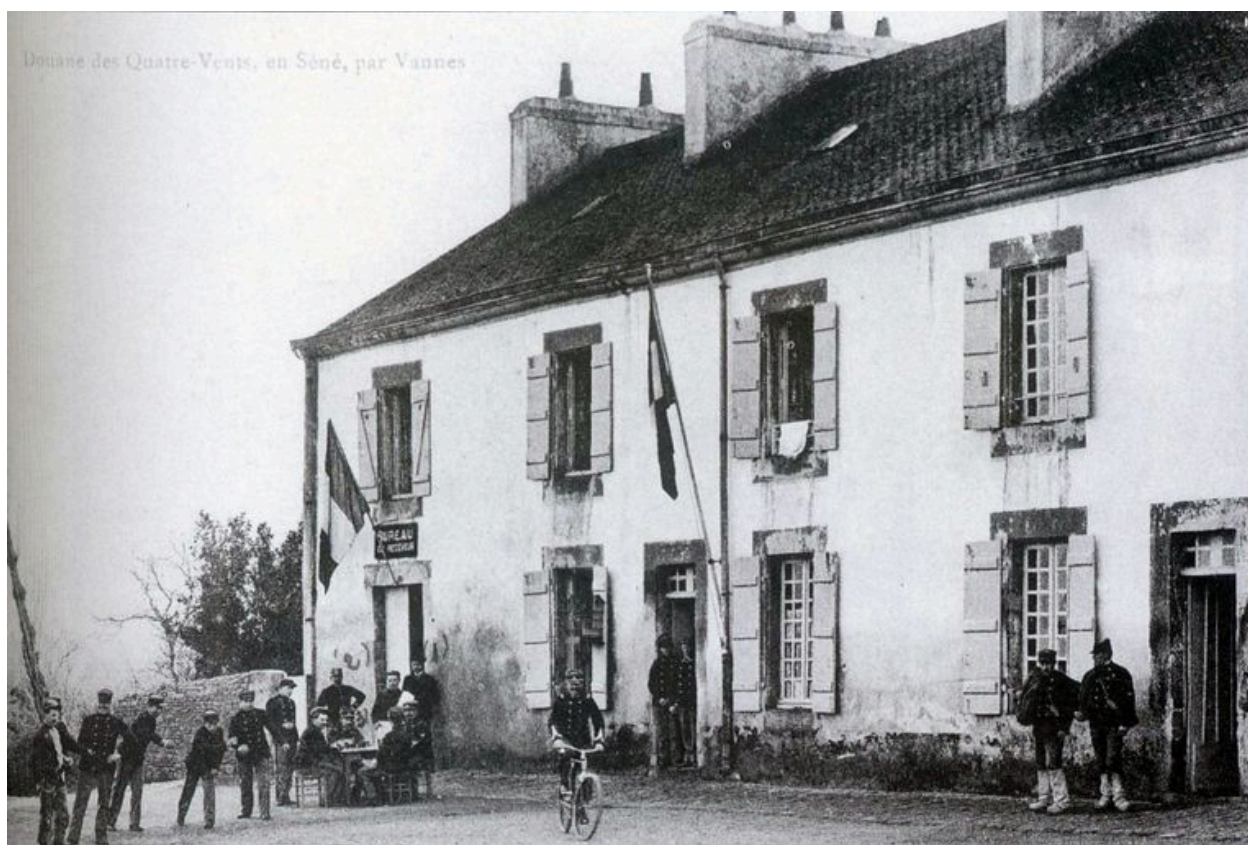
Vue ancienne de la caserne des douaniers des Quatre-Vents au début du 20e siècle