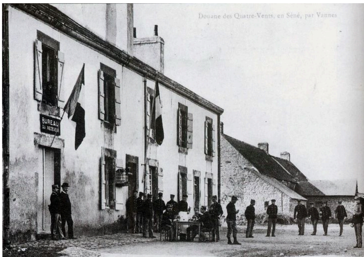
Vue ancienne de la caserne des douaniers des Quatre-Vents au début du 20e siècle