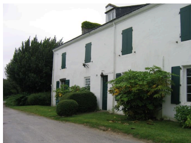
Ancienne caserne des douaniers des Quatre-Vents, devenue colonie de vacances puis maison d'habitation IVR53_20075605763NUCA