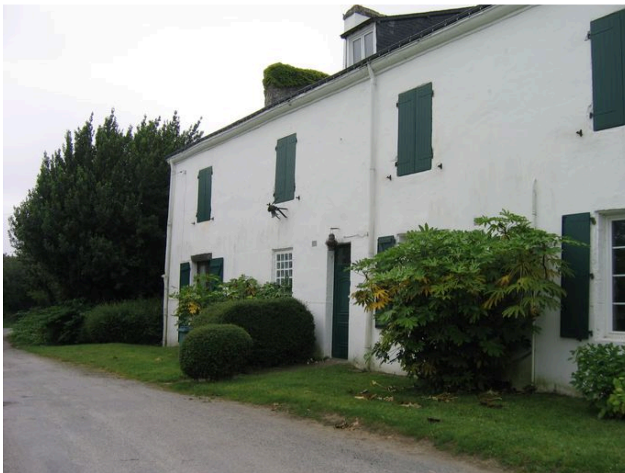
Ancienne caserne des douaniers des Quatre-Vents, devenue colonie de vacances puis maison d'habitation