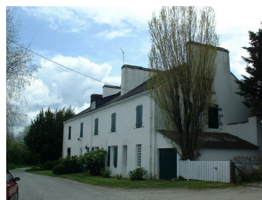
Vue générale de la caserne des douaniers des Quatre-Vents, devenue colonie de vacances puis maison d'habitation