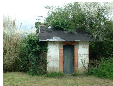
Dépendance de l'ancienne caserne des douaniers des Quatre-Vents