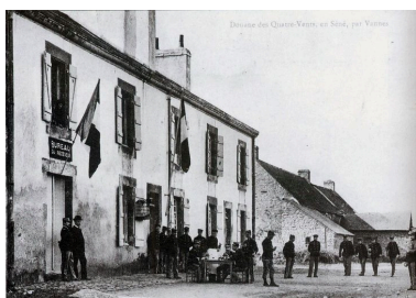
Vue ancienne de la caserne des douaniers des Quatre-Vents au début du 20e siècle