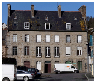
Vue générale de l'élévation principale (2008) IVR53_20082212656NUCA