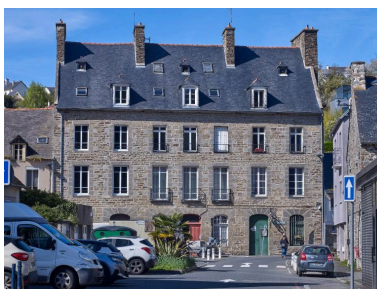
Immeuble de logements, anciennes maisons d'amateurs, à usage commercial en rez-de-chaussée IVR53_20262200244NUCA

IVR53_20082212692NUCA