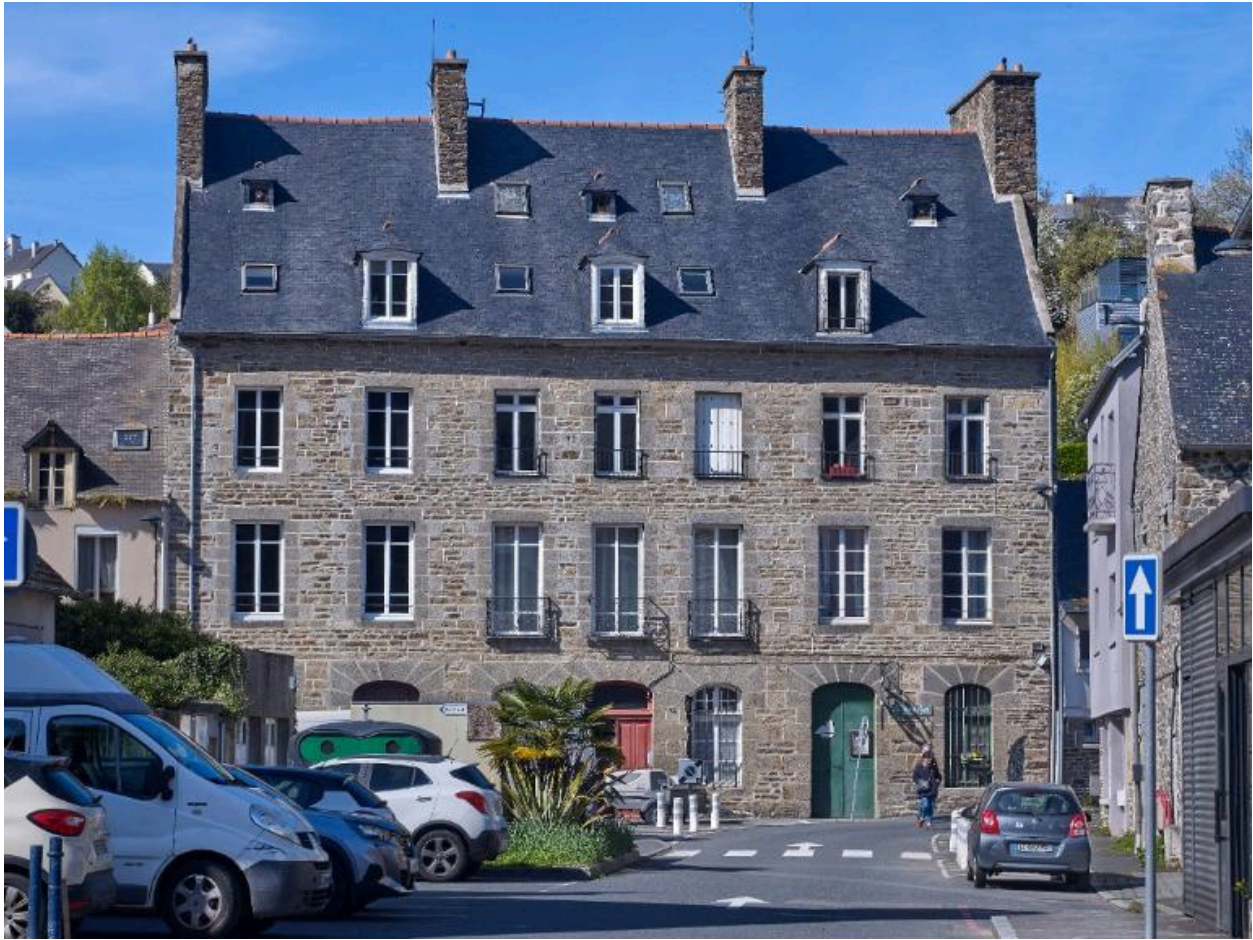
Immeuble de logements, anciennes maisons d'amateurs, à usage commercial en rez-de-chaussée