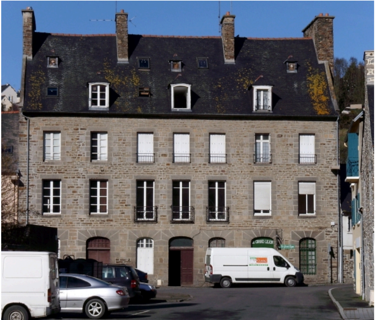
Vue générale de l'élévation principale (2008)