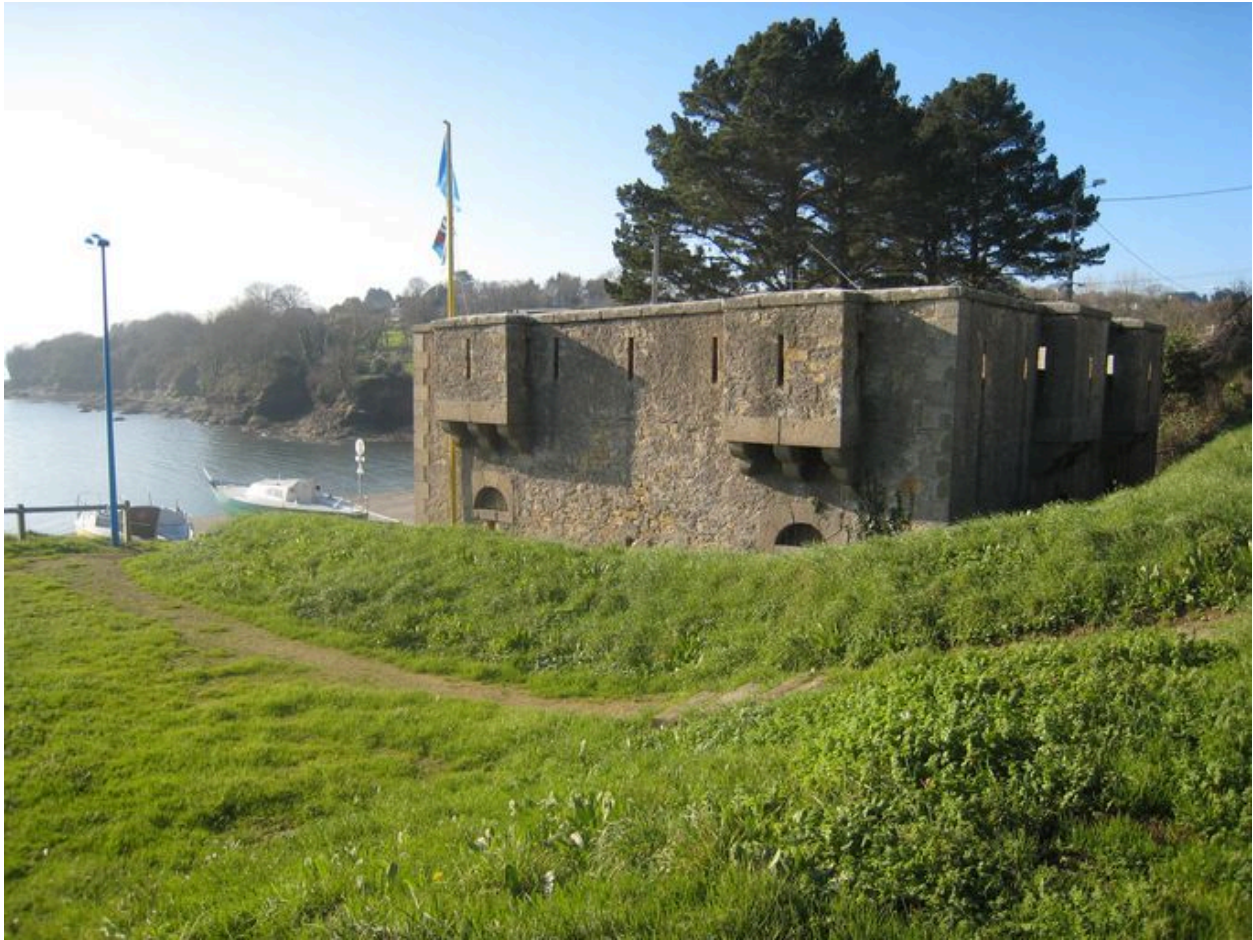
Vue arrière du corps de garde