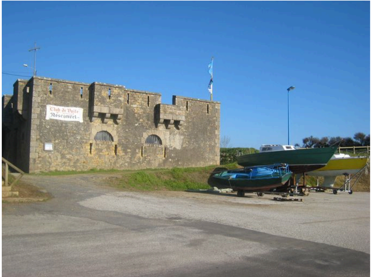
Vue générale du corps de garde