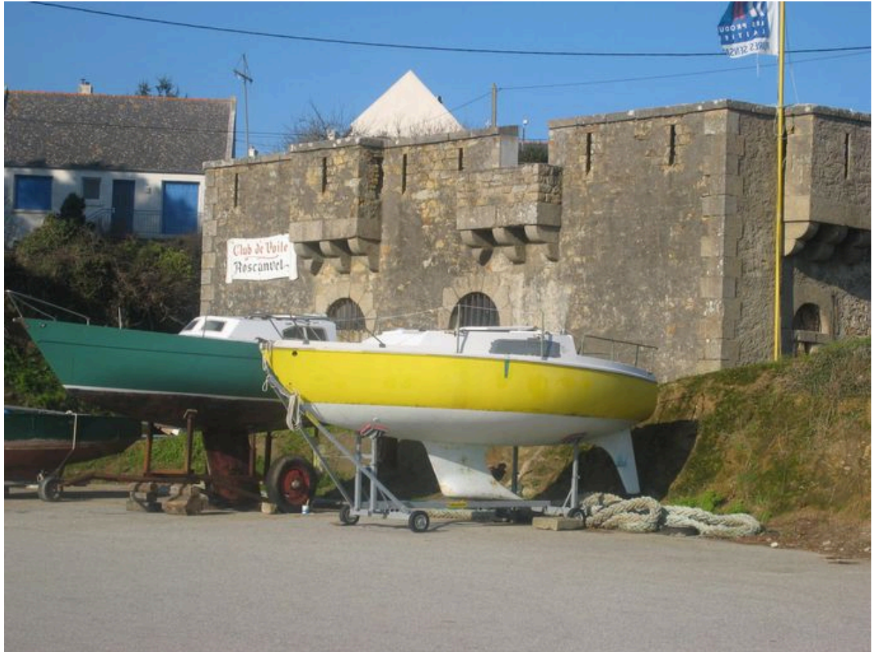
Corps de garde