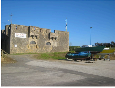
Vue générale du corps de garde