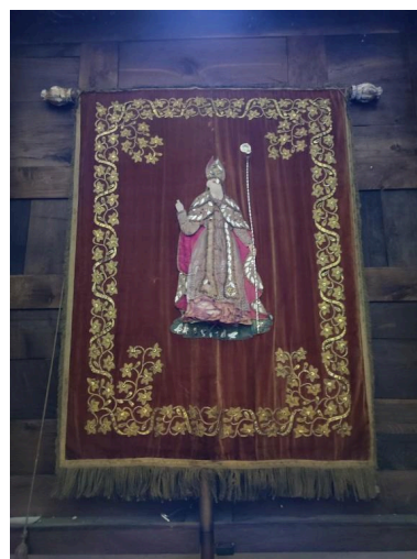
Bannière paroissiale de Broos-sur-Vilaine, provenant de l'église Saint-Martin : face représentant saint Martin