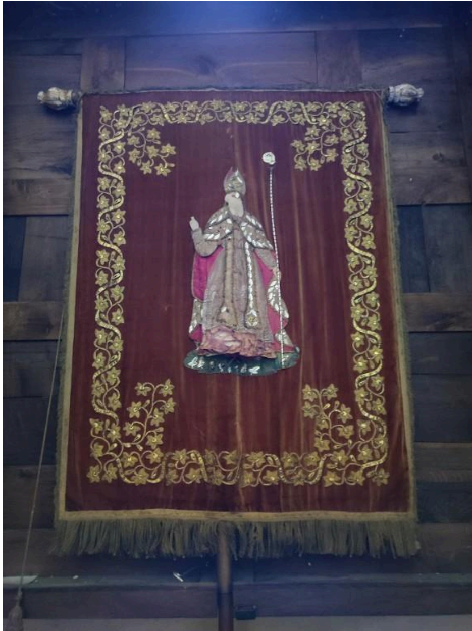
Bannière paroissiale de Broos-sur-Vilaine, provenant de l'église Saint-Martin : face représentant saint Martin