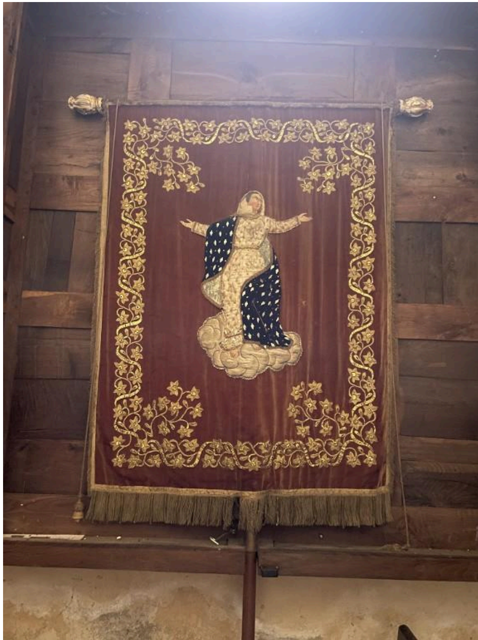
Bannière paroissiale de Broos-sur-Vilaine, provenant de l'église Saint-Martin : face représentant l'Assomption