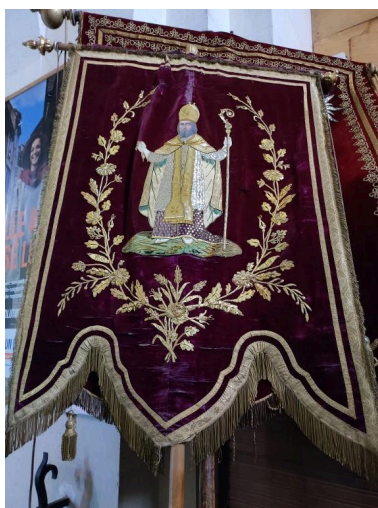
Bannière provenant de l'église Saint-Melaine : face représentant saint Melaine IVR53_20243531060NUCA