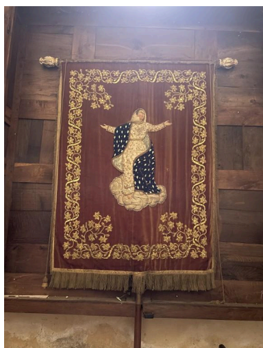
Bannière paroissiale de Broos-sur-Vilaine, provenant de l'église Saint-Martin : face représentant l'Assomption IVR53_20263510310NUCA