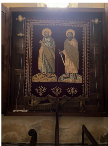
Bannière paroissiale de l'église Saint-Pierre : face représentant saint Pierre et saint Paul