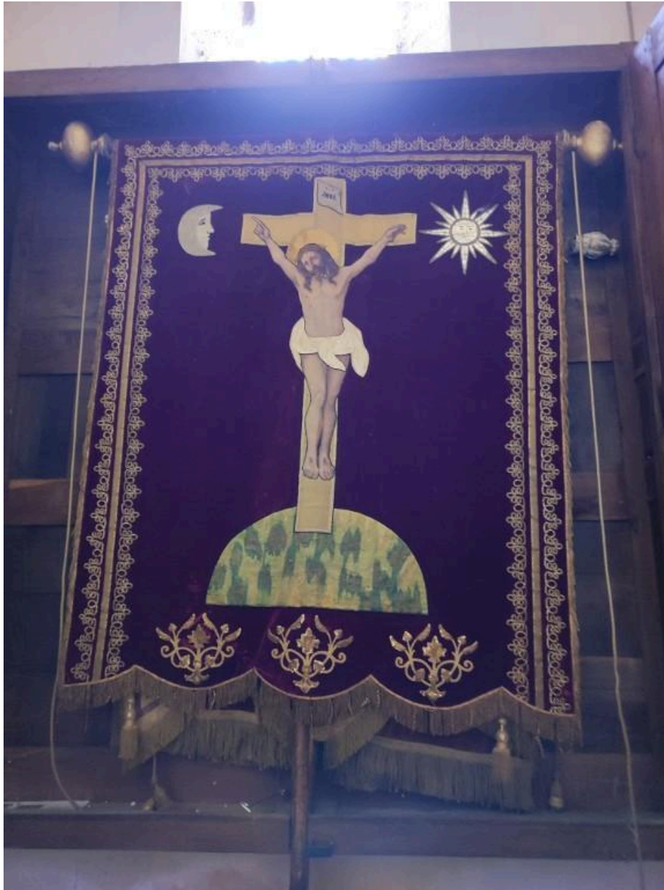
Bannière paroissiale de l'église Saint-Pierre : face représentant la Crucifixion