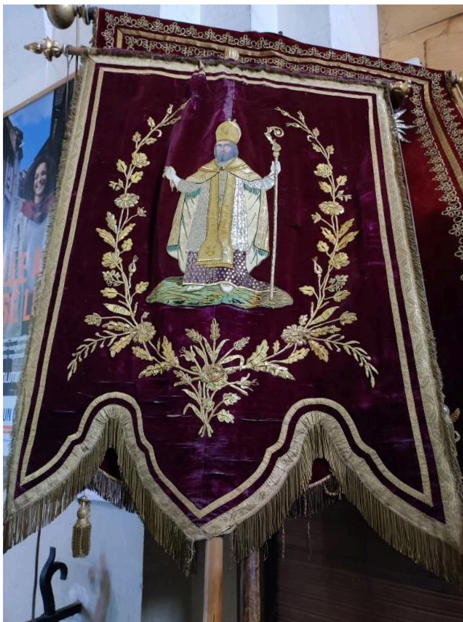
Bannière provenant de l'église Saint-Melaine : face représentant saint Melaine