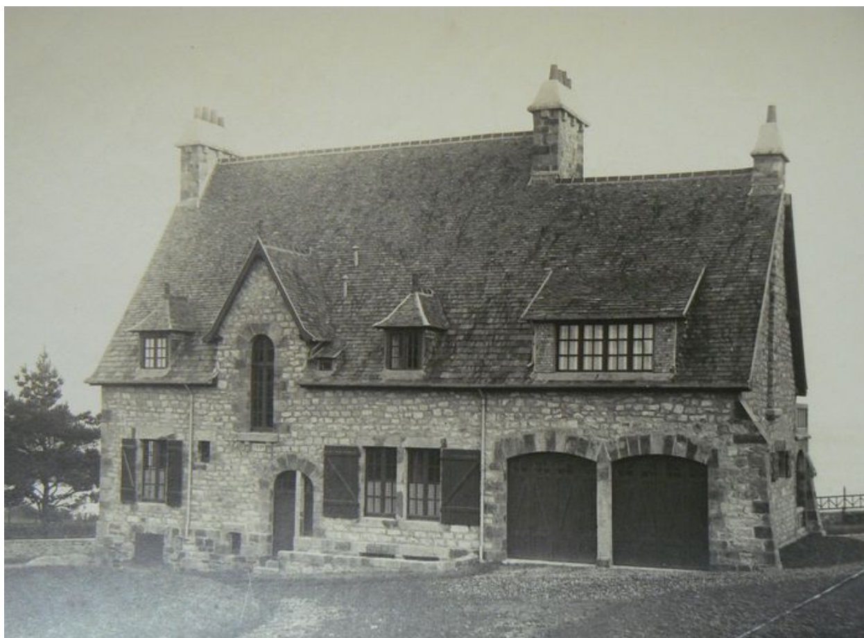
Vue ancienne de l'arrière de la villa Les Grottes, côté terre