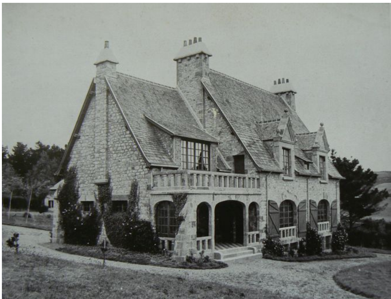
Vue générale ancienne de la villa Les Grottes, côté mer