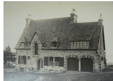
Vue ancienne de l'arrière de la villa Les Grottes, côté terre IVR53_20072908731NUC