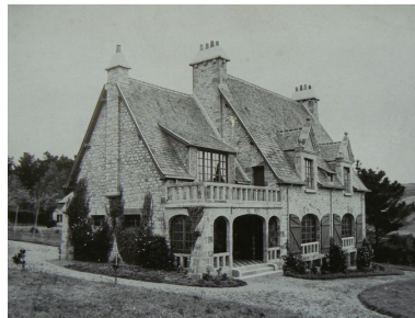
Vue générale ancienne de la villa Les Grottes, côté mer IVR53_20072908732NUC