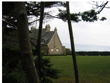
Vue latérale de la villa Les Grottes