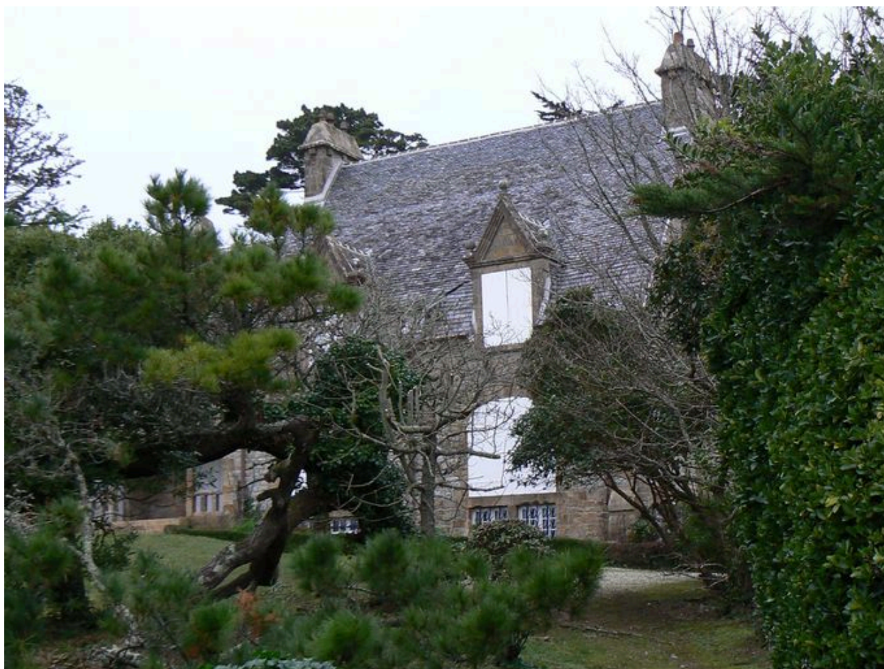
Vue de la villa Les Grottes, côté mer