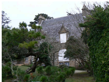
Vue de la villa Les Grottes, côté mer