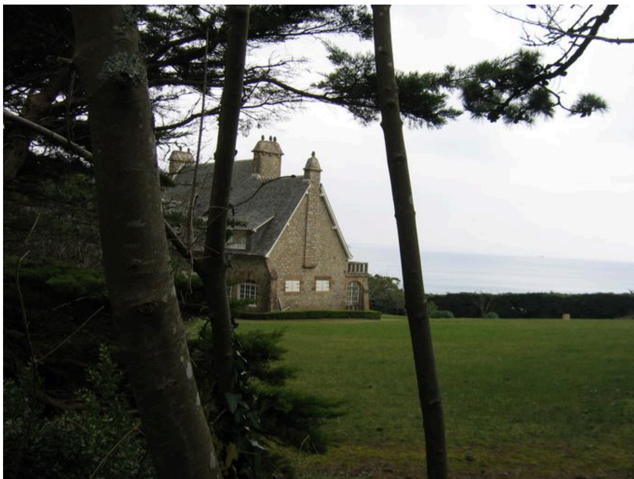
Vue latérale de la villa Les Grottes