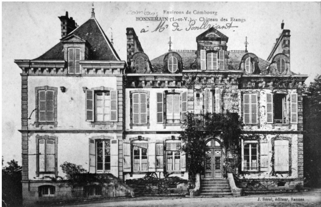
La nouvelle demeure au début du 20e siècle