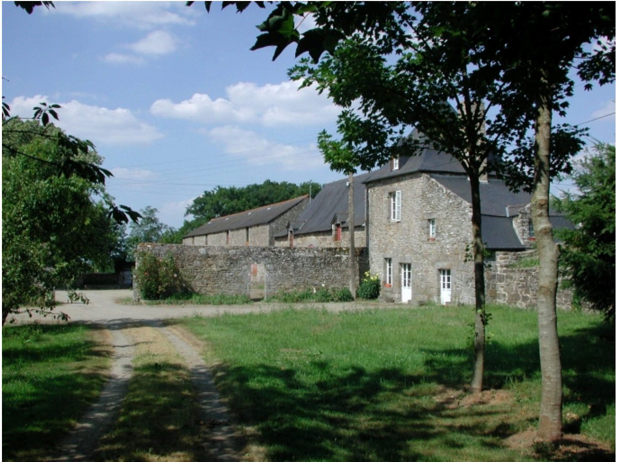
L'emplacement de l'ancien manoir