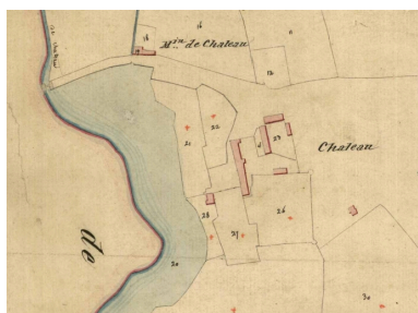
Cadastré vers 1825