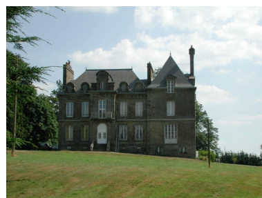
La demeure de la fin du 19e siècle ; vue générale nord