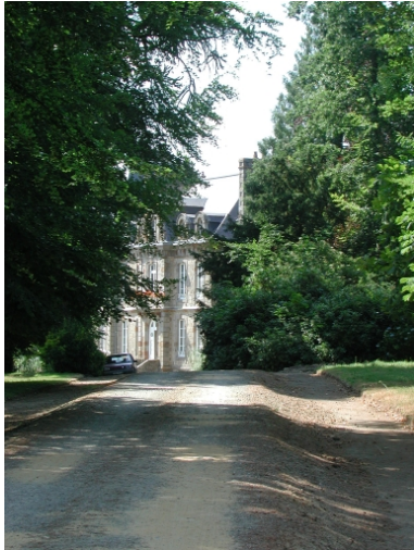
Vue partielle sud est IVR53_20013519919NUCA