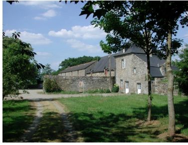
L'emplacement de l'ancien manoir