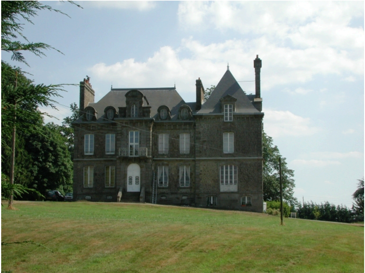
La demeure de la fin du 19e siècle ; vue générale nord