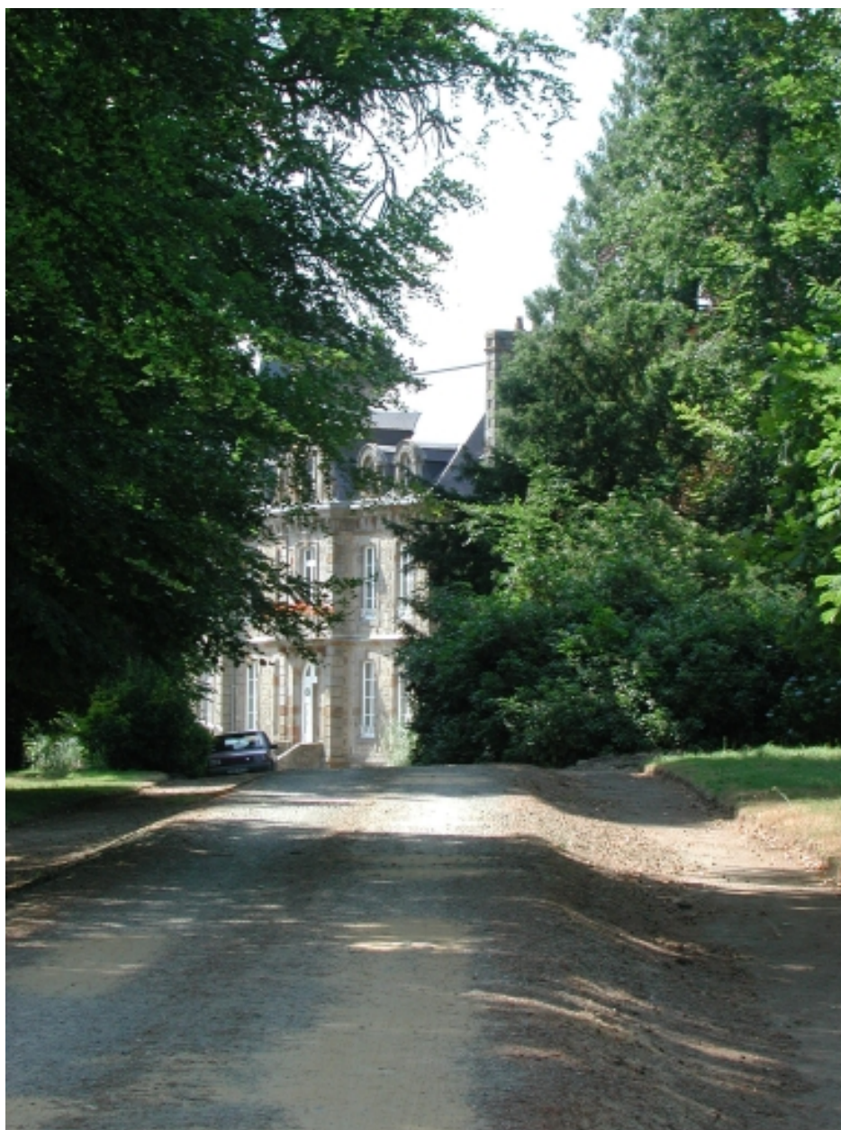
Vue partielle sud est