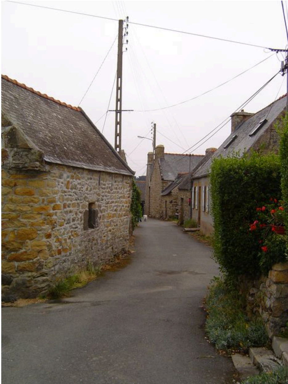
Village de Rostellec