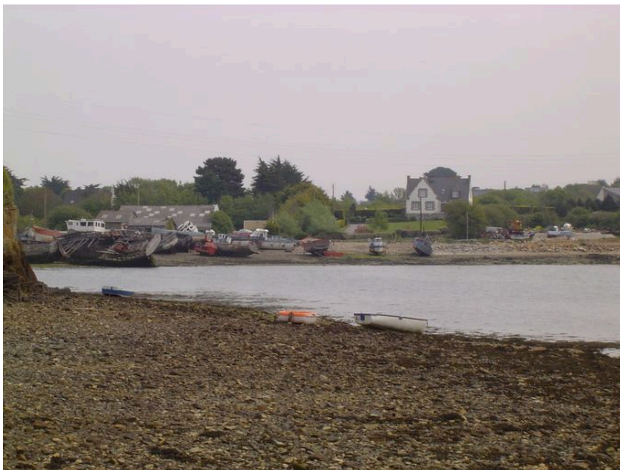
Vue générale de l'écart de Rostellec