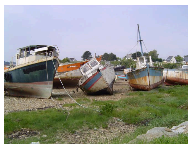
Cimetière de bateaux de Rostellec IVR53_20062908532NUCA