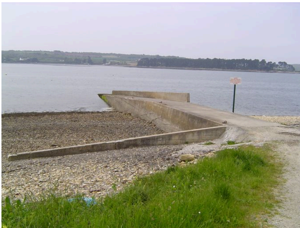
Cale de Rostellec