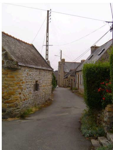
Village de Rostellec IVR53_20062908525NUCA