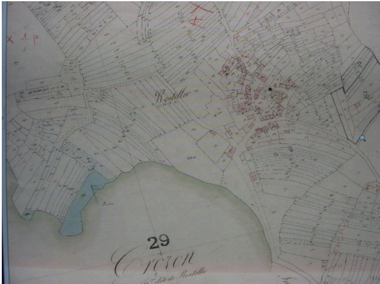
Cadastre de Rostellec de 1831