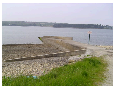
Cale de Rostellec IVR53_20062908528NUCA