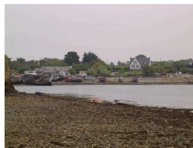
Vue générale de l'écart de Rostellec