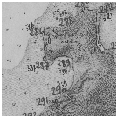
Carte de Rostellec en 1948