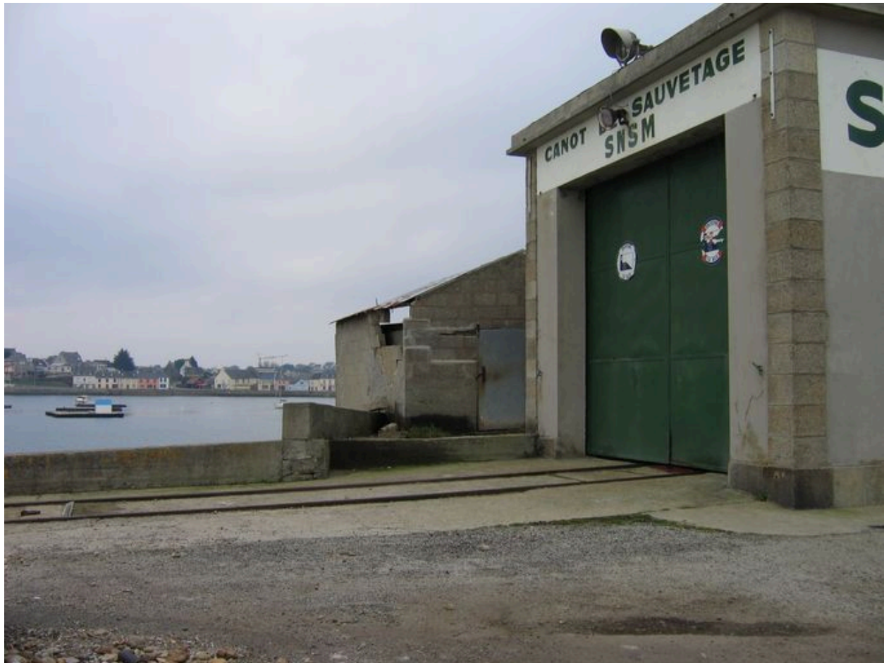
Entrée de l'abri du canot de sauvetage