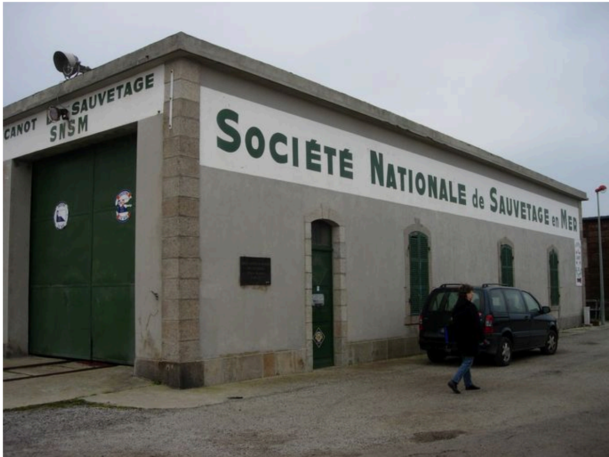
Elévation latérale de l'abri du canot de sauvetage