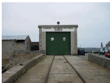
Vue générale de l'abri du canot de sauvetage