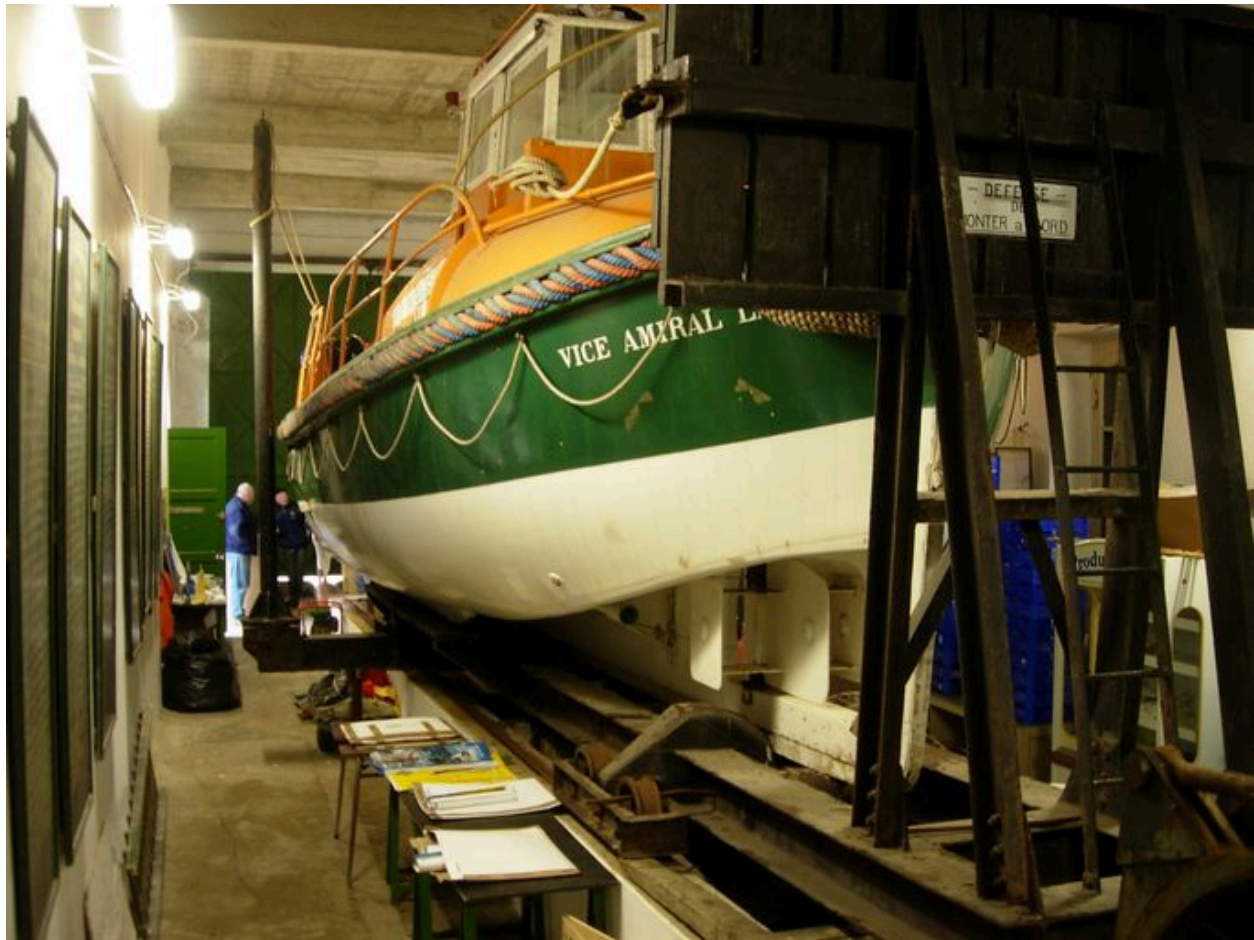
Vue du canot de sauvetage Vice-Amiral Lacaze