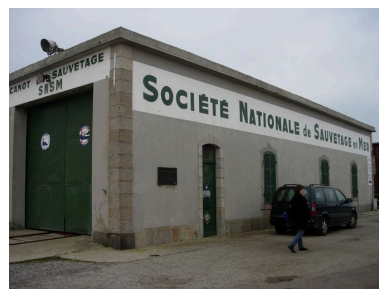
Elévation latérale de l'abri du canot de sauvetage IVR53_20062908388NUCA