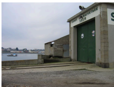
Entrée de l'abri du canot de sauvetage