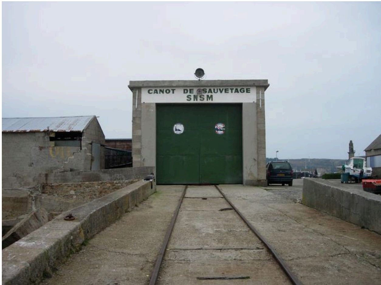
Vue générale de l'abri du canot de sauvetage