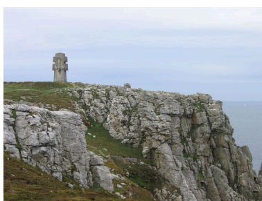
Vue de situation du Monument aux morts IVR53_20062908446NUCA