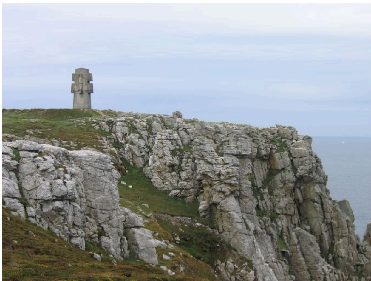
Vue de situation du Monument aux morts