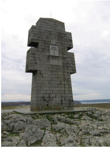
revers du Monument aux morts IVR53_20062908449NUCA