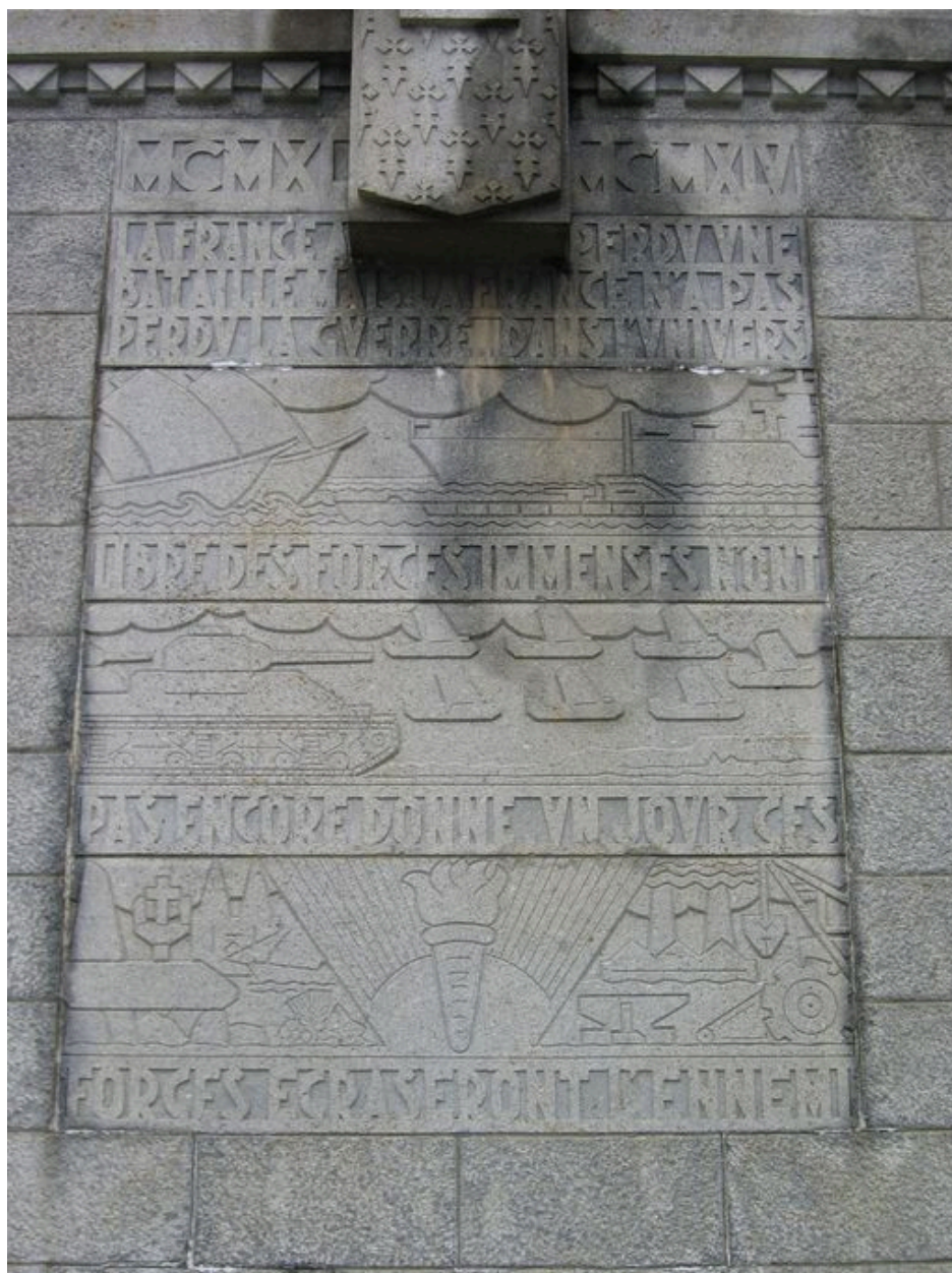
Face antérieure du Monument aux morts, détail : inscriptions