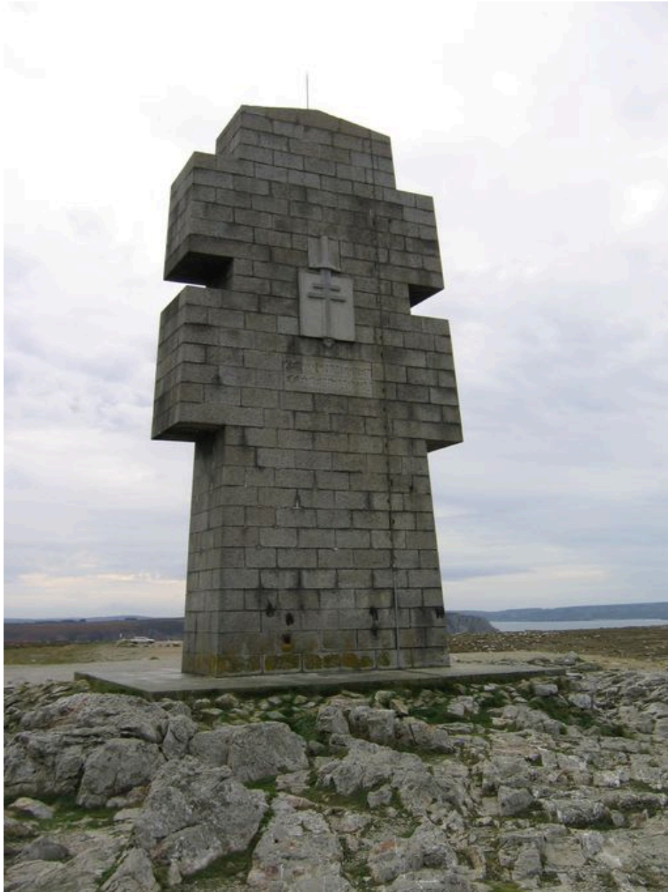
revers du Monument aux morts