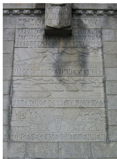
Face antérieure du Monument aux morts, détail : inscriptions