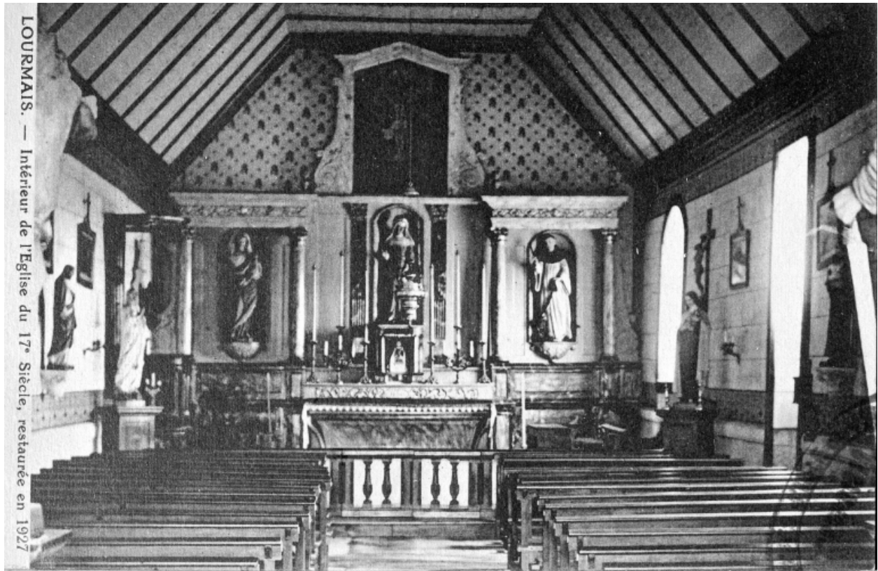
Carte postale du début du 20e siècle, vue intérieure