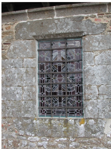
Mur sud de la nef, détail d'une fenêtre IVR53_20023505194NUCA