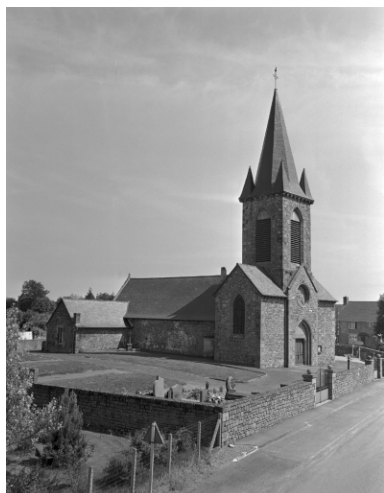
L'église et son enclos paroissial : vue nord, IVR53_19943501019X