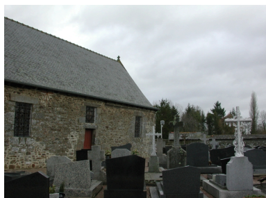
Mur sud de la nef et cimetière