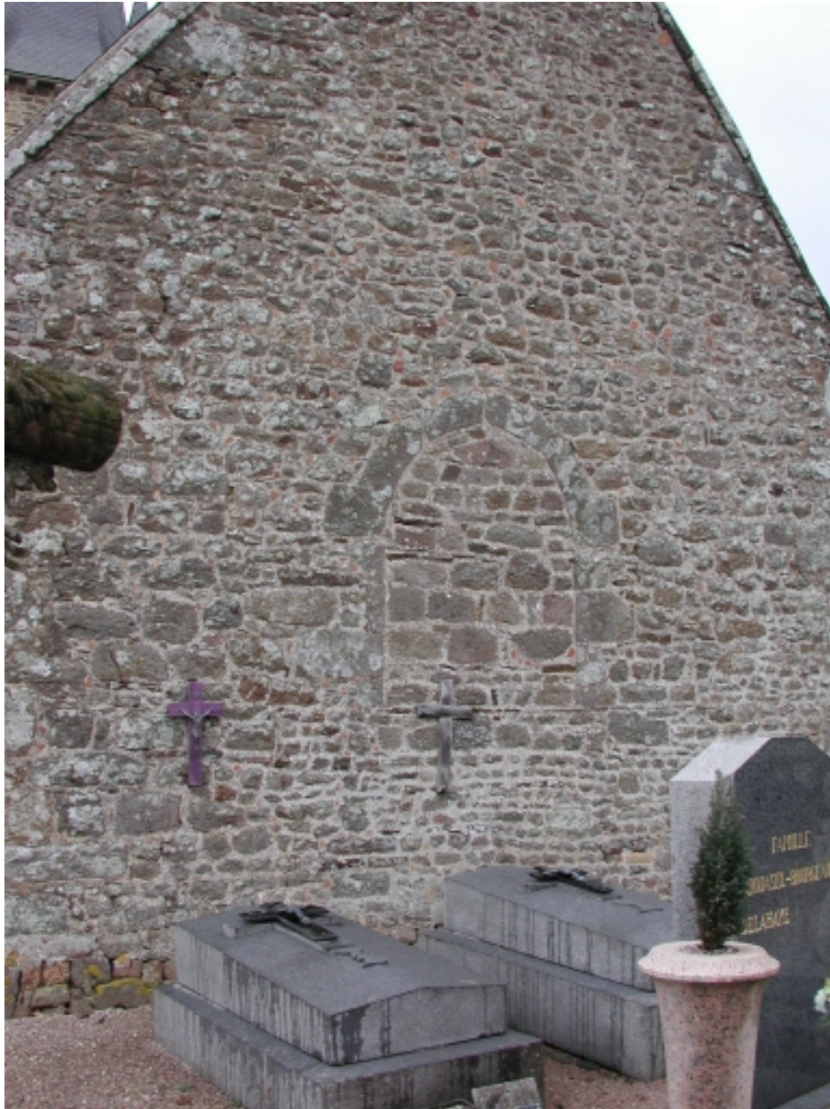
Vue extérieure du chevet, détail d'une ouverture murée