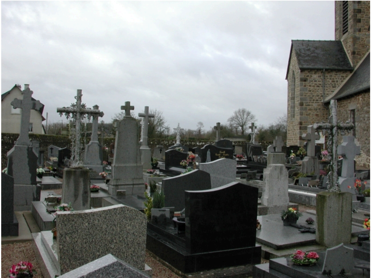
Vue générale du cimetière