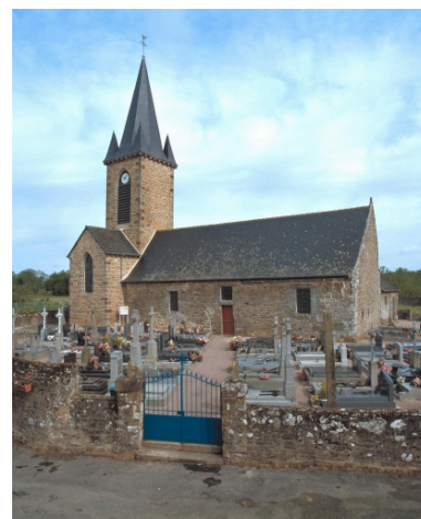
Cimetière et vue générale de l'église paroissiale IVR53_20013501195XA