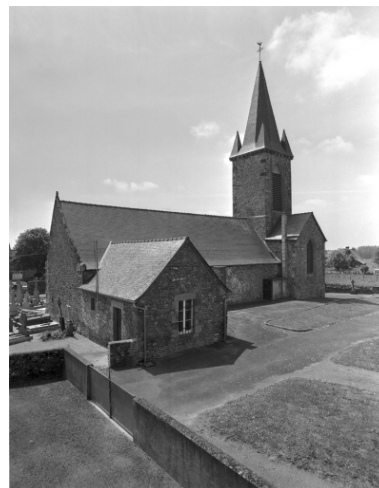
Vue d'ensemble des façades nord IVR53_19943501008X