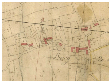
Extrait du cadastre de 1826, section du bourg