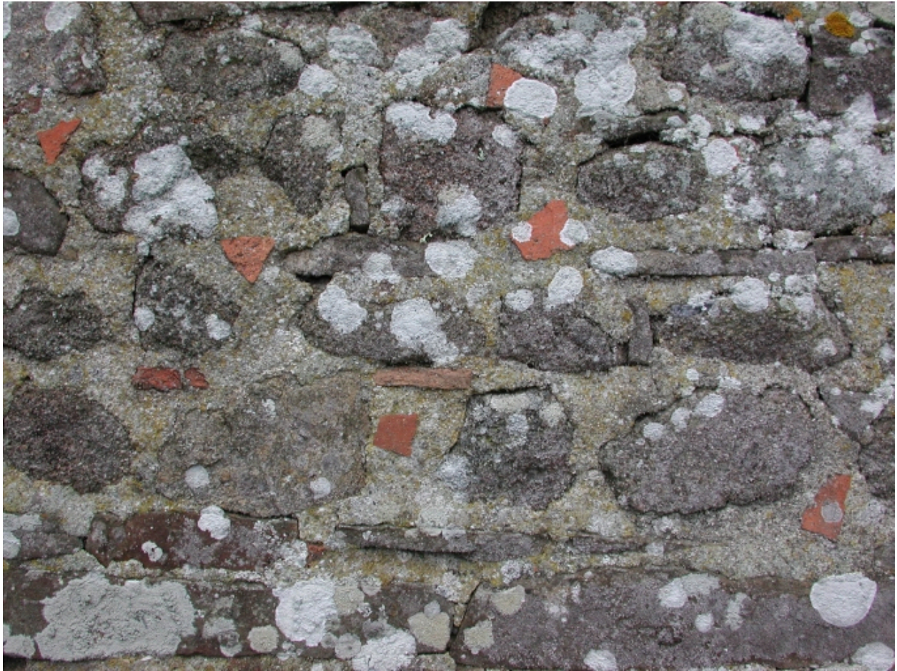
Mur nord de la nef, détail de l'appareillage