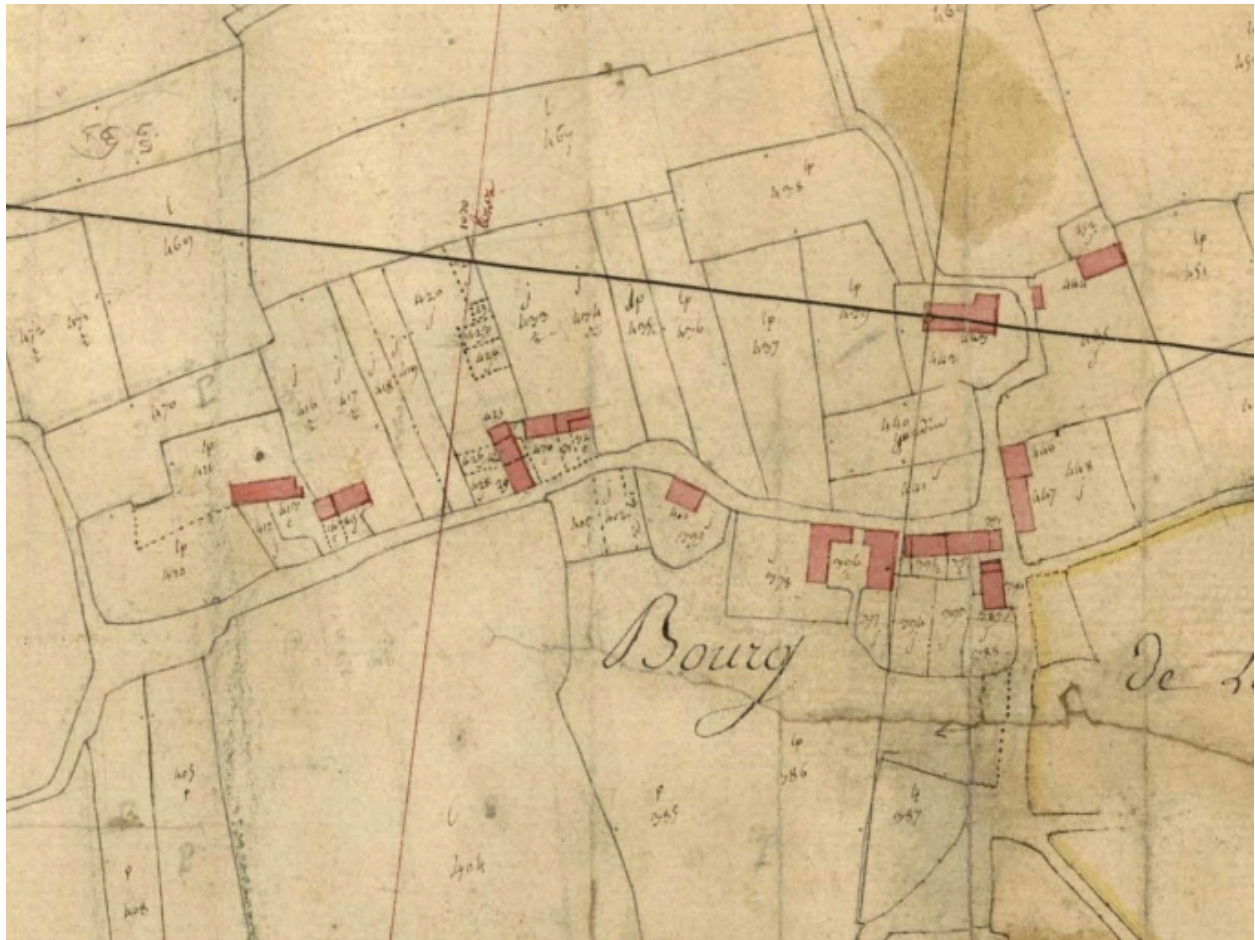
Extrait du cadastre de 1826, section du bourg