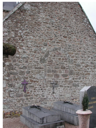
Vue extérieure du chevet, détail d'une ouverture murée IVR53_20023505192NUCA