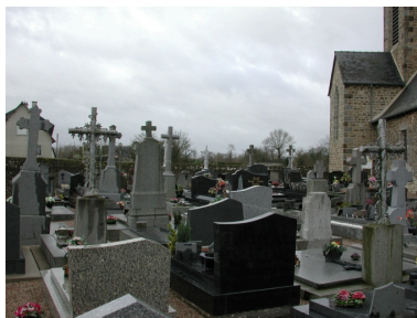
Vue générale du cimetière IVR53_20023505195NUCA