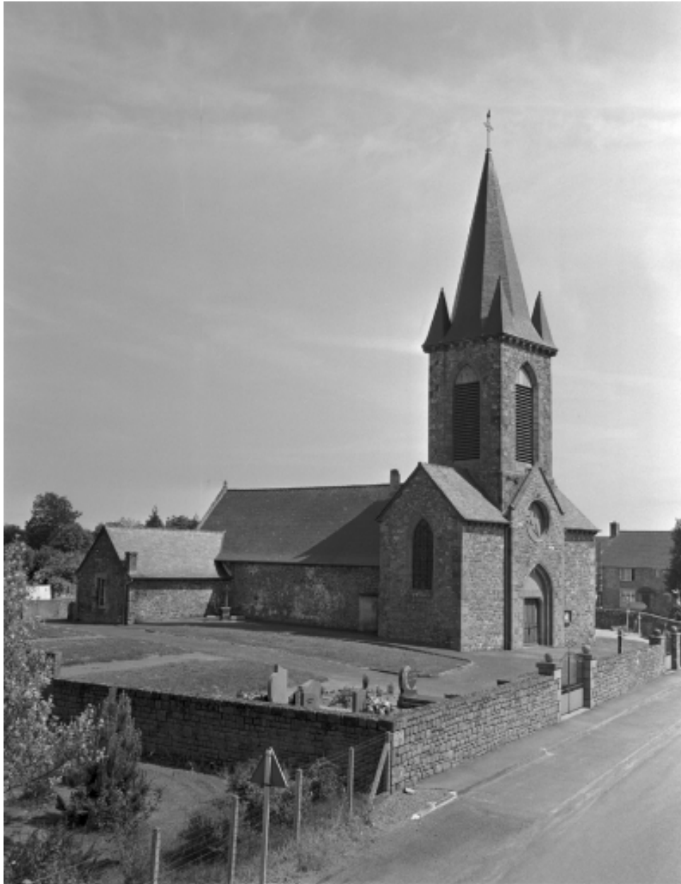
L'église et son enclos paroissial : vue nord