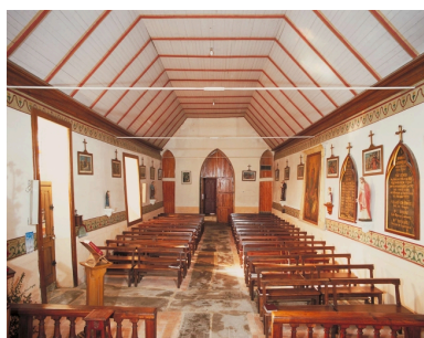
Vue intérieure prise du chœur vers la nef IVR53_20023500320XA