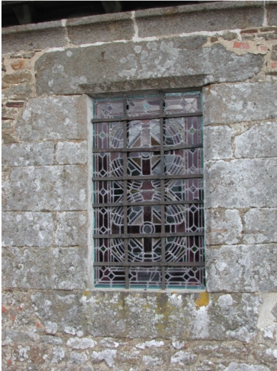
Mur sud de la nef, détail d'une fenêtre