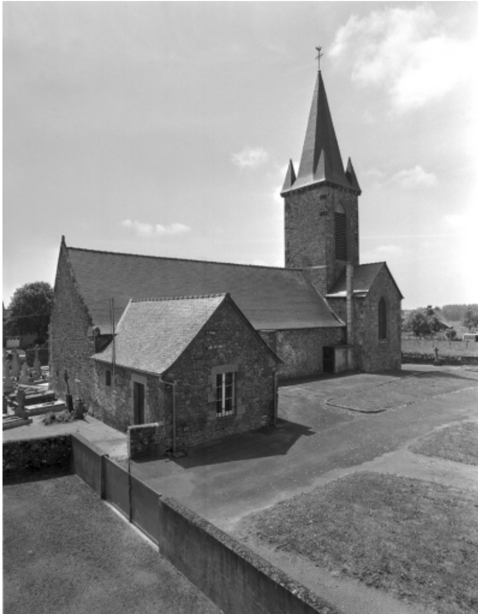
Vue d'ensemble des façades nord