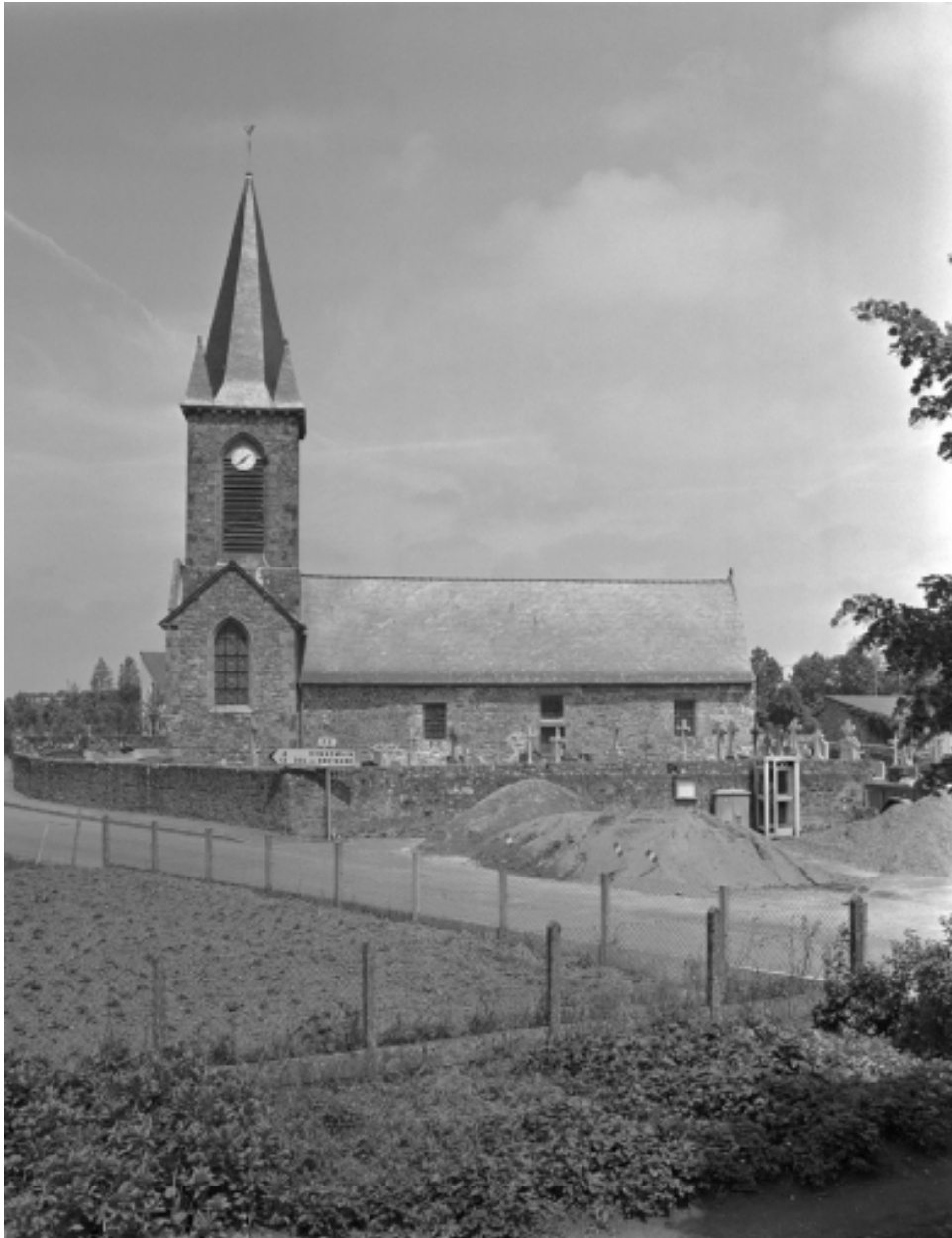
Vue d'ensemble de l'église et de son enclos paroissial : vue sud