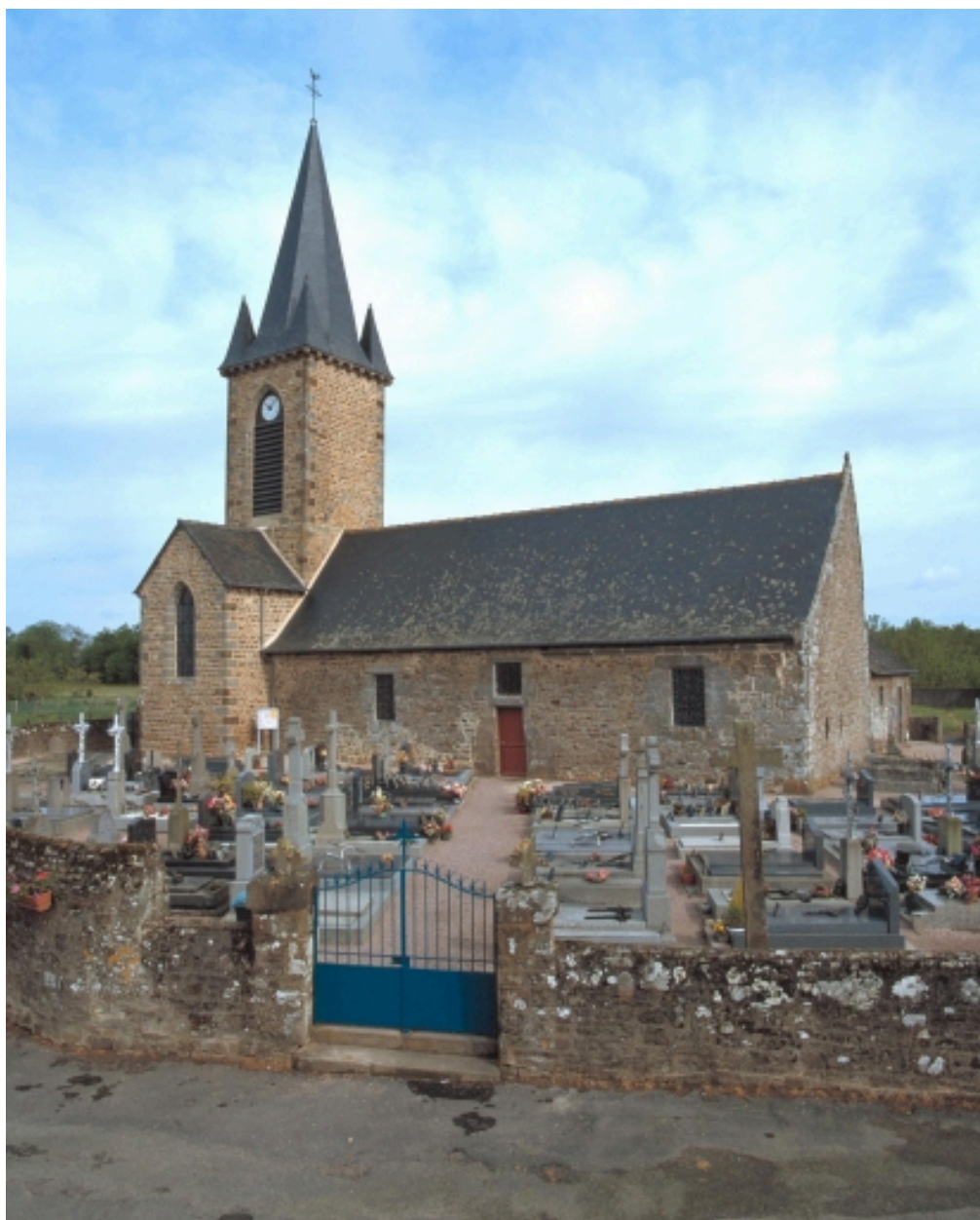
Cimetière et vue générale de l'église paroissiale