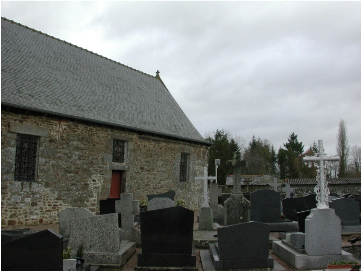
Mur sud de la nef et cimetière