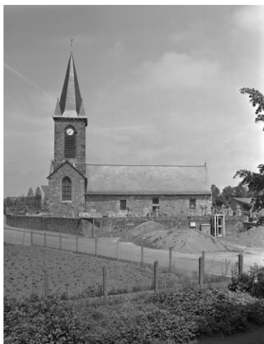
Vue d'ensemble de l'église et de son enclos paroissial : vue sud IVR53_19943501006X