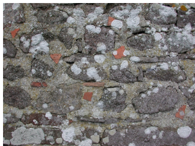
Mur nord de la nef, détail de l'appareillage IVR53_20023505193NUCA