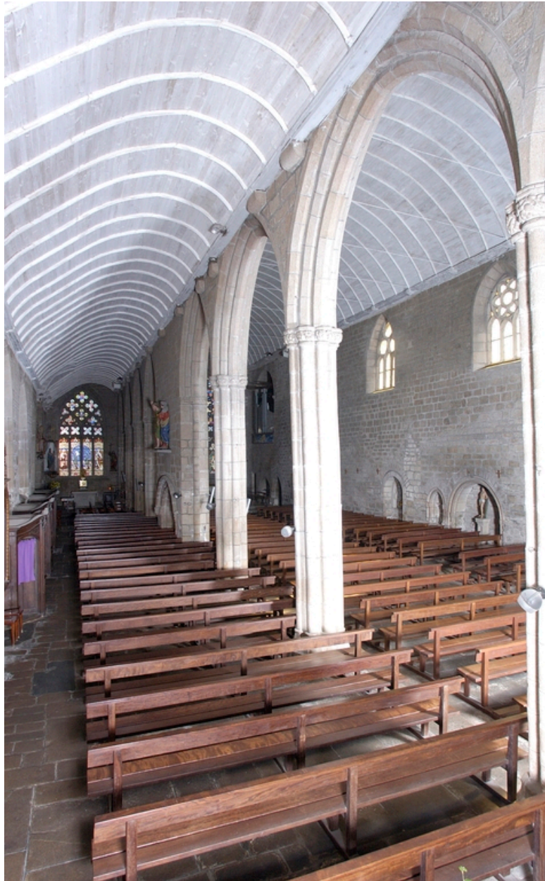
Vue du collatéral nord