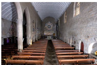
Vue axiale de la nef vers le chœur IVR53_20072900198NUCA