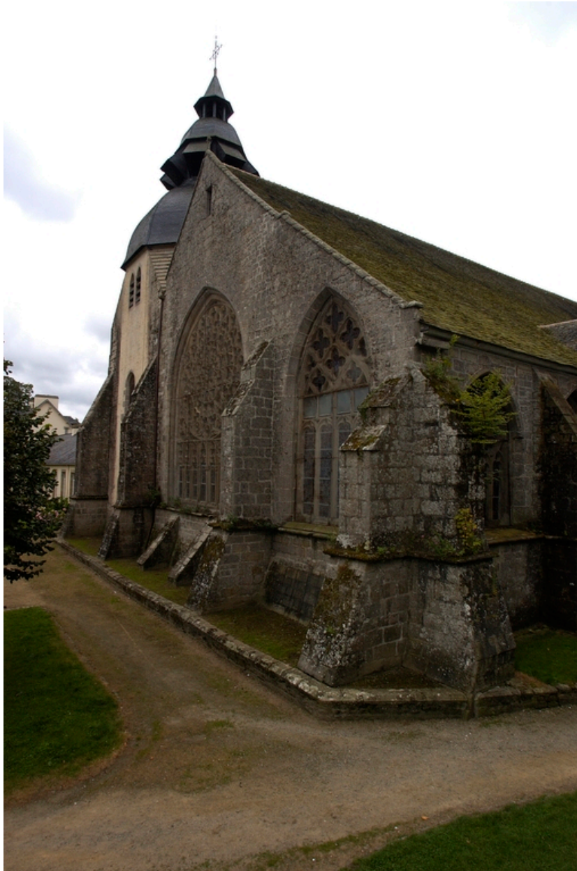
Vue du chevet prise du nord-est