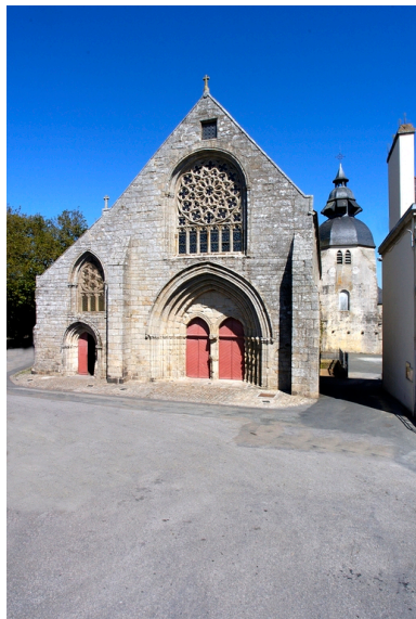
Vue générale de la façade ouest IVR53_20072900207NUCA