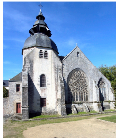
Vue générale du chevet