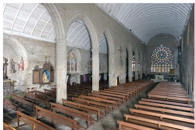
Vue biaisée de la nef vers le collatéral nord IVR53_20072900200NUCA