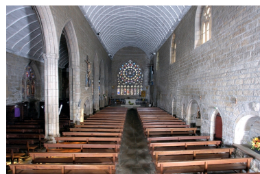
Vue axiale de la nef vers le chœur IVR53_20072900199NUCA