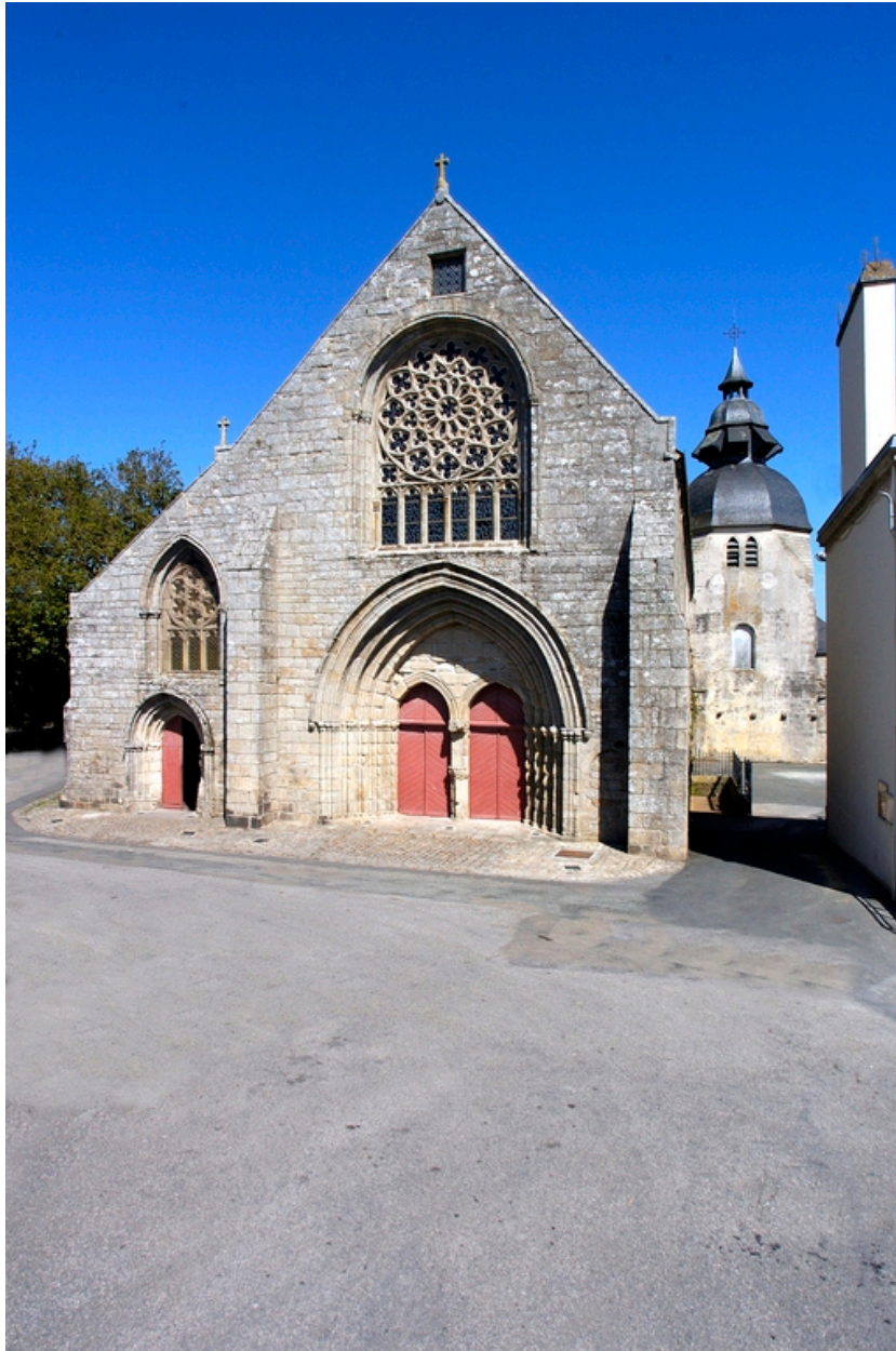
Vue générale de la façade ouest