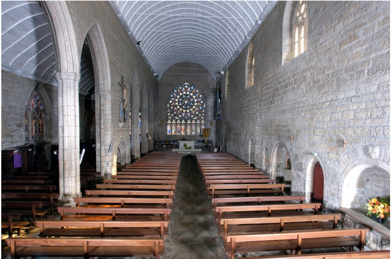
Vue axiale de la nef vers le chœur