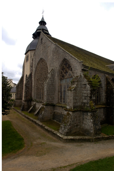
Vue du chevet prise du nord-est