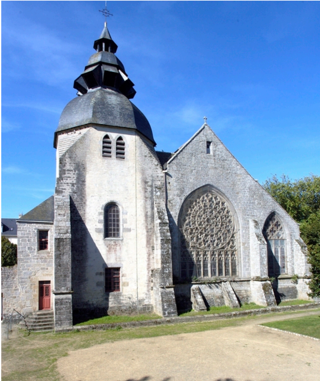
Vue générale du chevet