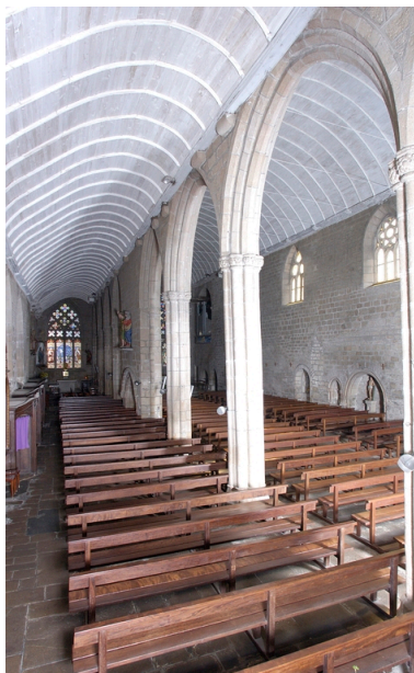
Vue du collatéral nord IVR53_20072900201NUCA