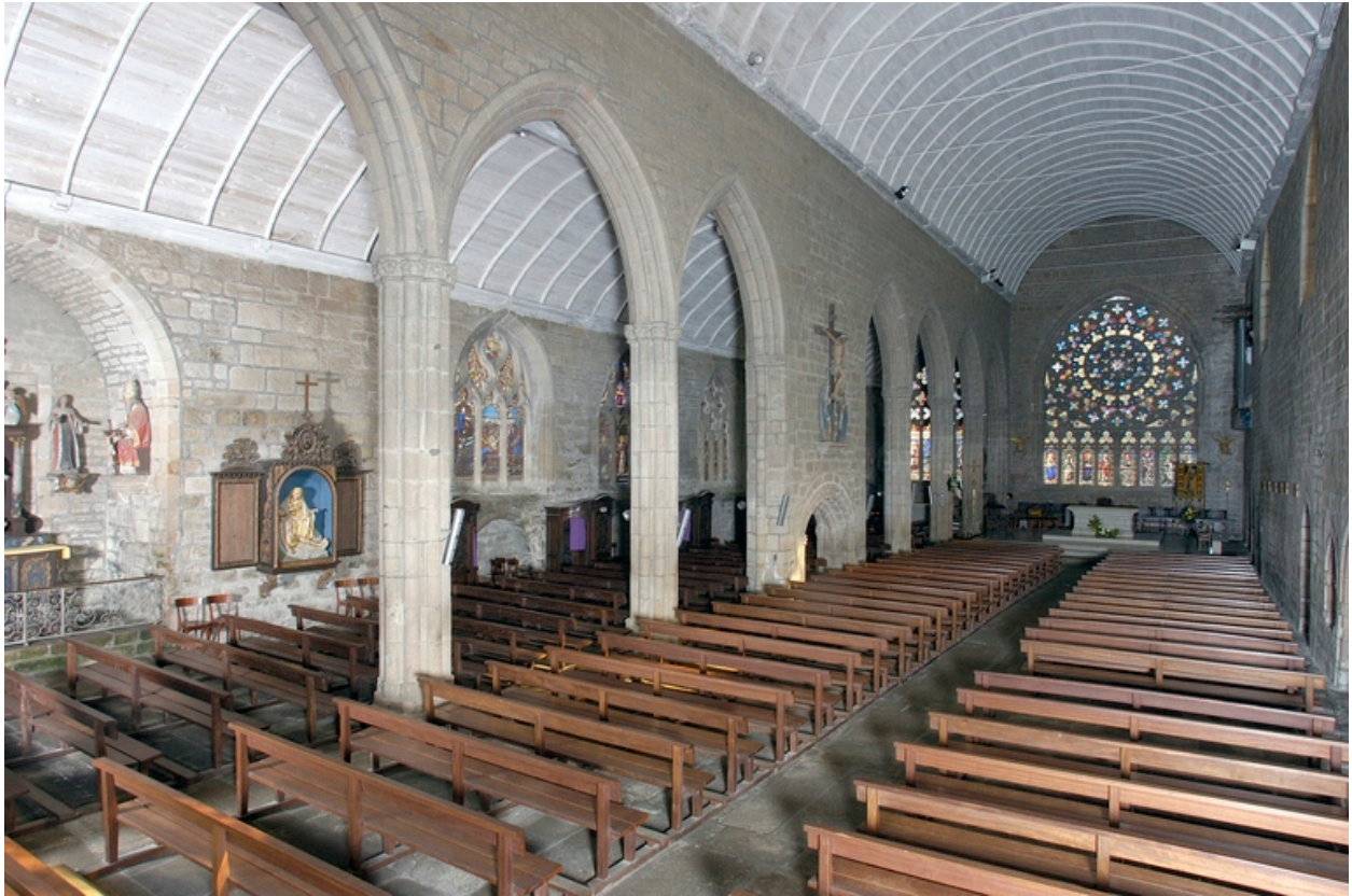
Vue biaise de la nef vers le collatéral nord