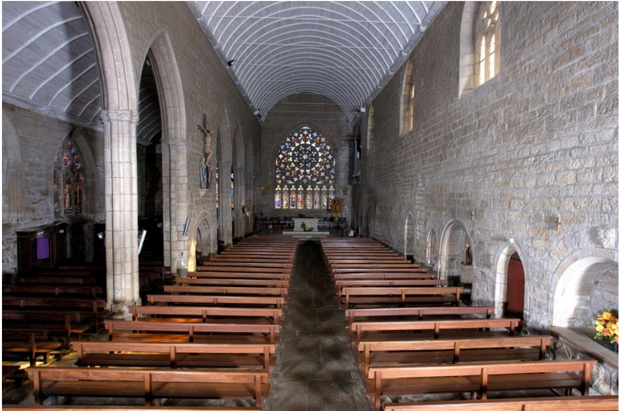
Vue axiale de la nef vers le chœur