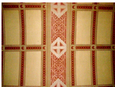
Morlaix, église paroissiale Saint-Mathieu : lambris de couvrement de la nef, détail IVR53_20082906620NUCA