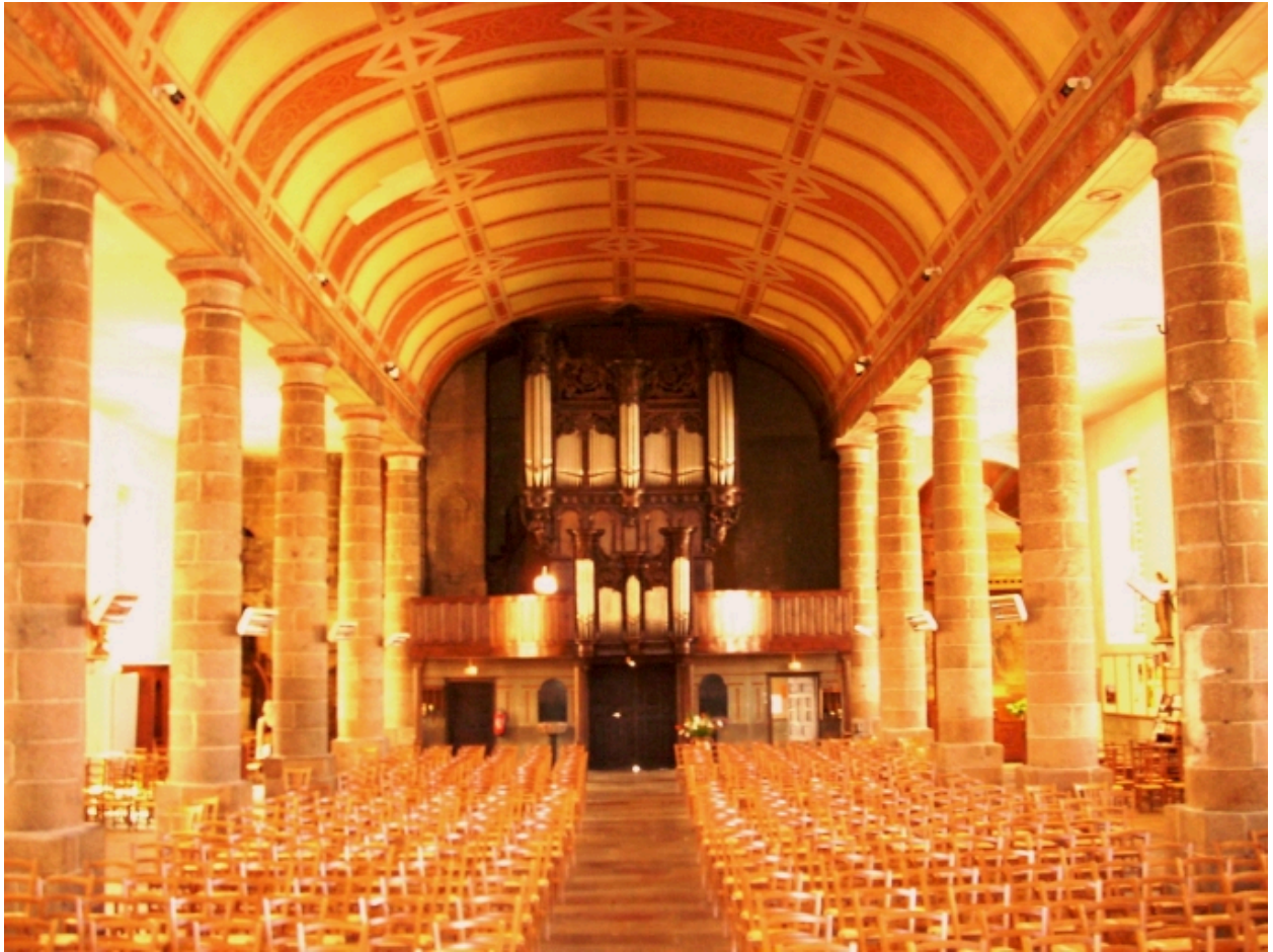
Morlaix, église paroissiale Saint-Mathieu : vue axiale ouest