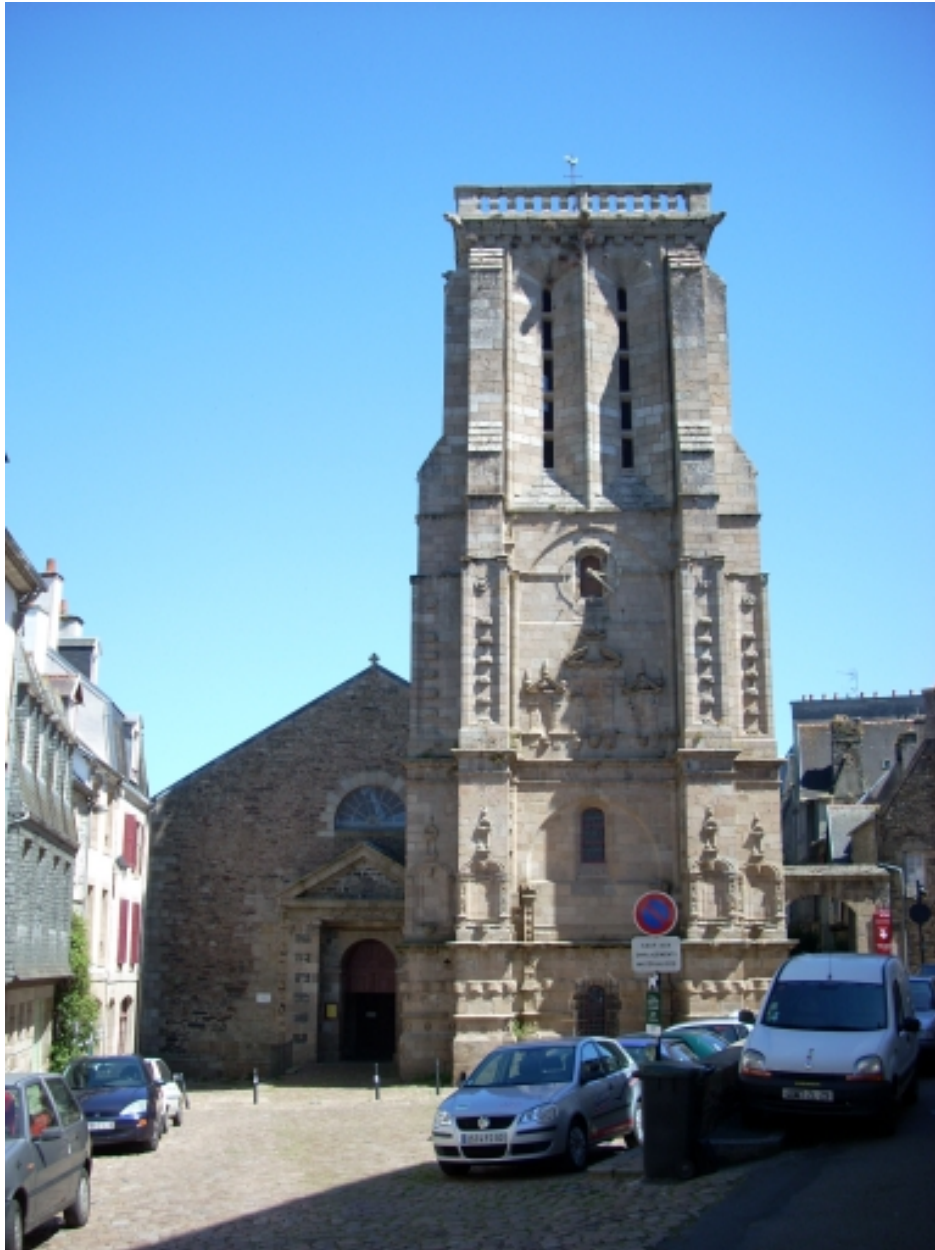
Morlaix, église paroissiale Saint-Mathieu : élévation ouest