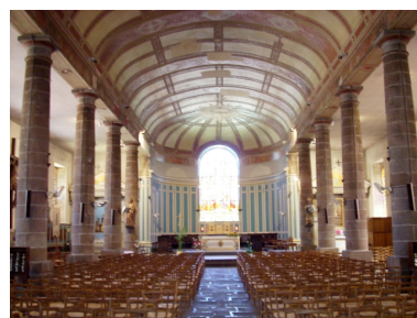
Morlaix, église paroissiale Saint-Mathieu : vue axiale est IVR53_20082906618NUCA