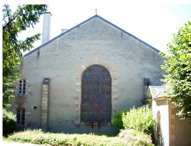
Morlaix, église paroissiale Saint-Mathieu : élévation est IVR53_20082906617NUCA