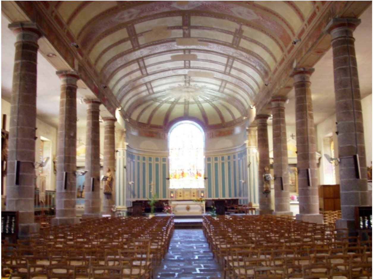
Morlaix, église paroissiale Saint-Mathieu : vue axiale est