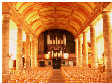
Morlaix, église paroissiale Saint- Mathieu : vue axiale ouest