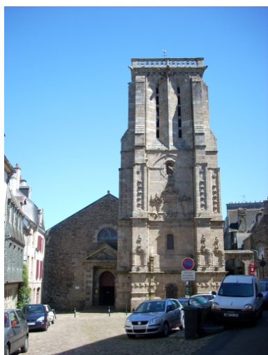
Morlaix, église paroissiale Saint-Mathieu : élévation ouest