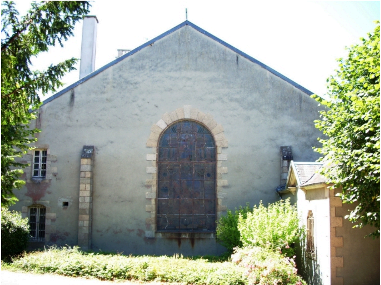
Morlaix, église paroissiale Saint-Mathieu : élévation est