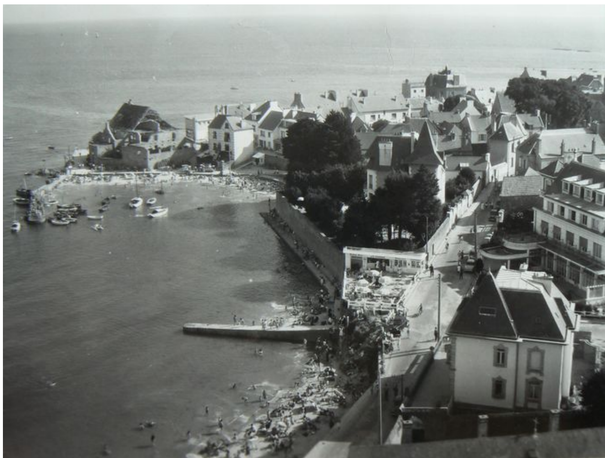
Vue du Petit Port datant de la fin des années 1950