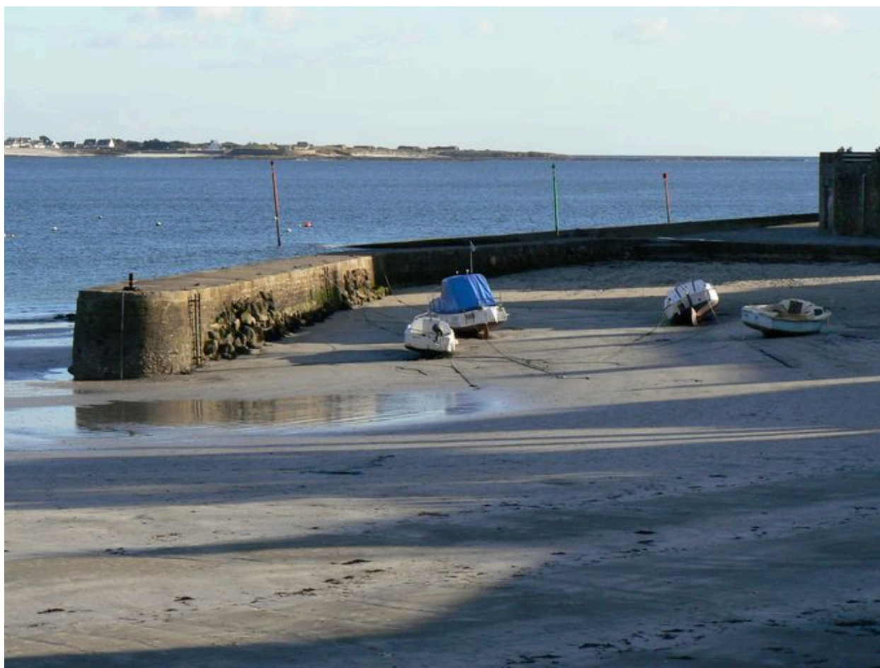
Jetée du Petit Port