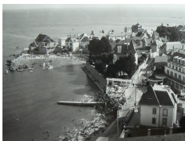
Vue du Petit Port datant de la fin des années 1950 IVR53_20075605601NUCB