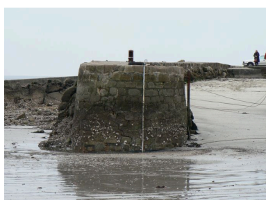
Jetée du Petit Port IVR53_20085606039NUCA