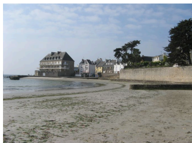
Petit Port IVR53_20075605599NUCA