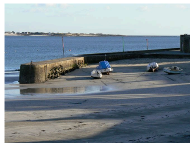
Jetée du Petit Port IVR53_20085606038NUCA