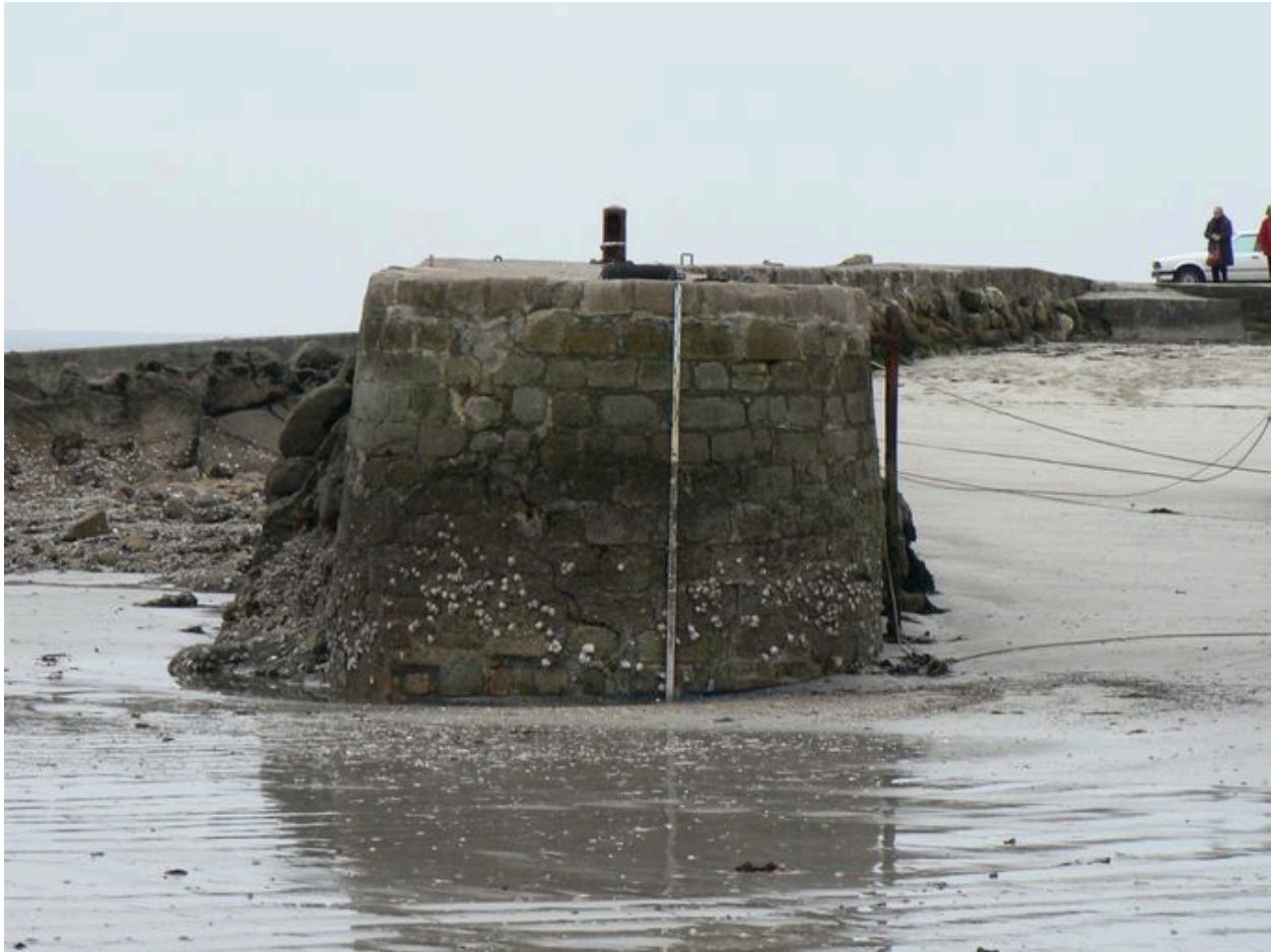
Jetée du Petit Port