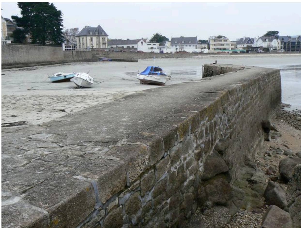
Jetée du Petit Port