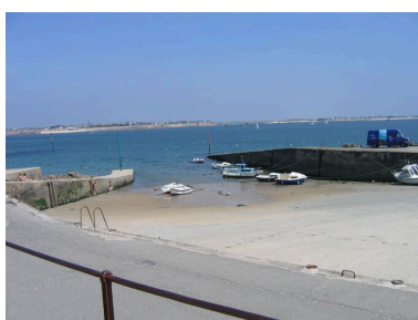
Petit Port