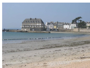
Petit Port IVR53_20075605600NUCA