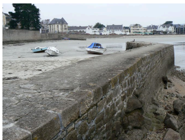
Jetée du Petit Port IVR53_20085606037NUCA