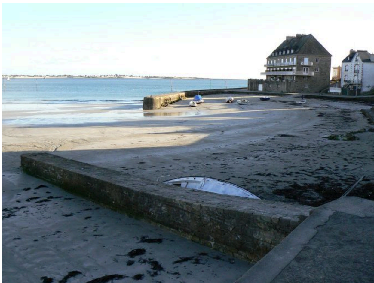
Vue générale du Petit Port, avec au premier plan la cale du conserveur Pierre Le Bras