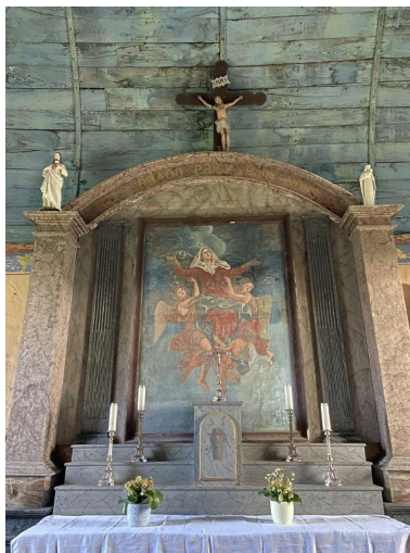
Détail IVR53_20265610495NUCA