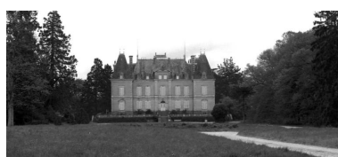
Vue générale du logis. IVR53_19833500379Z