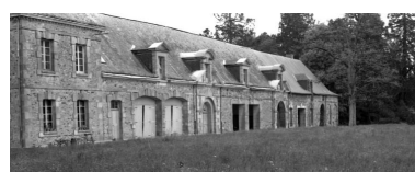
Vue générale des communs.