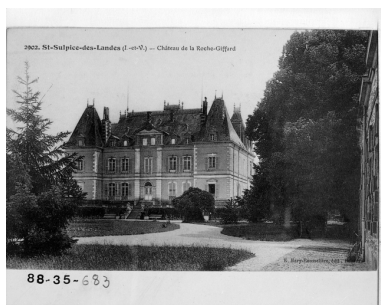
Carte postale ancienne. 2902 - Saint-Sulpice-des-Landes (I.-et-V.) - Château de la Roche-Giffard., IVR53_19883500683X