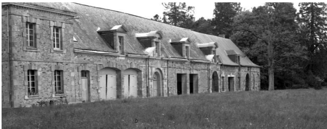
Vue générale des communs.