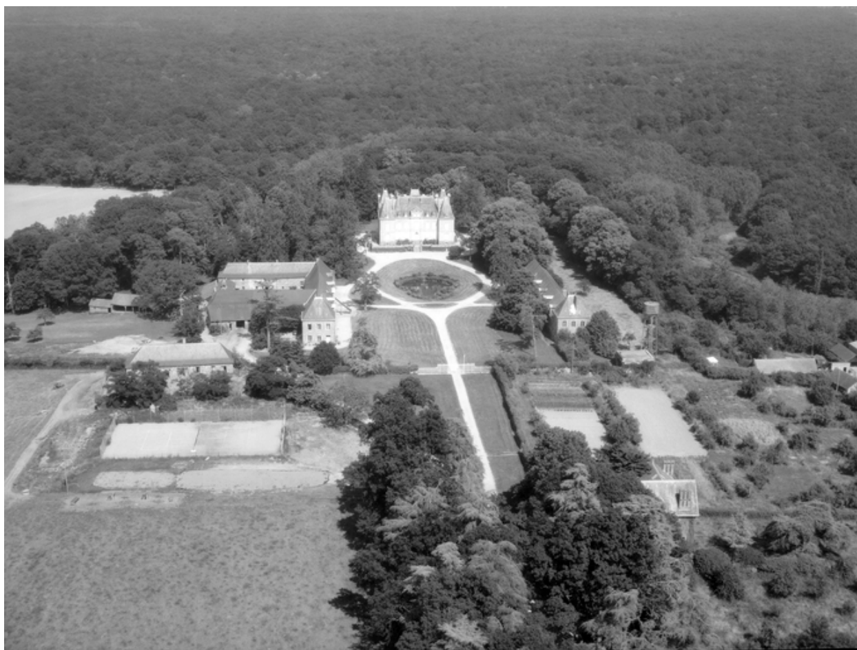
Vue aérienne sud.