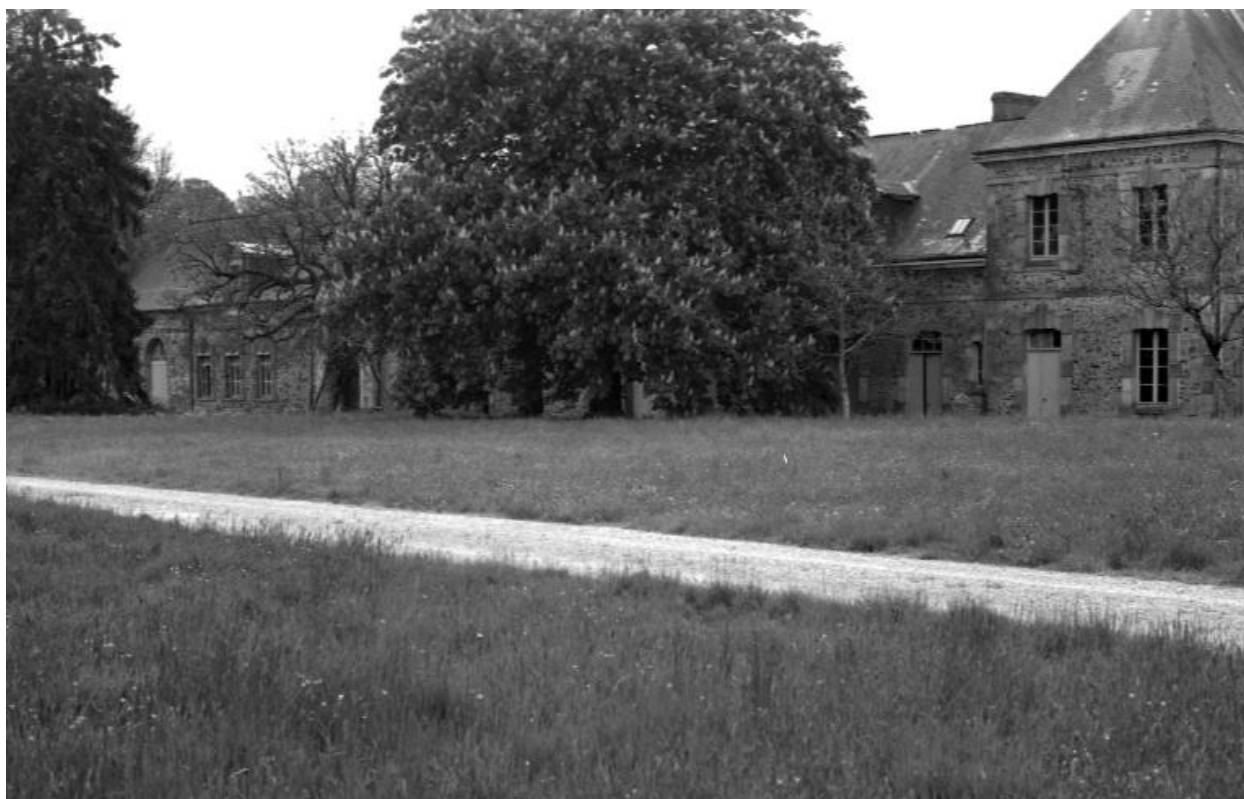
Dépendances sud, vue générale nord-ouest.