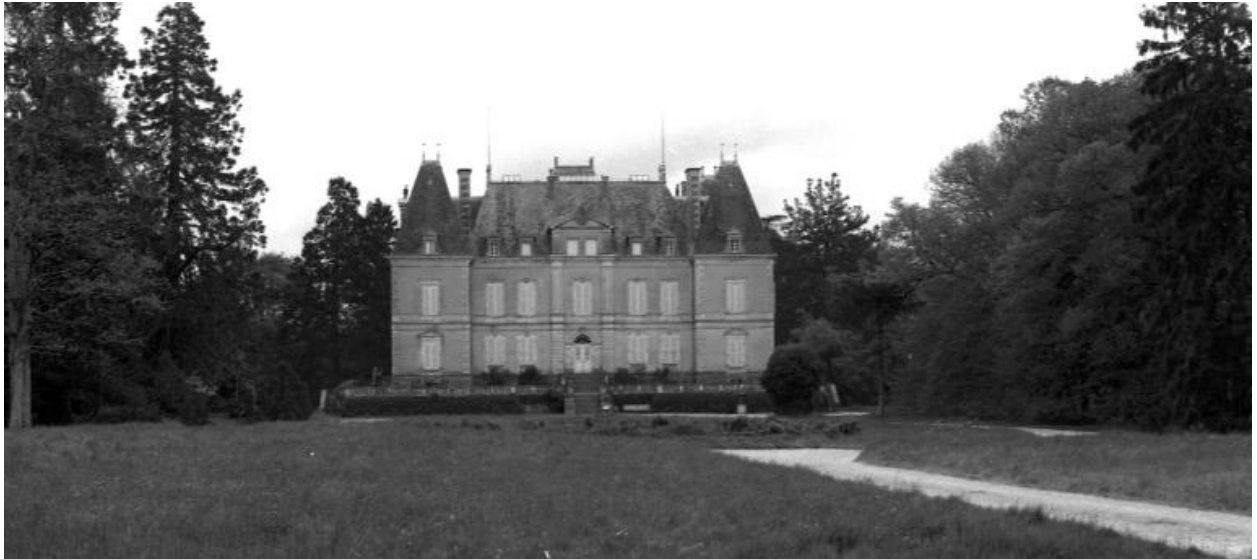
Vue générale du logis.