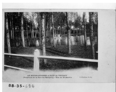
Fonds Lagrée - Carte postale ancienne. Collection Demy - La Roche Giffard et forêt de Teilloy, vue de St-Martin. IVR53_19883500686X