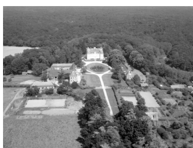
Vue aérienne sud. IVR53_19843501365V