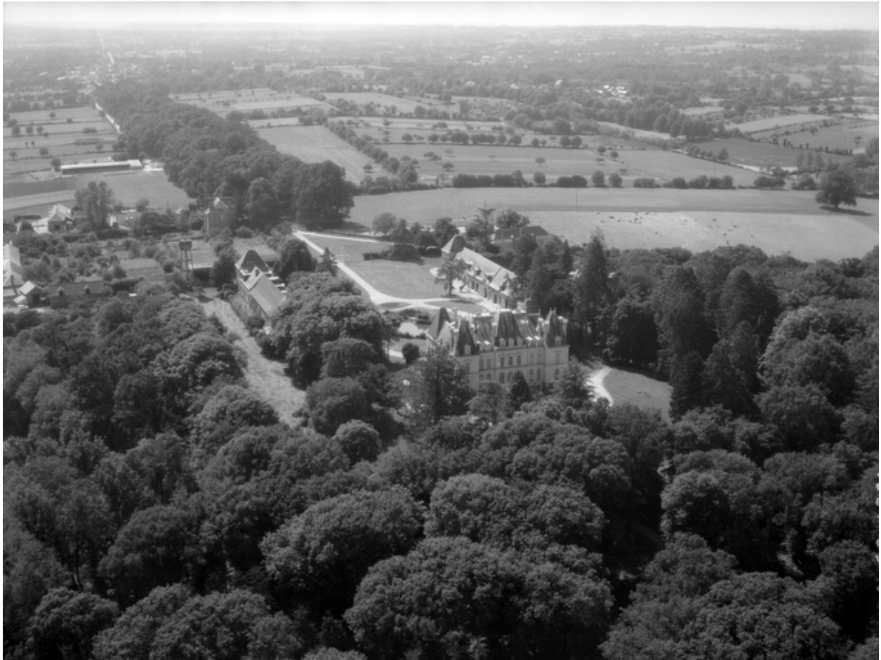
Vue aérienne nord.