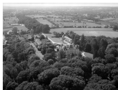
Vue aérienne nord. IVR53_19843501364V