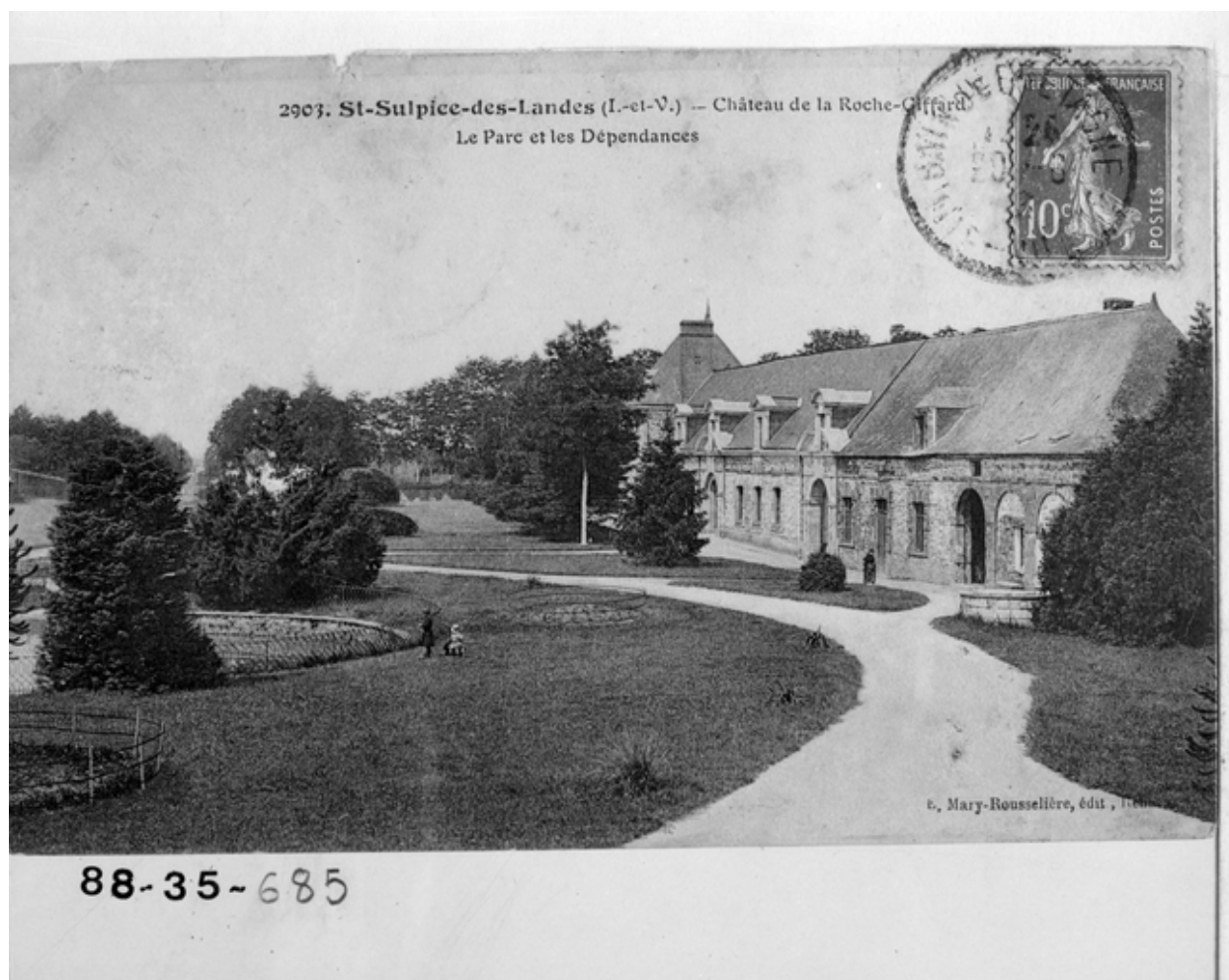
Carte postale ancienne. 2903 - Saint-Sulpice-des-Landes (I.-et-V.) - Château de la Roche-Giffard - Le Parc et les Dépendances.