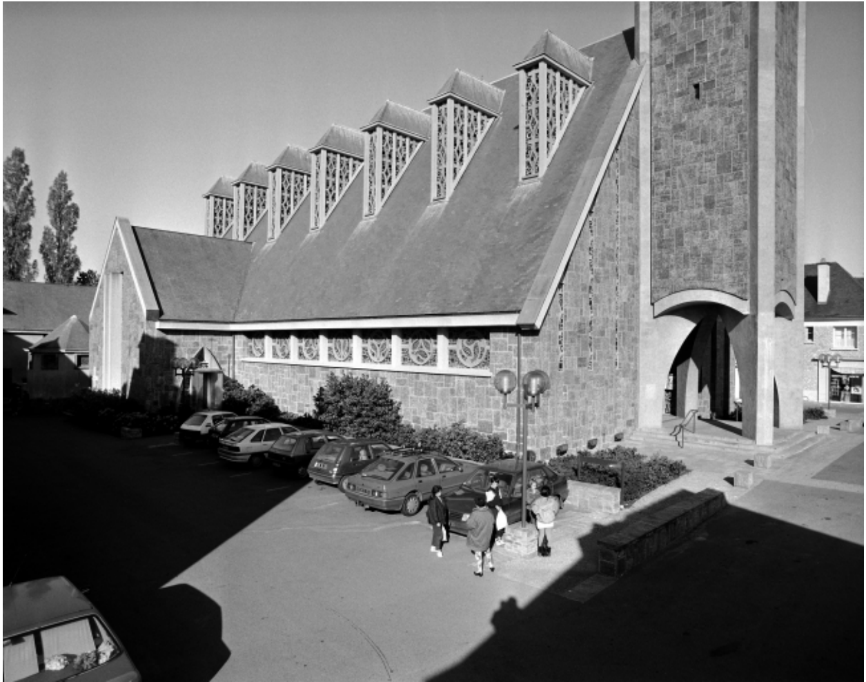
Elévation Sud : vue générale