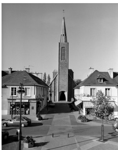
Elévation Est : vue générale IVR53_19943501892X