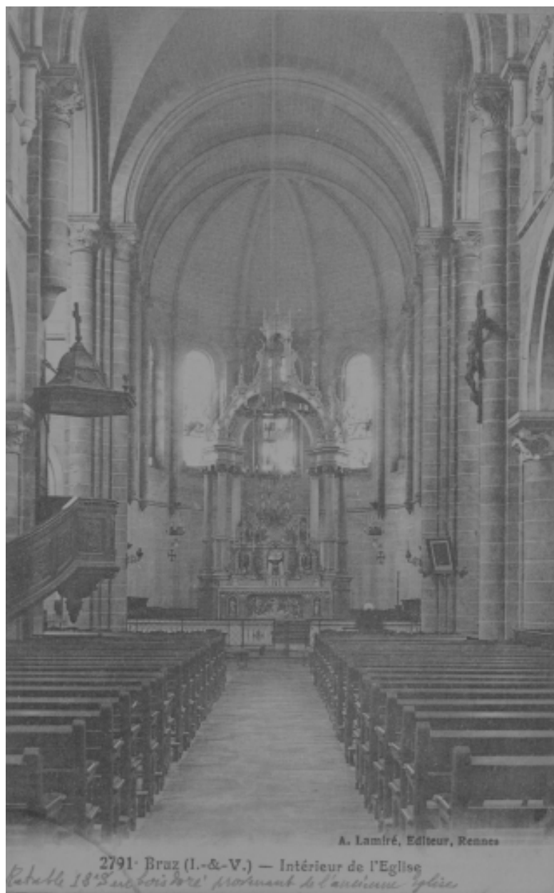
Carte postale ancienne - Intérieur : vue générale vers le chœur.