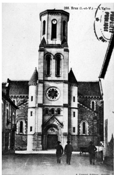
Elévation Ouest : vue générale (Carte postale ancienne, AD35 : 6Fi) IVR53_19933500533X