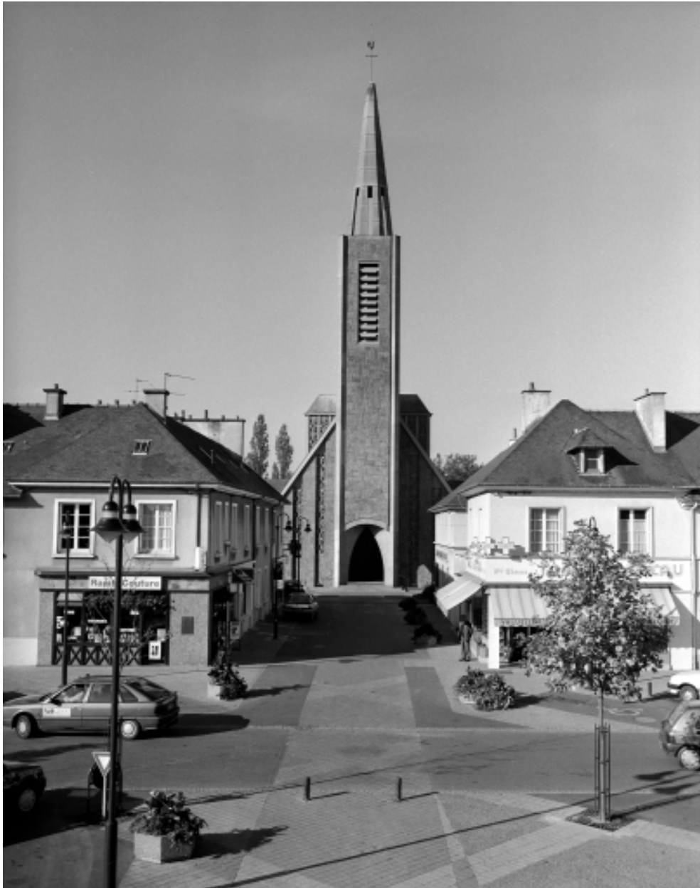
Elévation Est : vue générale