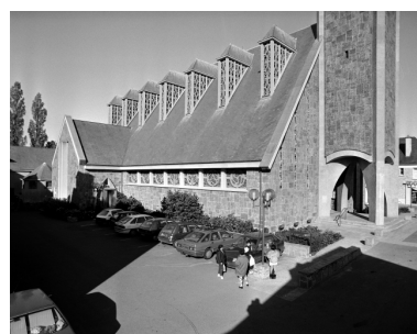
Elévation Sud : vue générale IVR53_19943501891X