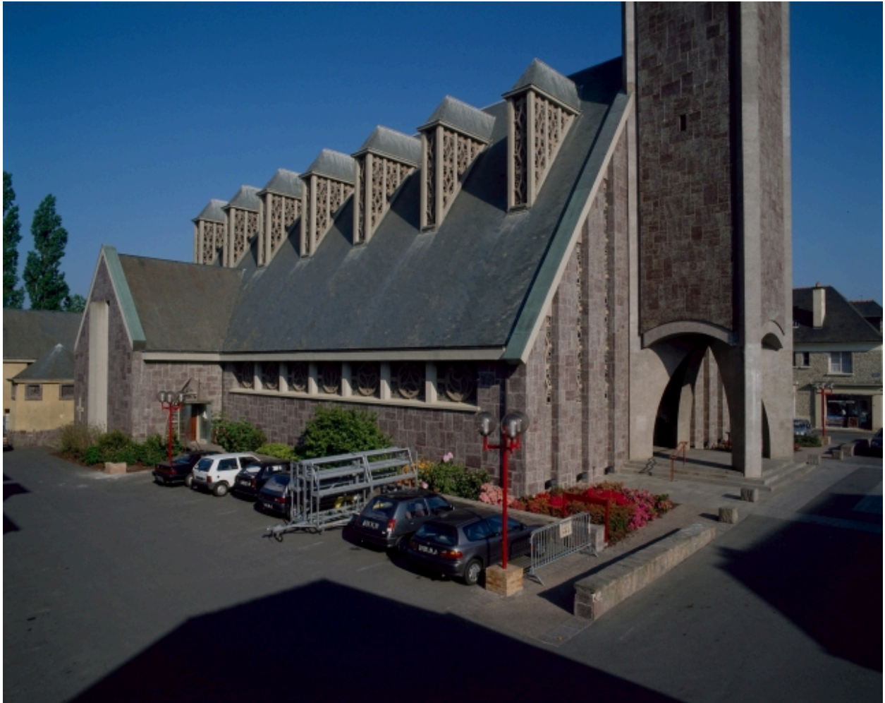
Elévation Sud : vue générale