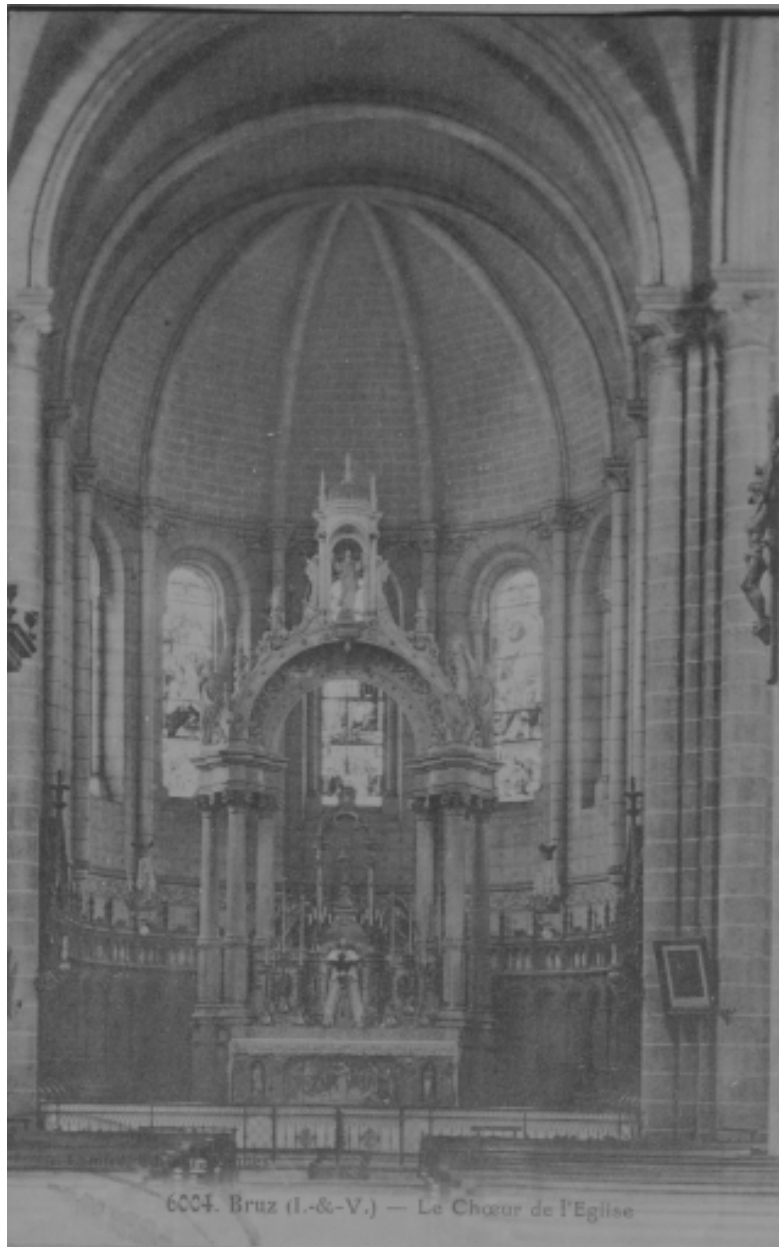
Carte postale ancienne - Intérieur, choeur : vue générale.