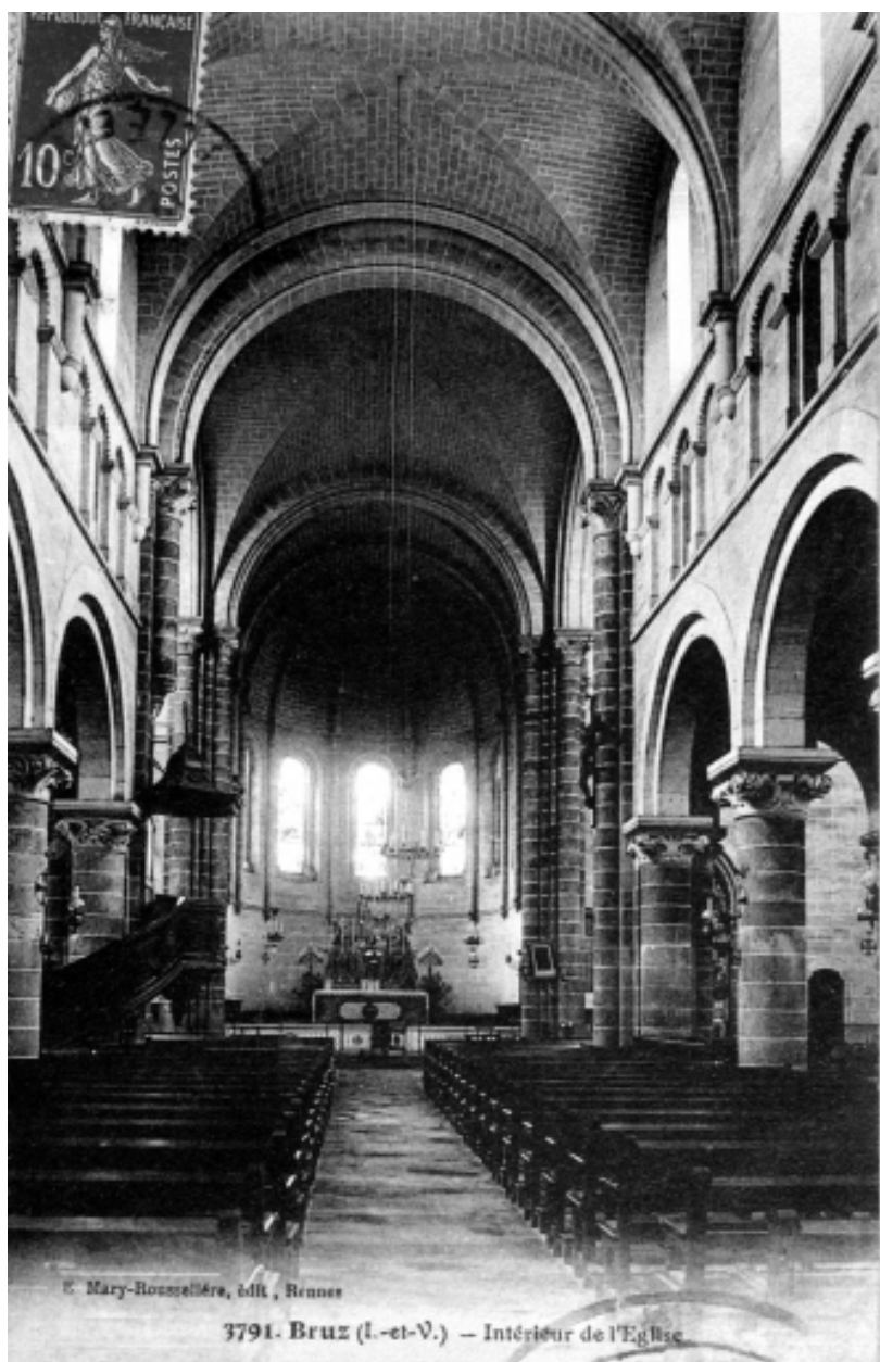
Carte postale ancienne - Intérieur : vue générale vers le chœur.