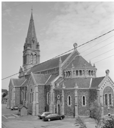
Elévation sud : vue générale IVR53_19943501411X