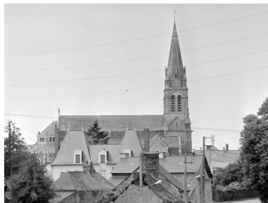
Elévation est : vue générale