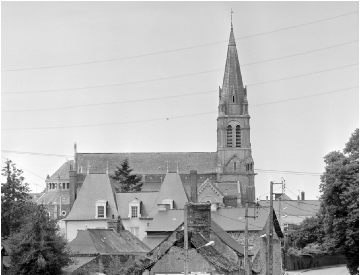
Elévation est : vue générale