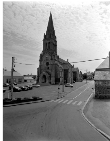
Elévation nord : vue générale IVR53_19943501412X