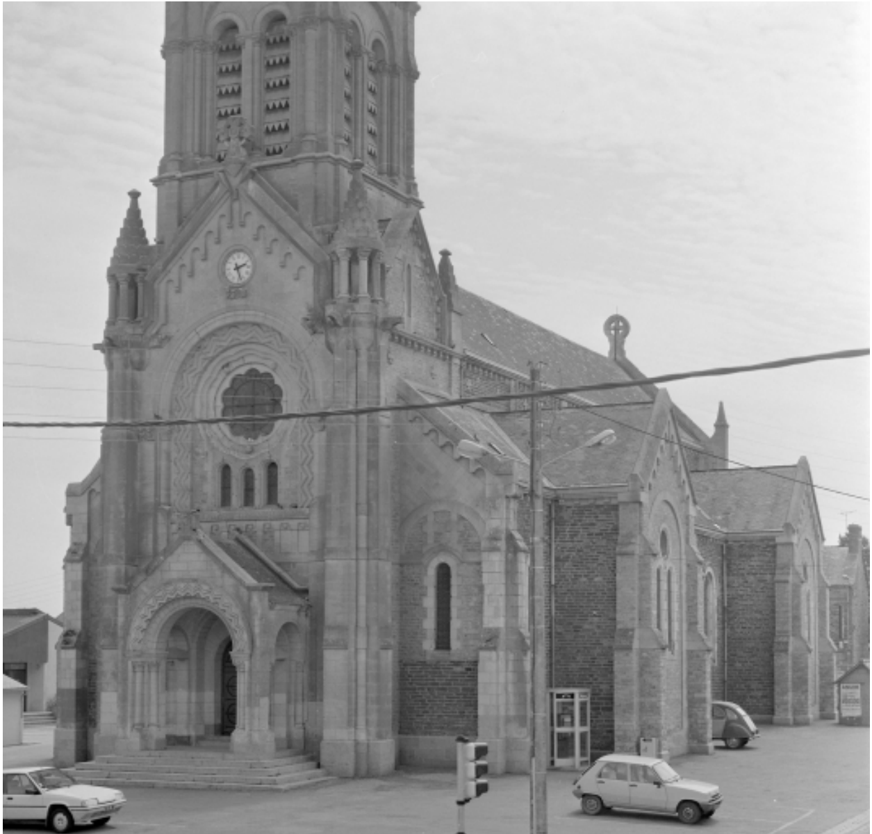
Elévation nord : vue générale