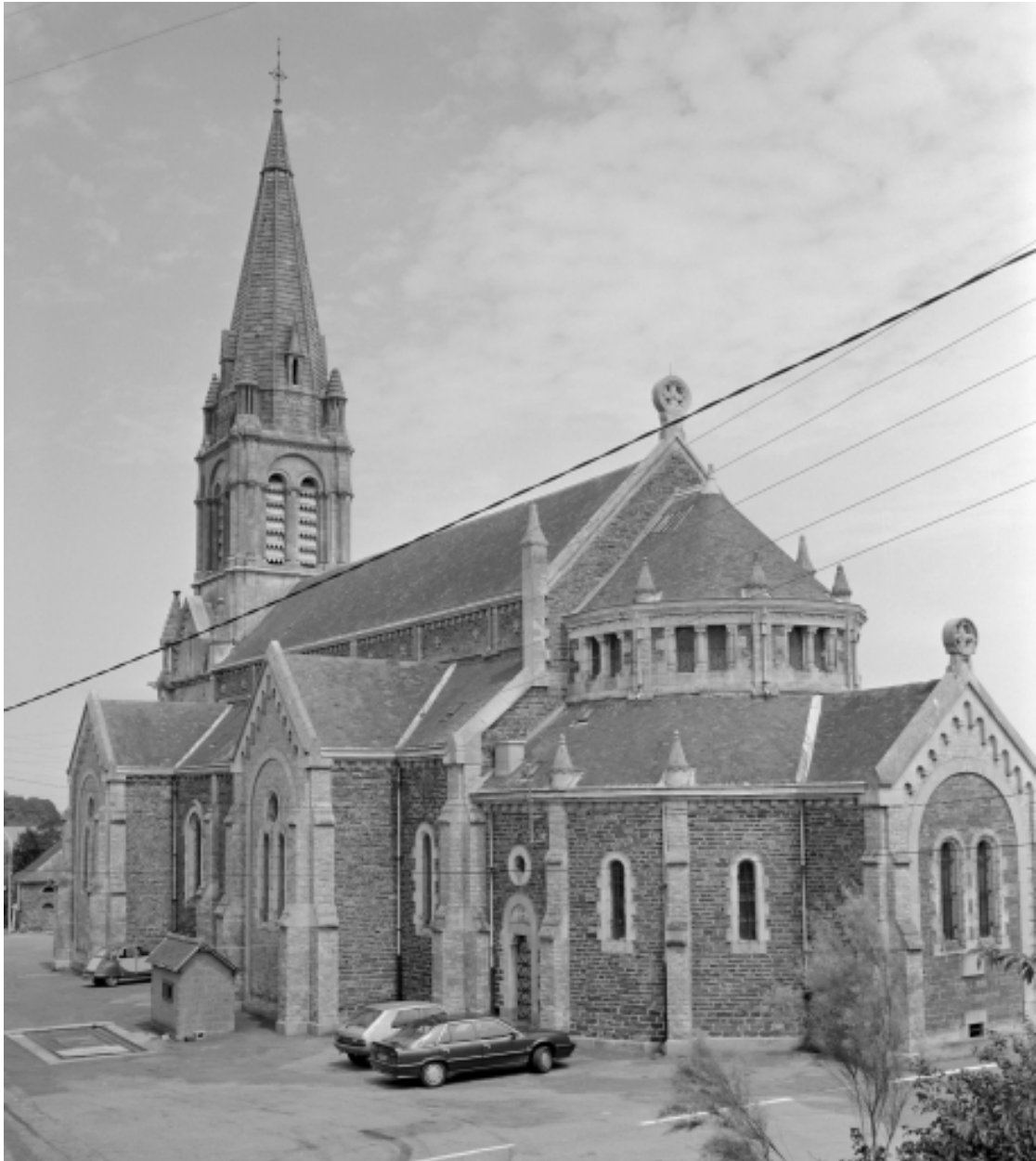
Elévation sud : vue générale