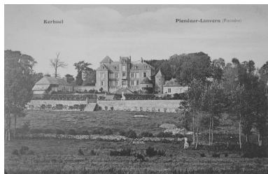
Vue de situation IVR53_20042905620NUCB