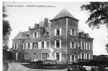
Élévations postérieure et latérale du corps du logis IVR53_20042905618NUCB