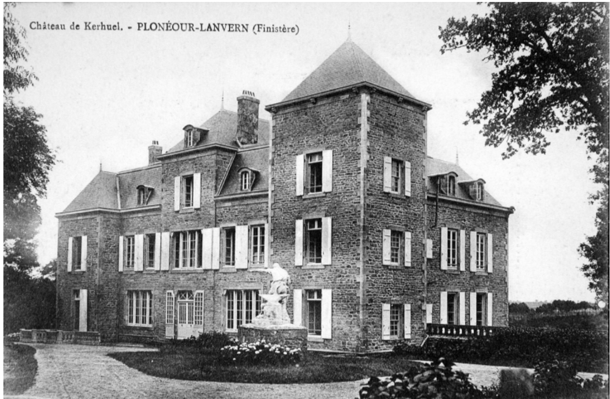
Elévations postérieure et latérale du corps du logis