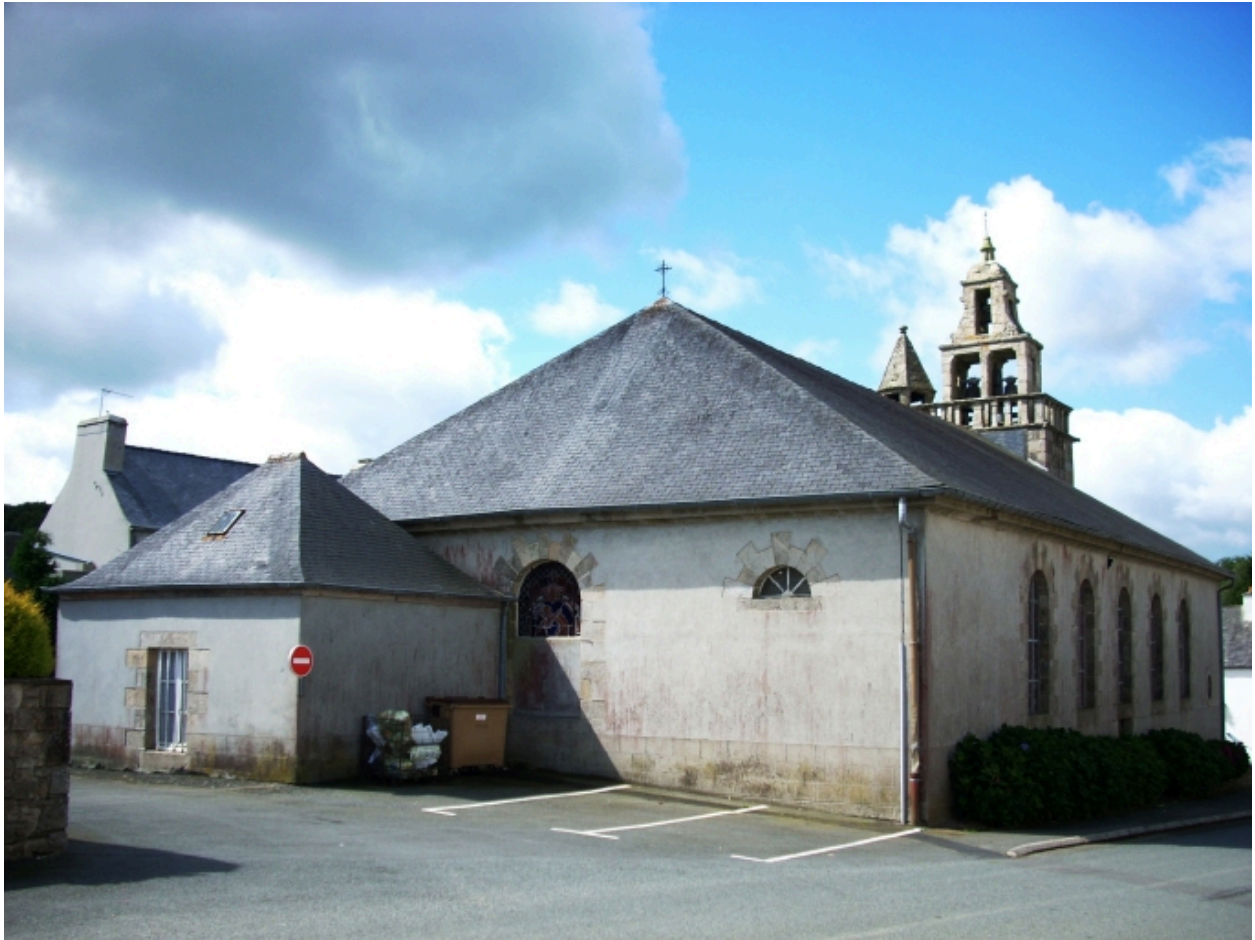
Lanneanou, église paroissiale Saint-Jean-Baptiste : vue générale sud-est