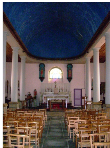
Lannéanou, église paroissiale Saint-Jean-Baptiste : vue axiale est IVR53_20082906677NUCA