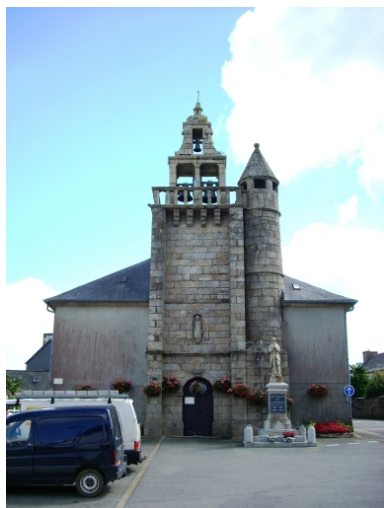
Lannéanou, église paroissiale Saint-Jean-Baptiste : élévation ouest IVR53_20082906675NUCA