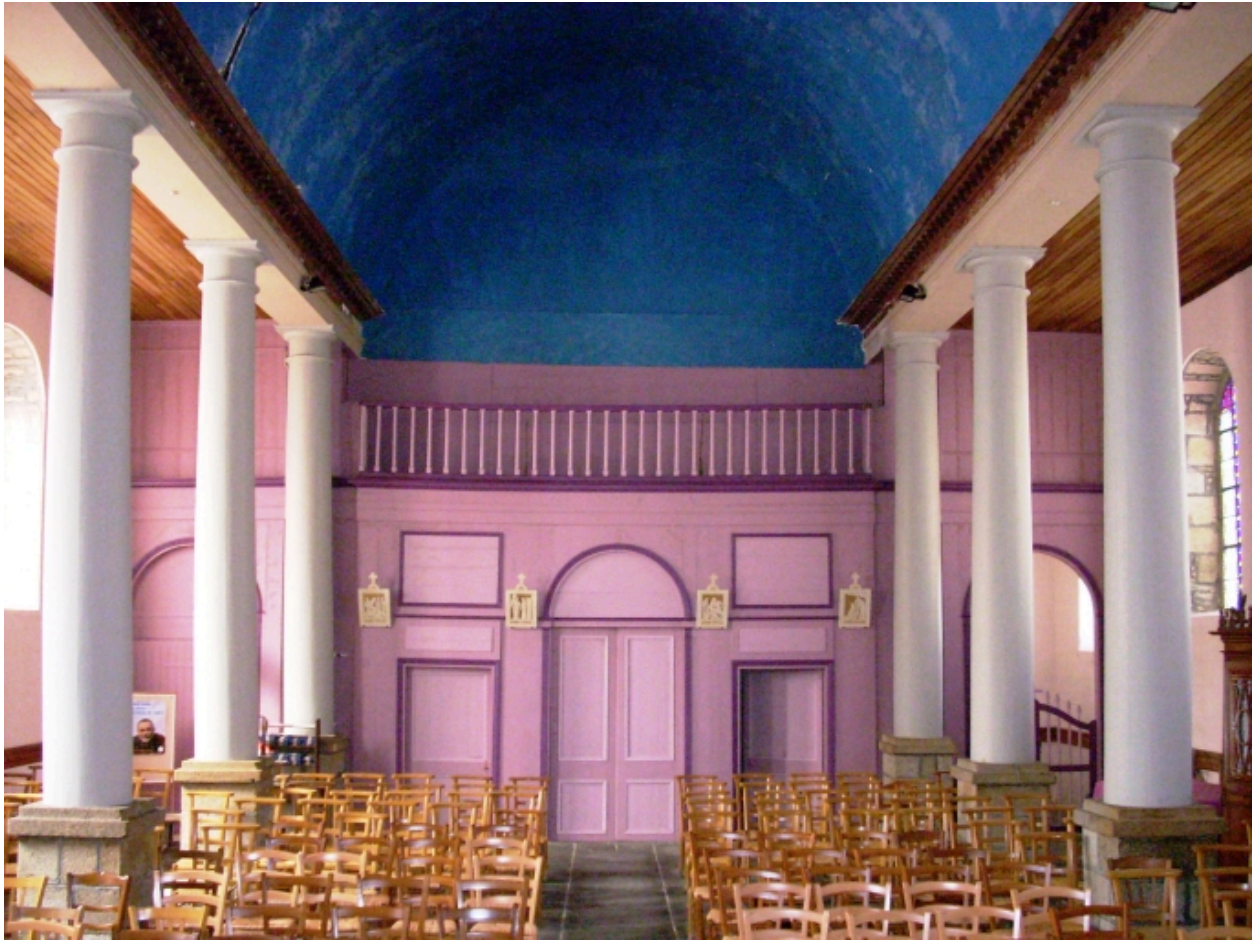
Lanneanou, église paroissiale Saint-Jean-Baptiste : vue axiale ouest