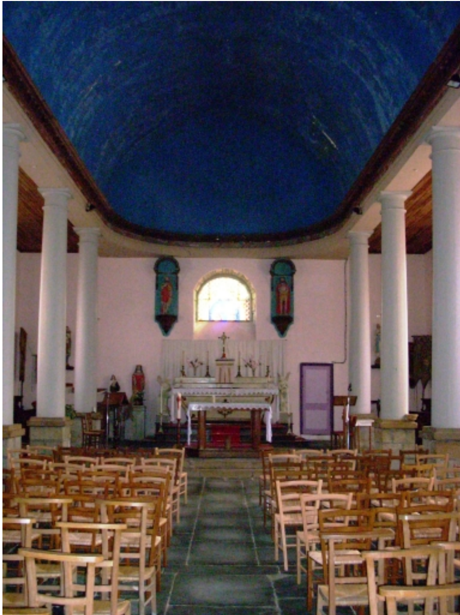
Lanneanou, église paroissiale Saint-Jean-Baptiste : vue axiale est