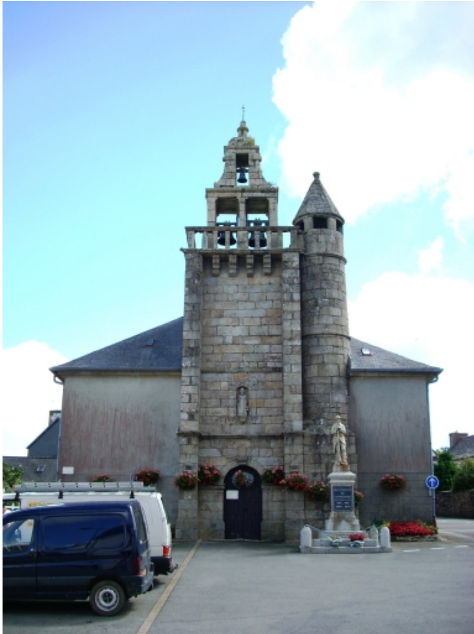
Lanneanou, église paroissiale Saint-Jean-Baptiste : élévation ouest