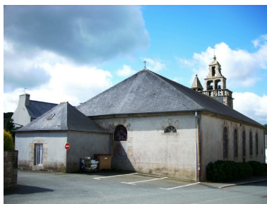
Lannéanou, église paroissiale Saint-Jean-Baptiste : vue générale sud-est