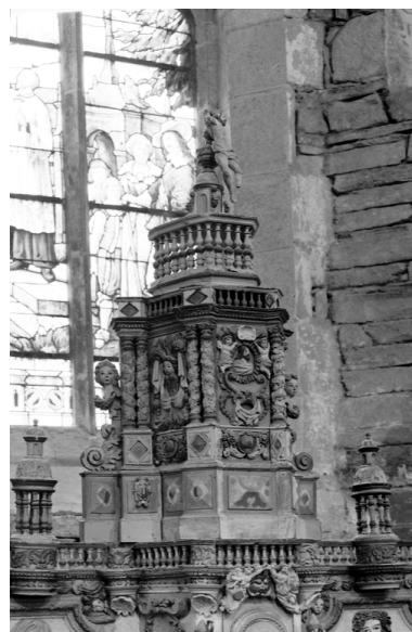
Maître-autel, couronnement du tabernacle