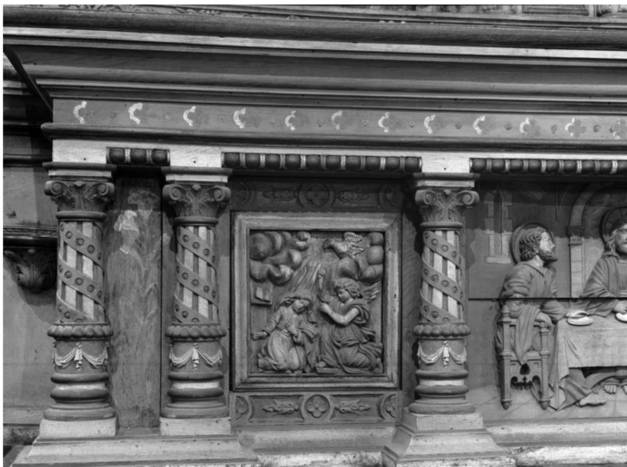
Maître-autel : panneau latéral du tombeau, l'Annonciation