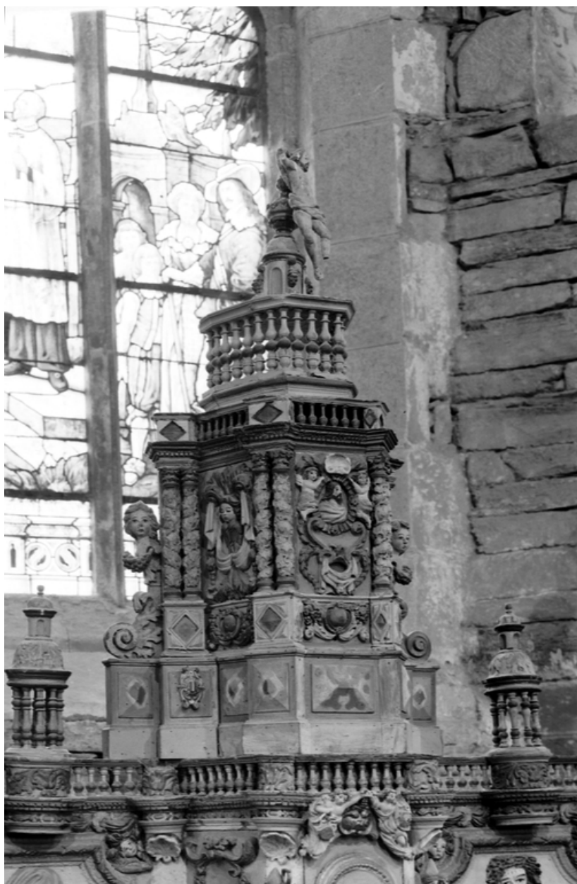
Maître-autel, couronnement du tabernacle