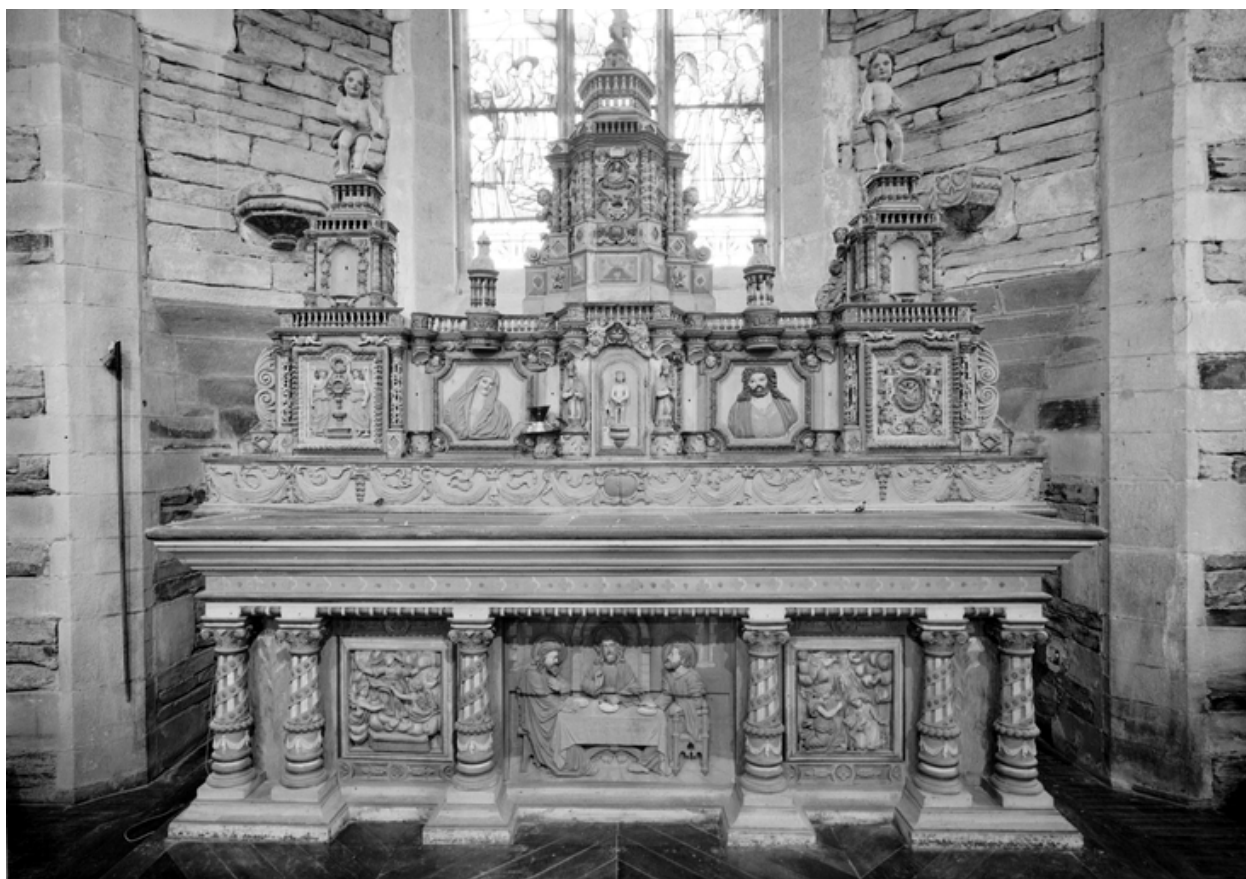
Maître-autel : vue générale de face