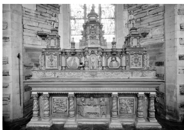
Maître-autel : vue générale de face IVR53_19662200130V