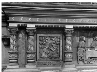
Maître-autel : panneau latéral du tombeau, l'Annonciation IVR53_19662200126V