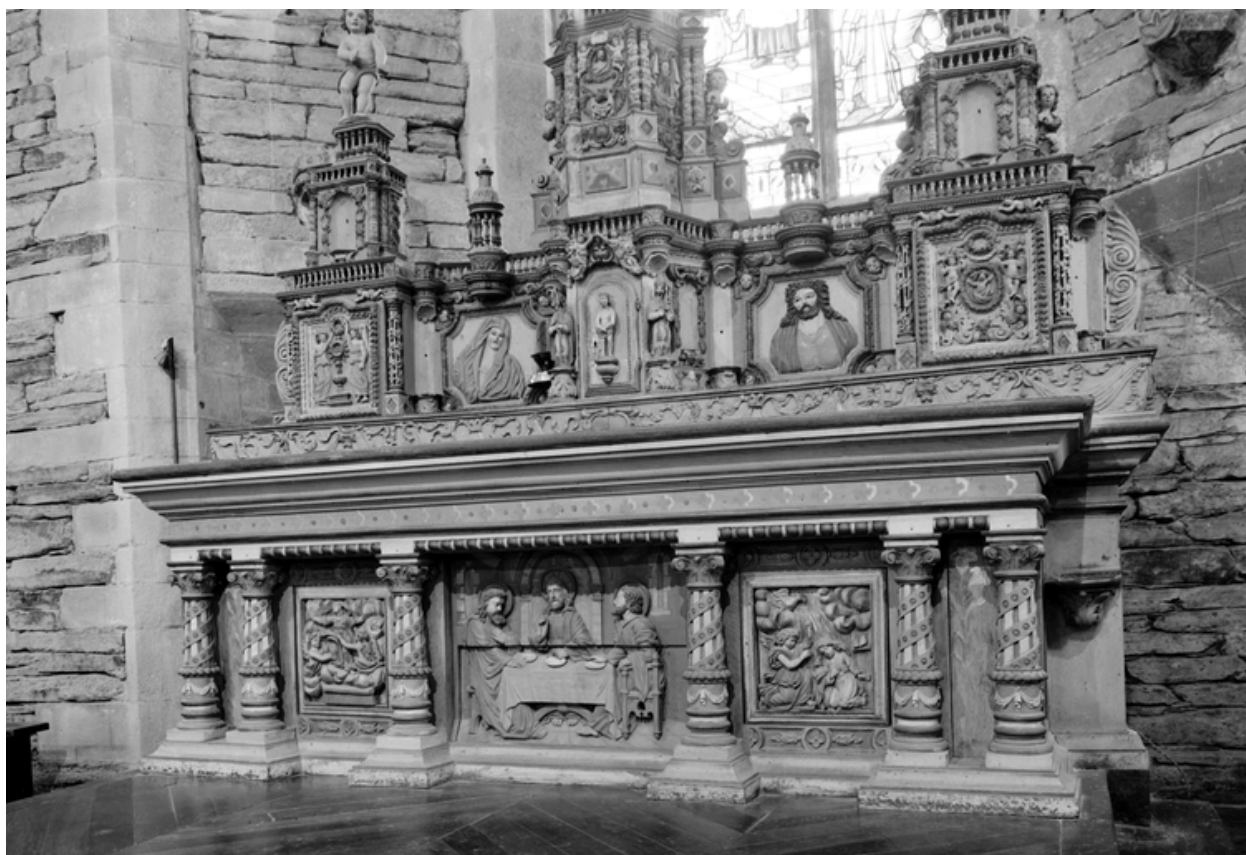
Maître-autel : vue générale du tombeau