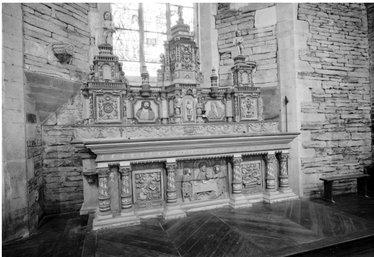
Maître-autel : vue générale de trois-quarts sud