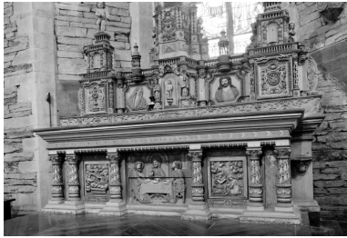
Maître-autel : vue générale du tombeau IVR53_19662200128V