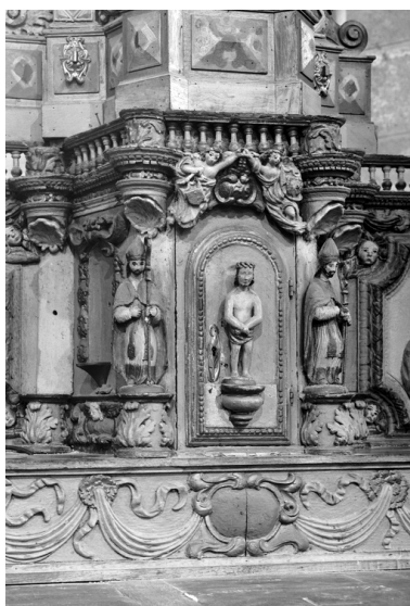
Maître-autel : vue du tabernacle IVR53_19662200127V