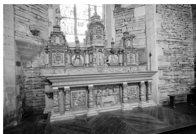
Maître-autel : vue générale de trois-quarts sud