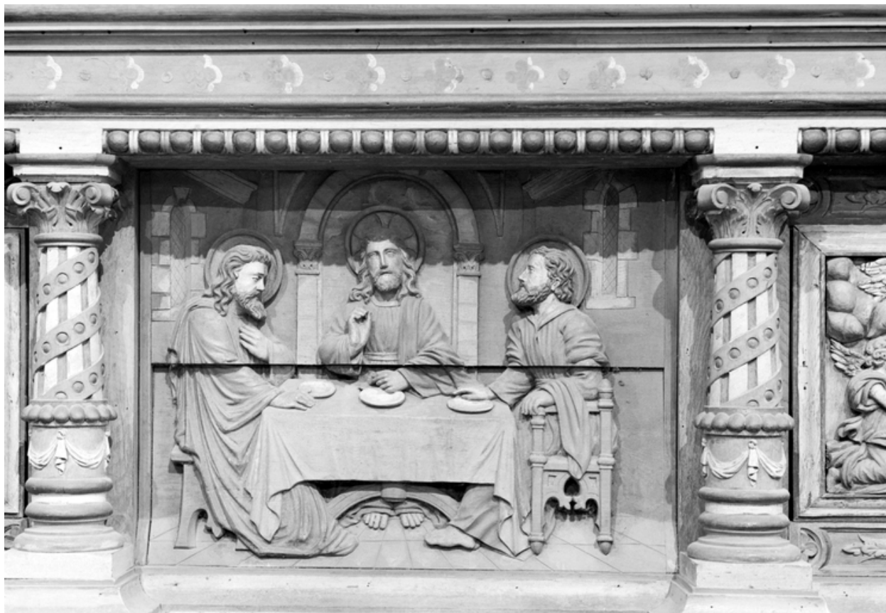
Maître-autel : panneau central du tombeau, Les Disciples d'Emmaüs