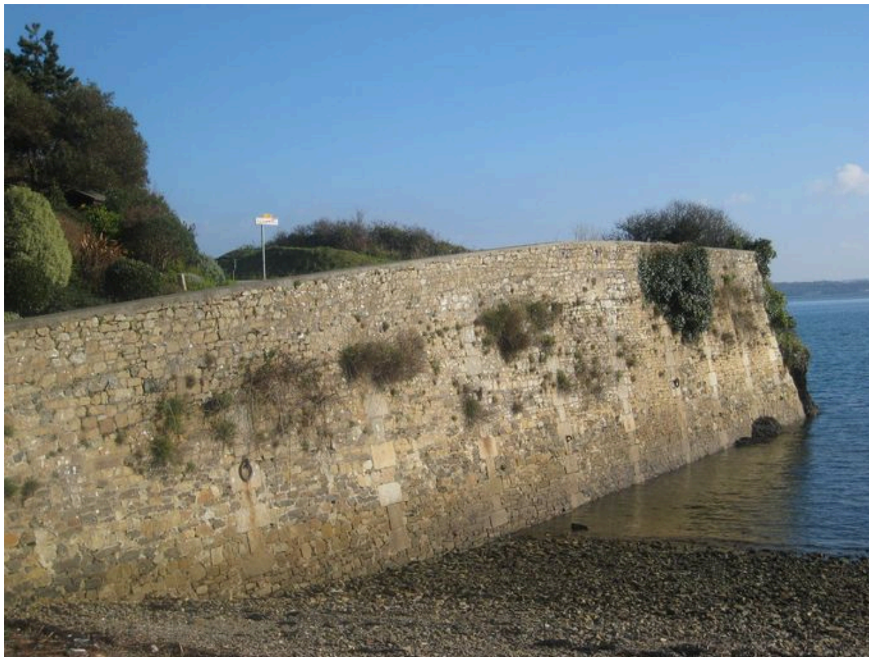
Vue générale du mur de soutènement de Pont-Scorff