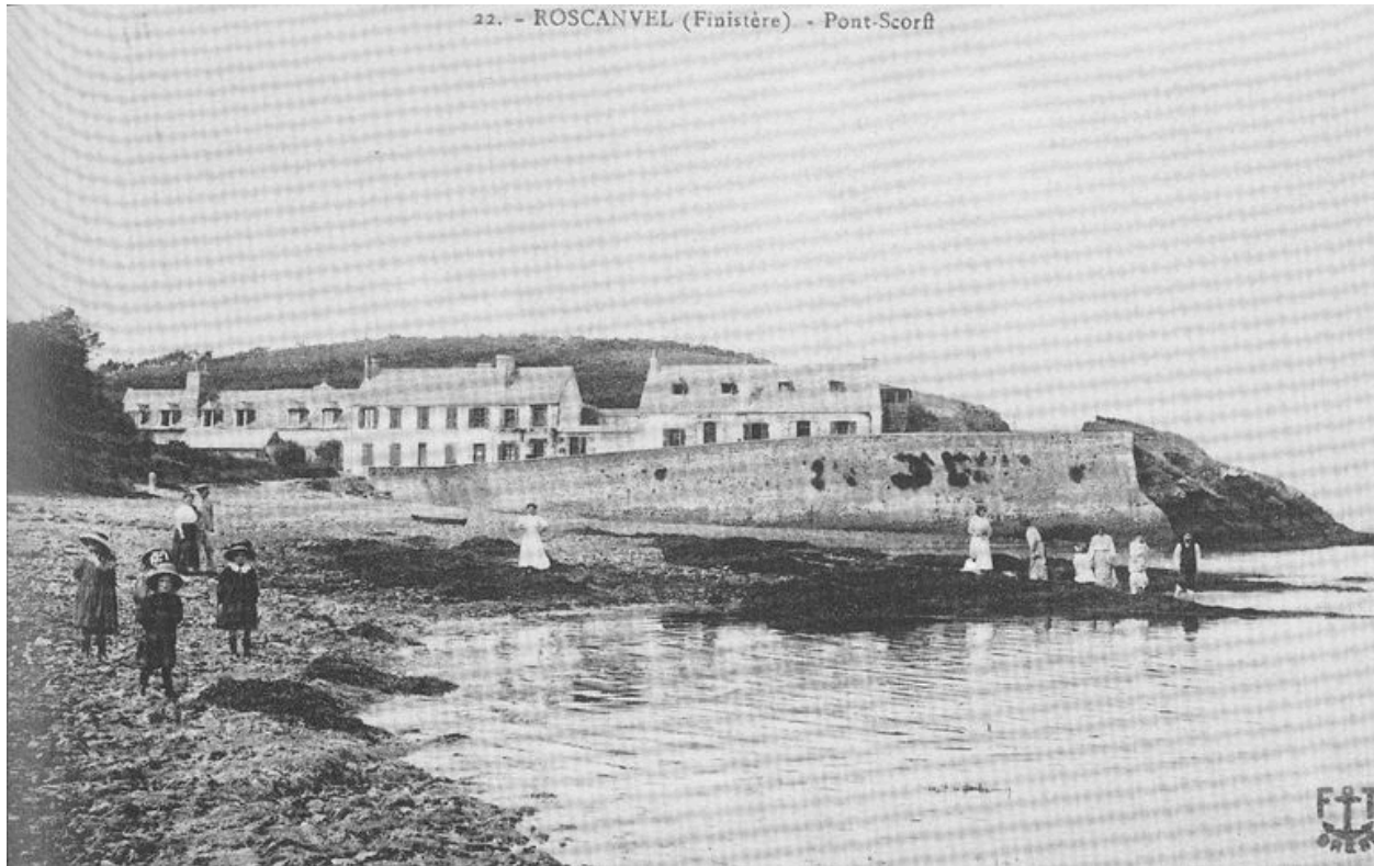
Carte postale : Pont-Scorff