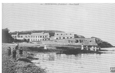
Carte postale : Pont-Scorff IVR53_20082908505NUC