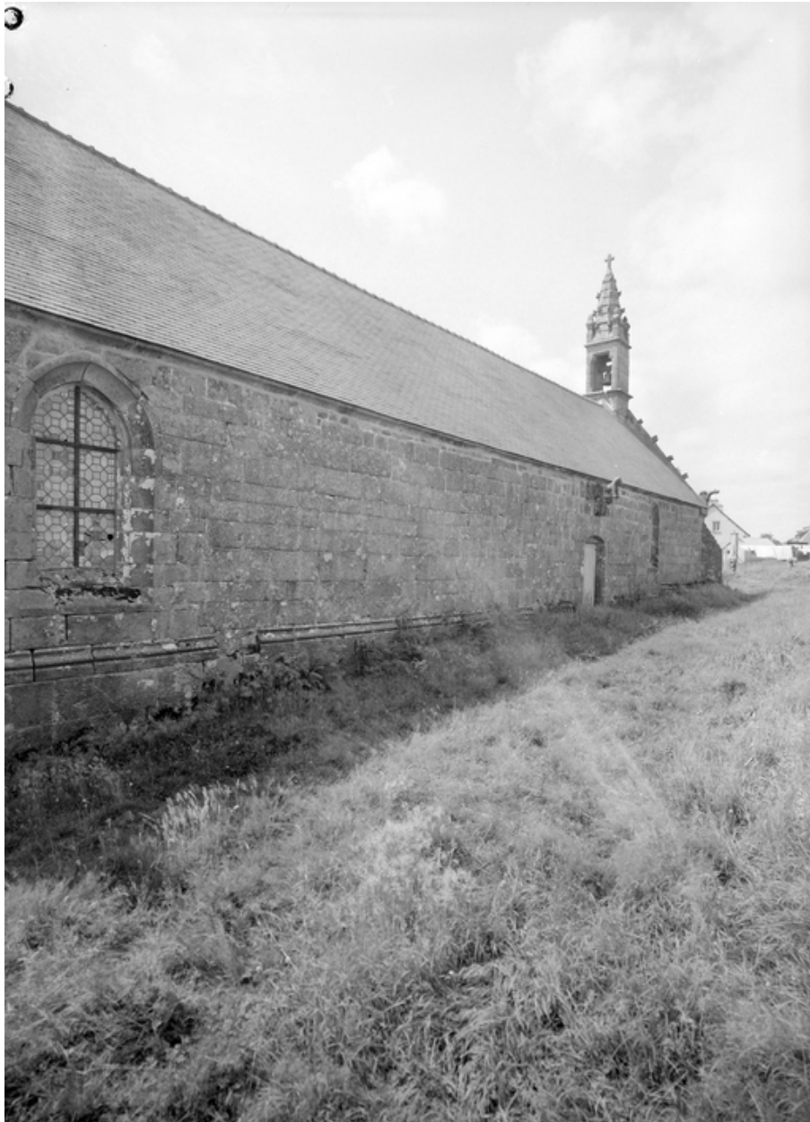
Face nord : vue générale