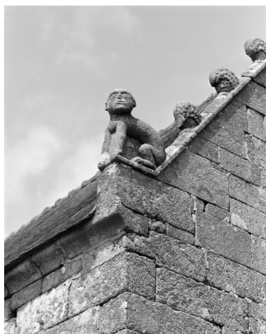
Chevet : détail des crosettes de rampants nord et sud IVR53_19752200426X