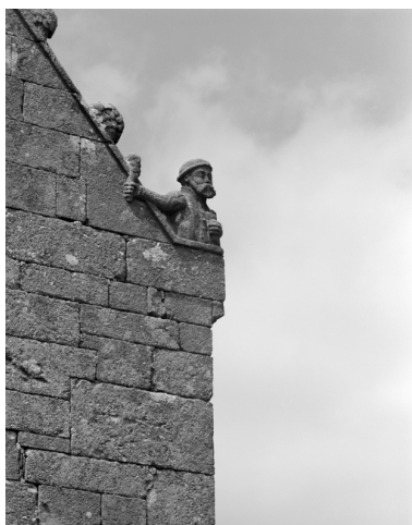
Chevet : détail des crosettes de rampants nord et sud IVR53_19752200427X