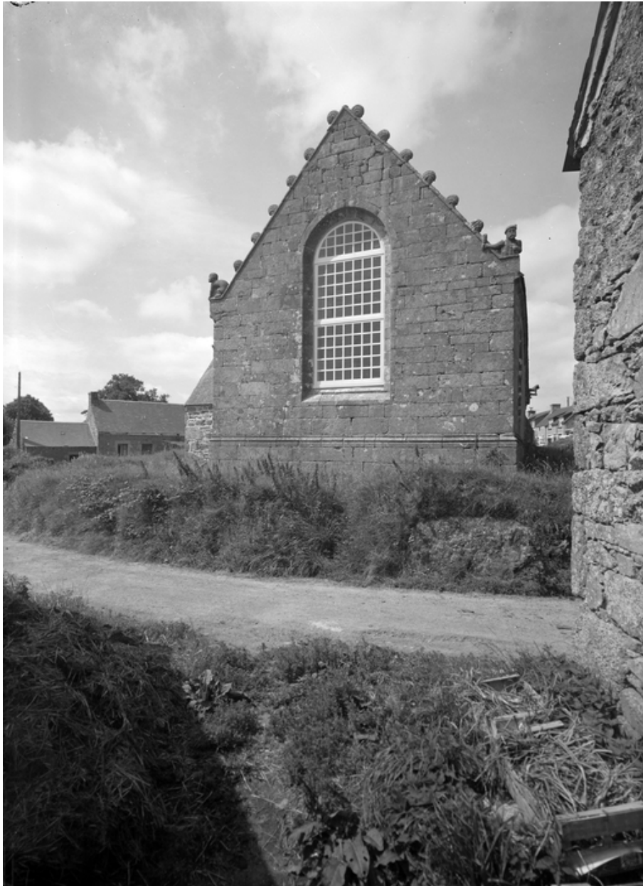
Face est : vue générale