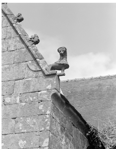
Détail des crossettes de rampants nord et sud IVR53_19752200428X