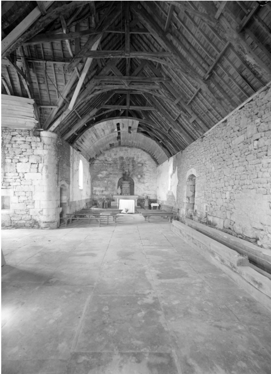
Nef : charpente en berceau