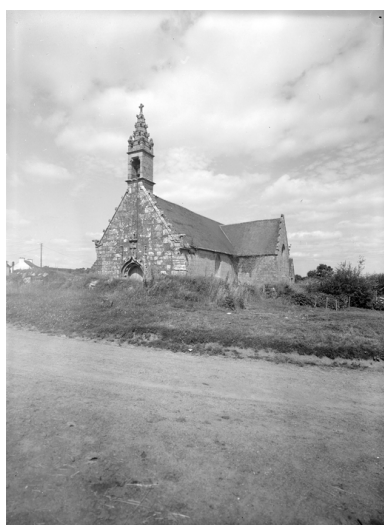
Face sud-ouest : vue générale IVR53_19752200421V