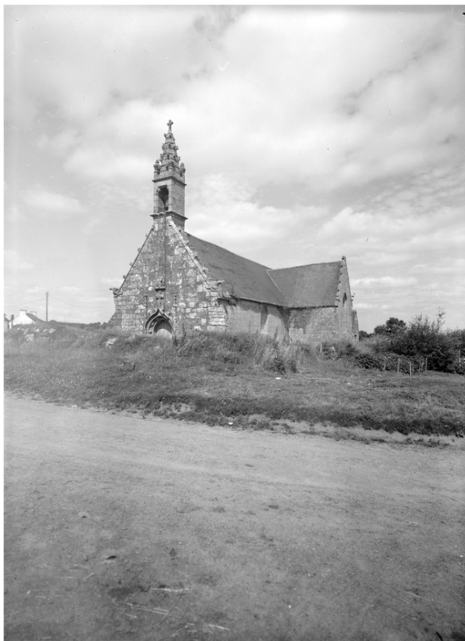
Face sud-ouest : vue générale