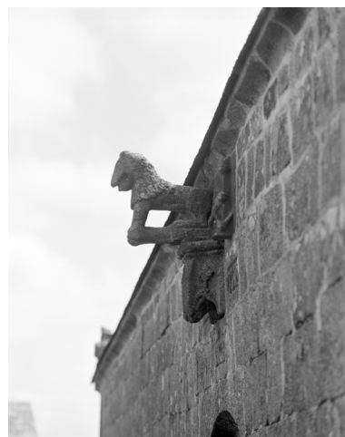
Face nord : détail porte et fleuron la surmontant IVR53_19752200432X