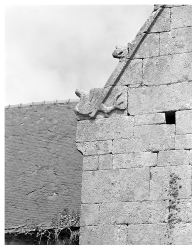
Détail des crossettes de rampants nord et sud IVR53_19752200429X