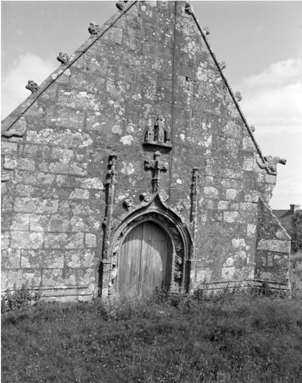
Face ouest : détail de la porte