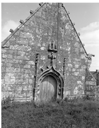
Face ouest : détail de la porte