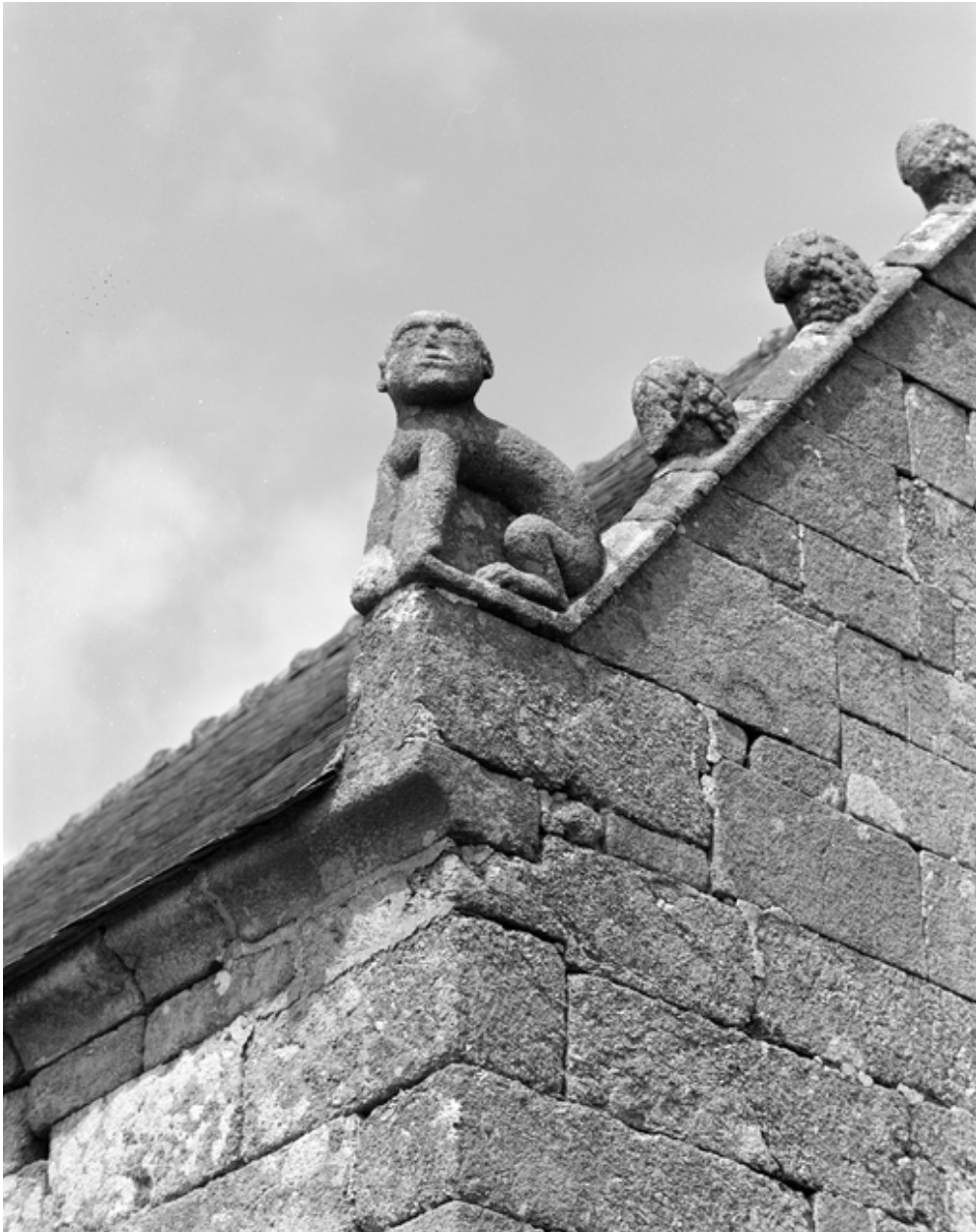
Chevet : détail des crossettes de rampants nord et sud