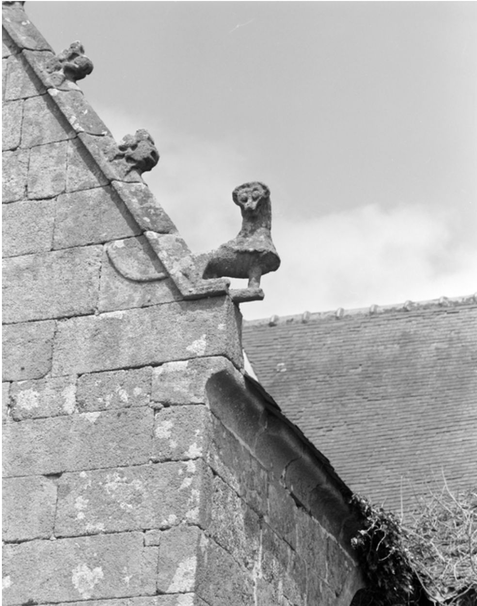
Détail des crossettes de rampants nord et sud