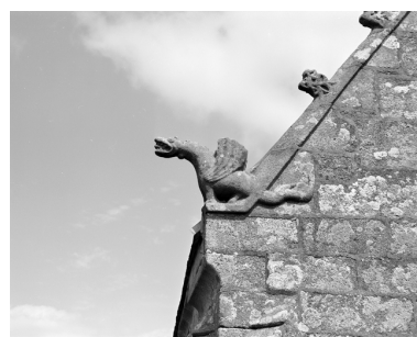
Rampant ouest IVR53_19752200430X