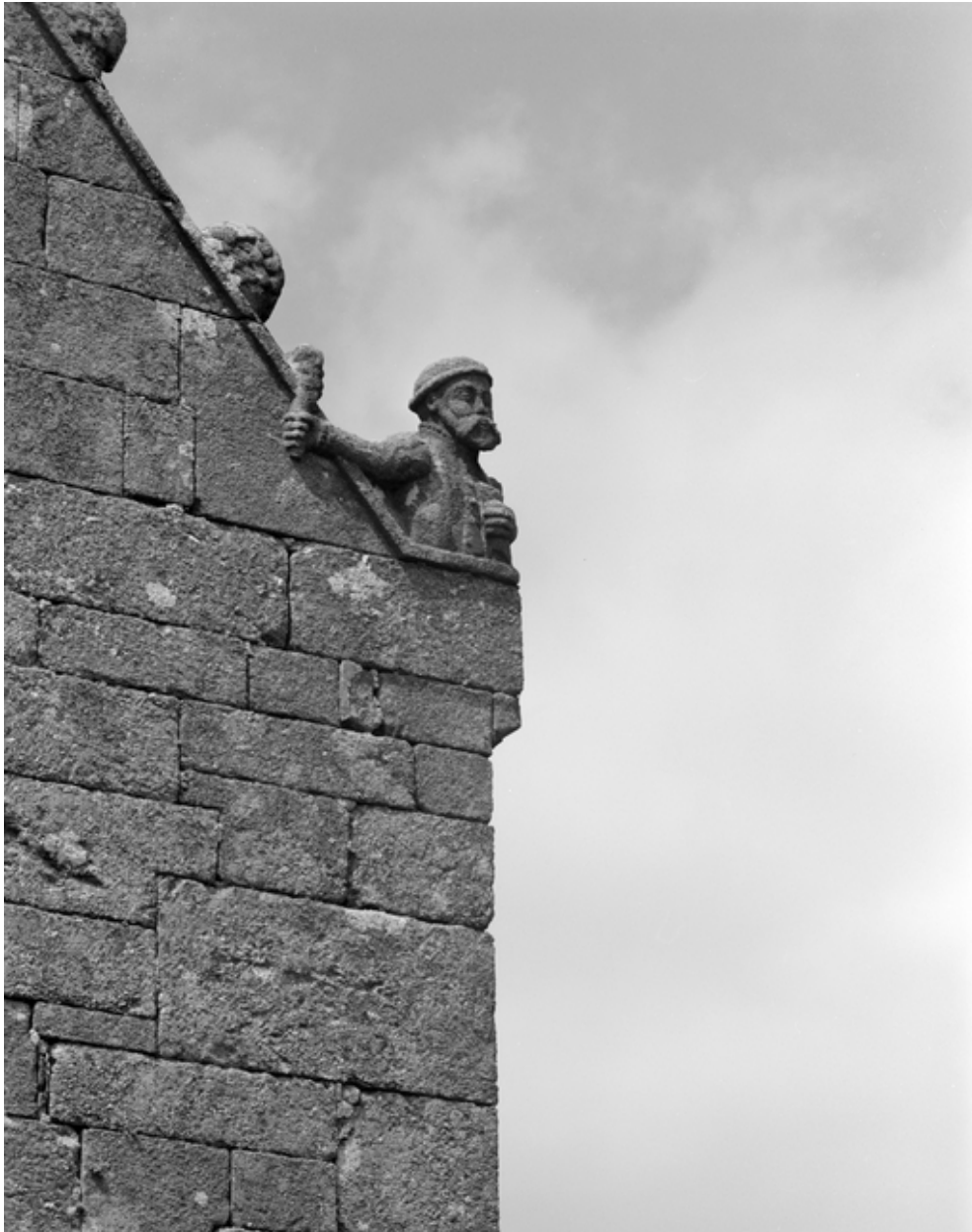
Chevet : détail des crossettes de rampants nord et sud