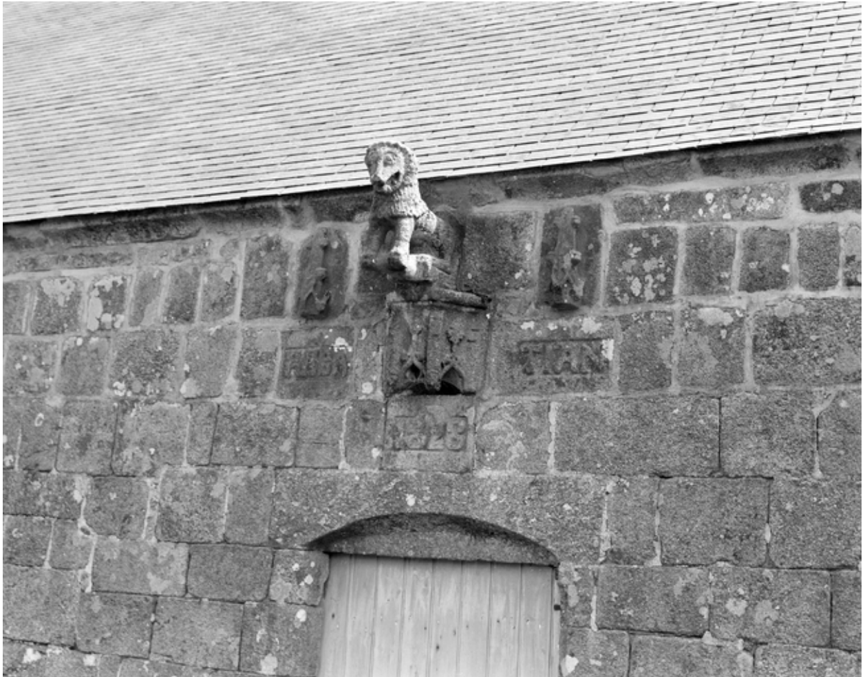
Face nord : détail porte et fleuron la surmontant