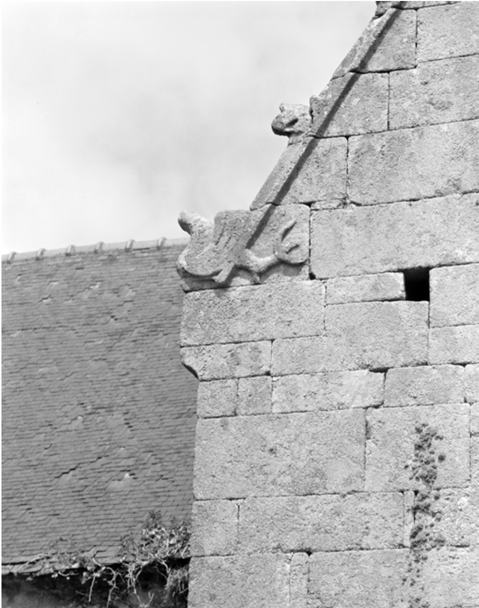
Détail des crossettes de rampants nord et sud