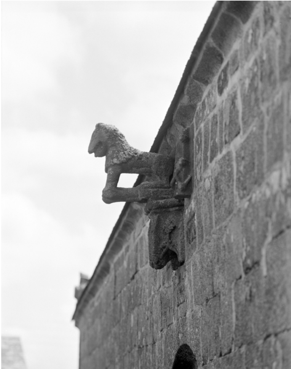
Face nord : détail porte et fleuron la surmontant