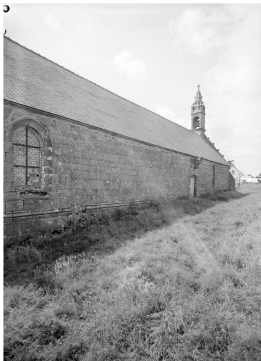
Face nord : vue générale IVR53_19752200423V