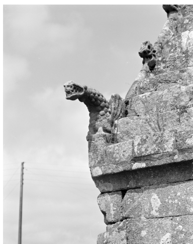
Rampant ouest IVR53_19752200431X