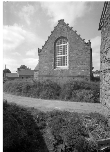
Face est : vue générale