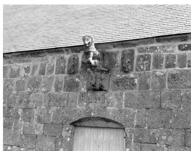
Face nord : détail porte et fleuron la surmontant IVR53_19752200434X