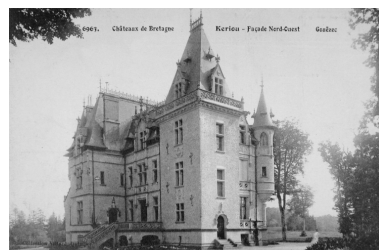
Vue de la façade nord-ouest IVR53_20042905471NUCB