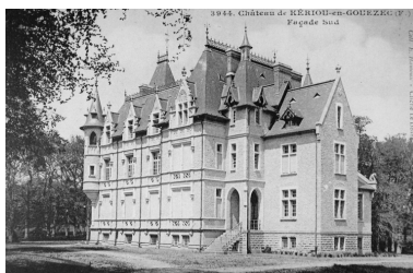
Vue de la façade principale IVR53_20042905472NUCB