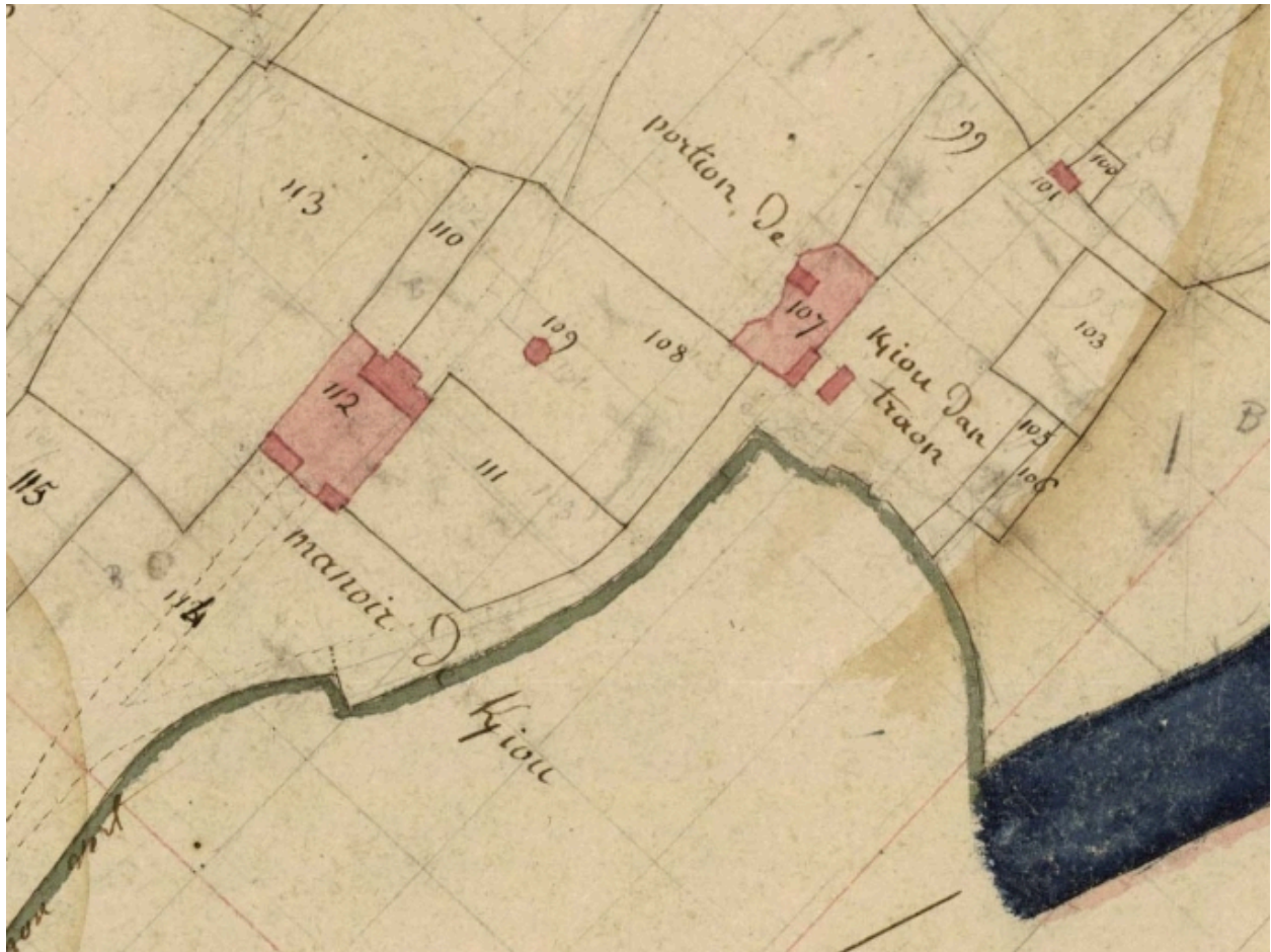
Le manoir de Kerriou sur le cadastre ancien