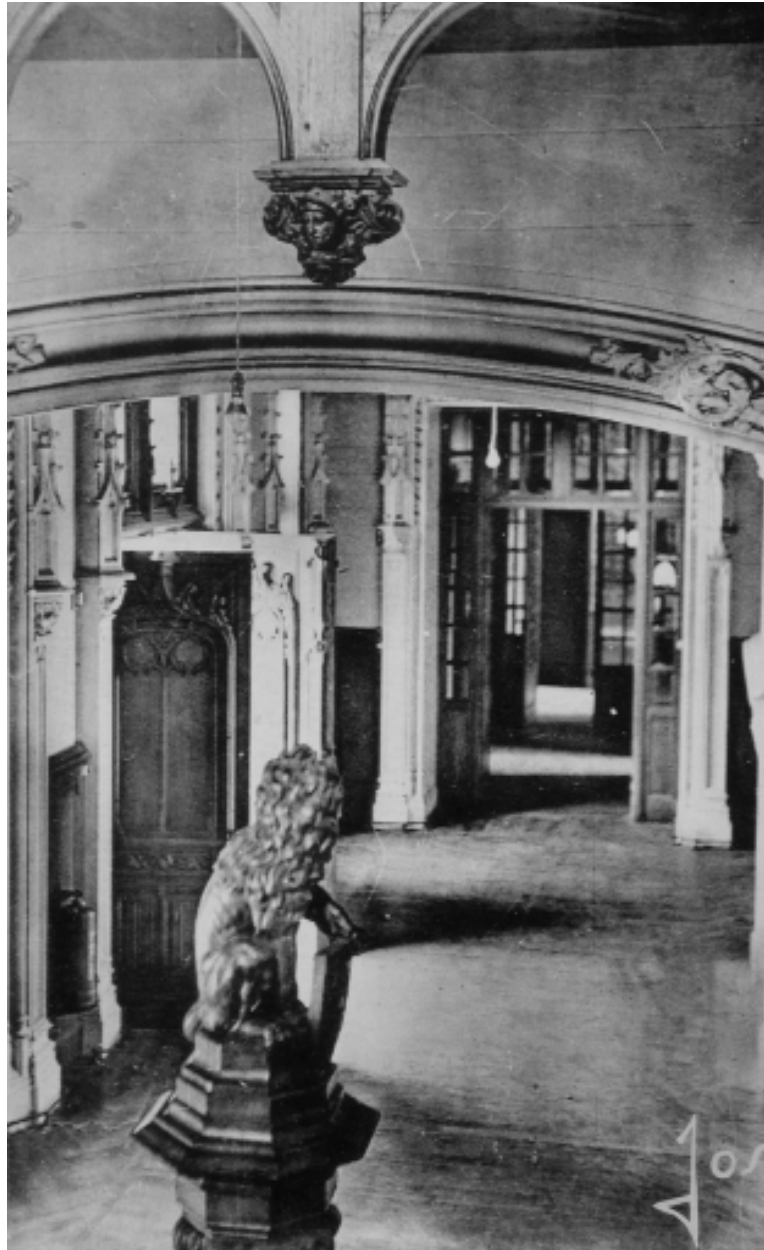
Le grand hall (autre vue)