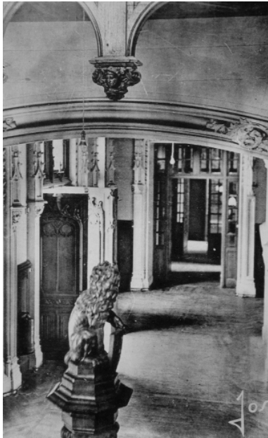
Le grand hall (autre vue) IVR53_20052904384NUCB