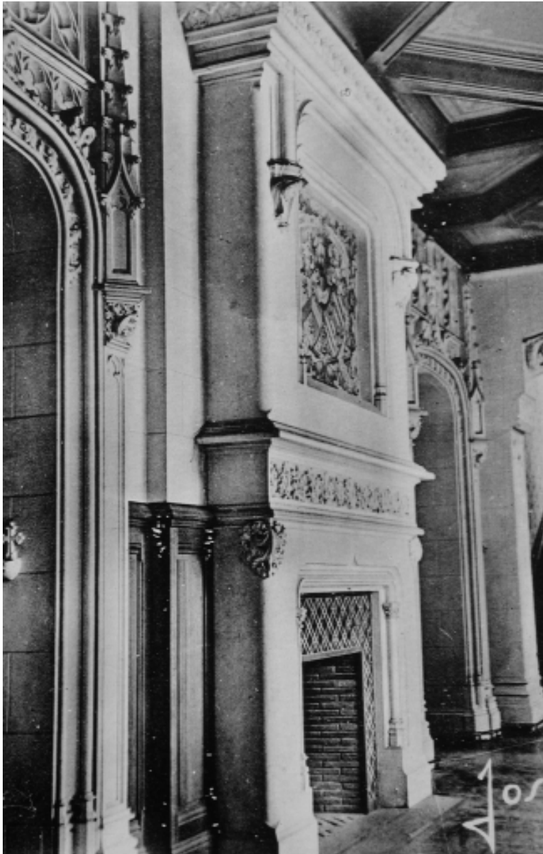
Le grand hall : vue de la cheminée