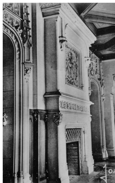
Le grand hall : vue de la cheminée