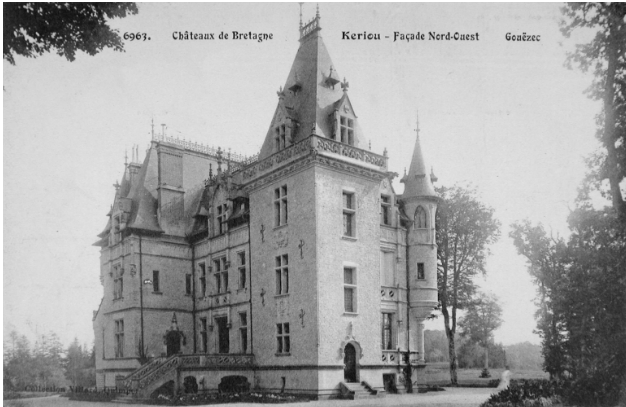
Vue de la façade nord-ouest