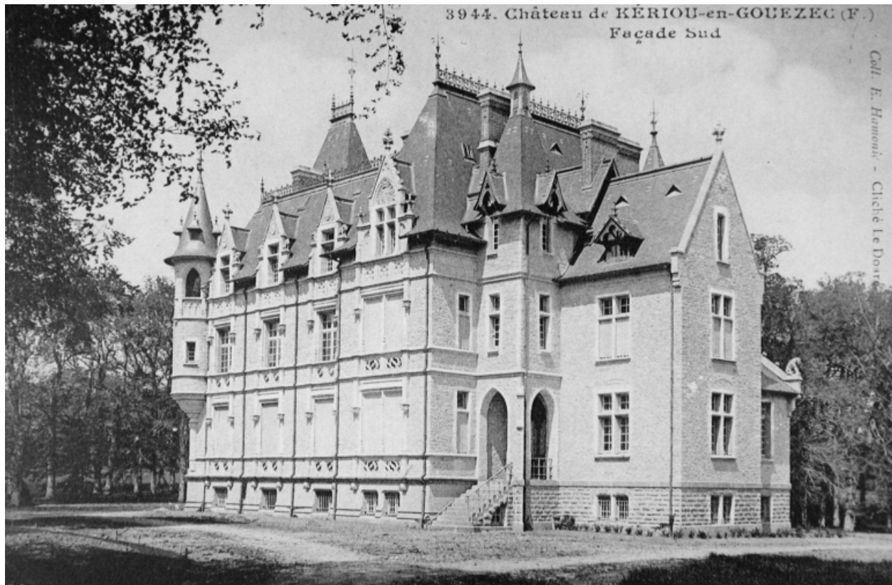
Vue de la façade principale