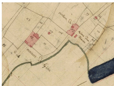
Le manoir de Kerriou sur le cadastre ancien