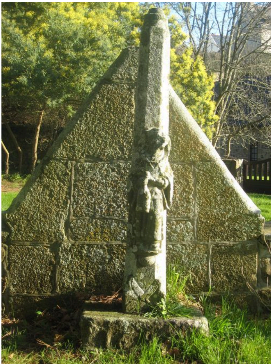
Vue arrière de la fontaine Saint-Eloi et de la statue de Saint-Yves