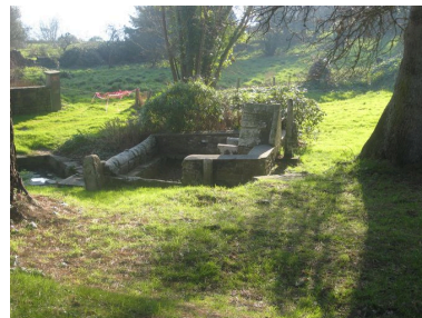
vue latérale de la fontaine Saint-Eloi