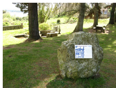
Vue générale de la fontaine Saint-Eloi avec le panneau de l'itinéraire de découverte 'sur les pas du roi Marc'h'