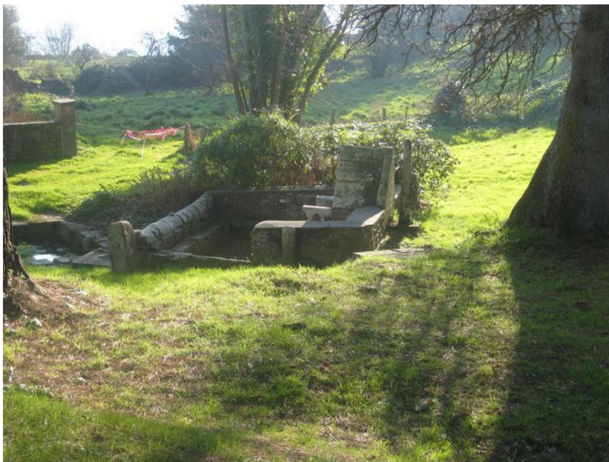
vue latérale de la fontaine Saint-Eloi