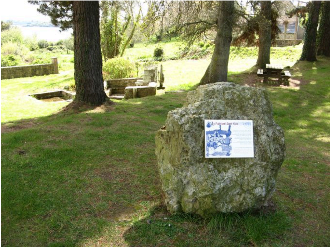
Vue générale de la fontaine Saint-Eloi avec le panneau de l'itinéraire de découverte 'sur les pas du roi Marc'h'