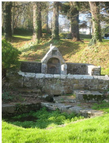
Vue générale de la fontaine Saint-Eloi