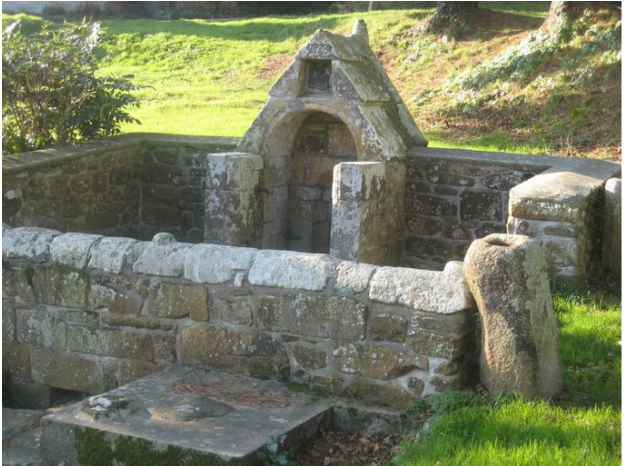
Détail de la fontaine Saint-Eloi