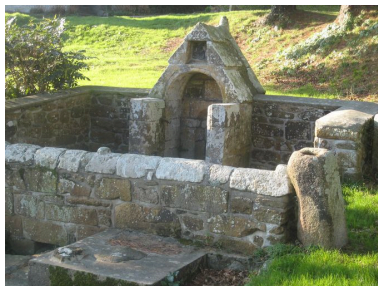
Détail de la fontaine Saint-Eloi