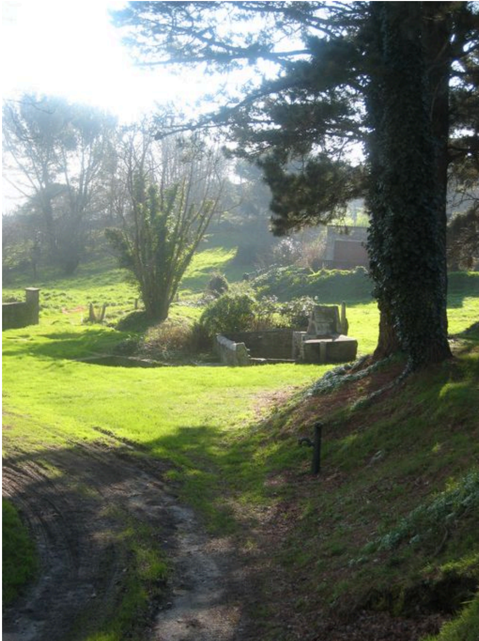
Vue générale de la fontaine Saint-Eloi