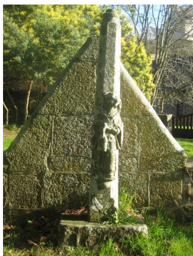
Vue arrière de la fontaine Saint-Eloi et de la statue de Saint-Yves IVR53_20072908913NUCA