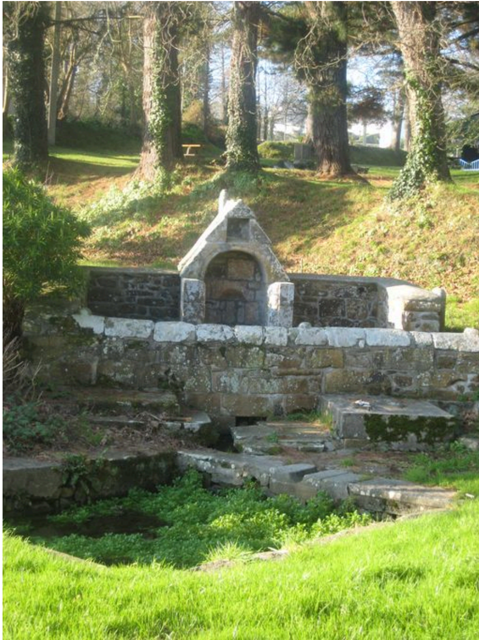
Vue générale de la fontaine Saint-Eloi