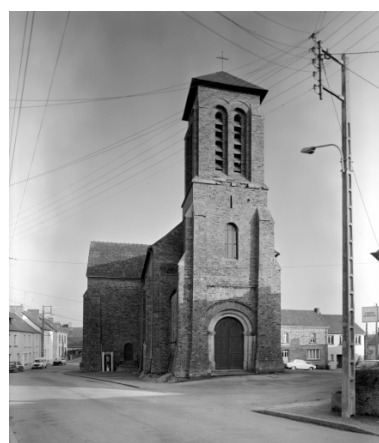
Elévation nord : vue générale IVR53_19823501342V