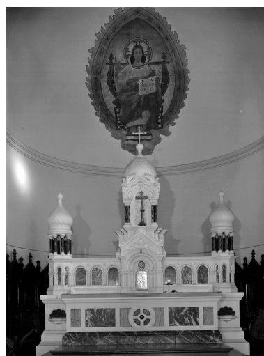
Intérieur, chœur, ensemble de 3 autels, autel du chœur : vue générale