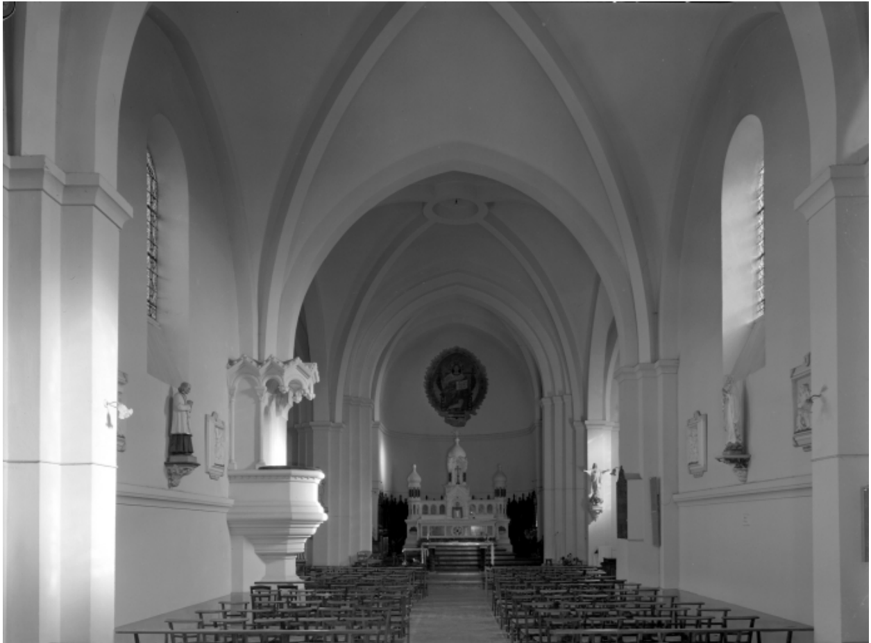
Intérieur : vue générale vers le chœur.