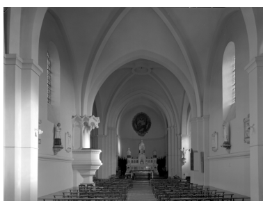
Intérieur : vue générale vers le chœur. IVR53_19823501344V