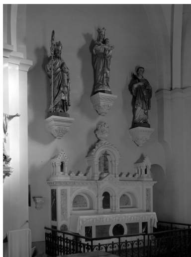
Intérieur, choeur, ensemble de 3 autels, autel sud : vue générale IVR53_19823501347V