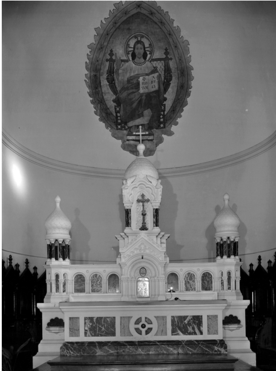
Intérieur, chœur, ensemble de 3 autels, autel du chœur : vue générale