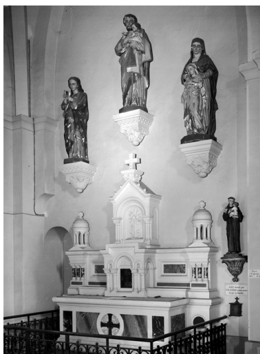
Intérieur, choeur, ensemble de 3 autels, autel nord : vue générale IVR53_19823501348V