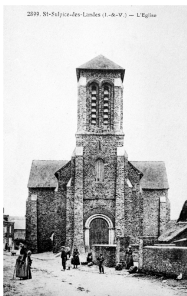
Carte postale ancienne. Elévation ouest : vue générale. IVR53_19933500921X