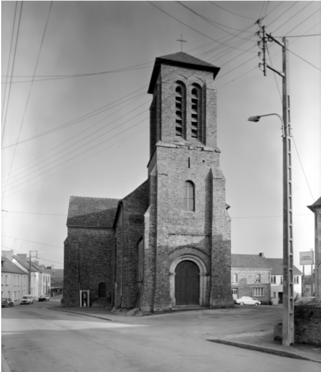
Elévation nord : vue générale