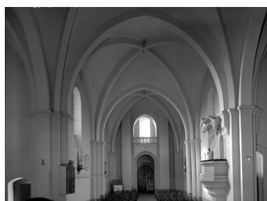
Intérieur, nef : vue générale. IVR53_19823501345V