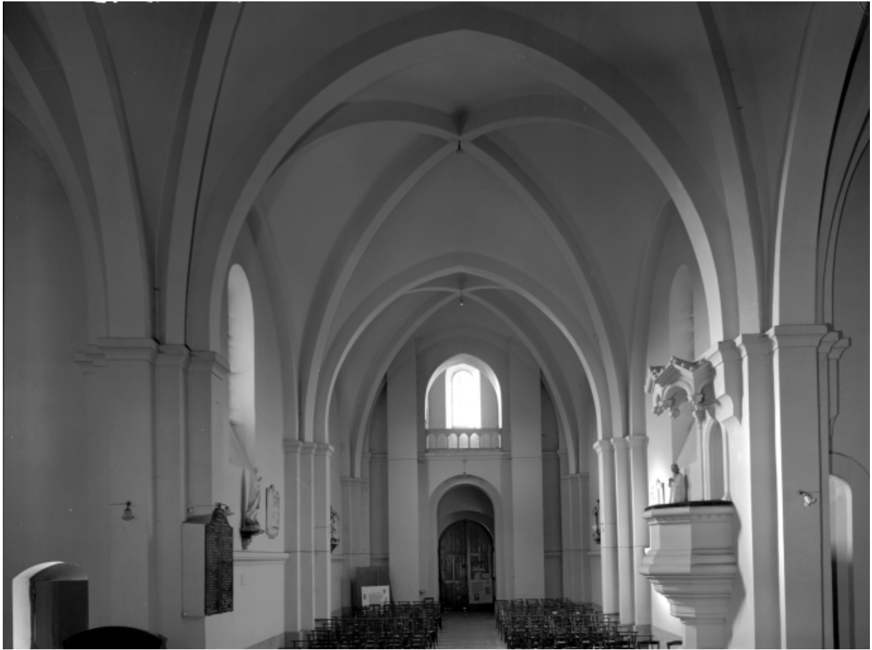
Intérieur, nef : vue générale.