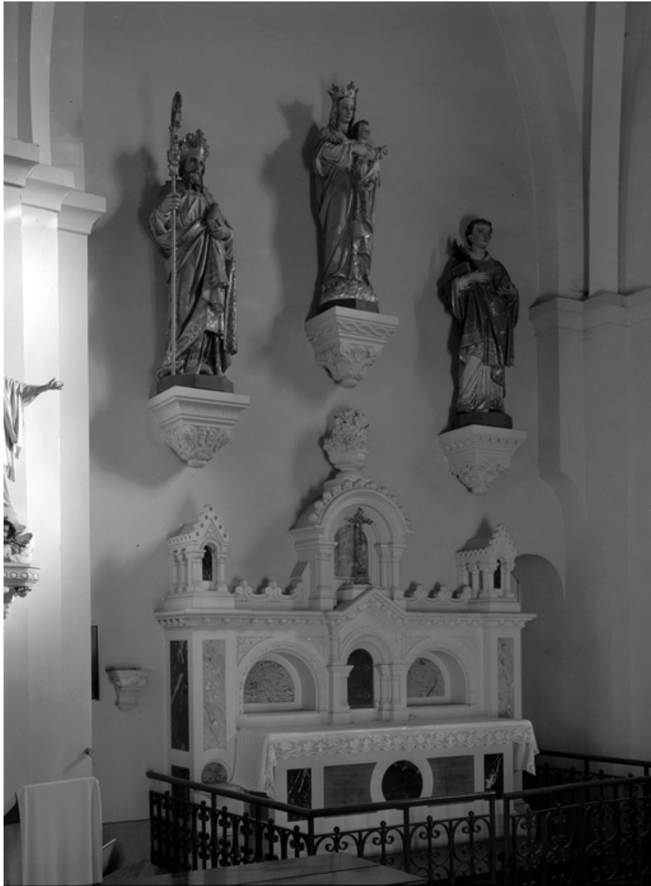
Intérieur, chœur, ensemble de 3 autels, autel sud : vue générale