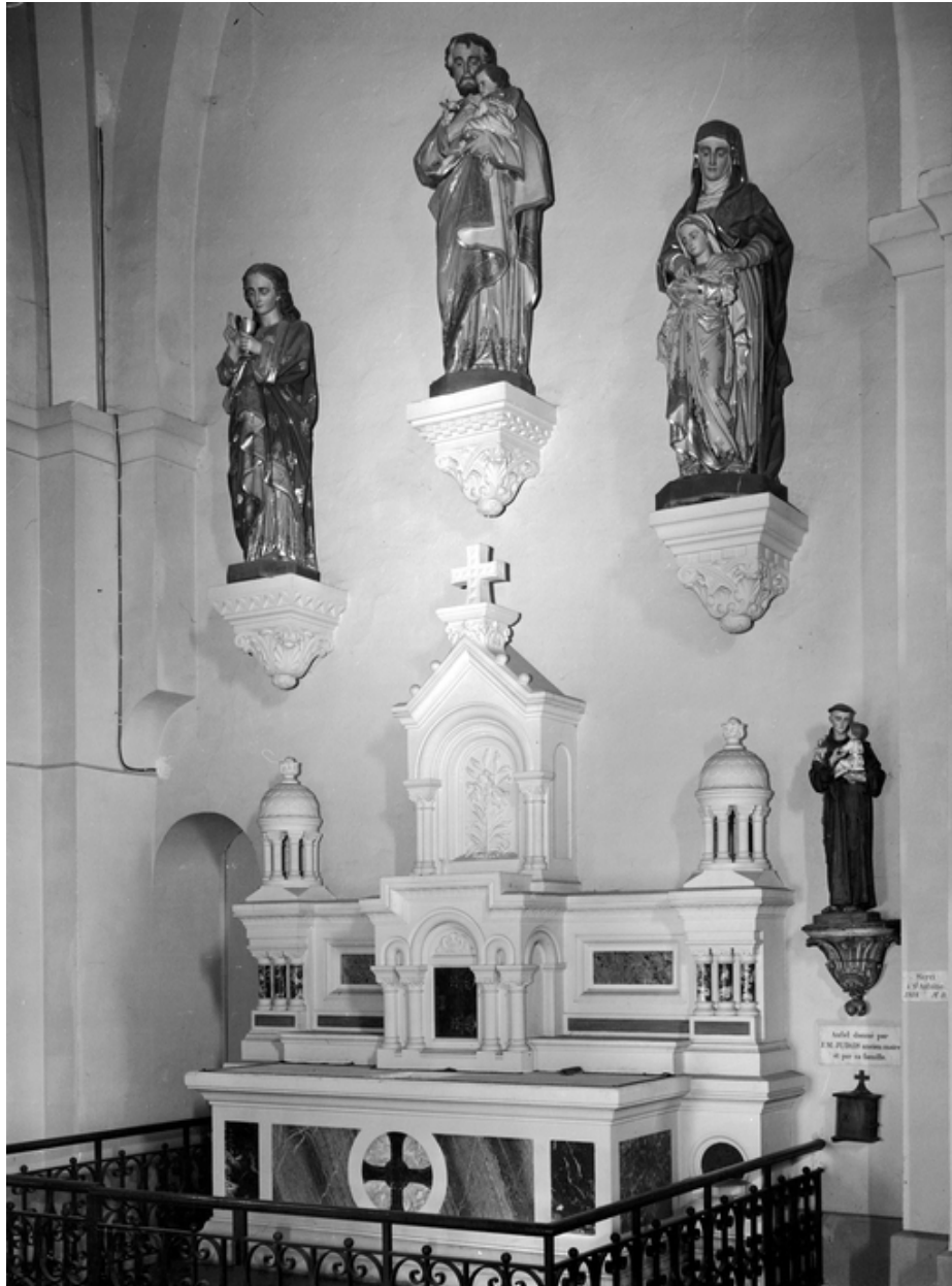
Intérieur, chœur, ensemble de 3 autels, autel nord : vue générale