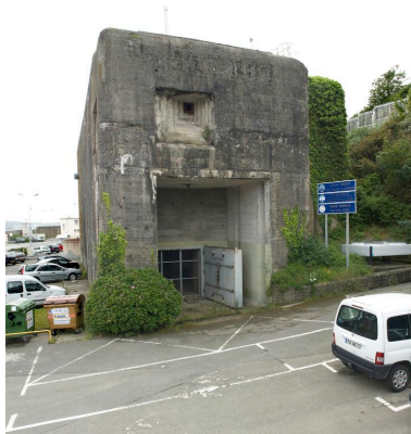
IVR53_20122900999NUCA