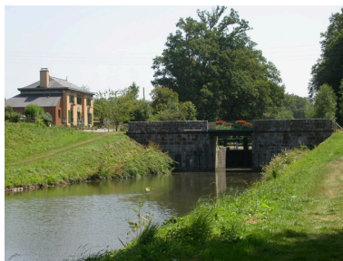
Vue générale sud-ouest IVR53_20053519028NUCA