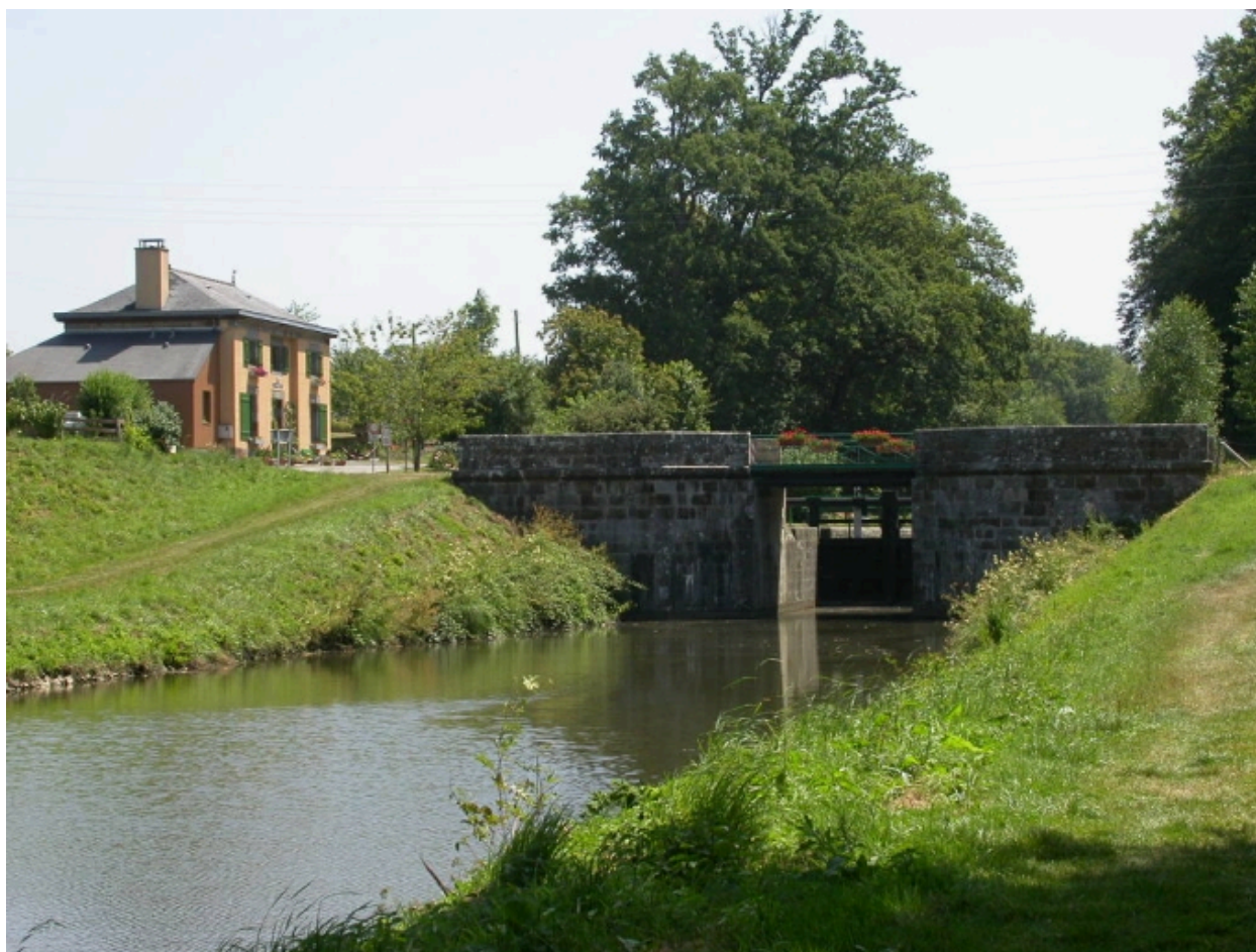
Vue générale sud-ouest