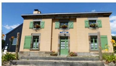
Vue sud IVR53_20243531607NUCA