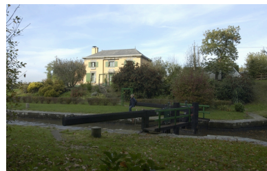
Vue générale sud-est IVR53_20053502970NUCA