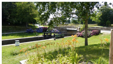
Vue de l'écluse et du pont