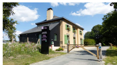
Vue sud ouest IVR53_20243531609NUCA