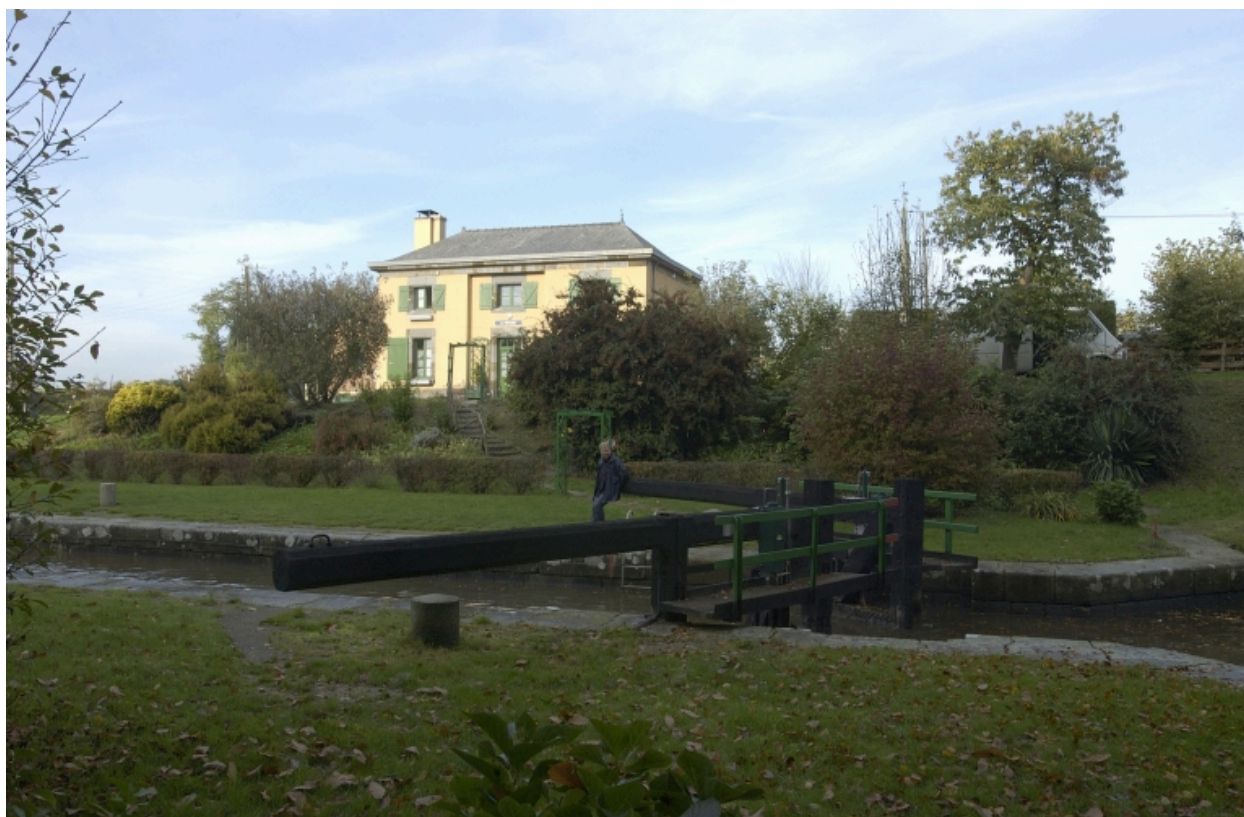
Vue générale sud-est