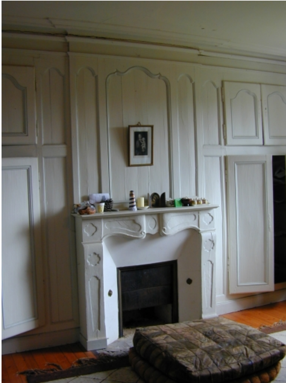
Château, pièce de l'étage