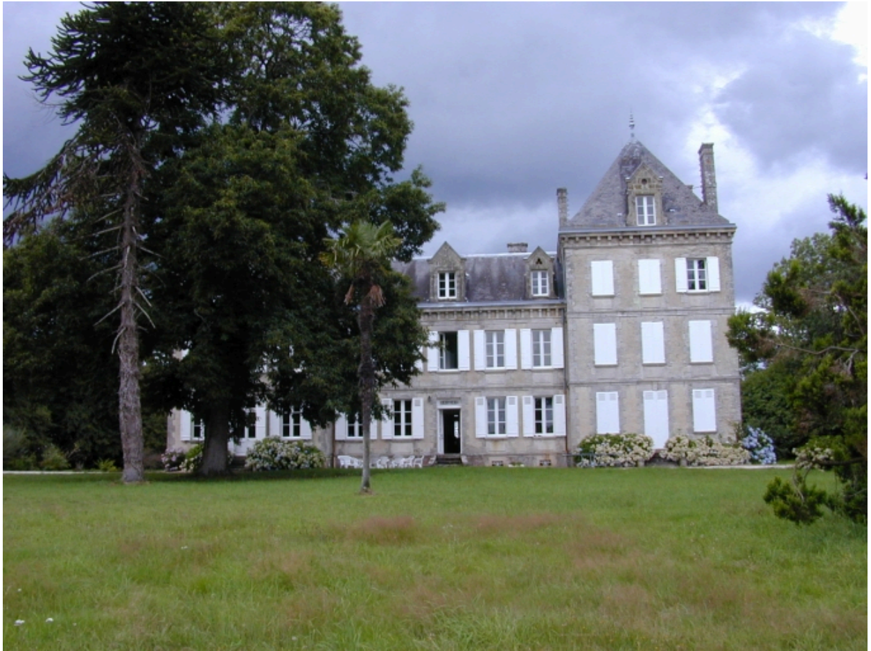
Château, élévation sud-est