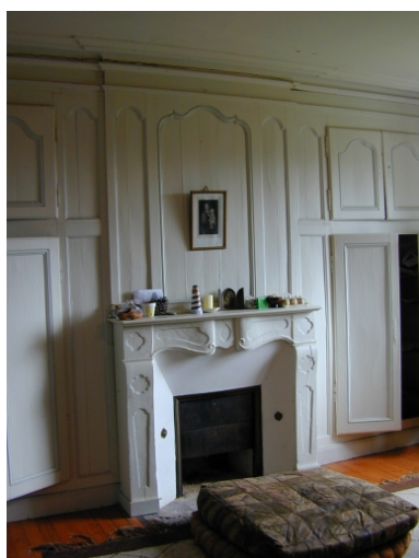
Château, pièce de l'étage