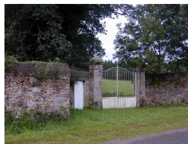
Portail est