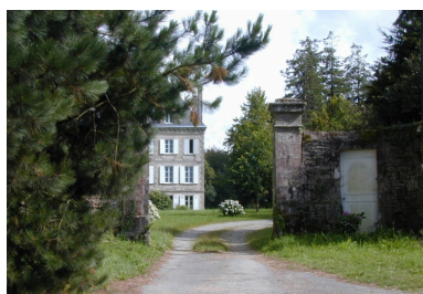
Portail nord IVR53_20042904829NUCA