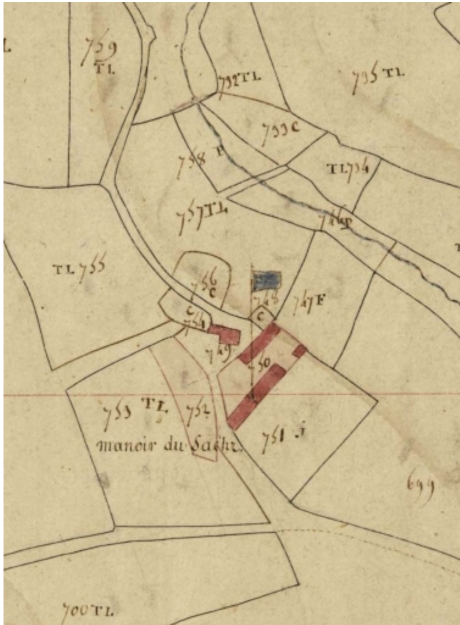
Extrait du cadastre de 1818, section C2