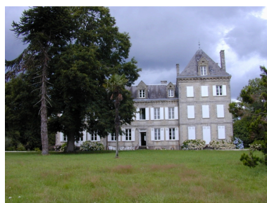
Château, élévation sud-est IVR53_20042904830NUCA