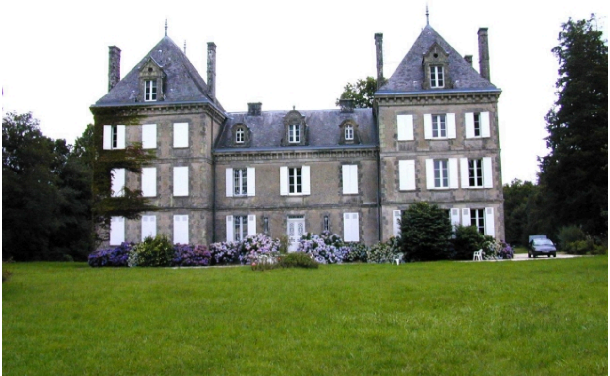
Château, élévation nord-ouest