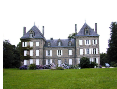
Château, élévation nord-ouest IVR53_20042904831NUCA