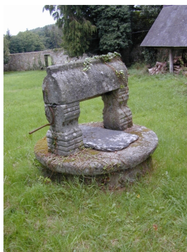
Puits