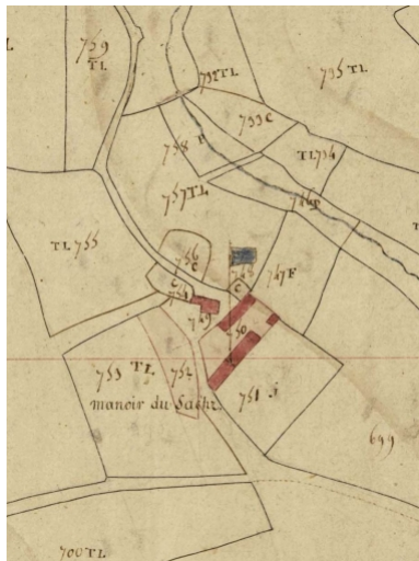
Extrait du cadastre de 1818, section C2

Repro. Christel Douard, Autr. Archives départementales du Finistère IVR53_20042904761NUCA