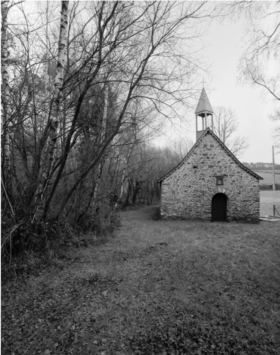
Vue générale ouest