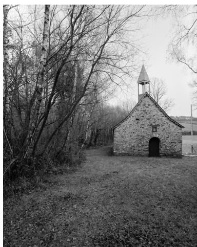
Vue générale ouest IVR53_19933500012X