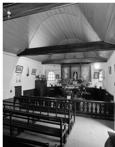
Vue intérieure, IVR53_19933500013X