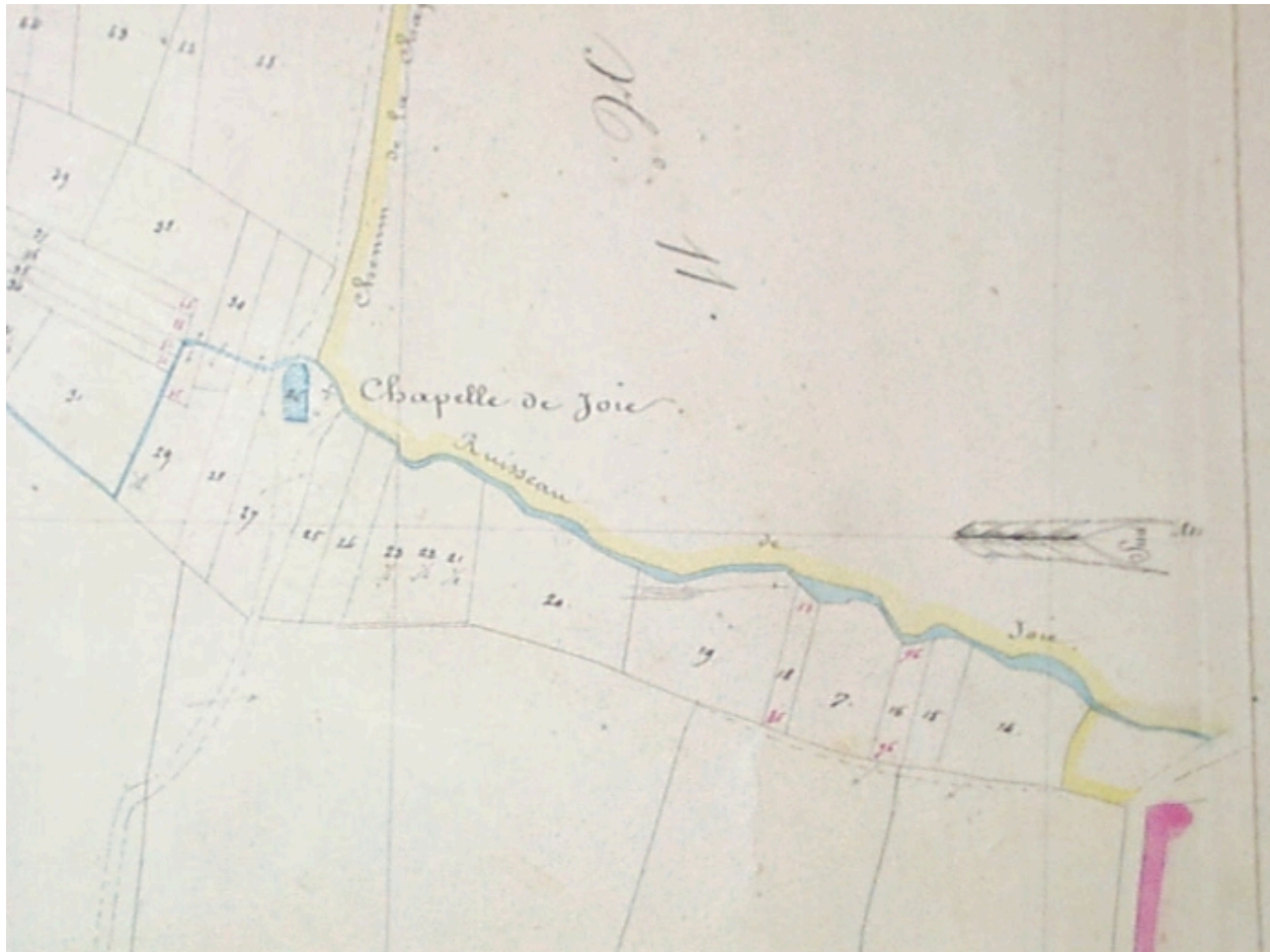
La chapelle sur le cadastre de 1836