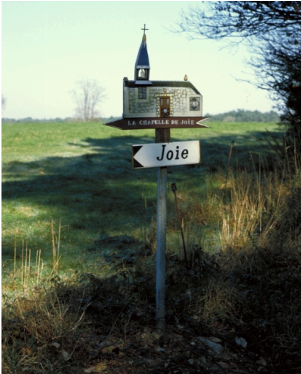
Pancarte de bois représentant la chapelle : vue générale est