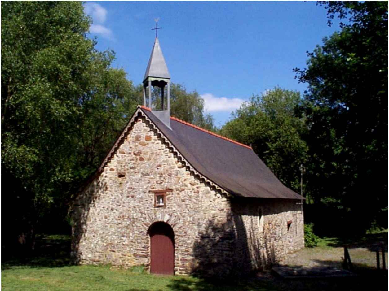
Vue générale ouest