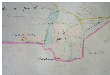
La chapelle sur le tableau d'assemblage du cadastre de 1836