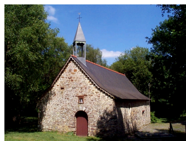
Vue générale ouest IVR53_19993505117NUCA