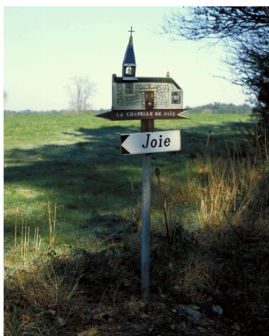
Pancarte de bois représentant la chapelle : vue générale est IVR53_20003500186XA