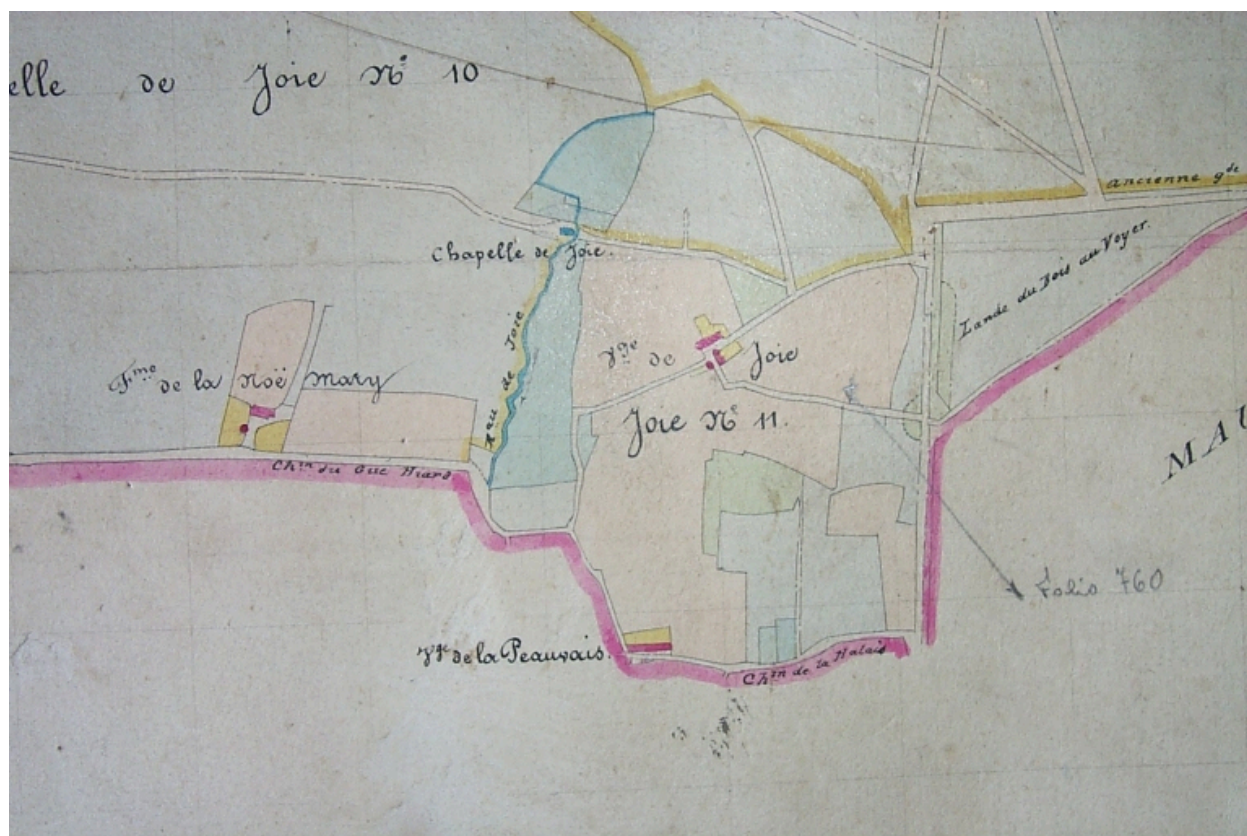
La chapelle sur le tableau d'assemblage du cadastre de 1836