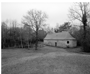
Vue générale sud-est IVR53_19933500011X