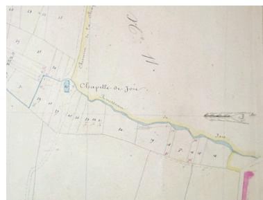
La chapelle sur le cadastre de 1836