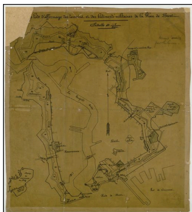
Plan des lots d'affermage des terrains et des bâtiments militaires de la place de Brest, 1922