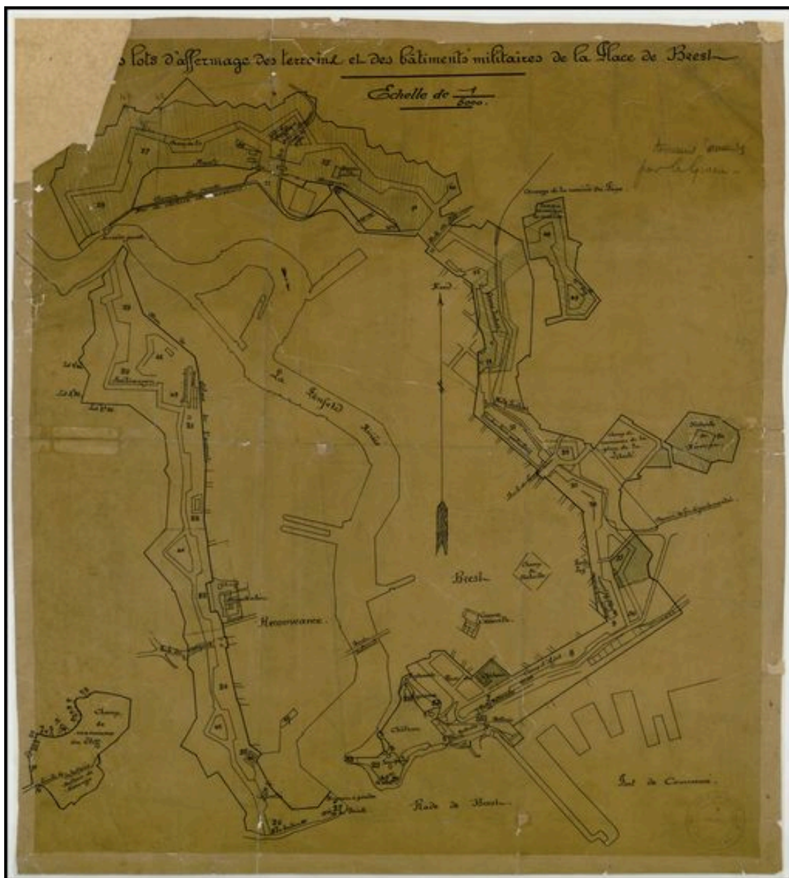
Plan des lots d'affermage des terrains et des bâtiments militaires de la place de Brest, 1922