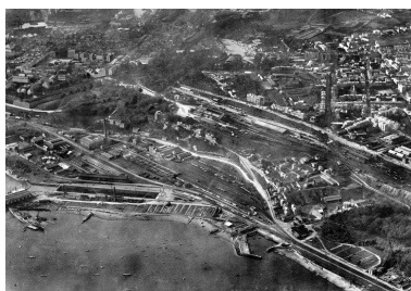
Vue aérienne oblique de Brest en 1926 : le port, Poullic al Lor, la gare de chemin de fer et la redoute de Keroriou