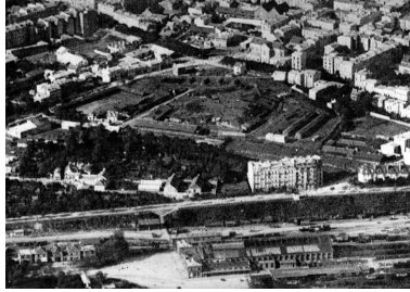
Vue aérienne oblique de Brest en 1926 : la redoute de Keroriou IVR53_20082909036NUC