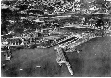
Vue aérienne oblique de Brest en 1926 : le port de commerce (grand bassin du nord-est ; au centre de la photographie : la jetée de l'est), la gare de chemin de fer et la redoute de Keroriou IVR53_20082909035NUC