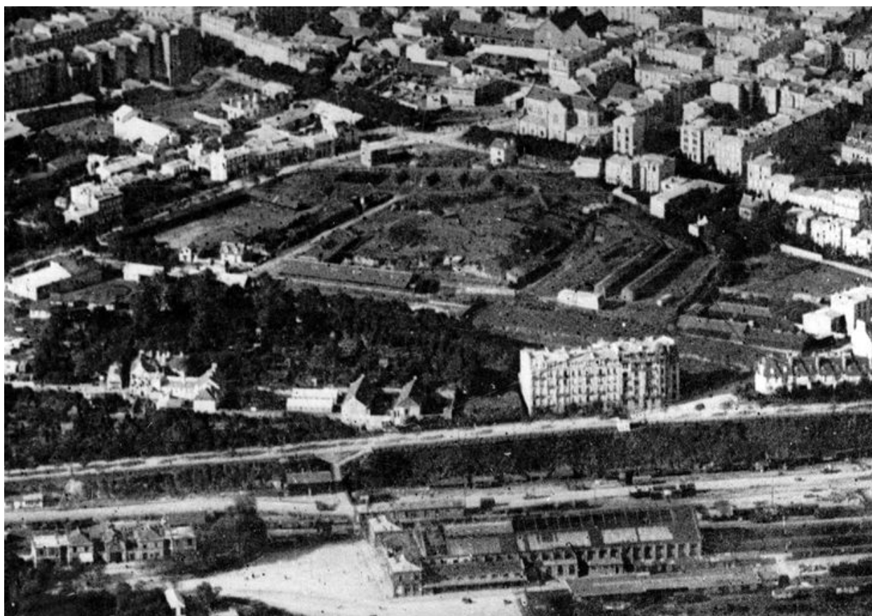
Vue aérienne oblique de Brest en 1926 : la redoute de Keroriou