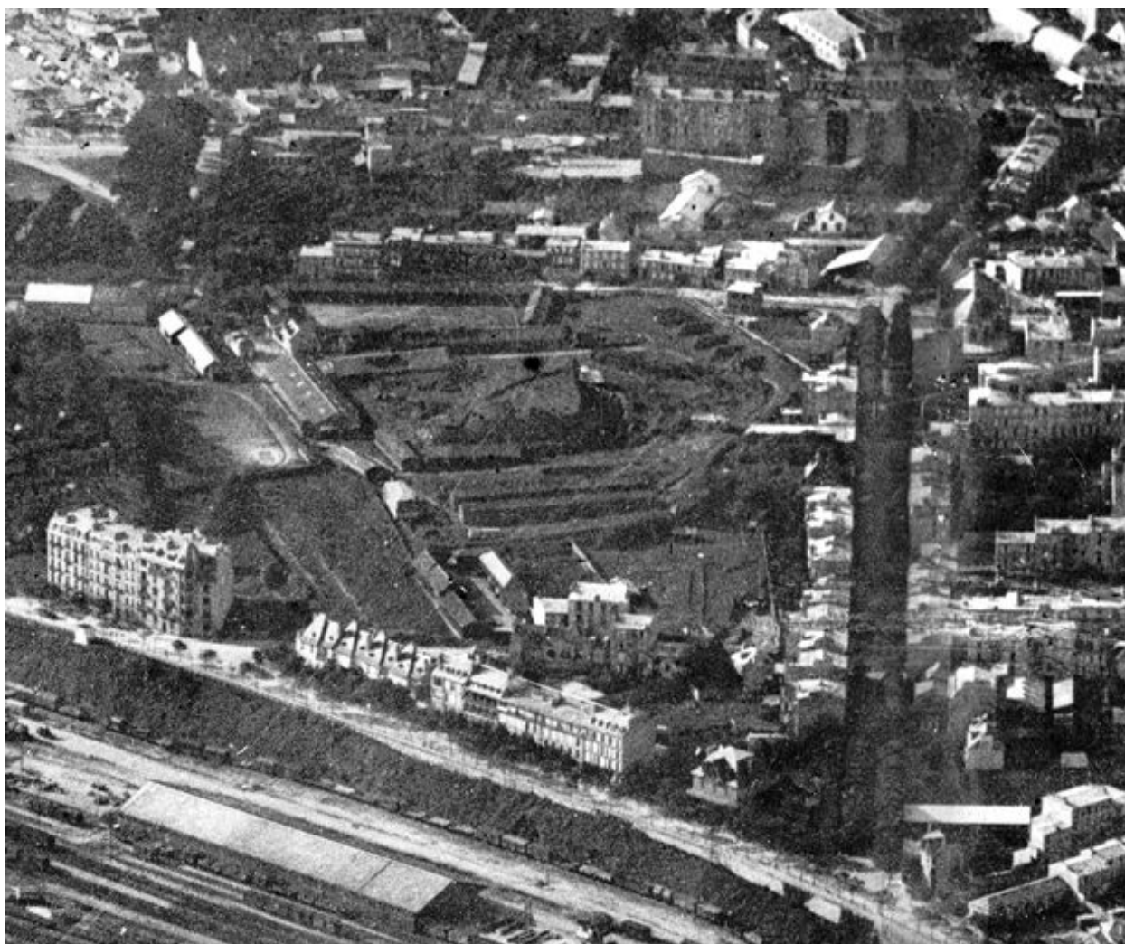
Vue aérienne oblique de Brest en 1926 : la redoute de Keroriou