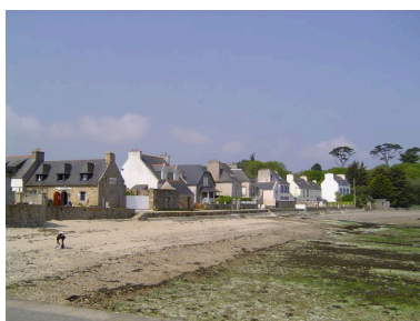
Vue latérale du front résidentiel du Fret IVR53_20062908548NUCA