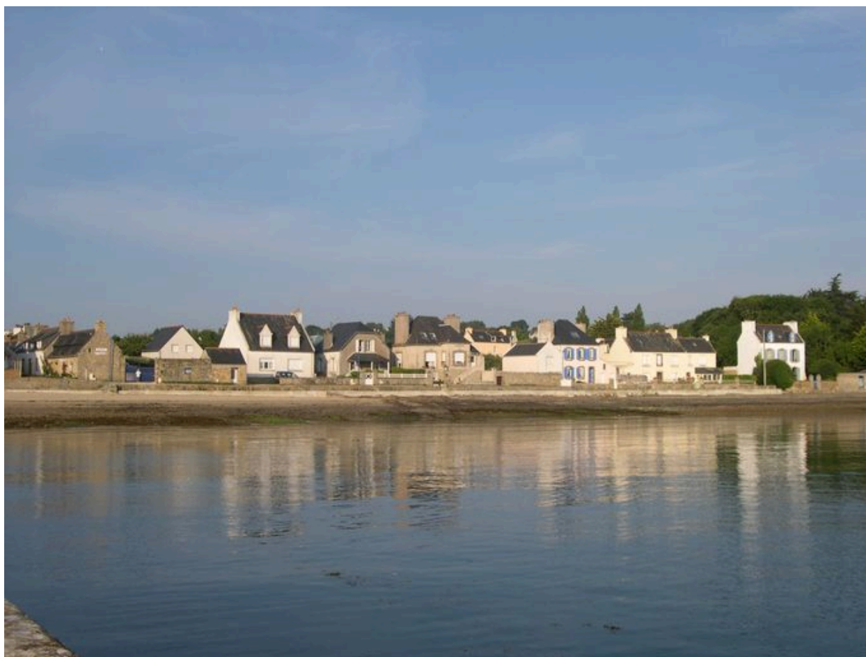
Vue générale du front résidentiel du Fret