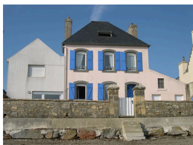
Maison Tertu IVR53_20062908580NUCA