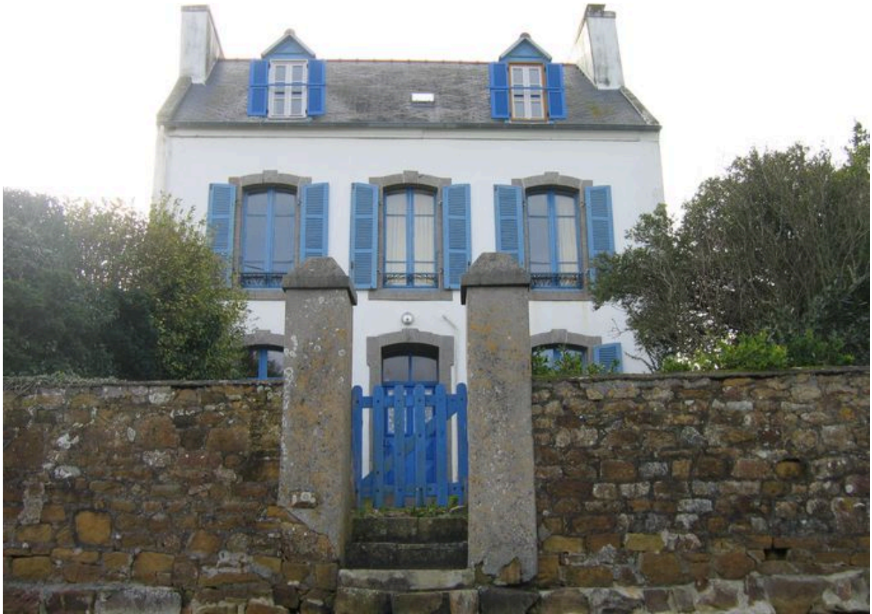
Villa du front résidentiel