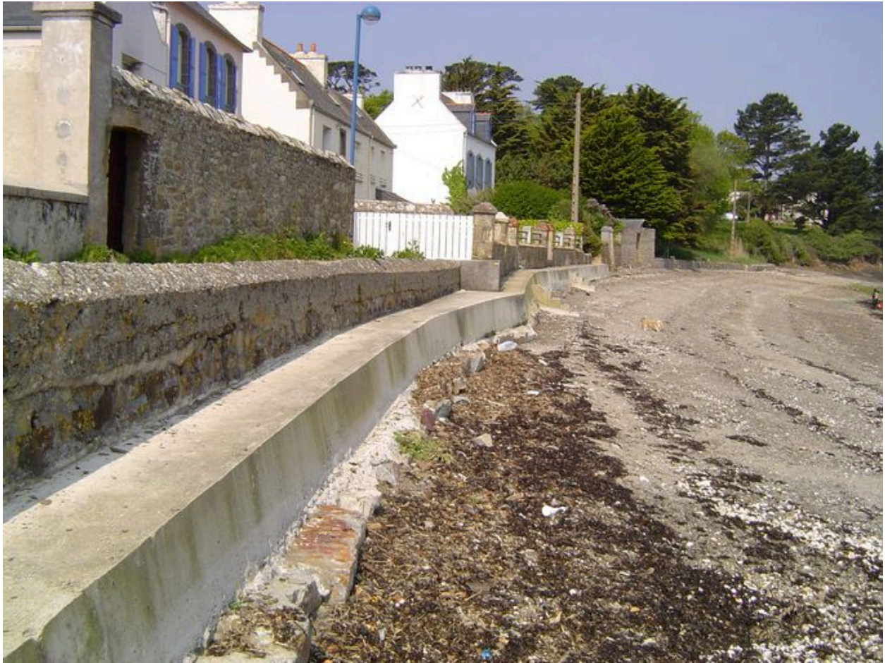
Digue et partie nord du front résidentiel