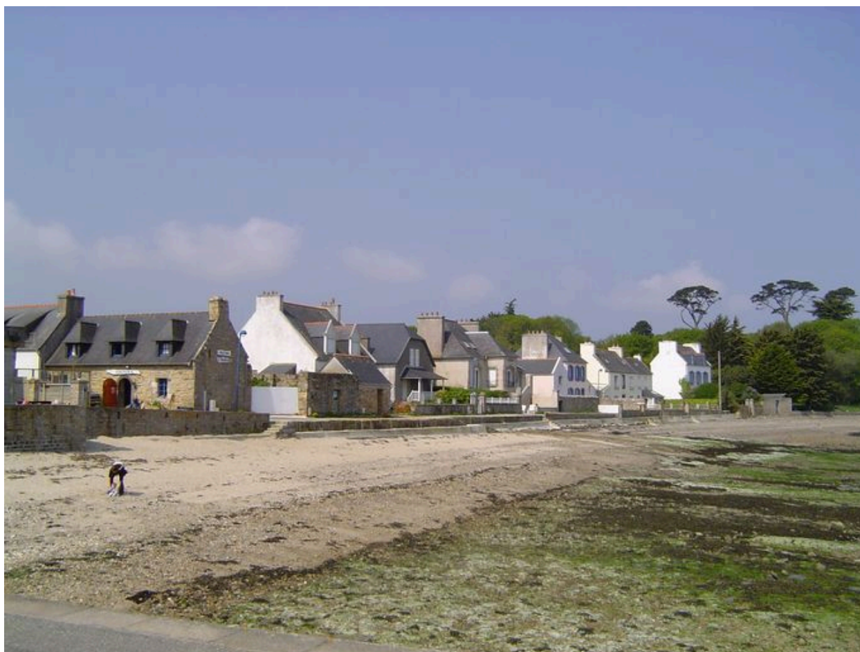
Vue latérale du front résidentiel du Fret