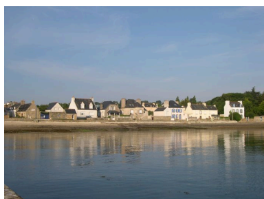
Vue générale du front résidentiel du Fret