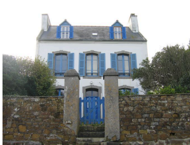
Villa du front résidentiel IVR53_20062908555NUCA