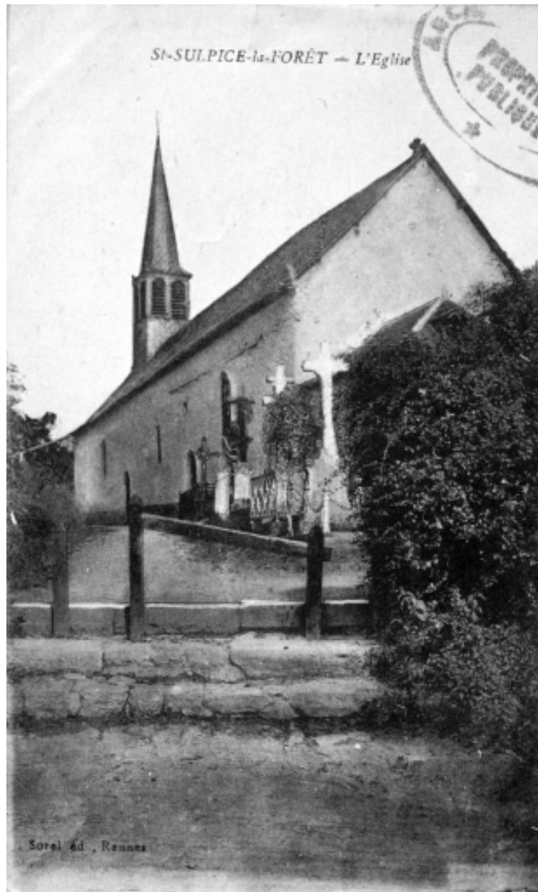
L'église sur une carte postale au début du 20e siècle : vue partielle sud-est