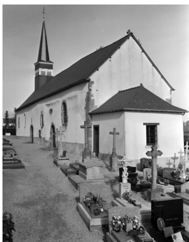
Elévation sud IVR53_19943500773X