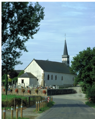
Vue de situation nord-est