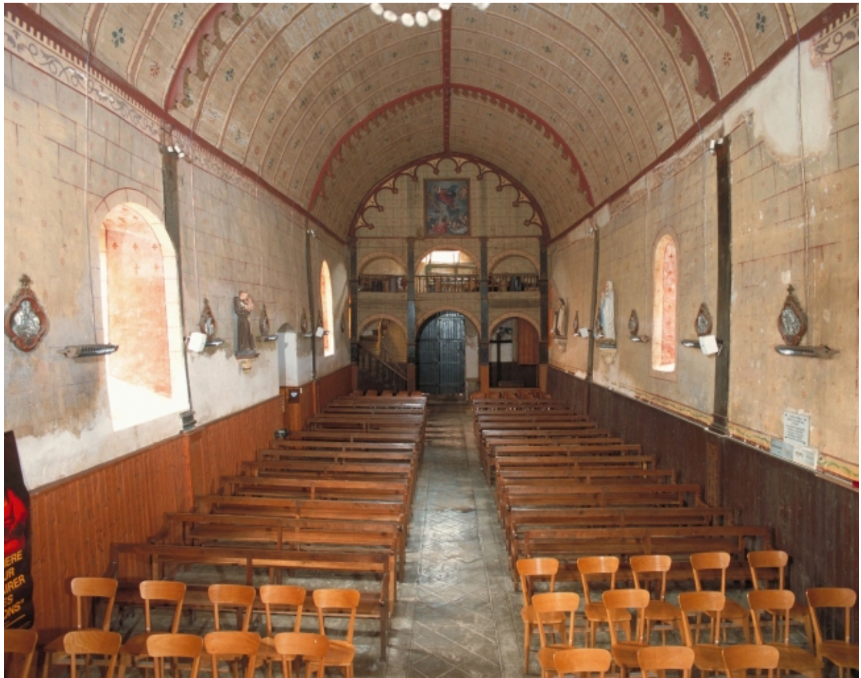
Vue intérieure prise du chœur vers la nef