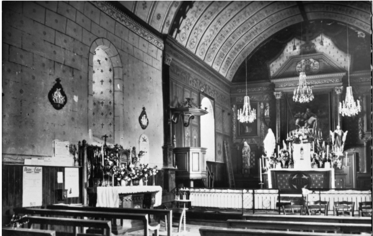
L'aménagement du chœur (carte postale, début 20e siècle)