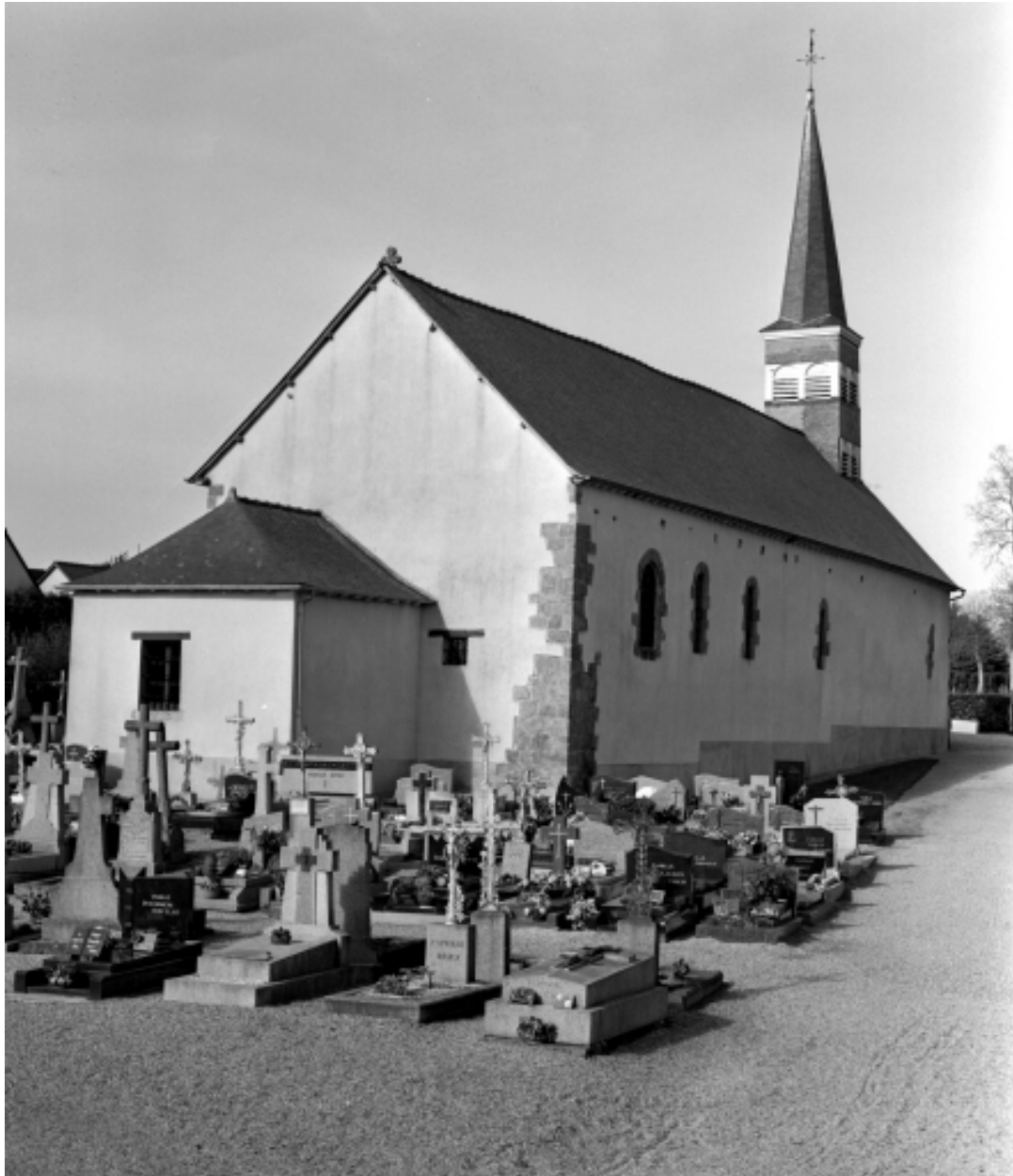
Elévation nord et sacristie accolée au chevet.