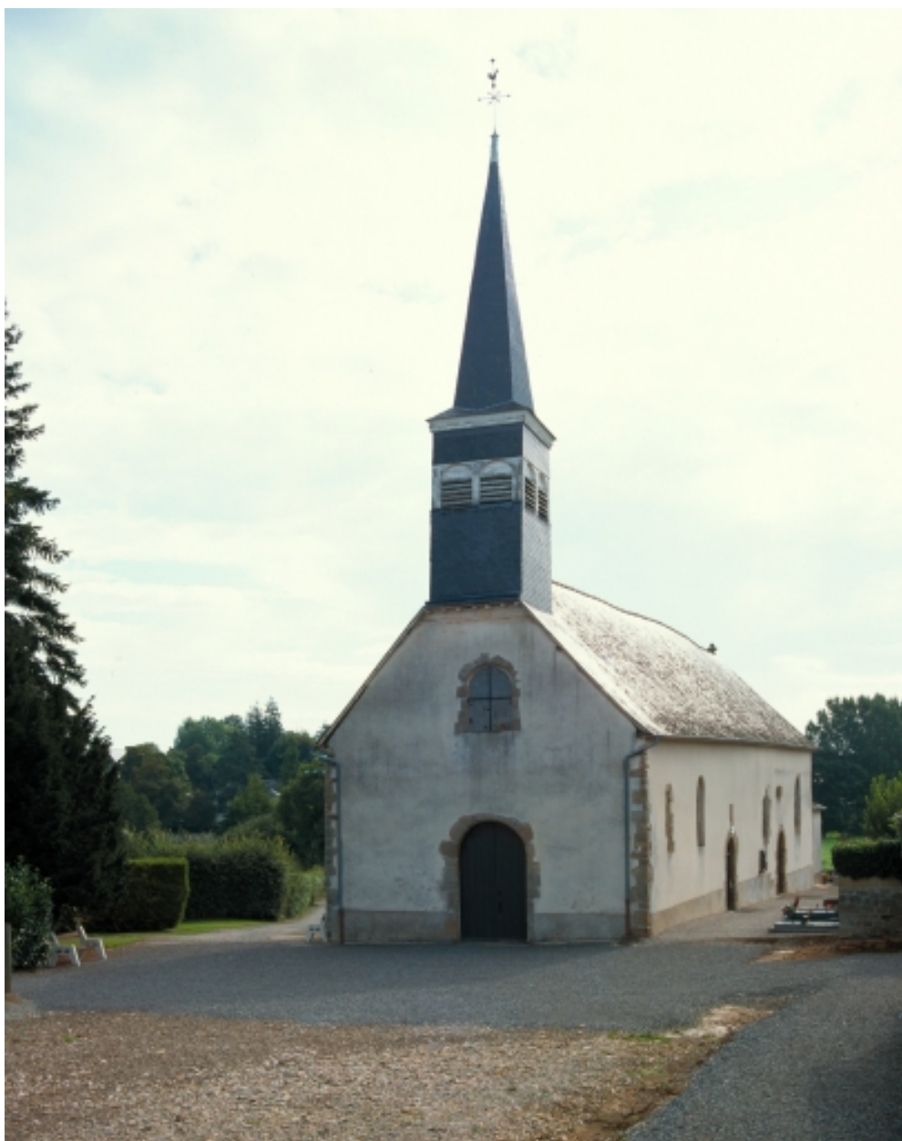
Vue générale sud-ouest