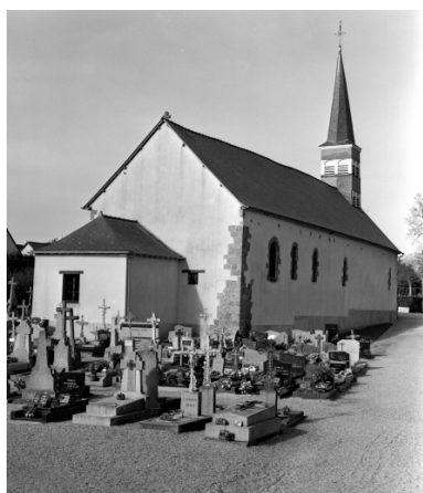
Elévation nord et sacristie accollée au chevet.