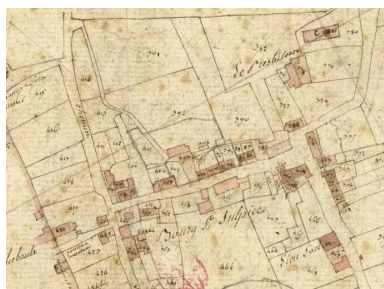
L'église sur le cadastre de 1826