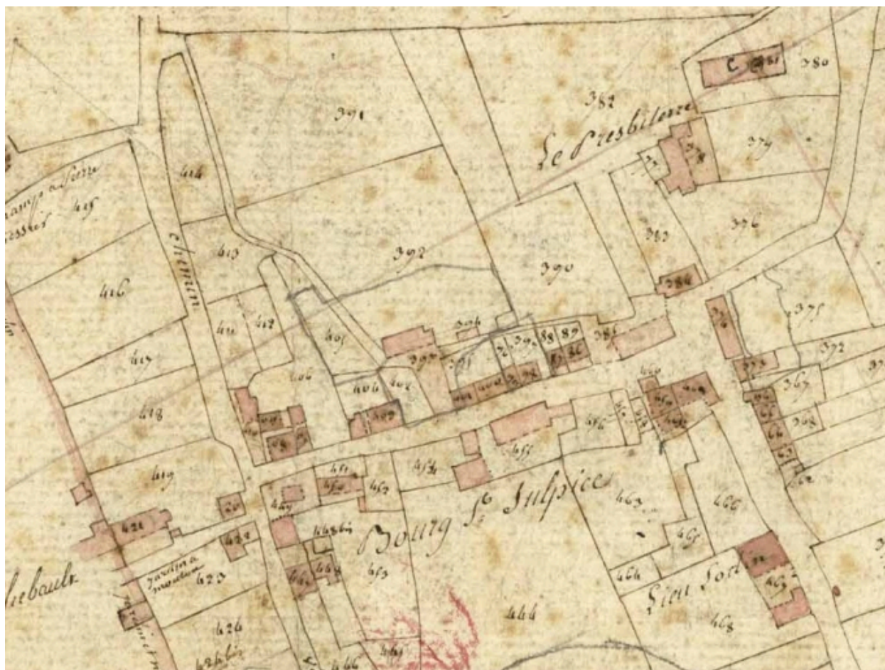
L'église sur le cadastre de 1826