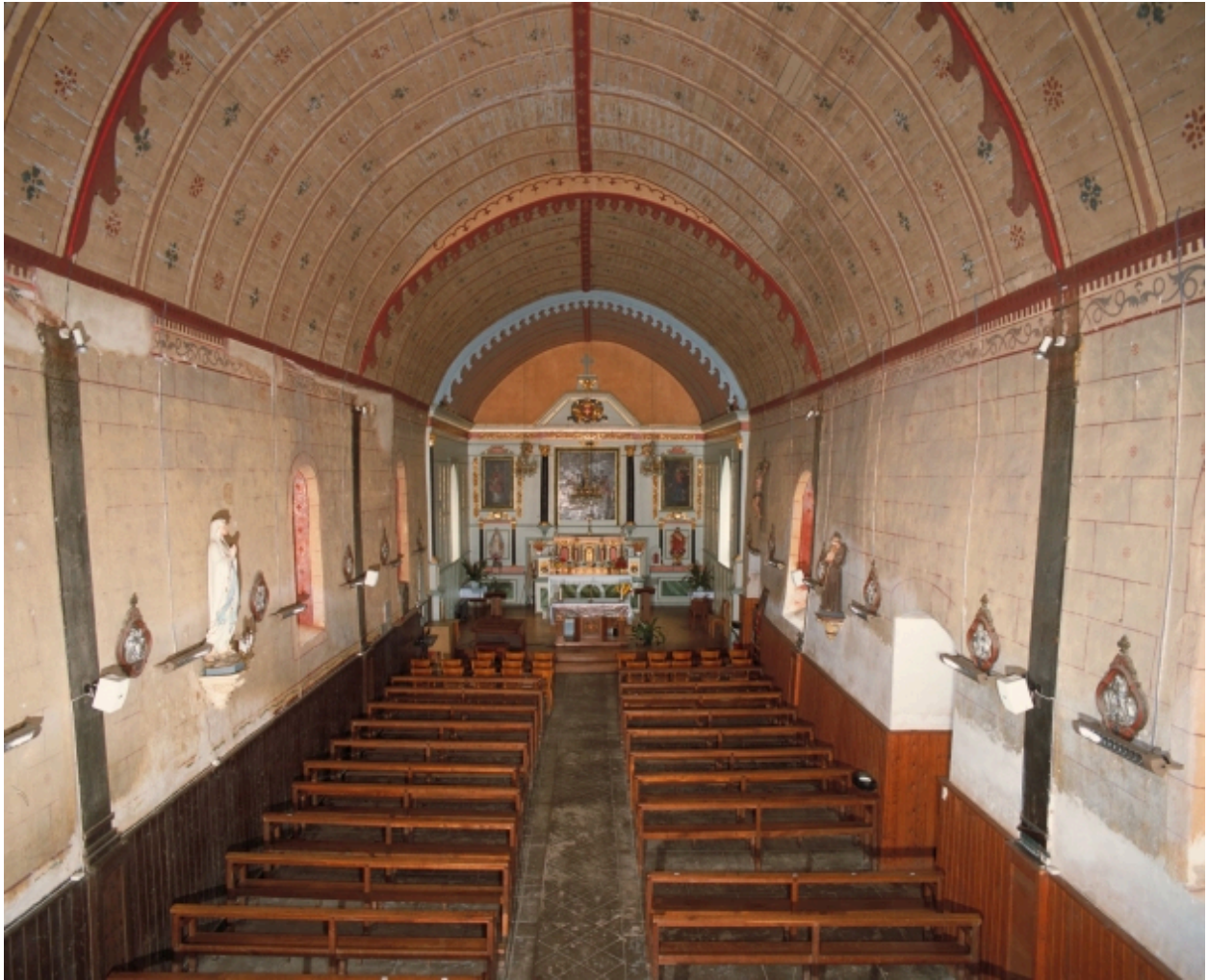
Vue intérieure prise de la nef vers le chœur