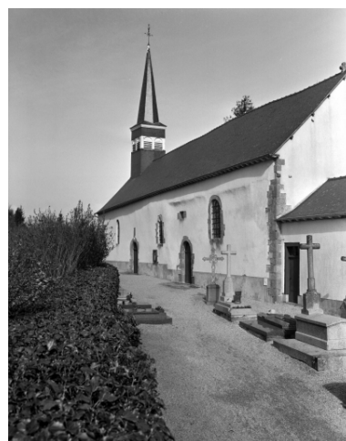
Elévation sud