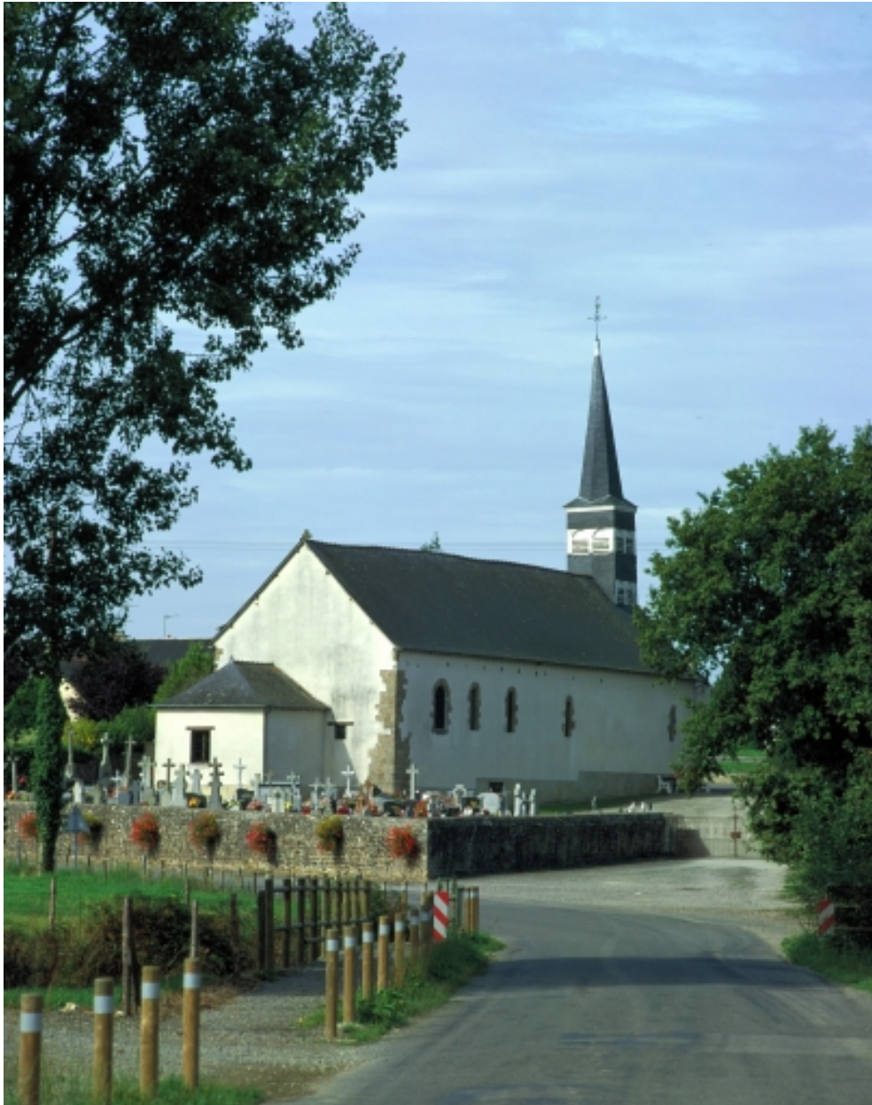
Vue de situation nord-est