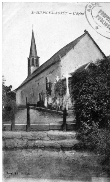
L'église sur une carte postale au début du 20e siècle : vue partielle sud-est