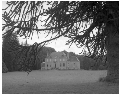
Vue générale est IVR53_19815600813X