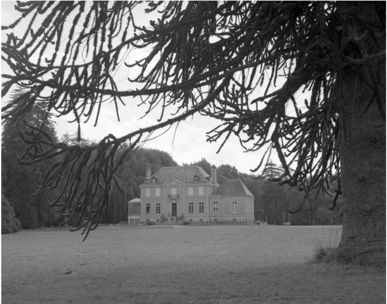
Vue générale est