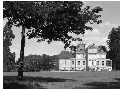
Vue générale ouest IVR53_19815600814X