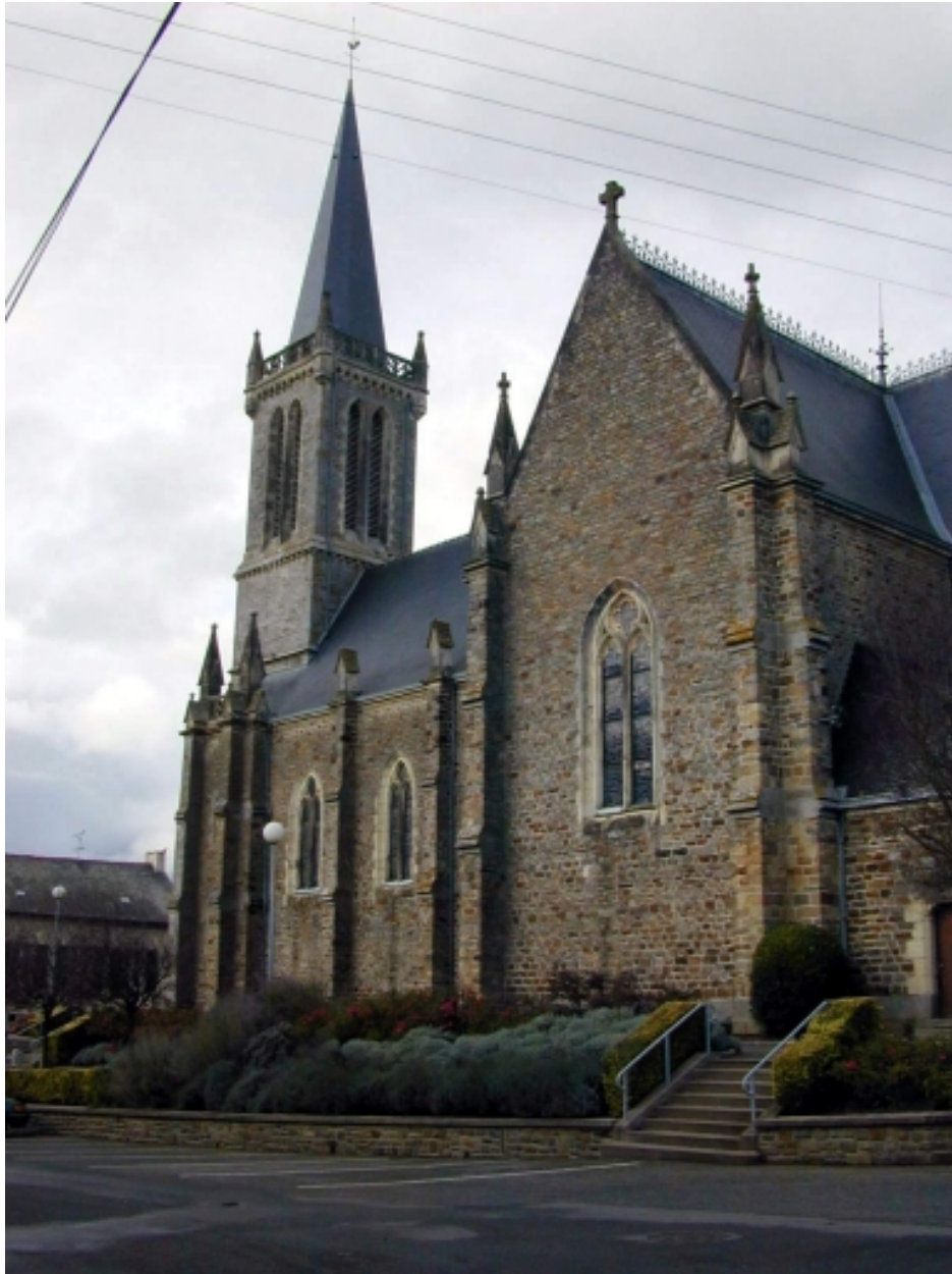
Vue partielle sud