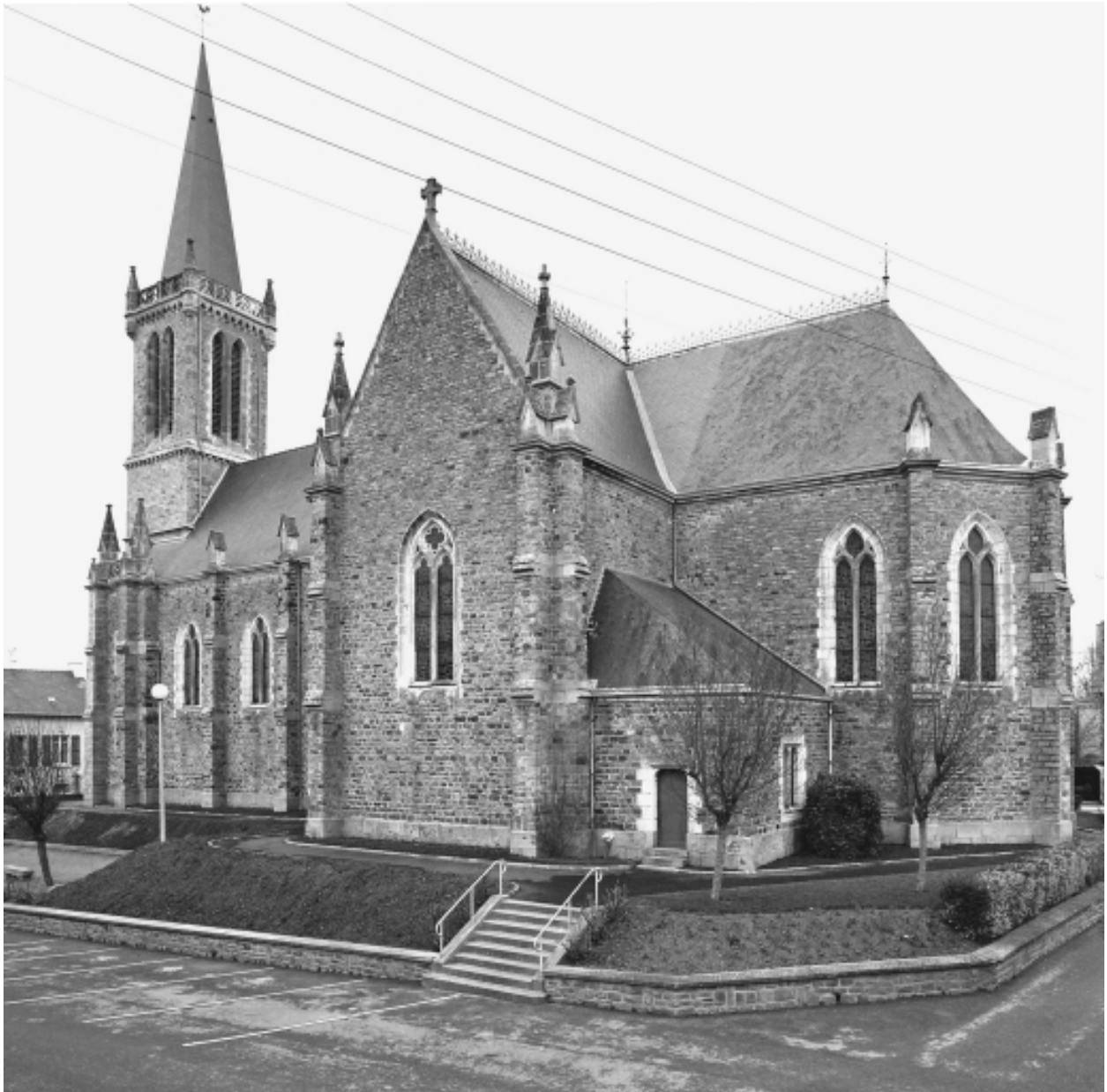
Elévation sud-est : vue générale