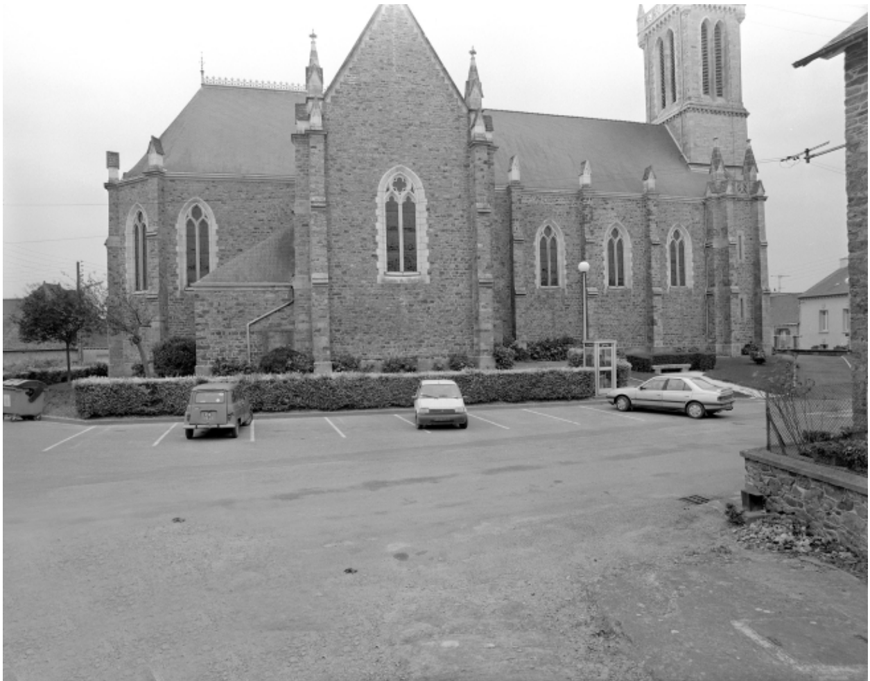
Elévation nord : vue générale