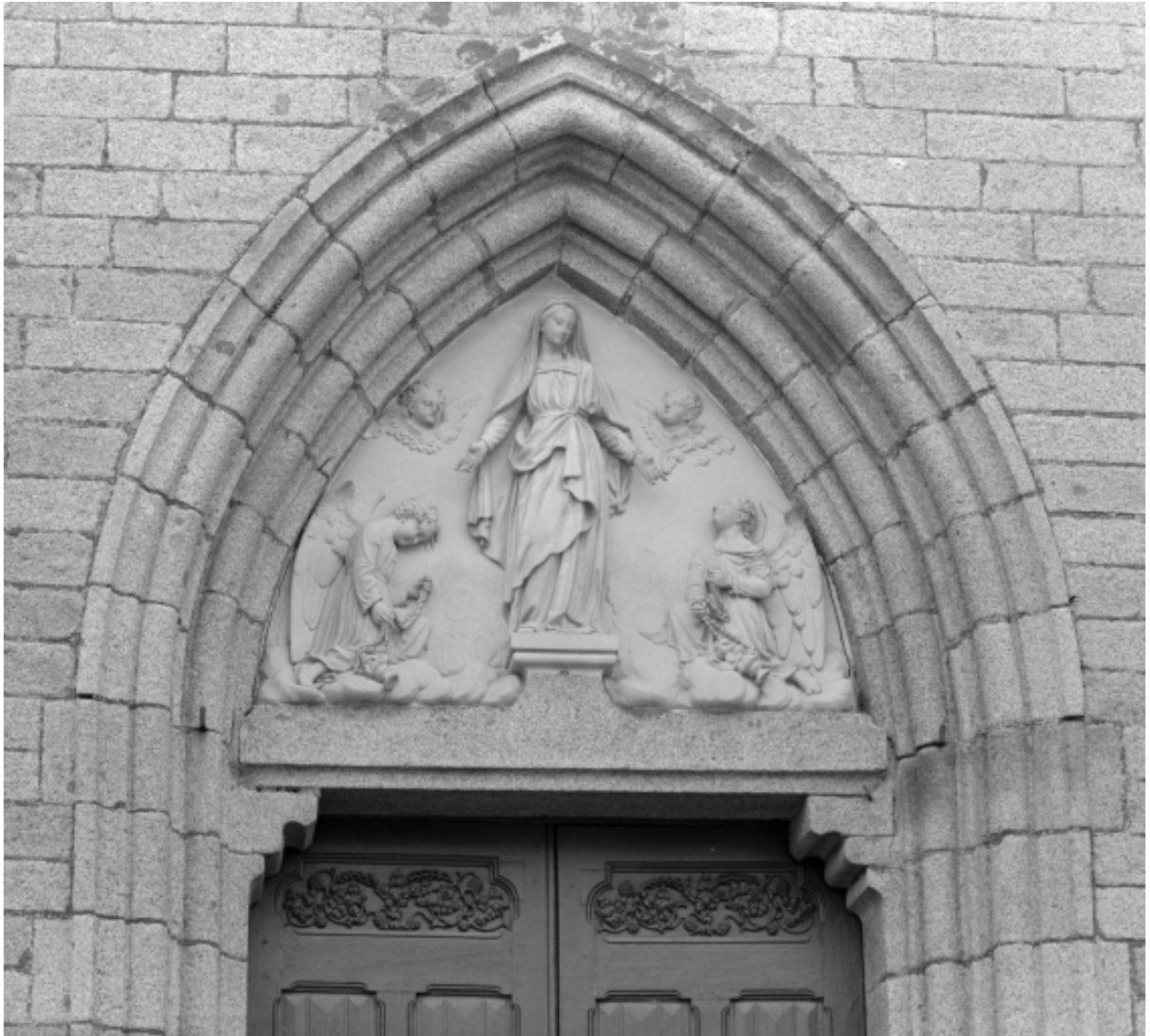
Elévation ouest, porte : détail du tympan