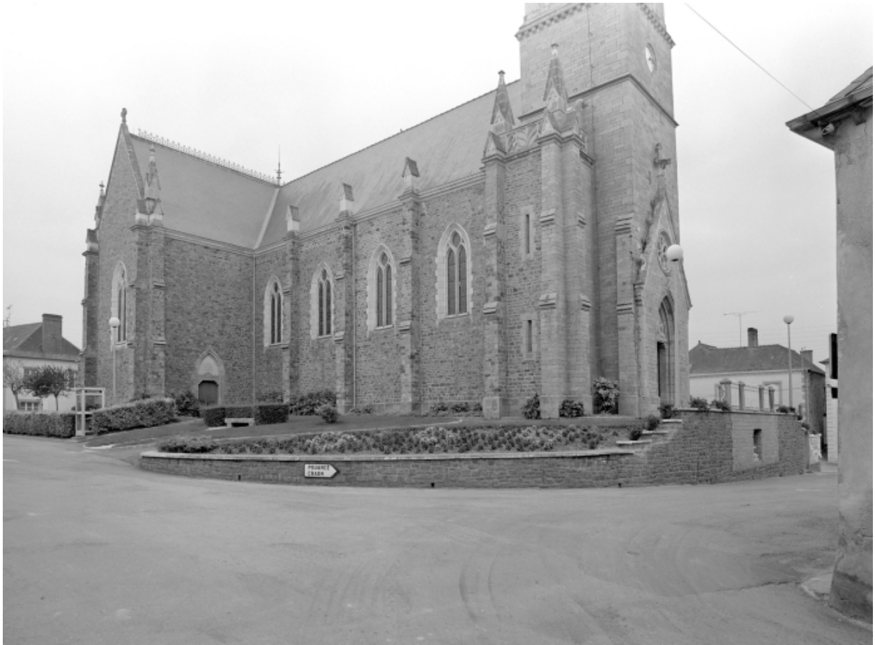
Elévation nord-ouest : vue générale