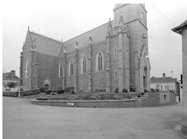
Elévation nord-ouest : vue générale IVR53_19933500445X