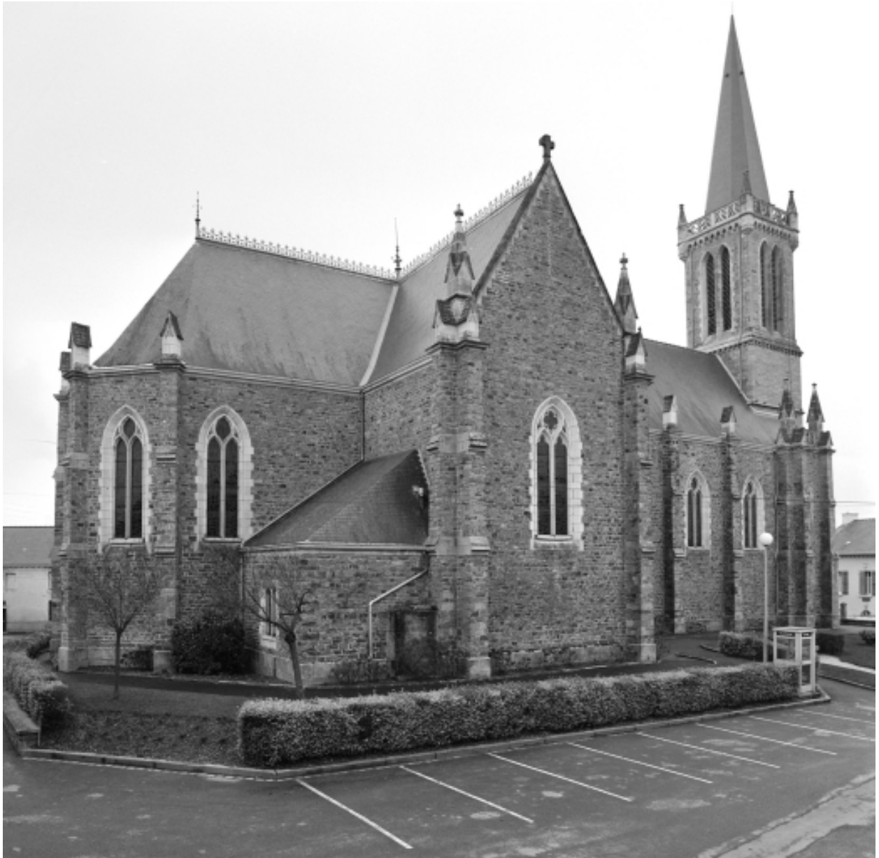
Elévation nord-est : vue générale