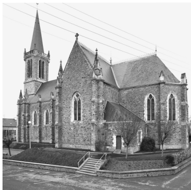
Elévation sud-est : vue générale IVR53_19933500443X