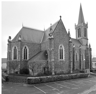
Elévation nord-est : vue générale IVR53_19933500442X