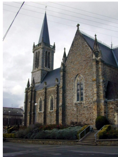
Vue partielle sud