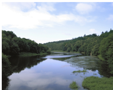
Vue de l'Arguenon prise du pont de Lorgeril IVR53_19982200620XA