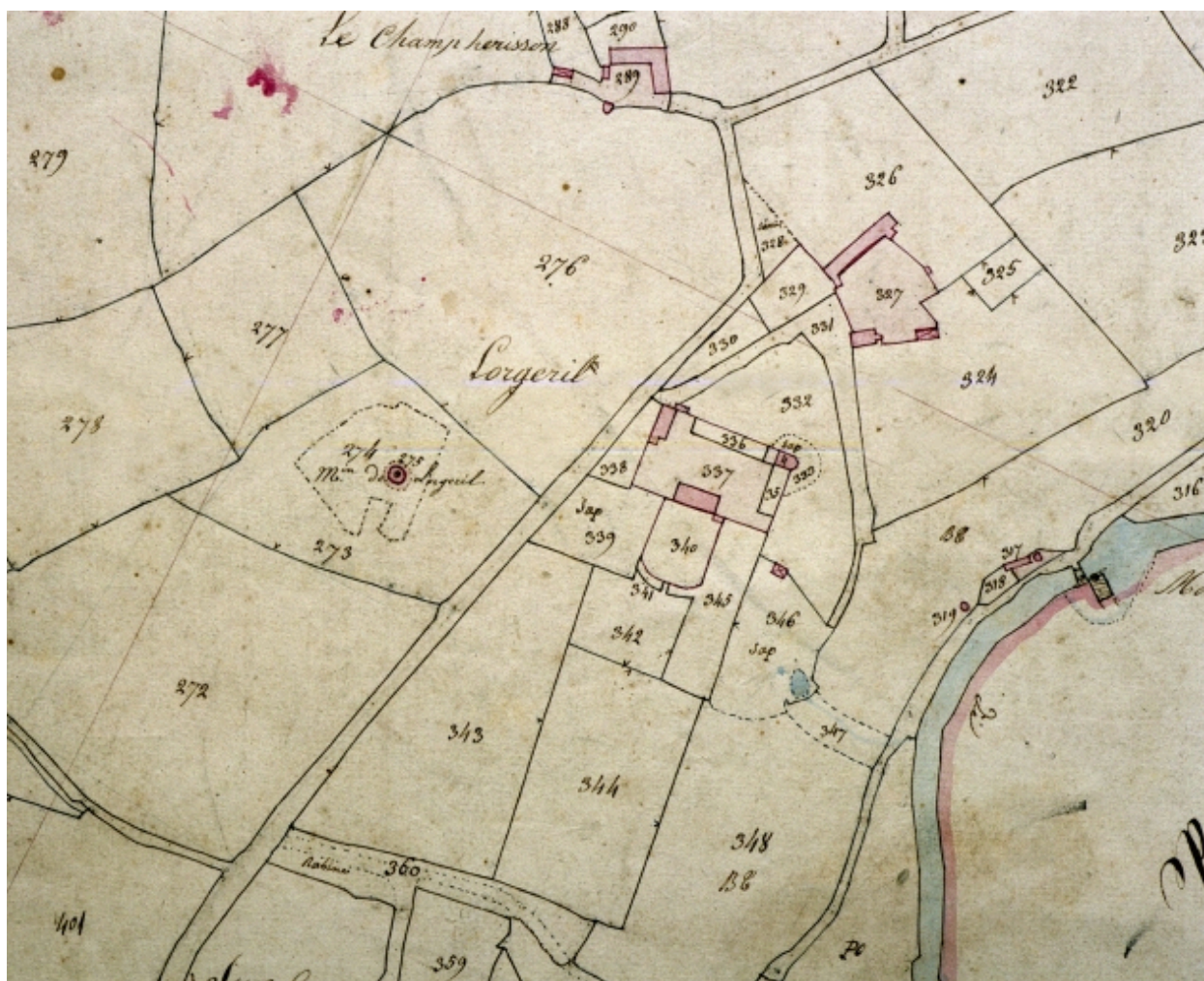
Extrait du cadastre de 1837