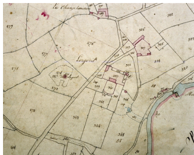
Extrait du cadastre de 1837