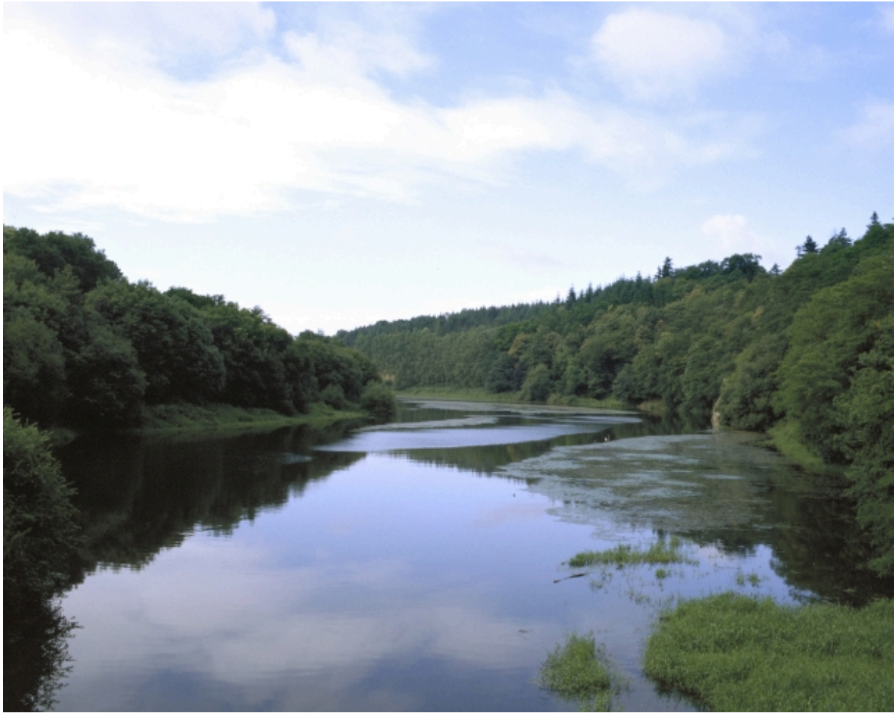
Vue de l'Arguenon prise du pont de Lorgeril