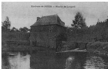
Repro. Carte postale : le moulin de Lorgeril sur l'Arguenon