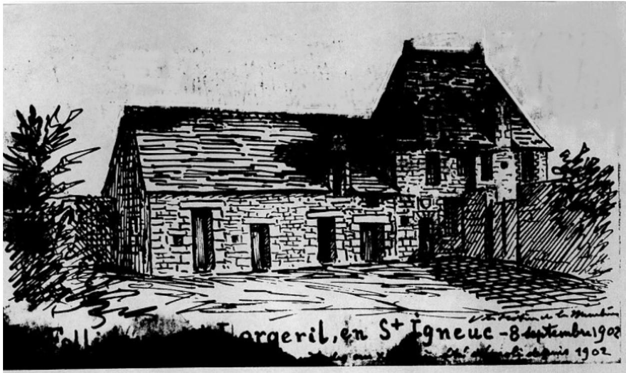
Repro. Dessin Frotier : vue du logis