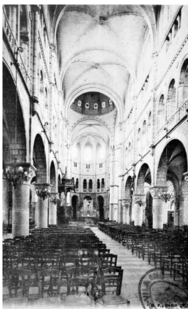
Intérieur : vue générale vers le chœur (Carte postale ancienne, AD35 : 6Fi)