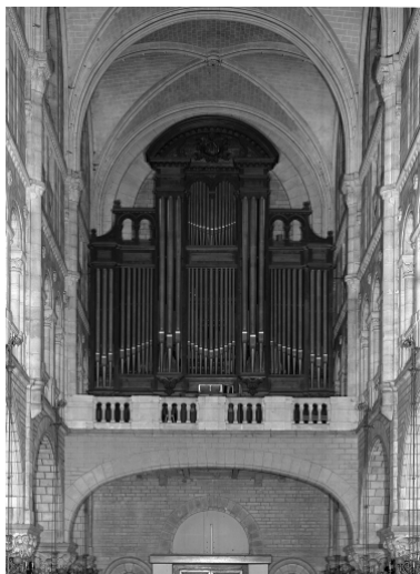
Grand orgue situé en tribune au bas de la nef.