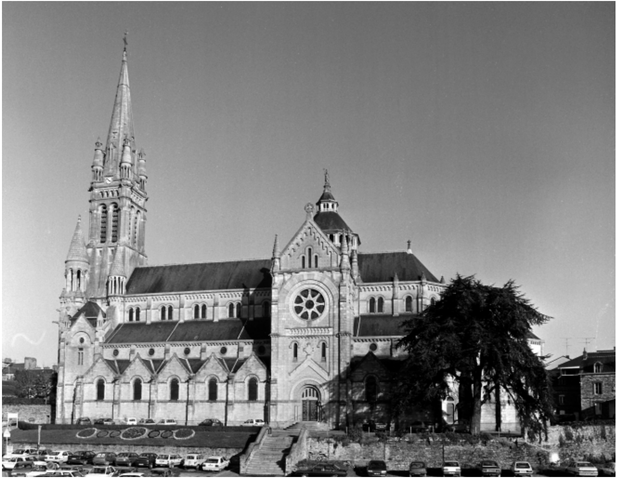
Elévation Sud : vue générale.