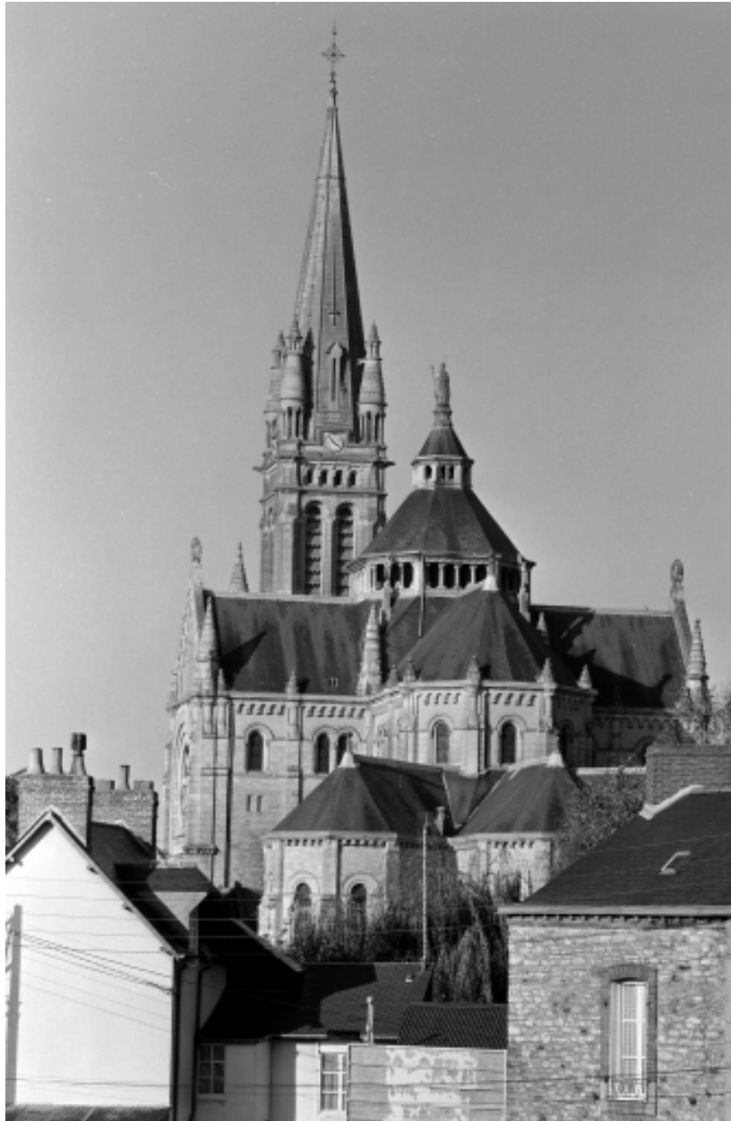
Elévation Est : vue générale.