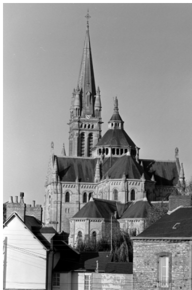
Elévation Est : vue générale. IVR53_19943502186X