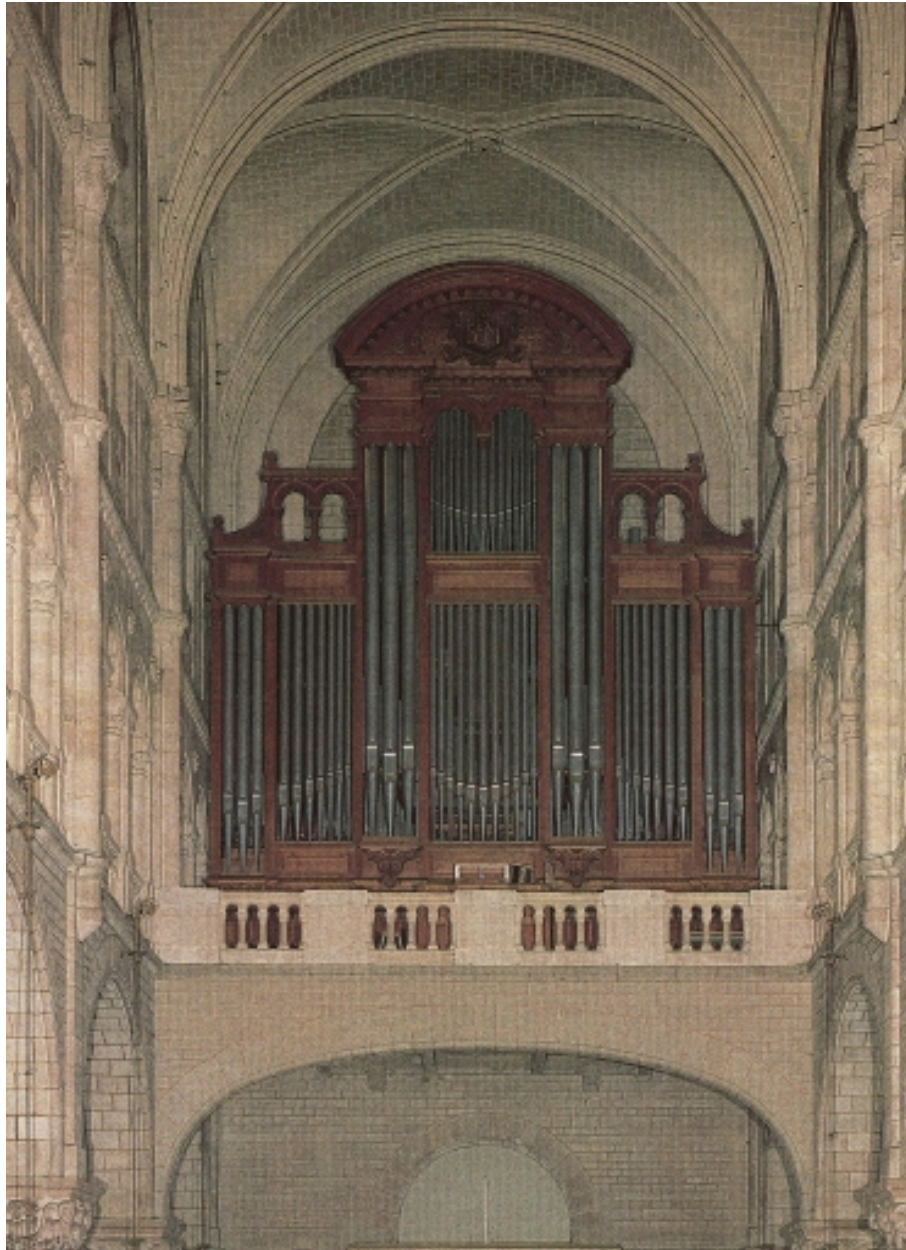
Grand orgue situé en tribune au bas de la nef.