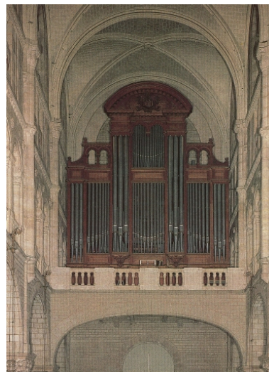
Grand orgue situé en tribune au bas de la nef. IVR53_19873500072VA