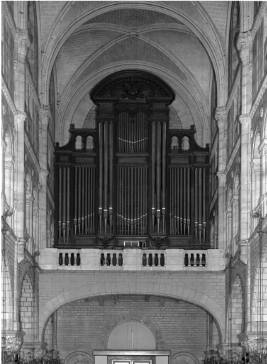
Grand orgue situé en tribune au bas de la nef.