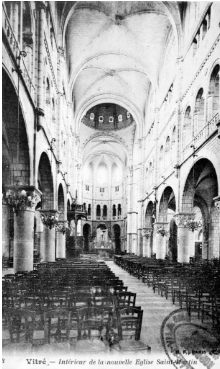
Intérieur : vue générale vers le chœur (Carte postale ancienne, AD35 : 6Fi)