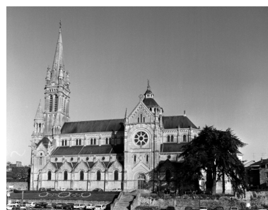
Elévation Sud : vue générale.