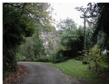
Vue du sentier avec l'ancien calvaire qui mène au parc