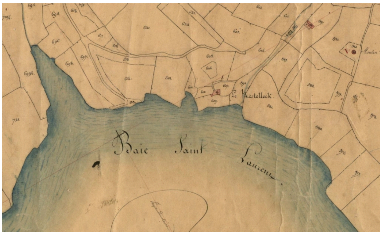
Extrait du cadastre de 1834 : la baie de Saint-Laurent (AD 22)