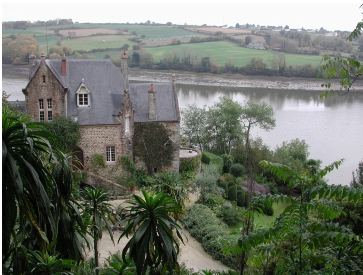
Le jardin et le manoir du kestellic : un belvédère sur l'estuaire