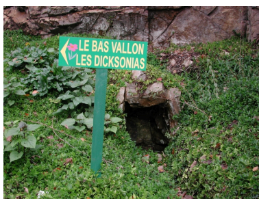
Vers le bas vallon