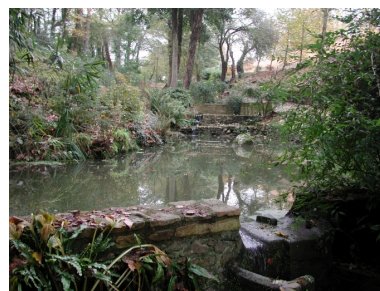
Le plan d'eau du parc IVR53_20082209061NUCA