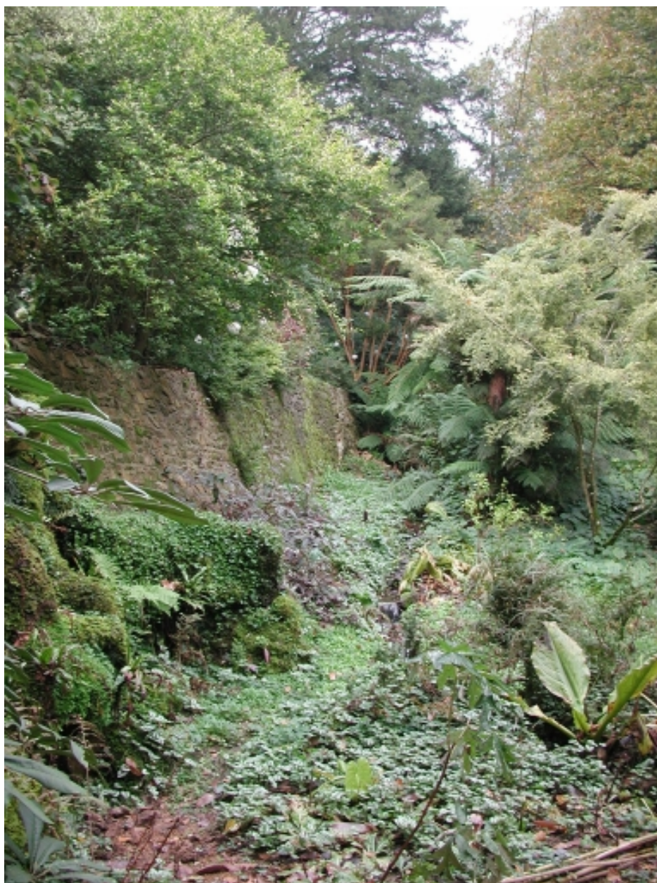
Vue d'un mur de soutènement et de la végétation adaptée