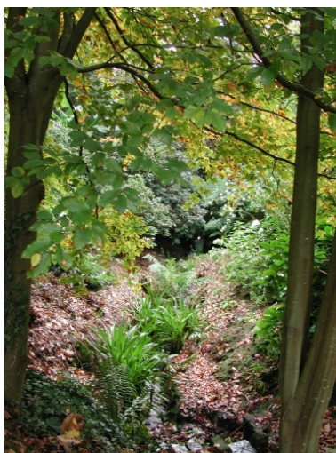
La végétation de sous-bois