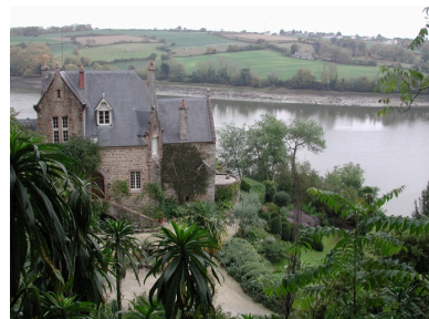
Le jardin et le manoir du kestelllic : un belvédère sur l'estuaire