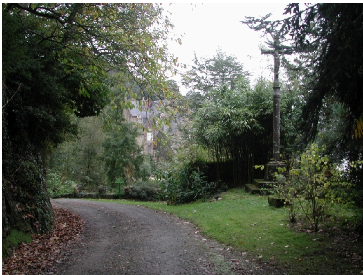
Vue du sentier avec l'ancien calvaire qui mène au parc