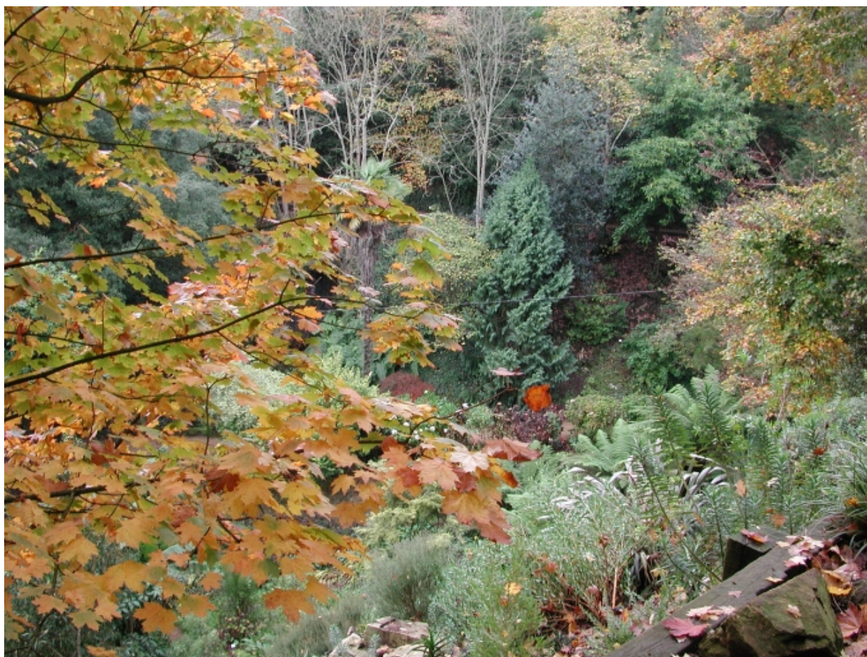
Plantes de sous-bois dans un petit vallon aménagé