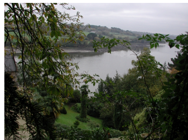
Le jardin et l'anse de Saint-Laurent