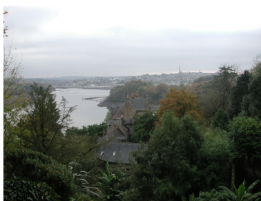
Vue du manoir du Kestelllic caché par la végétation, devant l'estuaire