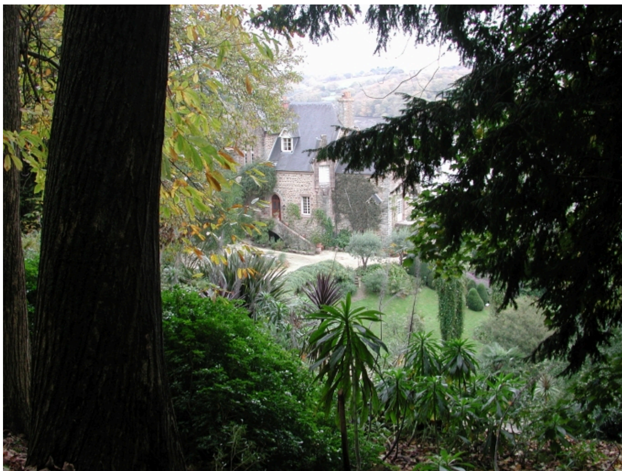
Vue du manoir privé du kestellic dans son écrin de verdure