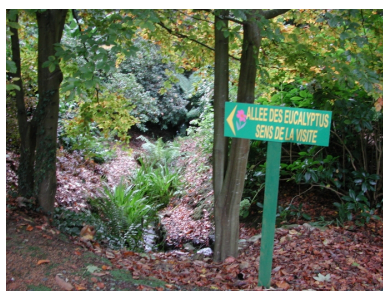
Vue générale IVR53_20082209006NUCA