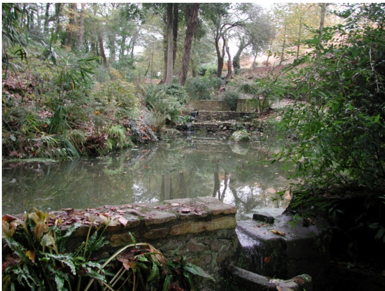
Le plan d'eau du parc