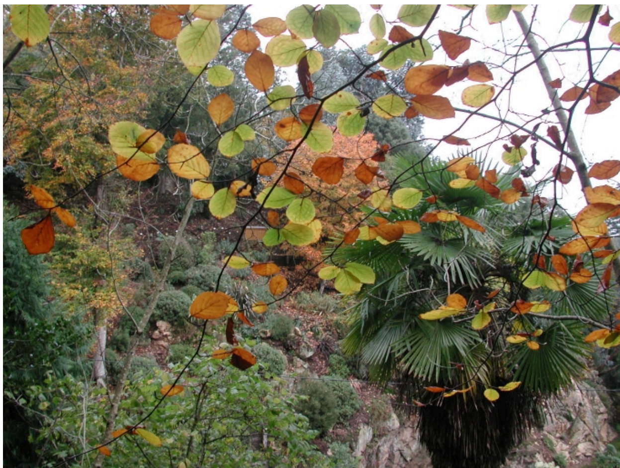
Le parc du Kestellic : une palette de couleurs dans un théâtre de verdure