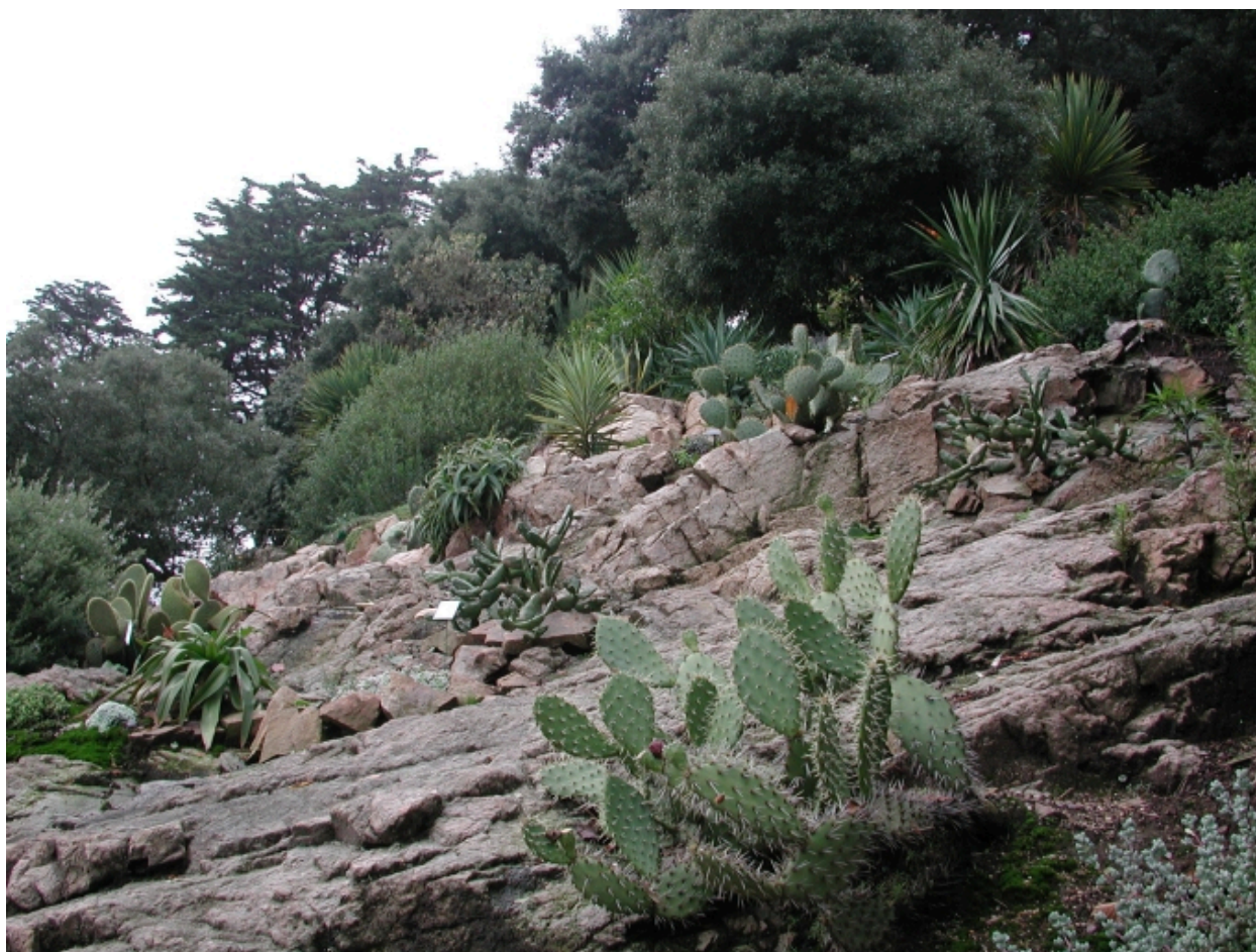
Plantes grasses de rocaille