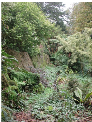
Vue d'un mur de soutènement et de la végétation adaptée