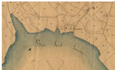
Extrait du cadastre de 1834 : la baie de Saint-Laurent (AD 22)