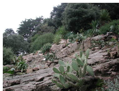
Plantes grasses de rocaille