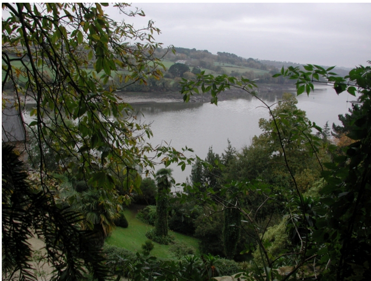
Le jardin et l'anse de Saint-Laurent