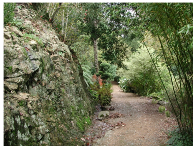
Vue de l'un des sentiers de visite et de découverte du parc