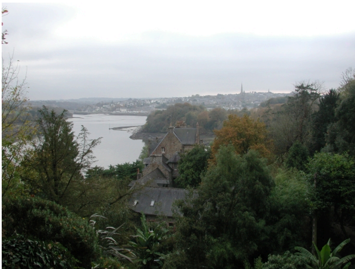
Vue du manoir du Kestellic caché par la végétation, devant l'estuaire