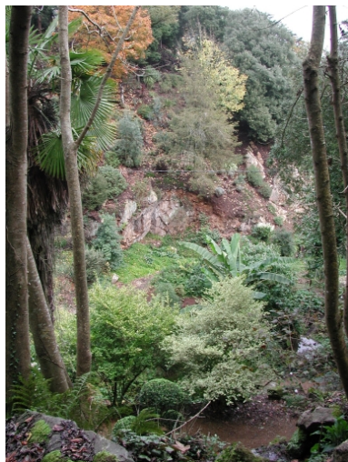
Le jardin de rocaille