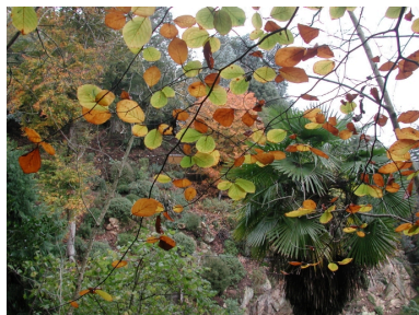
Le parc du Kestelllic : une palette de couleurs dans un théâtre de verdure