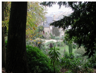
Vue du manoir privé du kestelllic dans son écrin de verdure