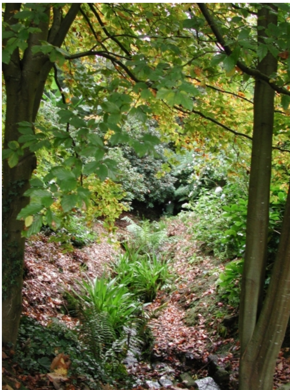
La végétation de sous-bois