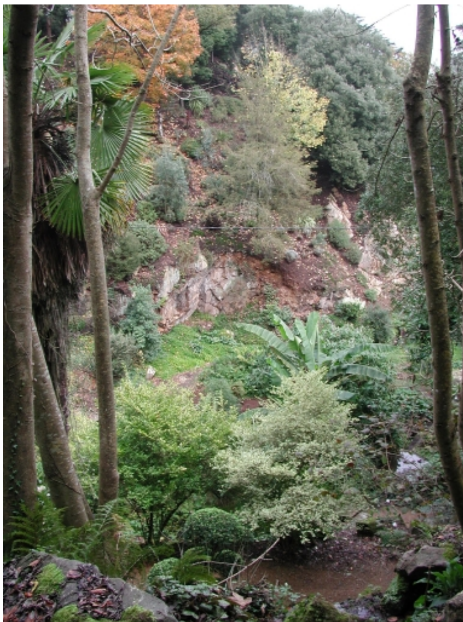
Le jardin de rocaille