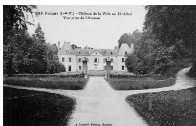
Fonds Lagrée - Carte postale ancienne. 1919 - Irodouër (I.-et-V.) - Château de la Ville au Sénéchal, vue prise de l'avenue.

Repro. Guy Artur, Repro. Norbert Lambart, Autr. Alexandre Lamiré IVR53_19883500312XB