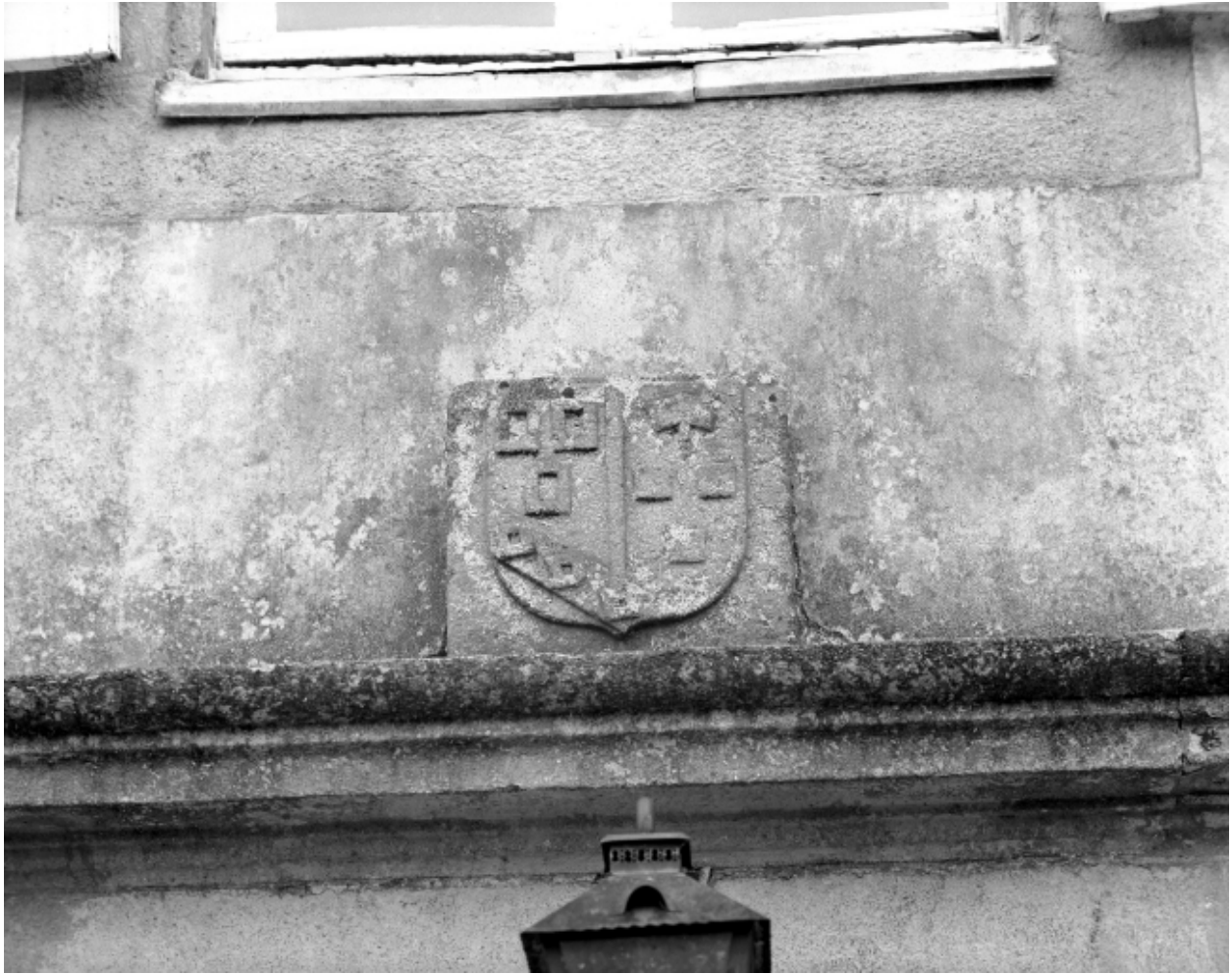
Façade antérieure, vue de détail des armoiries.