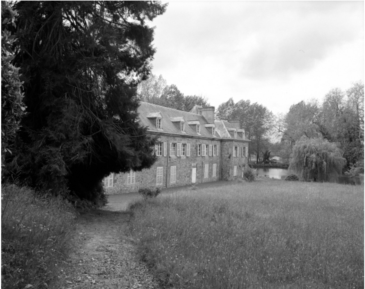
Façade postérieure, vue générale nord-est.