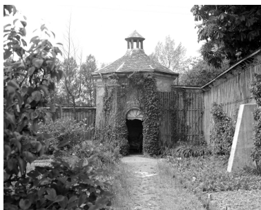
Colombier et murs en terre du jardin

IVR53_19853501961X