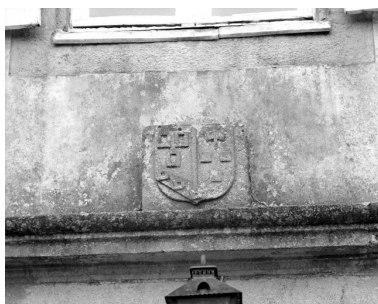
Façade antérieure, vue de détail des armoiries.

IVR53_19853501962X