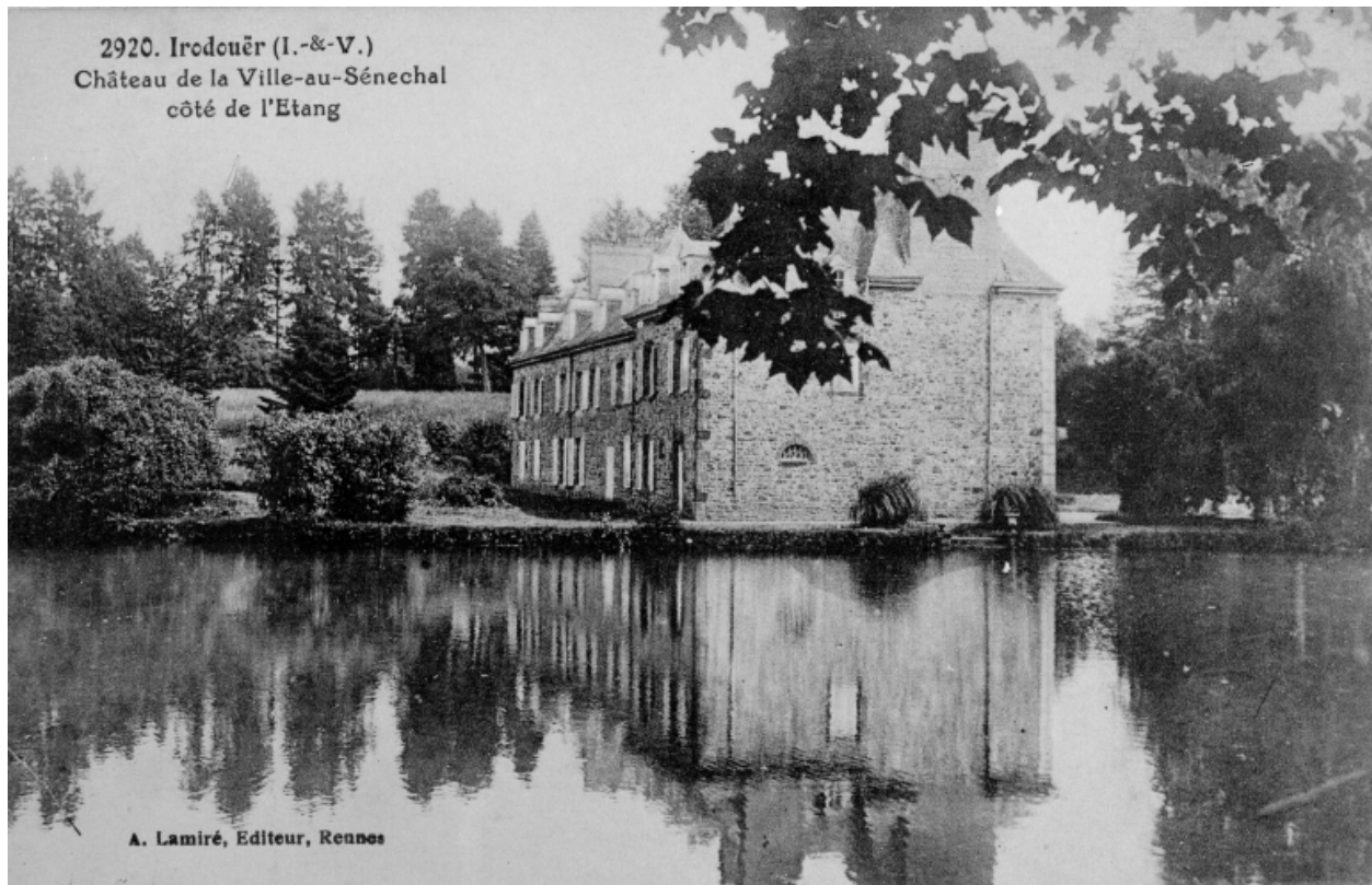
Fonds Lagrée - Carte postale ancienne. 2920 - Irodouër (I.-et-V.) - Le château de la Ville au Sénéchal, côté de l'étang.