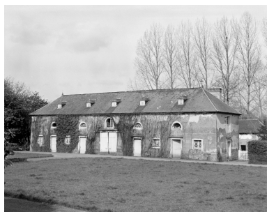
Vue générale de l'un des bâtiments des communs en terre

IVR53_19853501960X