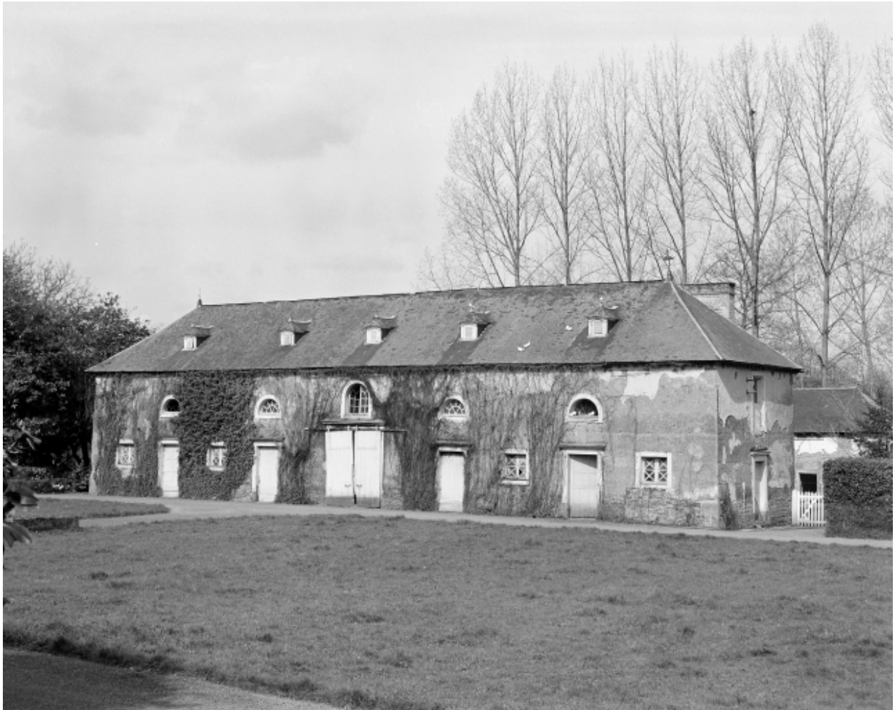
Vue générale de l'un des bâtiments des communs en terre