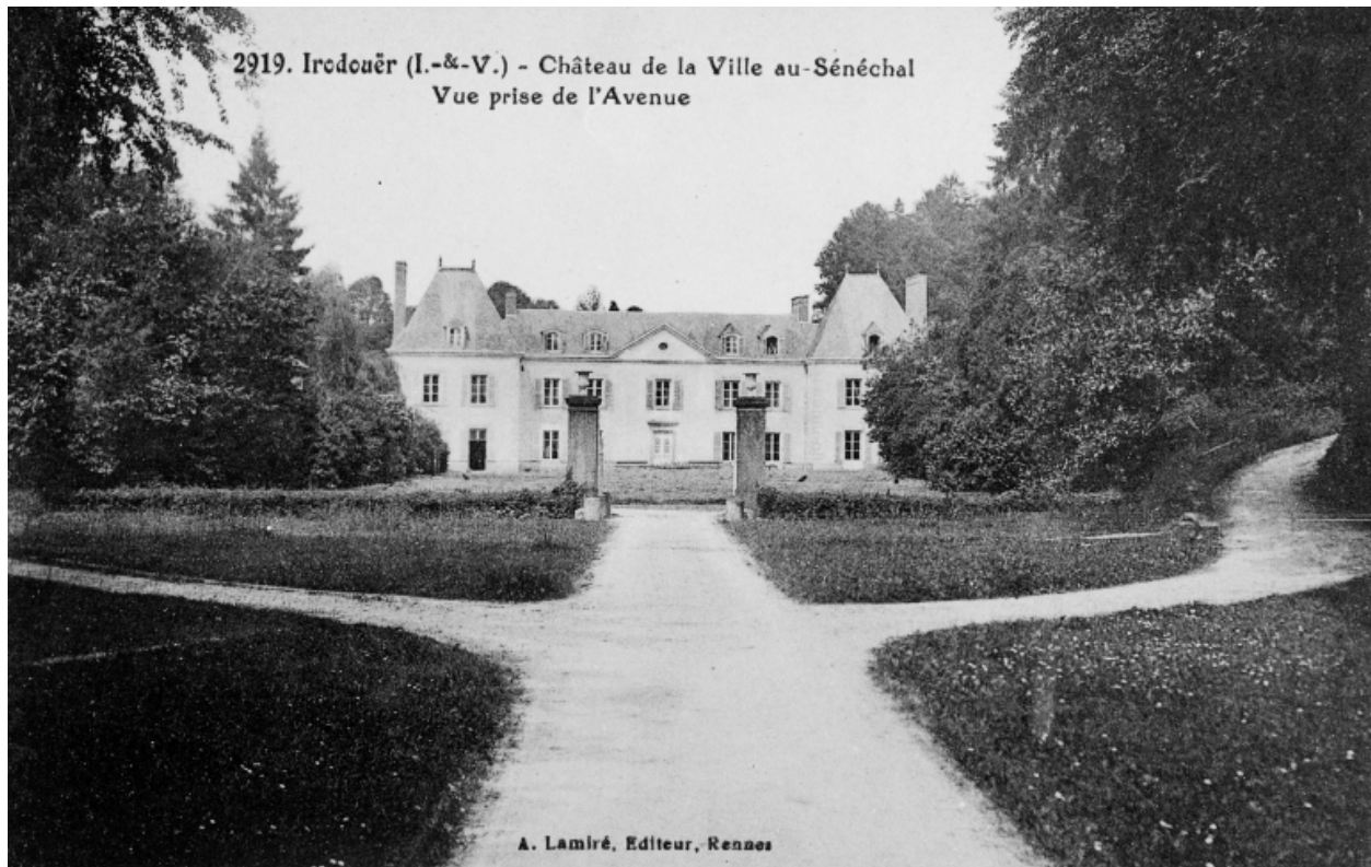
Fonds Lagrée - Carte postale ancienne. 2919 - Irodouër (I.-et-V.) - Château de la Ville au Sénéchal, vue prise de l'avenue.