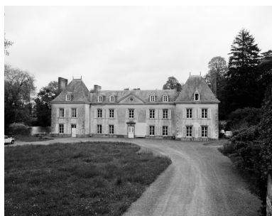
Façade antérieure, vue générale.

Autr. Alexandre Lamiré IVR53_19883500314X