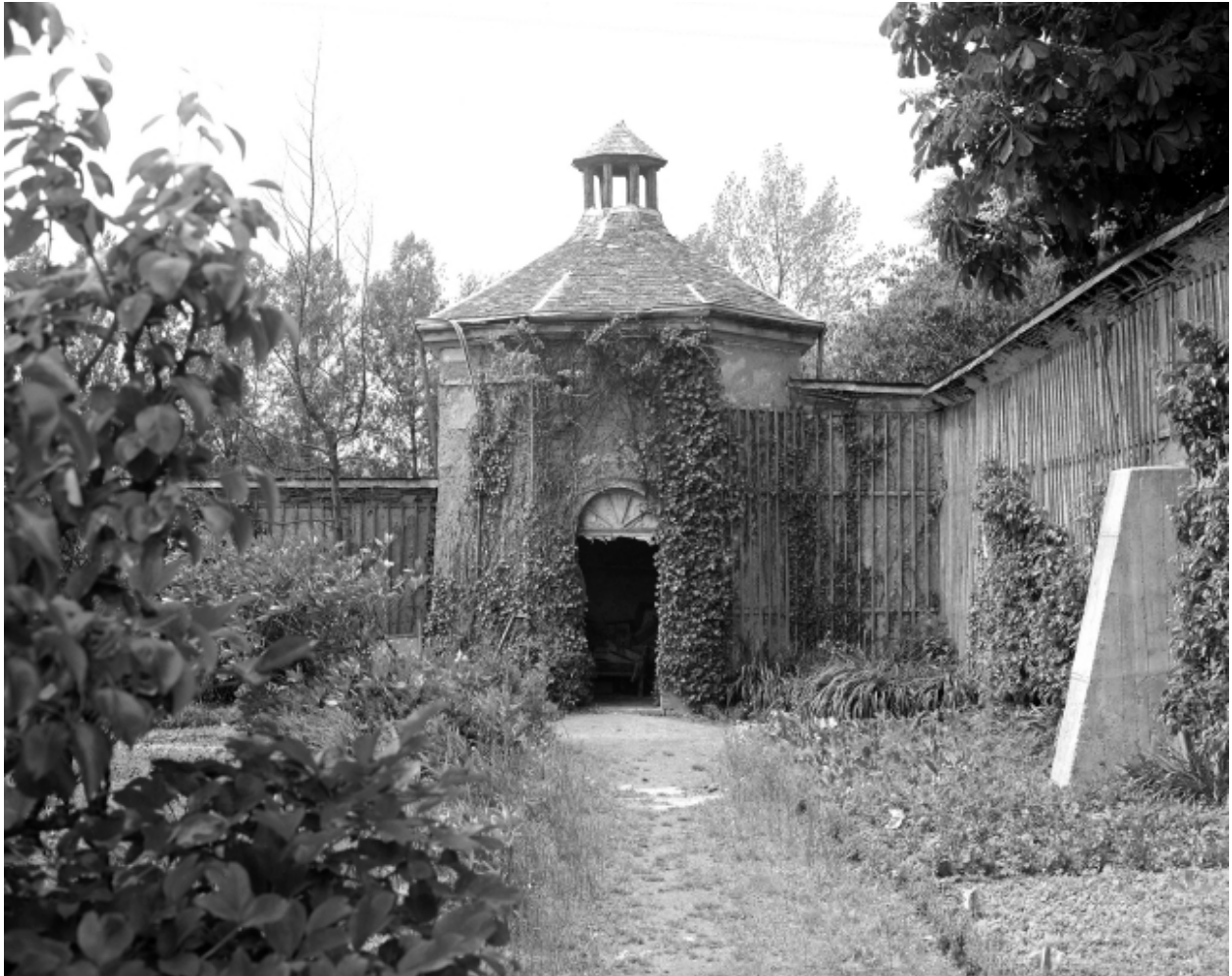
Colombier et murs en terre du jardin