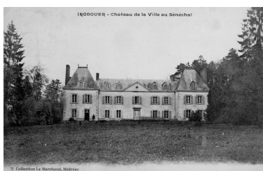
Fonds Lagrée - Carte postale ancienne. Irodouër - Château de la Ville au Sénéchal.

Repro. Guy Artur, Repro. Norbert Lambart, Autr. Alexandre Lamiré IVR53_19883500312XB