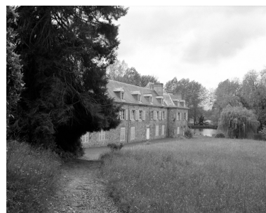
Façade postérieure, vue générale nord-est.

IVR53_19853501963X