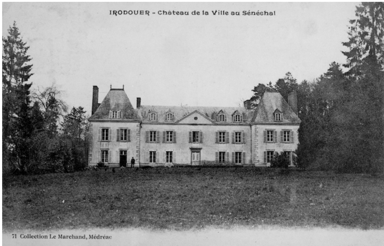
Carte postale ancienne. Irodouër - Château de la Ville au Sénéchal.