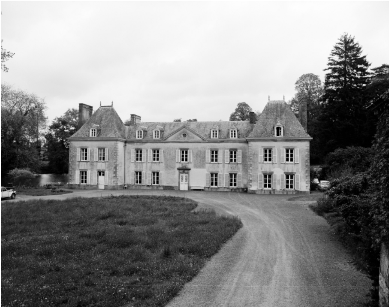
Façade antérieure, vue générale.