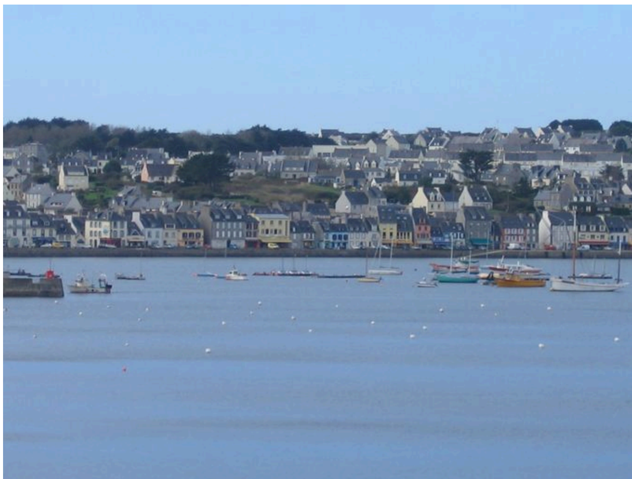
Front portuaire Toudouze