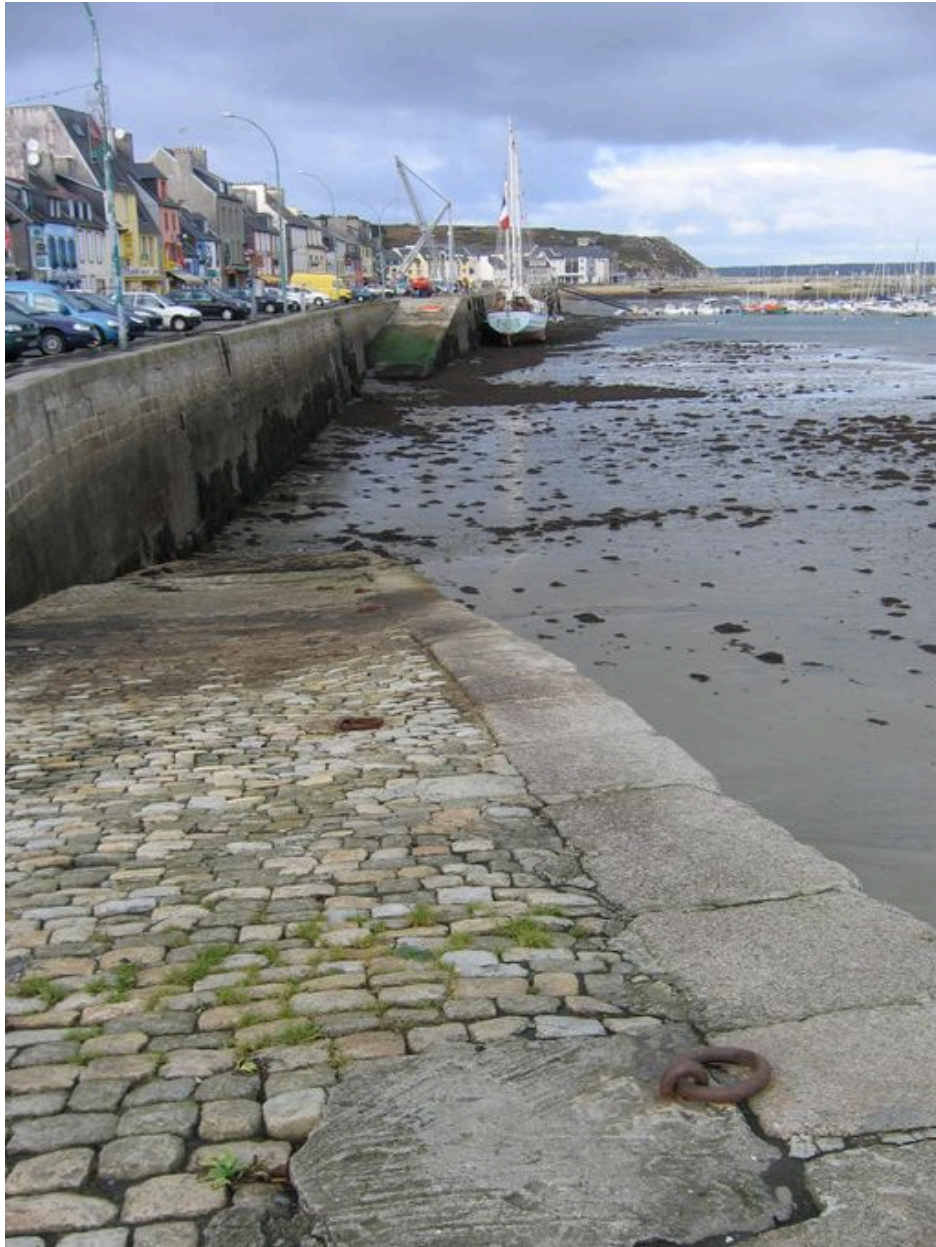
Vue d'une cale et du quai Toudouze