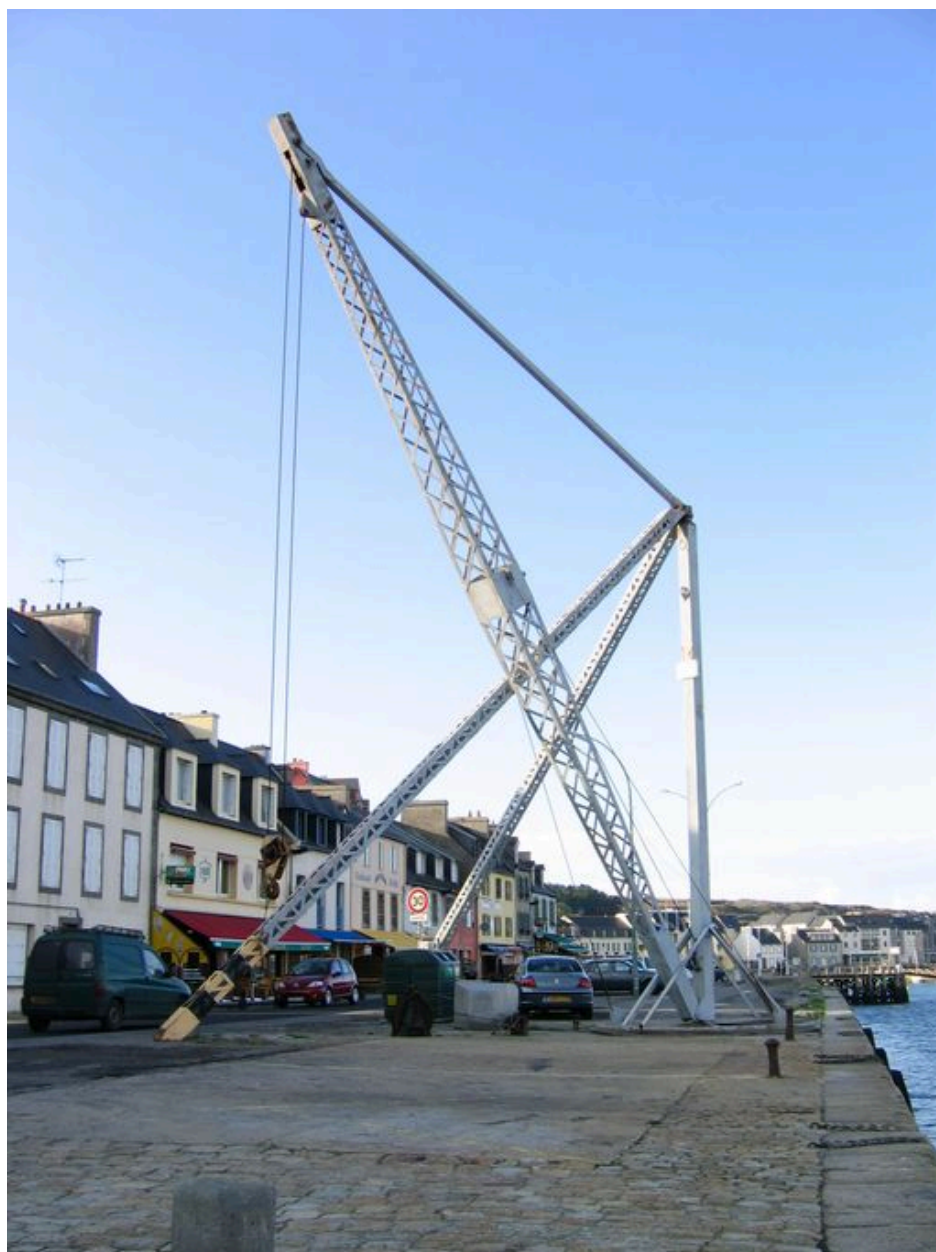
Grue à mâter et de levage sur le quai Toudouze