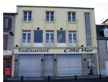
Restaurant Côté Mer IVR53_20062908340NUCA