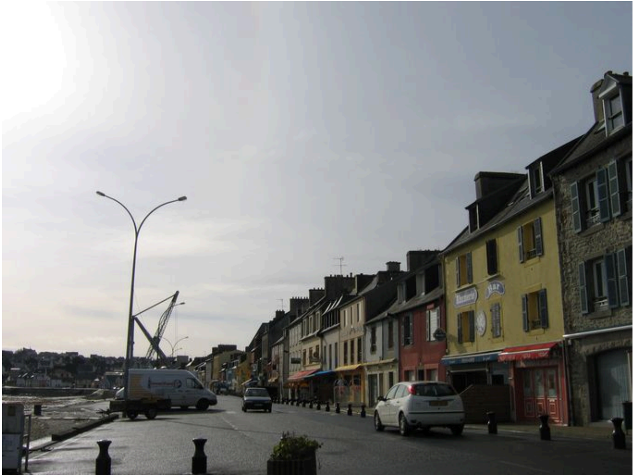
Vue générale du front portuaire Toudouze