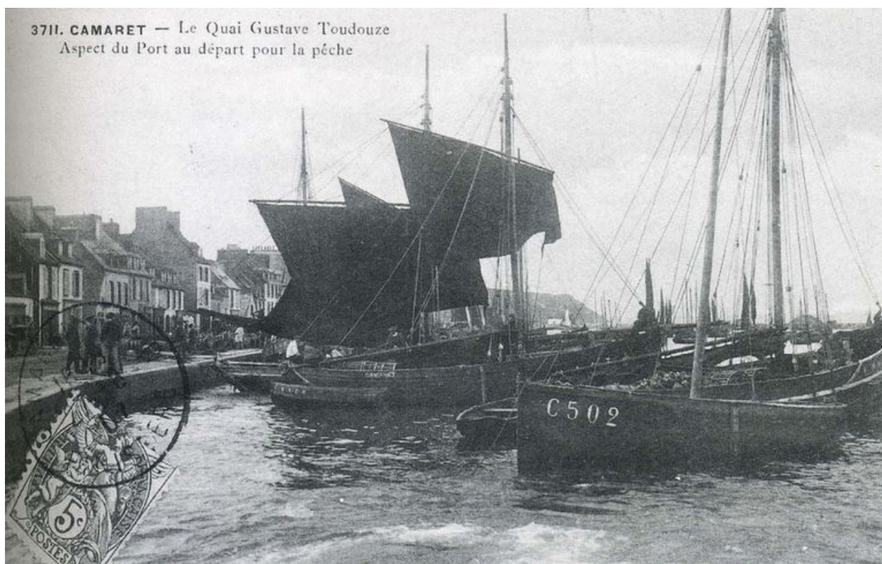
Carte postale 1907 : Le quai Toudouze, aspect du port au départ pour la pêche