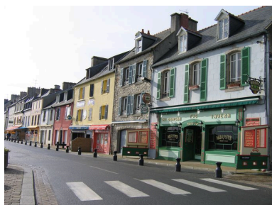
Front portuaire Toudouze IVR53_20062908401NUCA