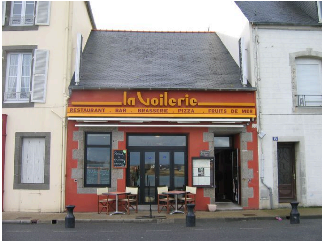
Restaurant La Voilerie