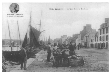
Carte postale : Le quai Gustave Toudouze