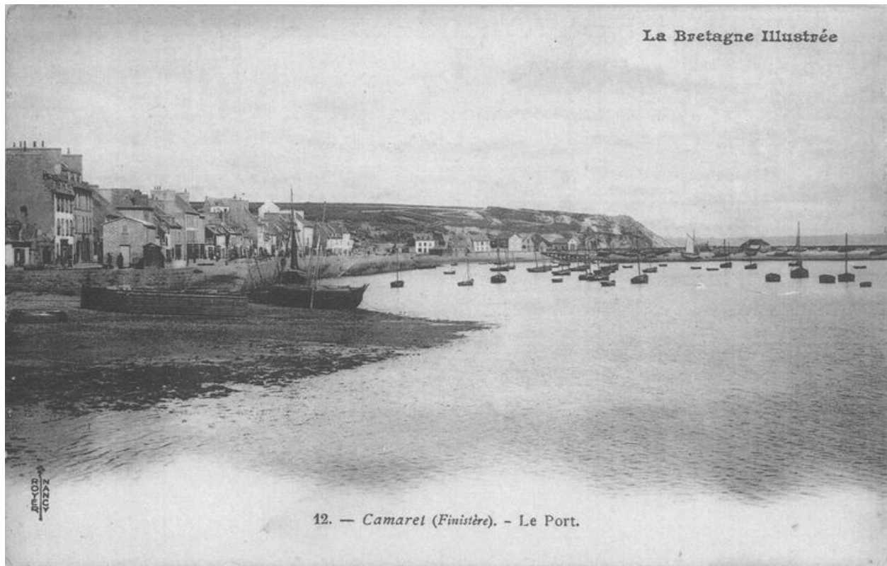
Carte postale : Le port