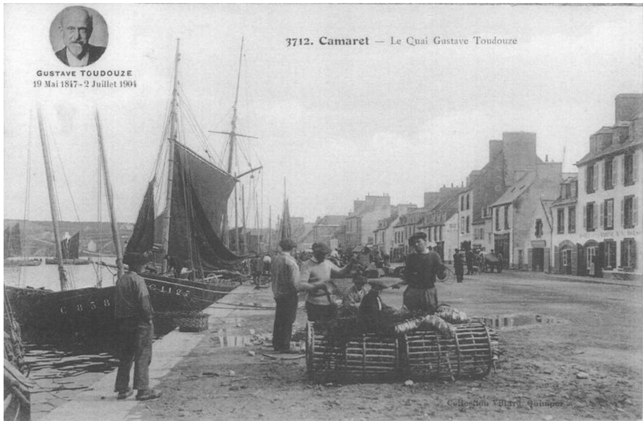
Carte postale : Le quai Gustave Toudouze