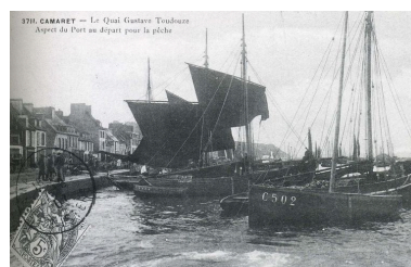
Carte postale 1907 : Le quai Toudouze, aspect du port au départ pour la pêche IVR53_20072908577NUCB