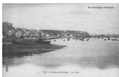
Carte postale : Le port