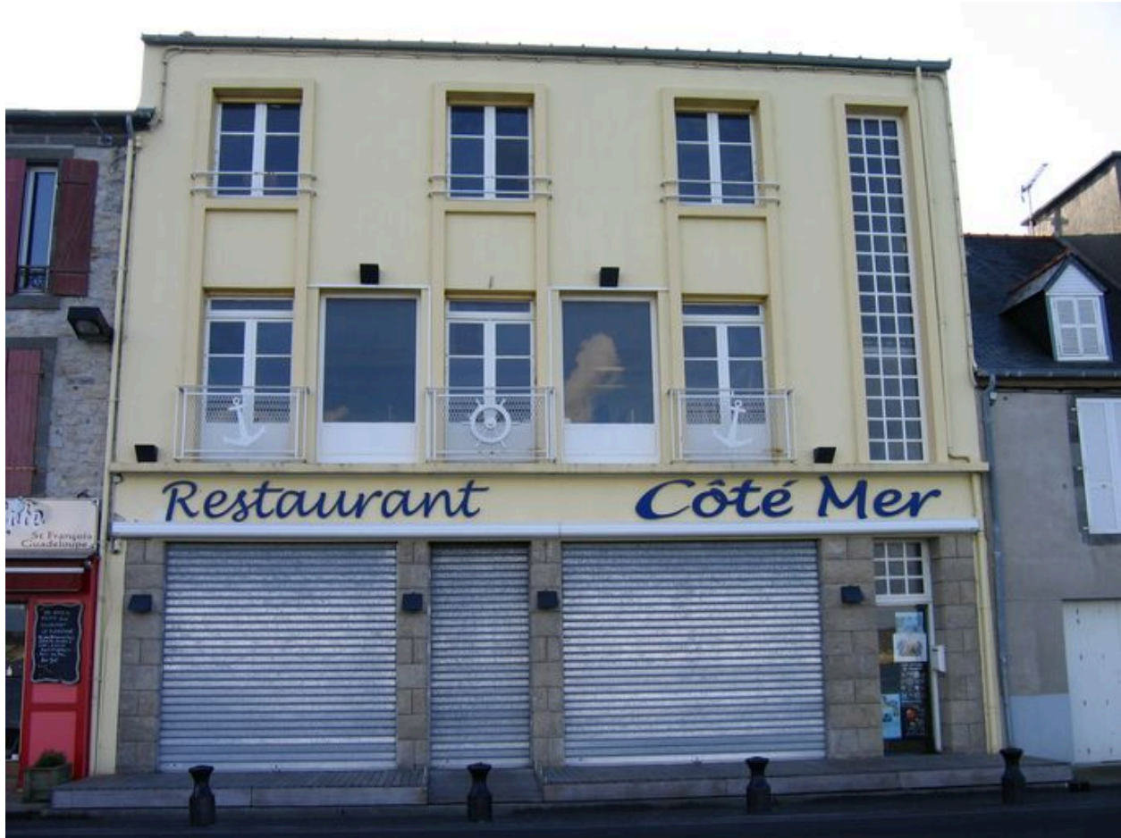
Restaurant Coté Mer