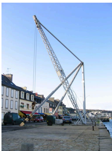
Grue à mâter et de levage sur le quai Toudouze IVR53_20062908341NUCA