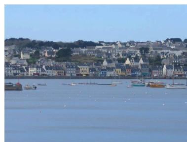
Front portuaire Toudouze