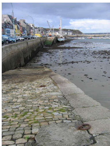
Vue d'une cale et du quai Toudouze IVR53_20062908312NUCA