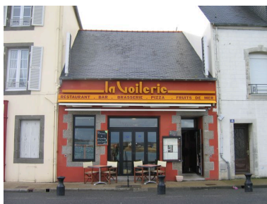
Restaurant La Voilerie