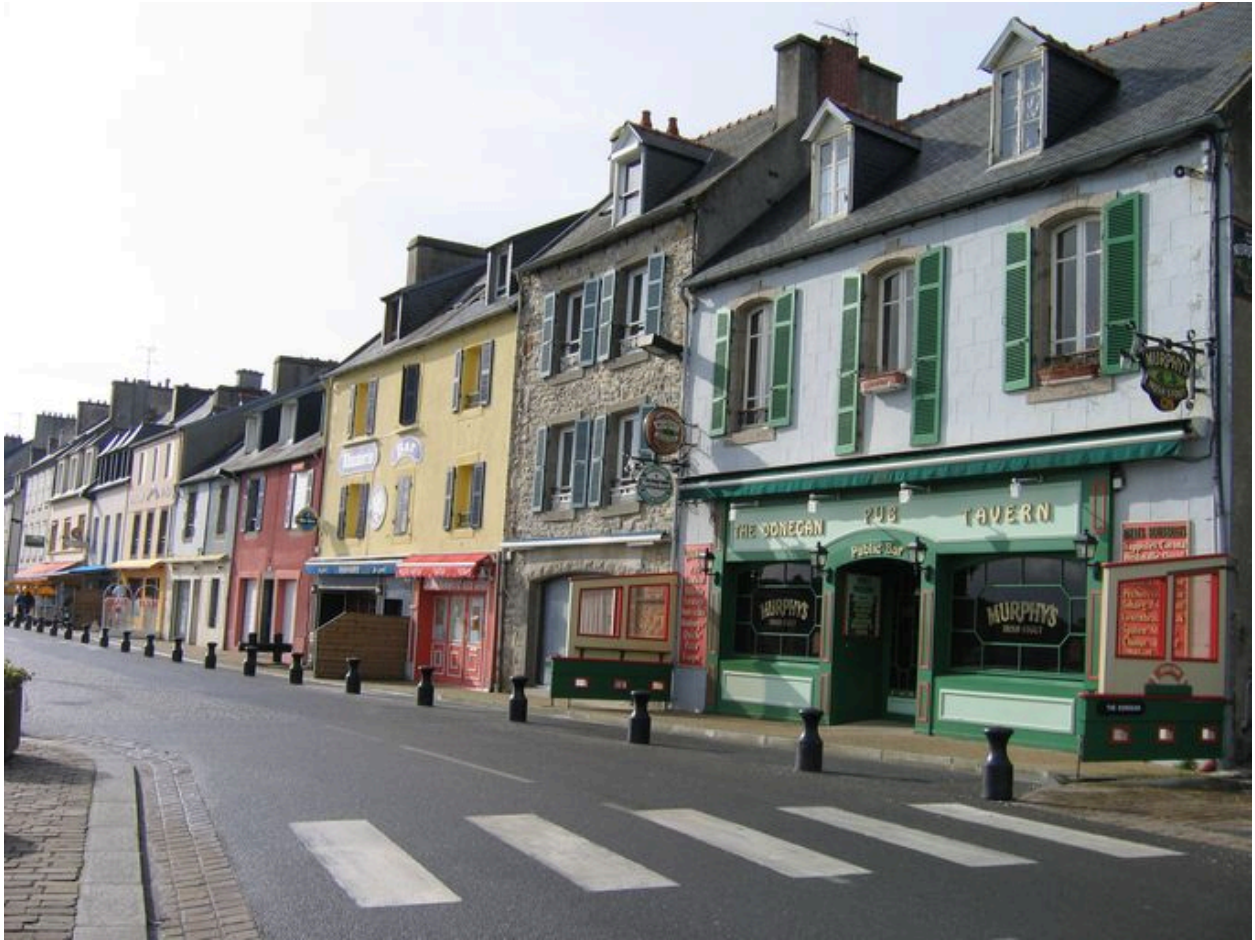
Front portuaire Toudouze