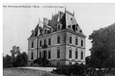
Les Loges au début du 20e siècle