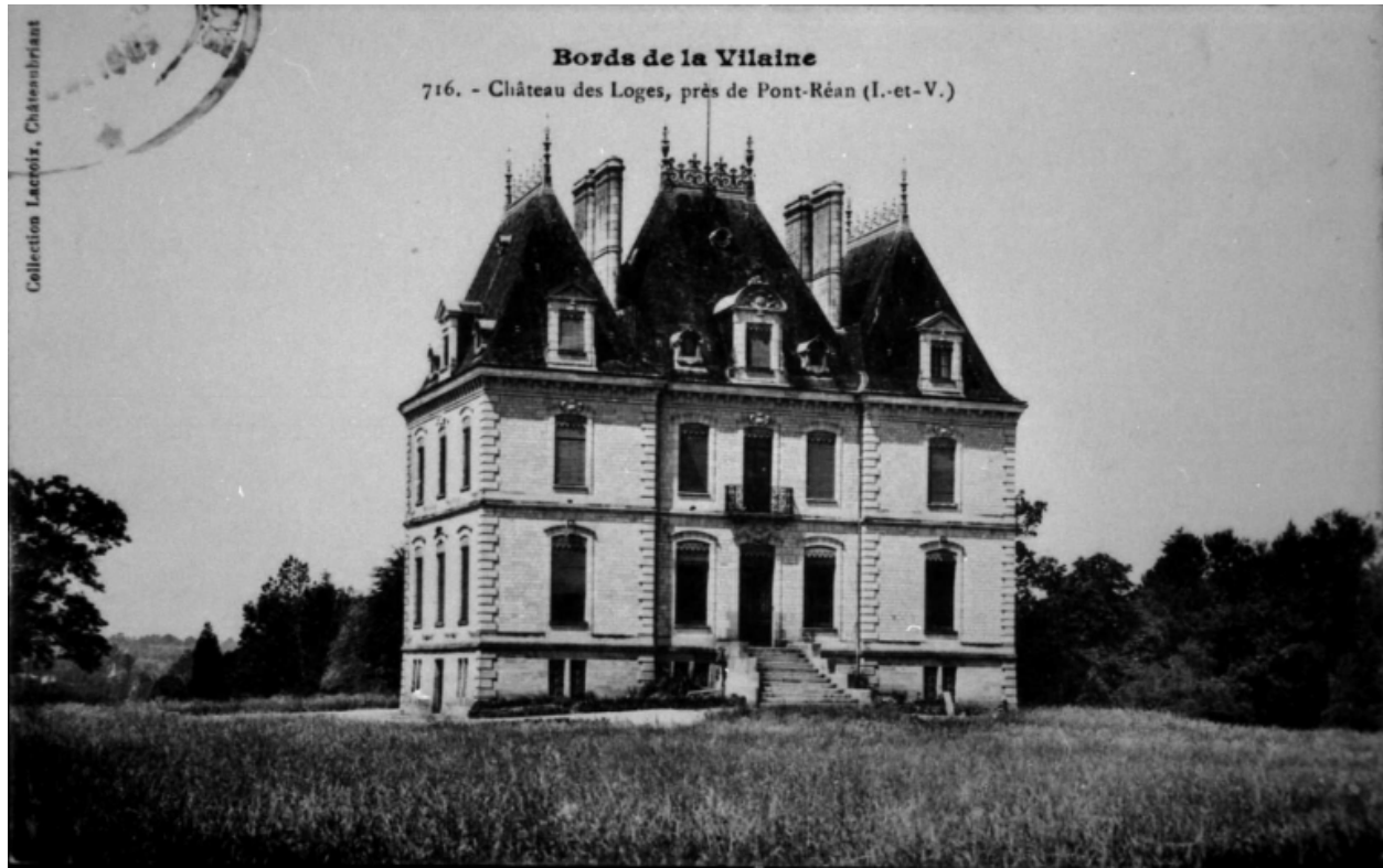
Les Loges au début du 20e siècle