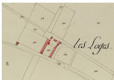
Les loges sur le cadastre de 1812 IVR53_20083508295NUCA