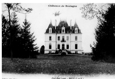
Les Loges au début du 20e siècle