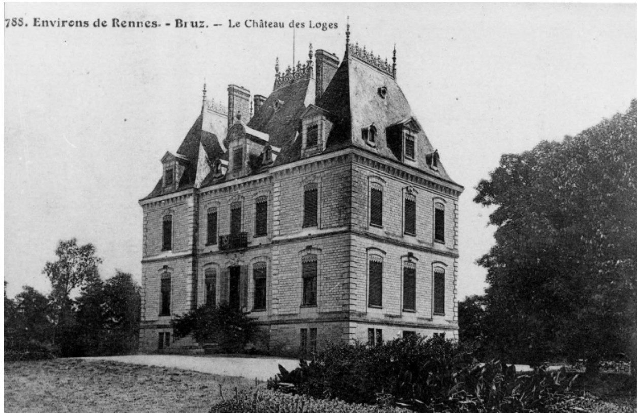
Les Loges au début du 20e siècle