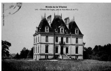
Les Loges au début du 20e siècle IVR53_20083508326NUCB