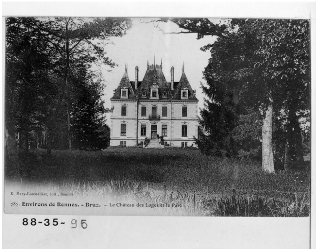
Le château et le parc au début du 20e siècle