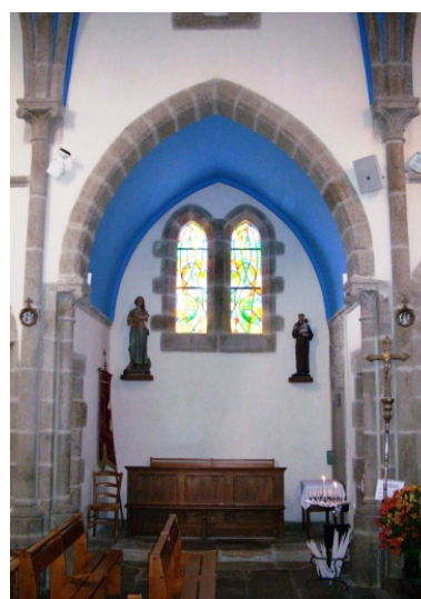
Plouarzel, église de Trézien : vue de la chapelle latérale sud depuis le nord IVR53_20082906238NUCA