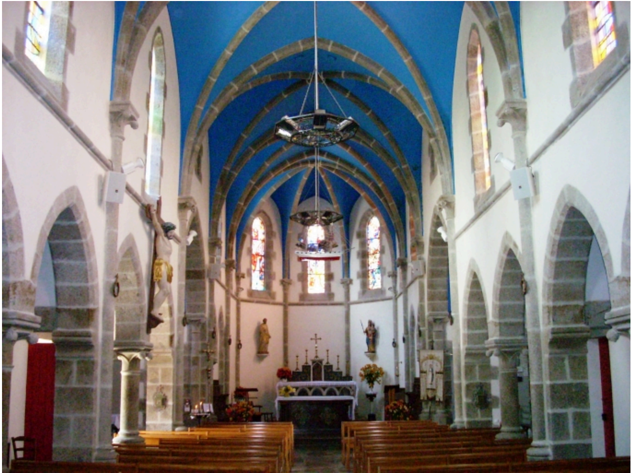
Plouarzel, église de Trézien : vue axiale est