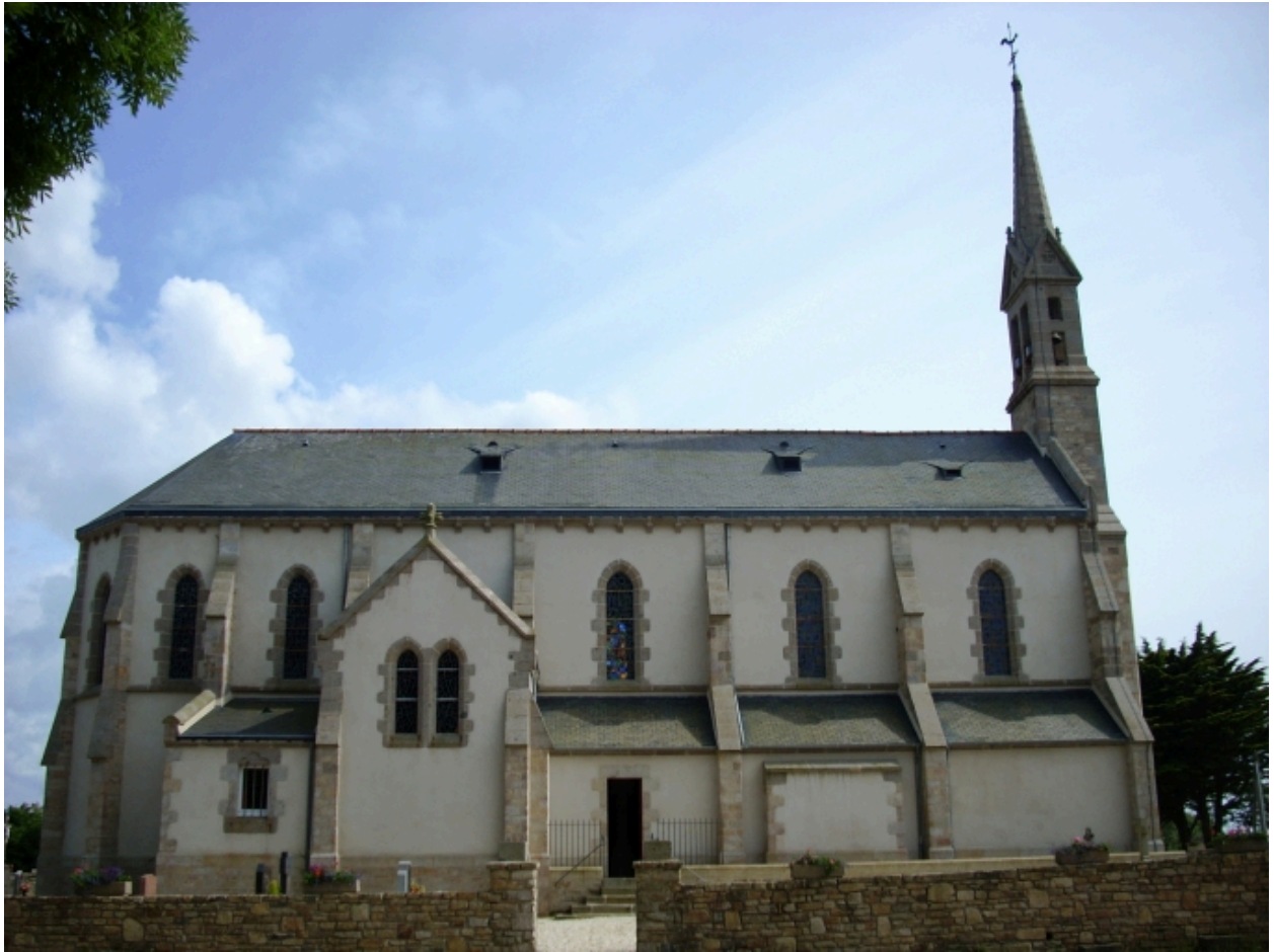
Plouarzel, église de Trézien : élévation nord