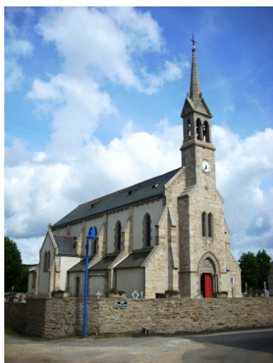
Plouarzel, église de Trézien : vue générale nord-ouest IVR53_20082906233NUCA