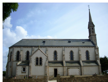
Plouarzel, église de Trézien : élévation nord IVR53_20082906235NUCA