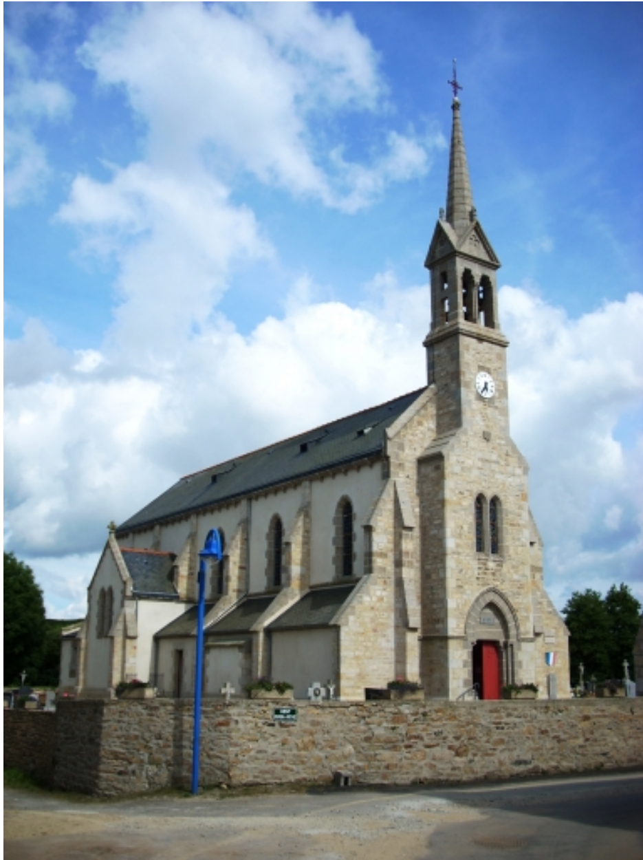
Plouarzel, église de Trézien : vue générale nord-ouest