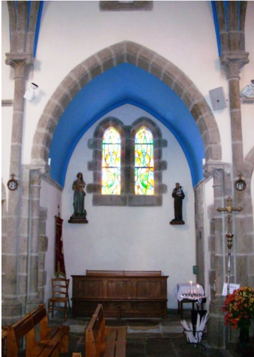
Plouarzel, église de Trézien : vue de la chapelle latérale sud depuis le nord