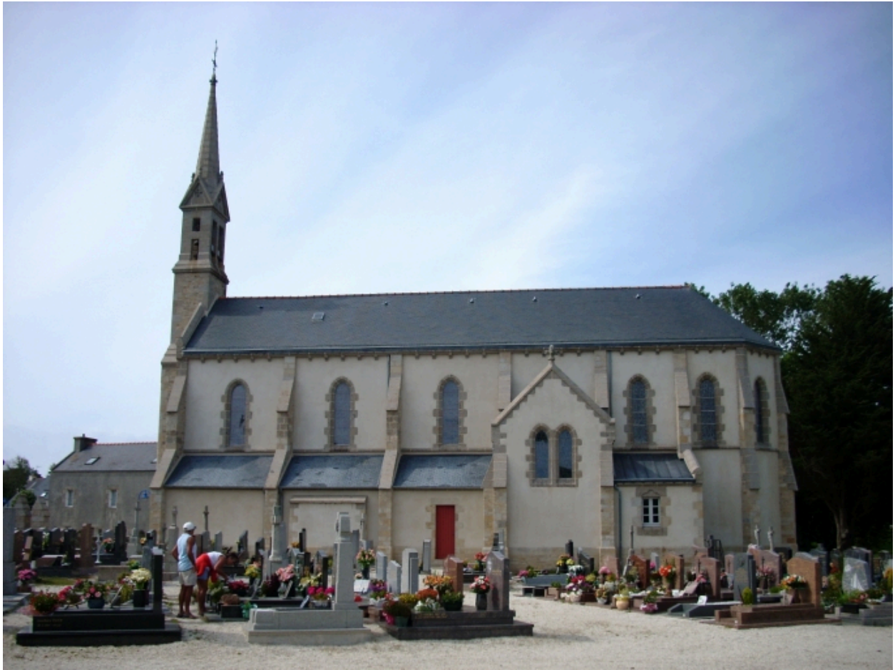
Plouarzel, église de Trézien : élévation sud