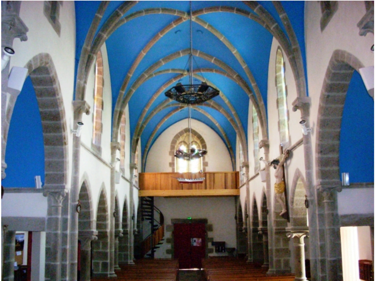
Plouarzel, église de Trézien : vue axiale ouest