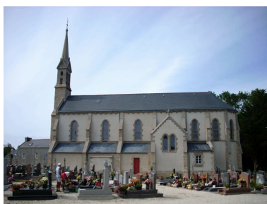
Plouarzel, église de Trézien : élévation sud IVR53_20082906234NUCA