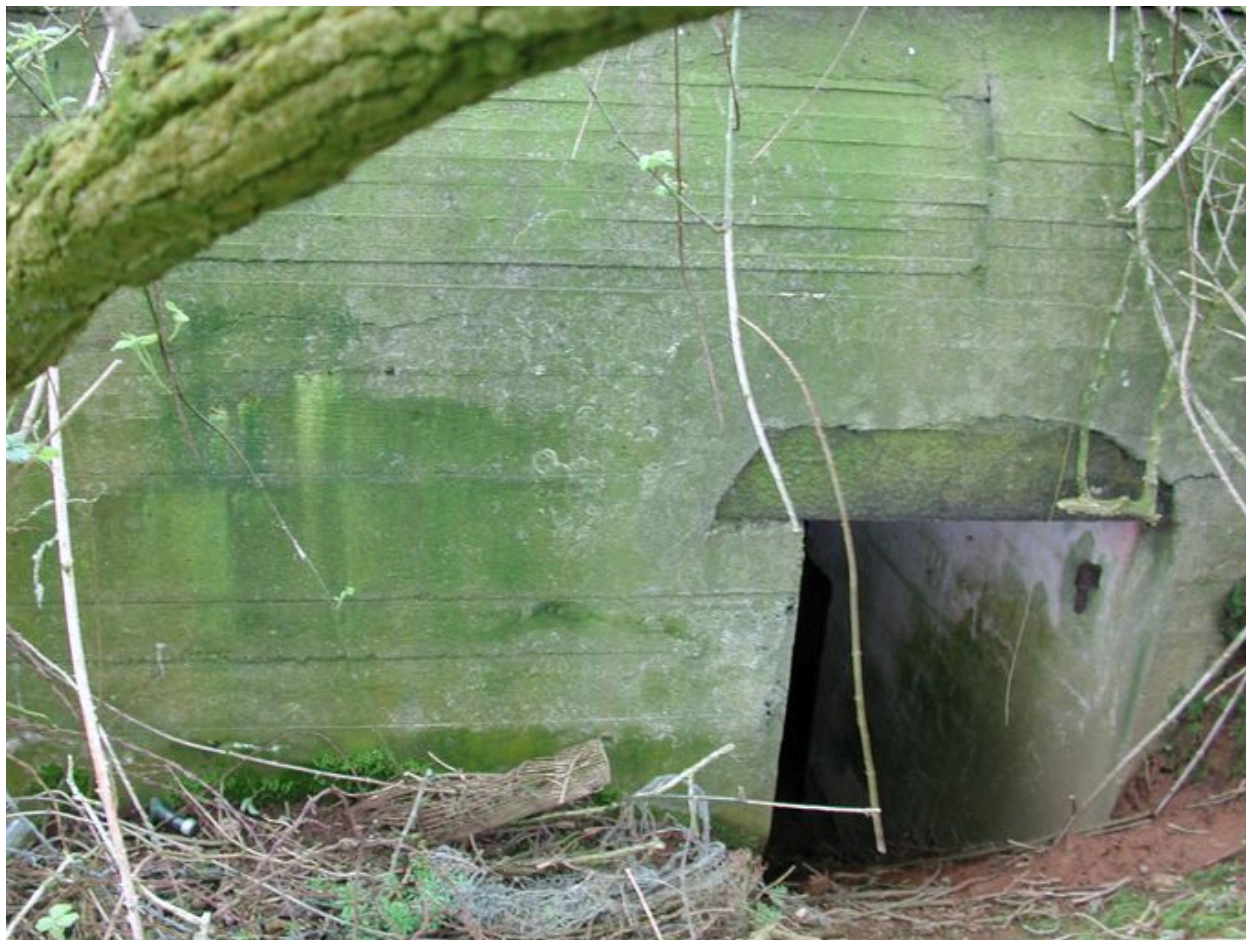
Vue de l'une des deux entrées du bunker (état en 2002)