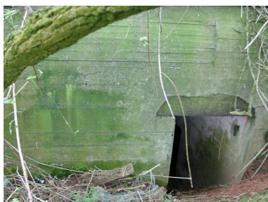
Vue de l'une des deux entrées du bunker (état en 2002)