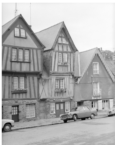
Vue générale, place du Marchix.