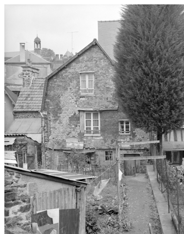
Vue générale de l'élévation postérieure.