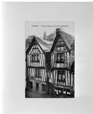
Reproduction - Maisons n°13 et n°15 place du Marchix, vue générale.