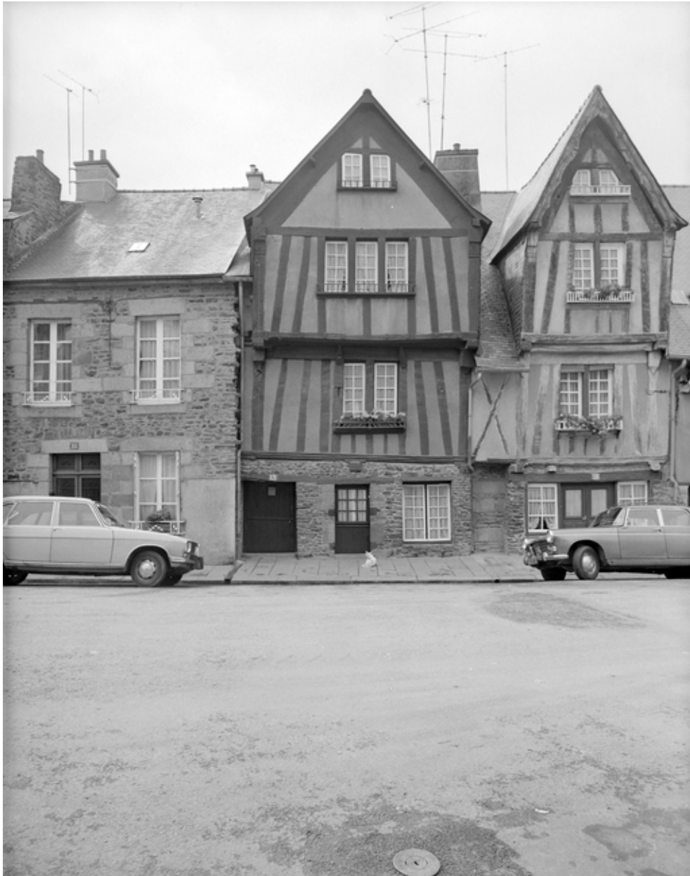
Vue générale de l'élévation antérieure.