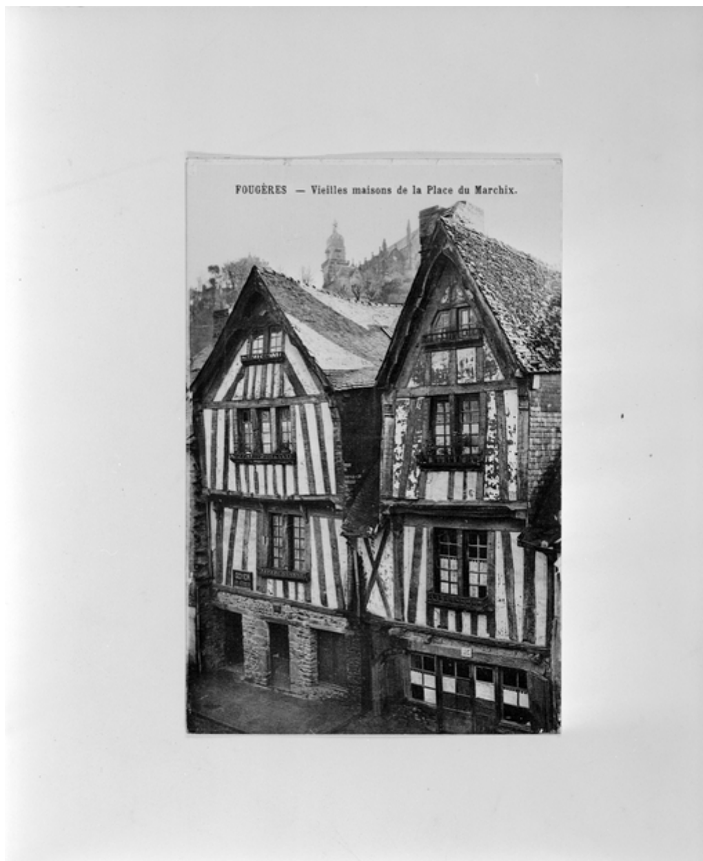
Reproduction - Maisons n°13 et n°15 place du Marchix, vue générale.