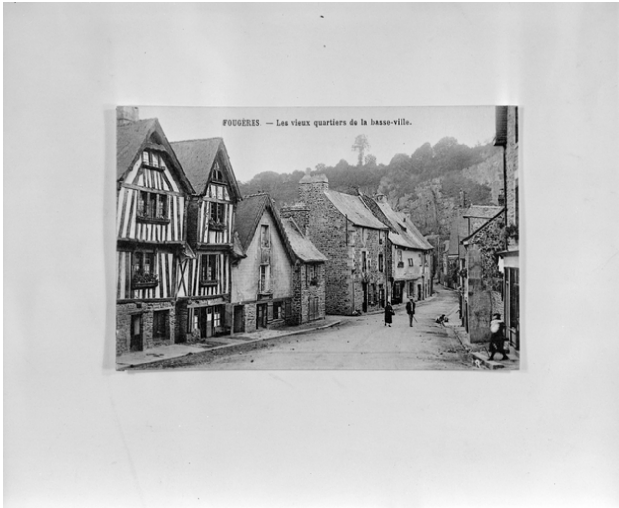
Les vieux quartiers de la Basse Ville, vue générale nord-est, carte postale ancienne.