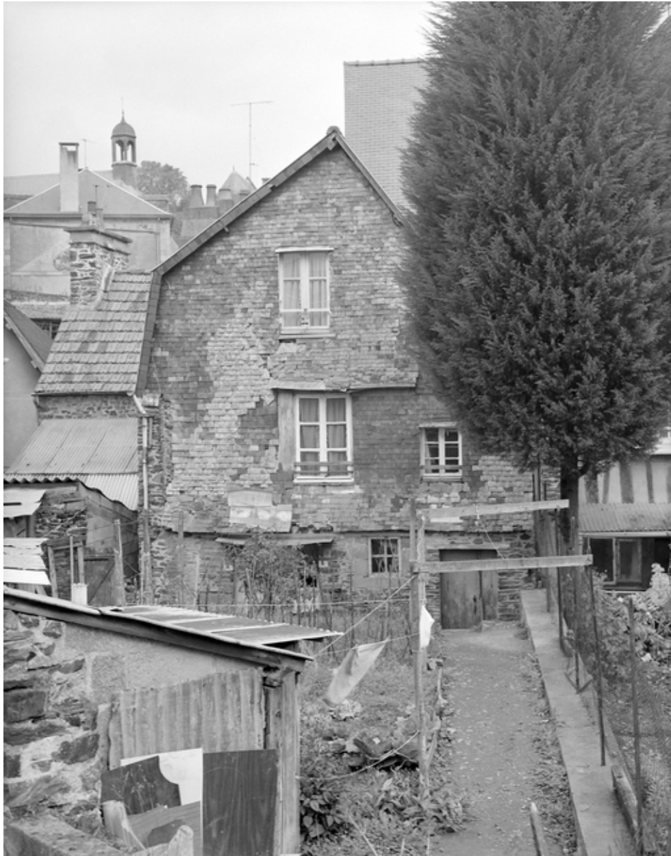
Vue générale de l'élévation postérieure.