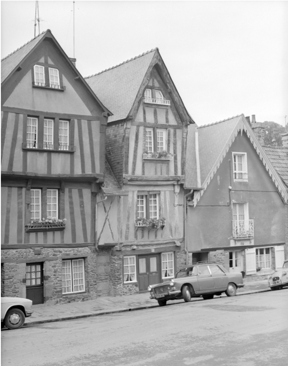
Vue générale, place du Marchix.