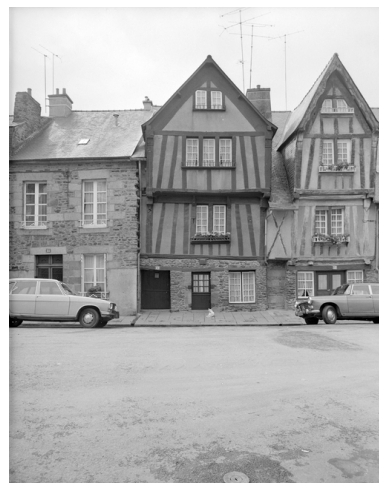
Vue générale de l'élévation antérieure.