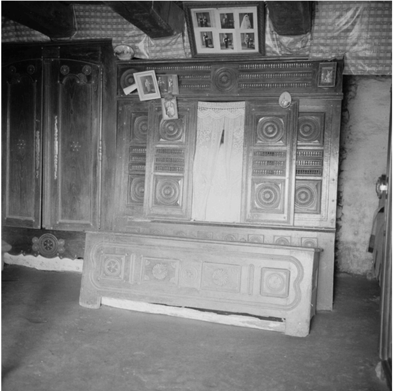
Lit coffre et banc coffre