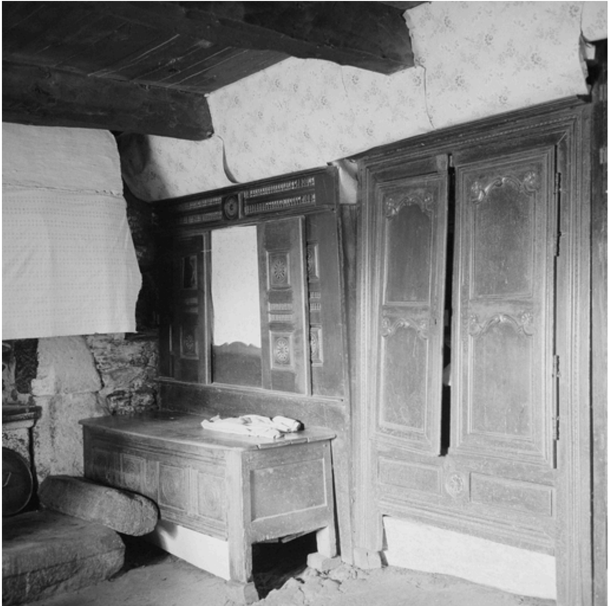
Lit clos et armoire