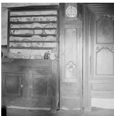
Vaisselle, horloge et armoire IVR53_19665601395X