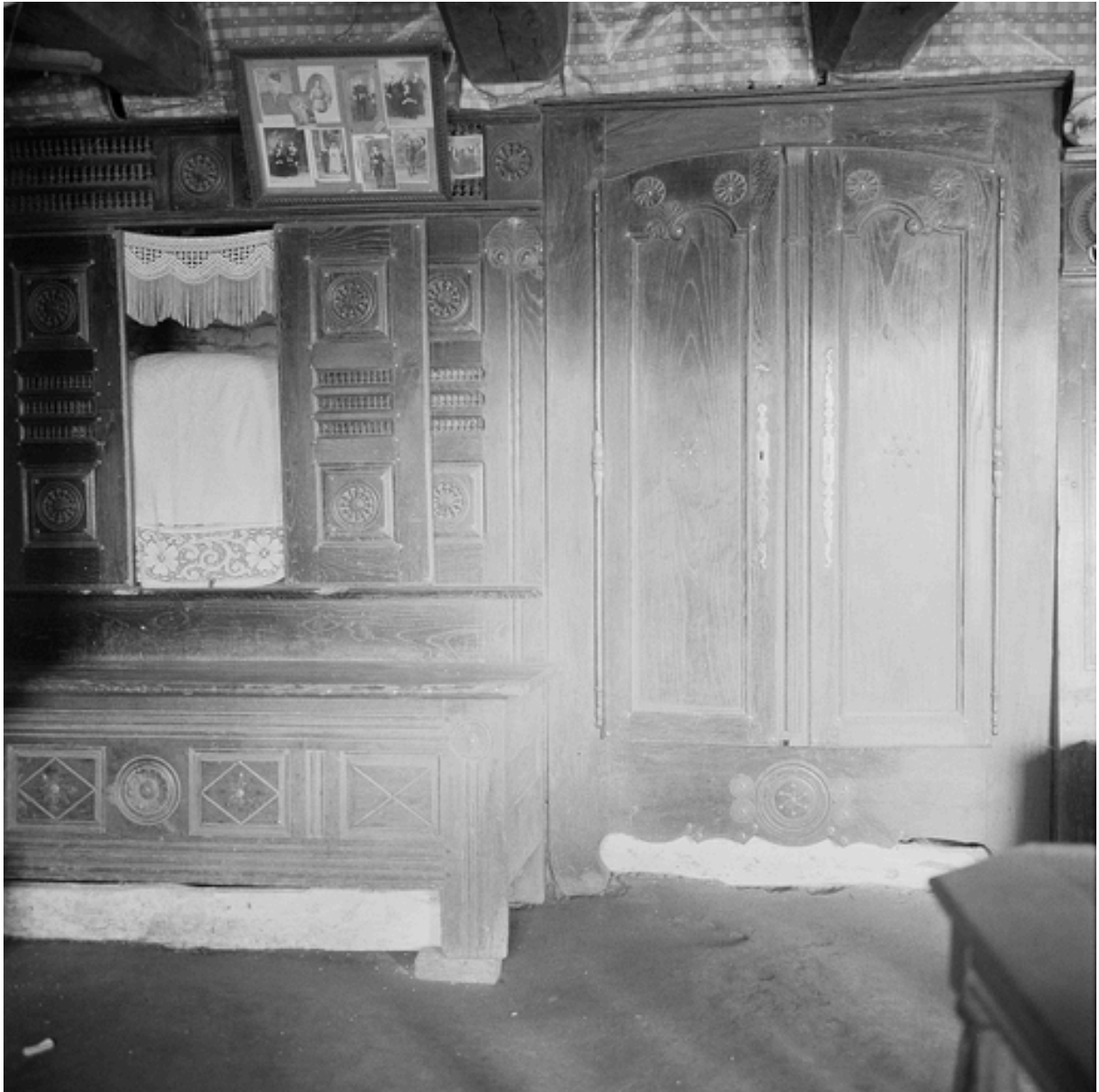
Mobilier : armoire (1865) et lit clos