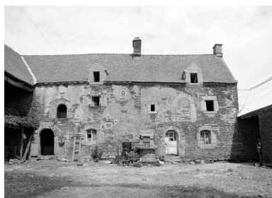
Vue générale de la façade antérieure