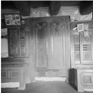
Mobilier : armoire (1865) IVR53_19665601391X