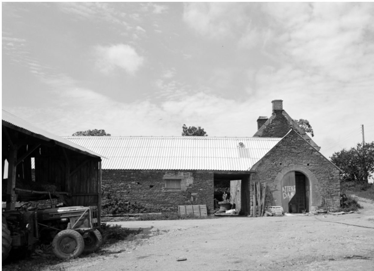
Vue générale des communs