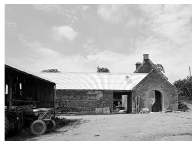
Vue générale des communs IVR53_19745600213X