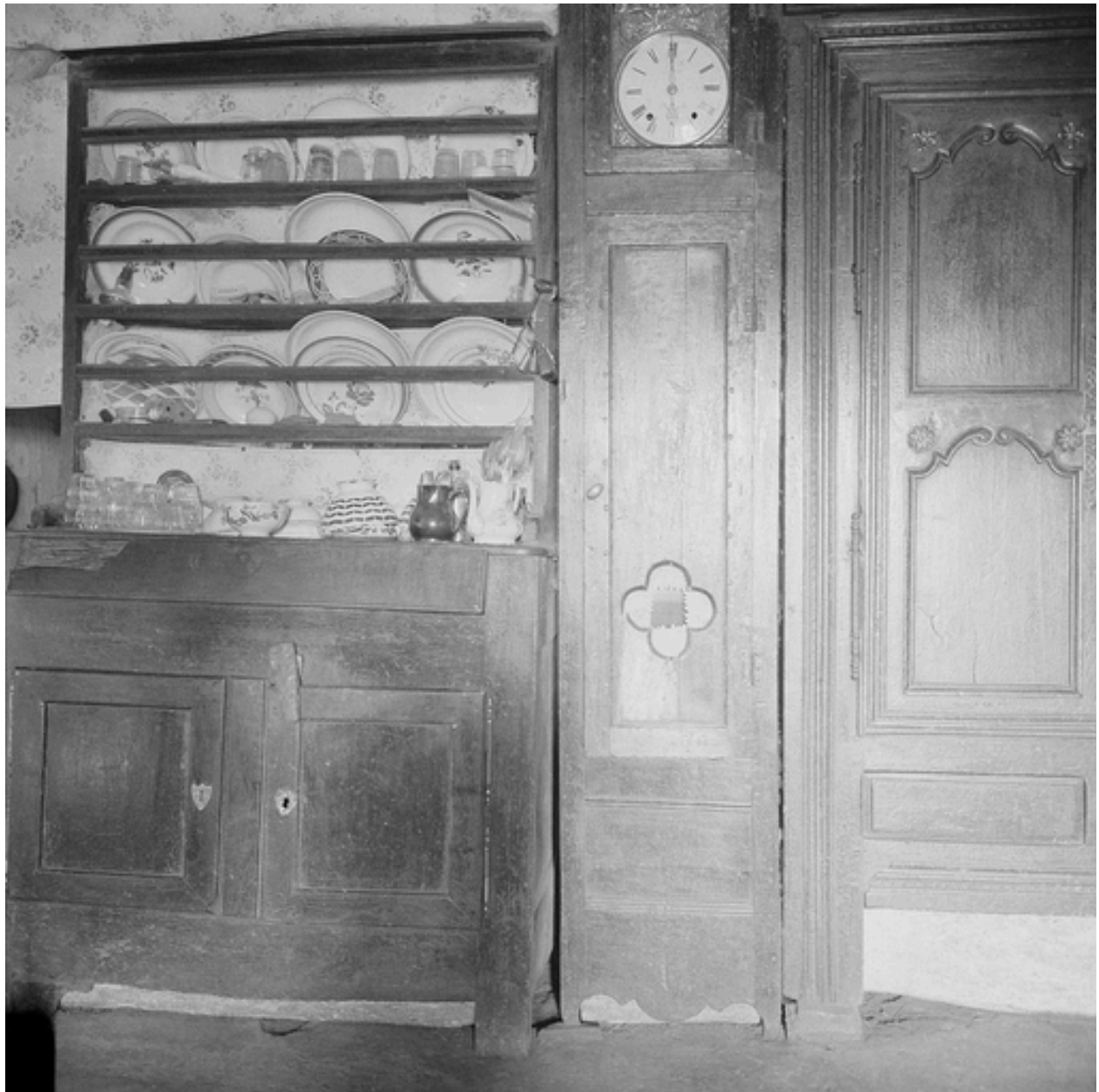
Vaisselle, horloge et armoire