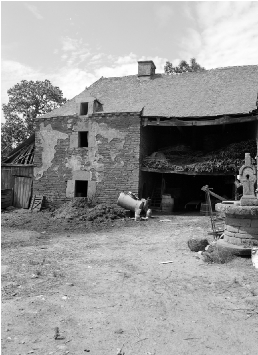
Vue générale sur la grange