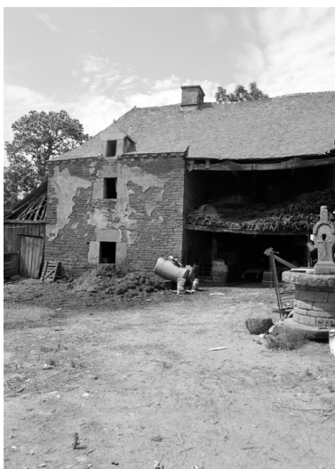
Vue générale sur la grange IVR53_19745600214X