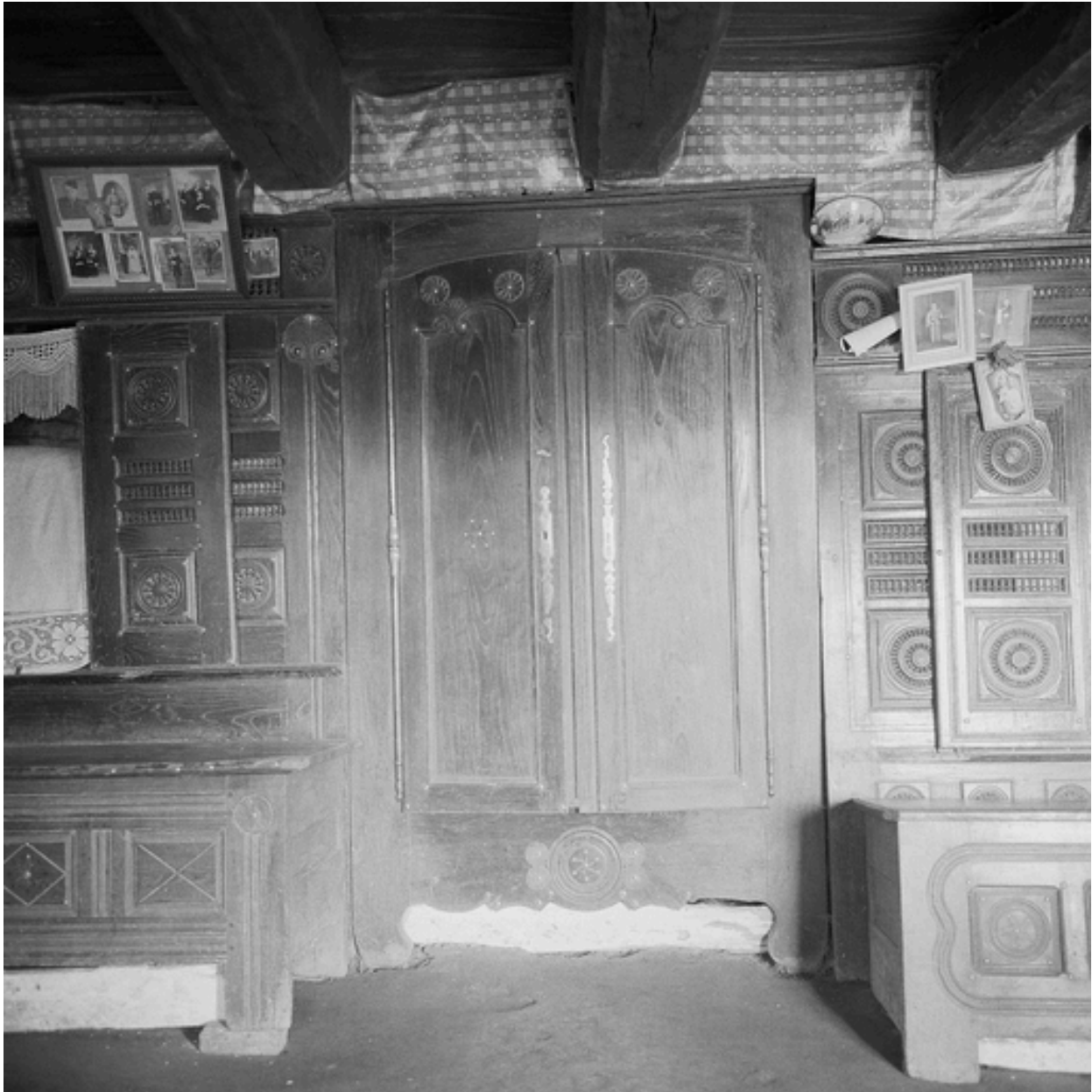
Mobilier : armoire (1865)