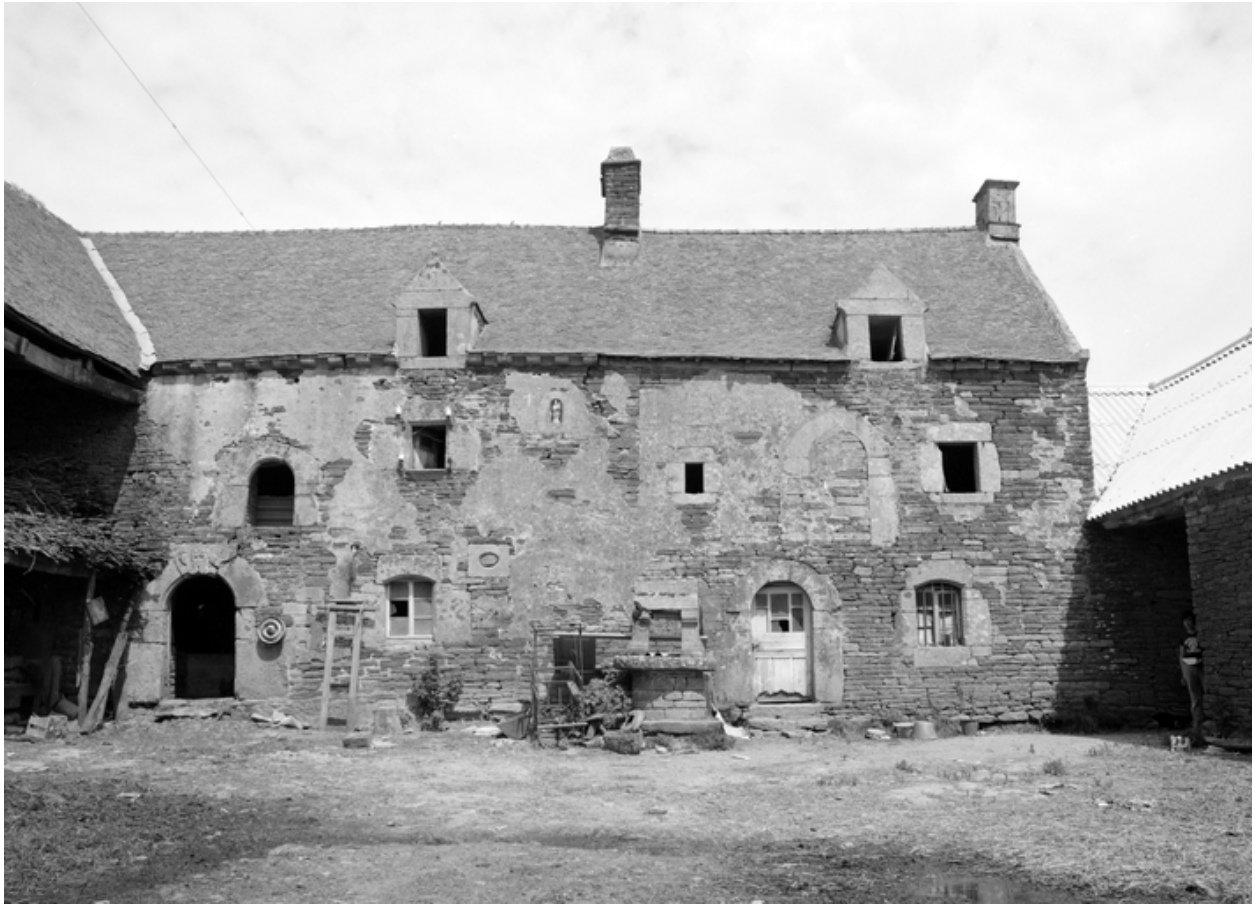
Vue générale de la façade antérieure