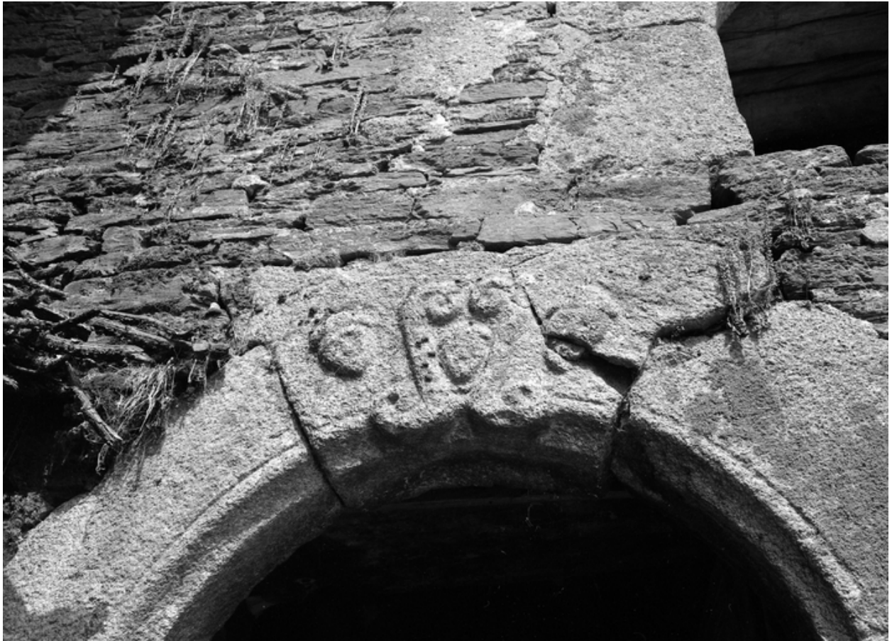
Vue sur le linteau d'une porte