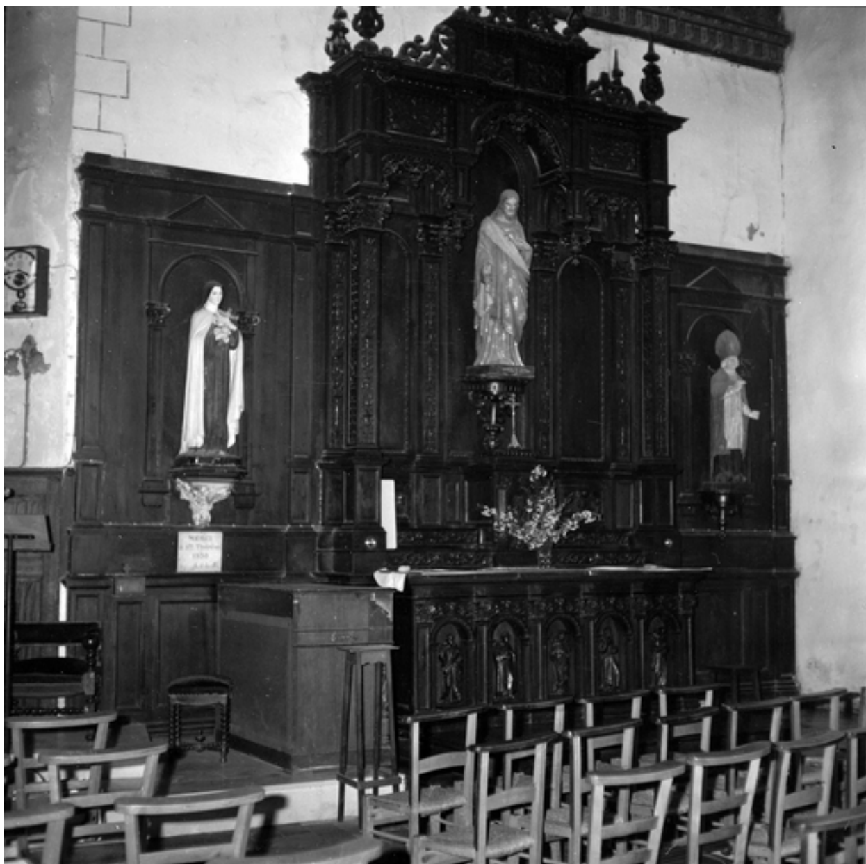
Intérieur, transept : retable sud