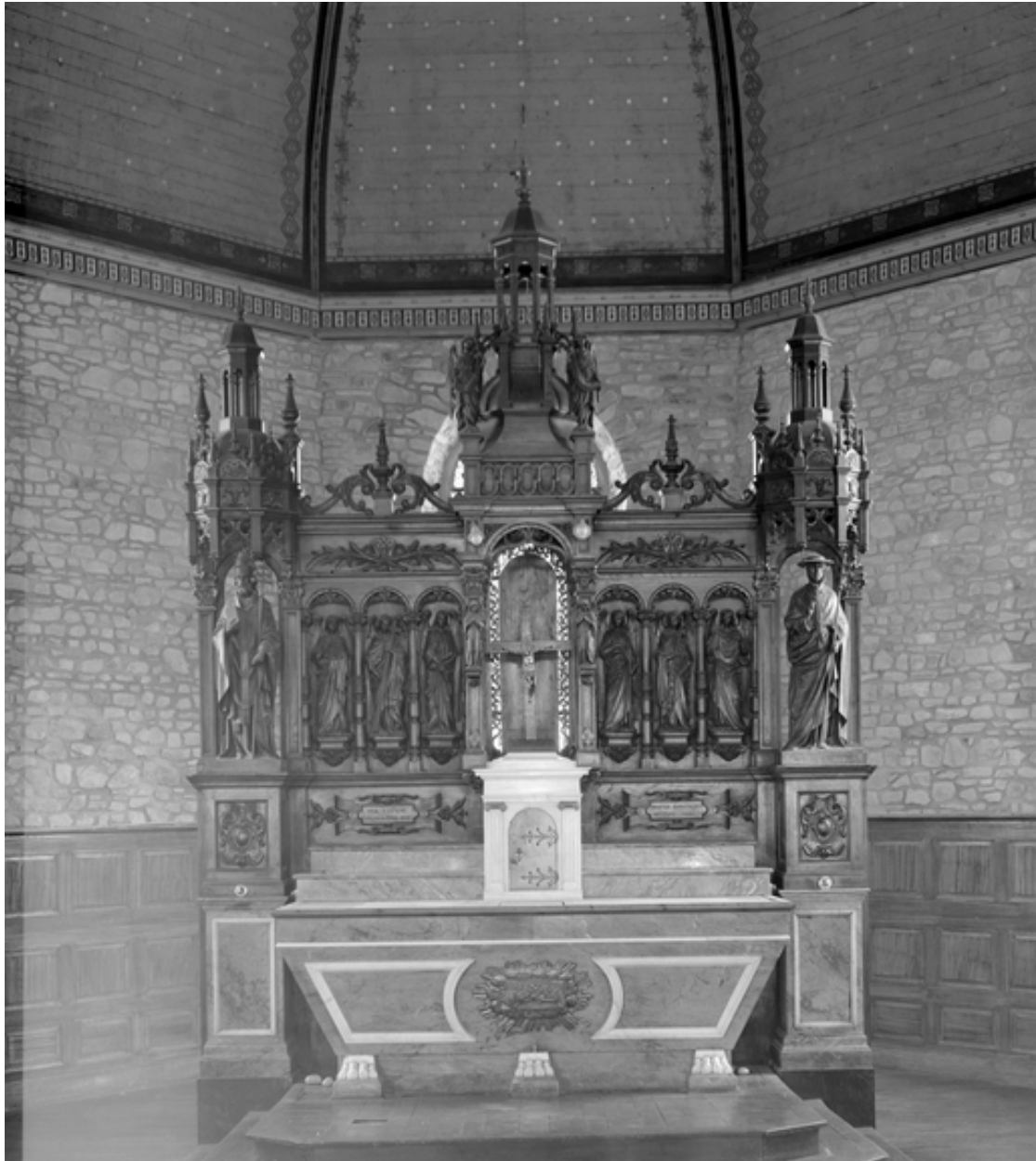
Intérieur, chœur : maître-autel