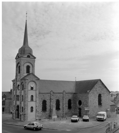
Elévation sud : vue générale IVR53_19943501392X