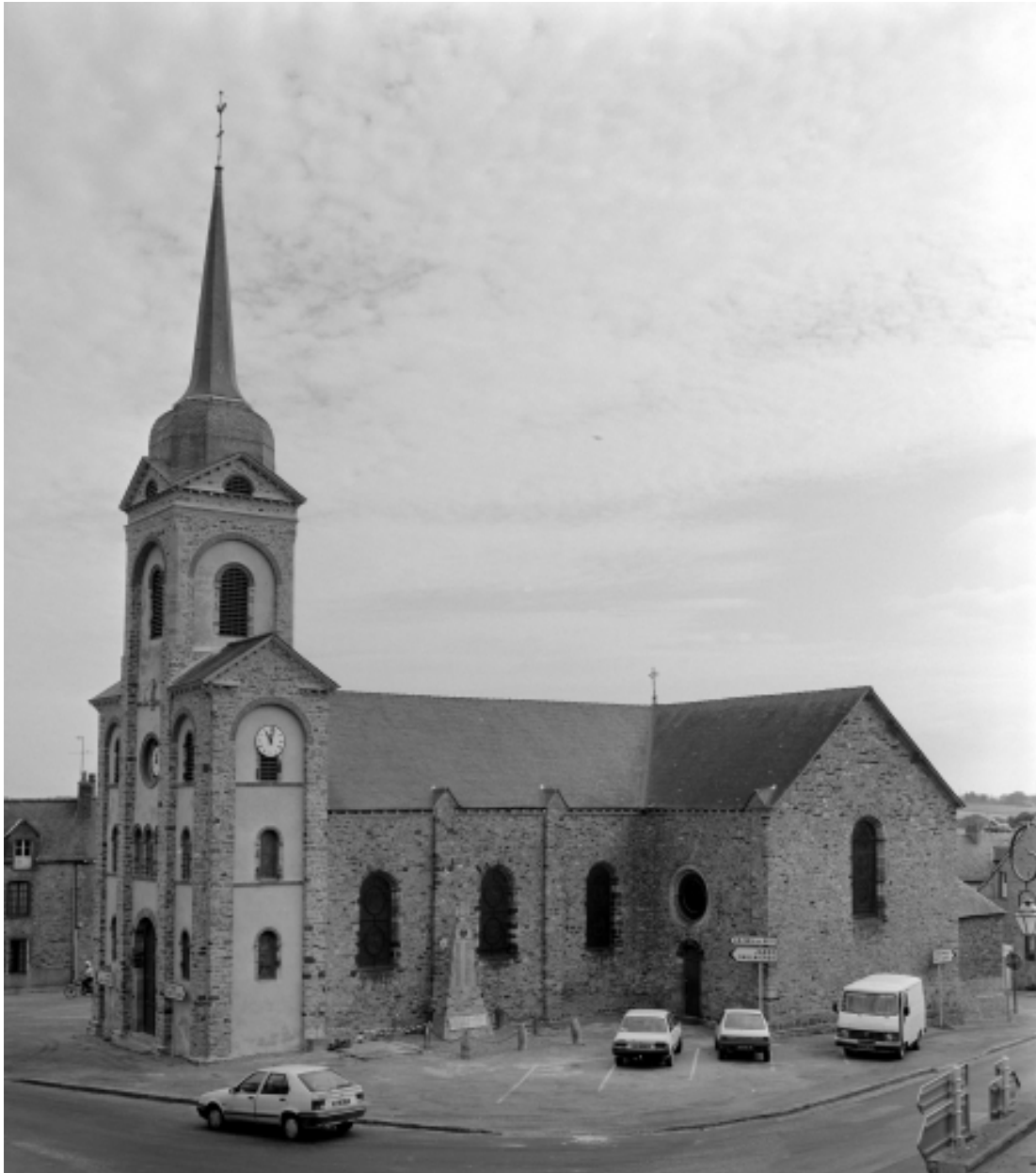
Elévation sud : vue générale