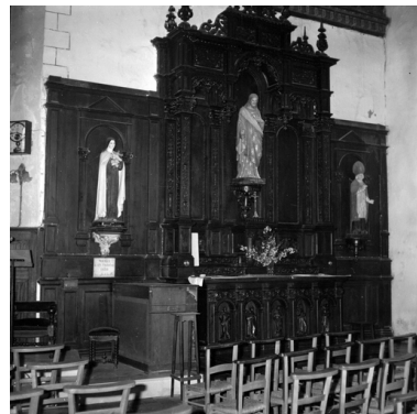
Intérieur, transept : retable sud IVR53_19823501372X