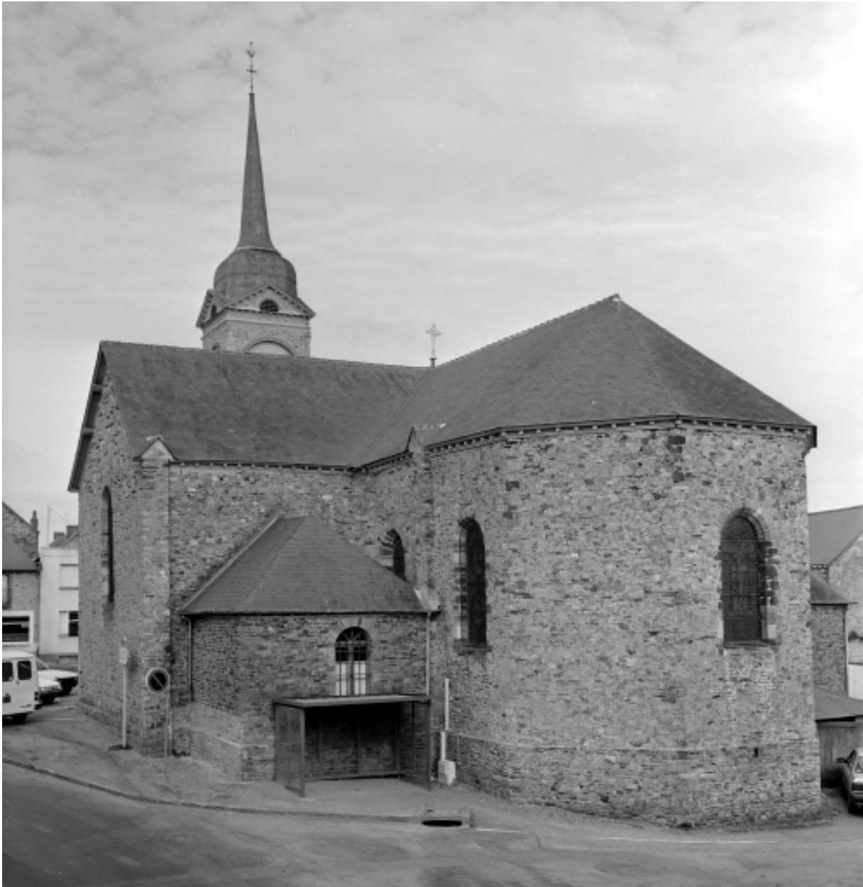
Elévation est : vue générale