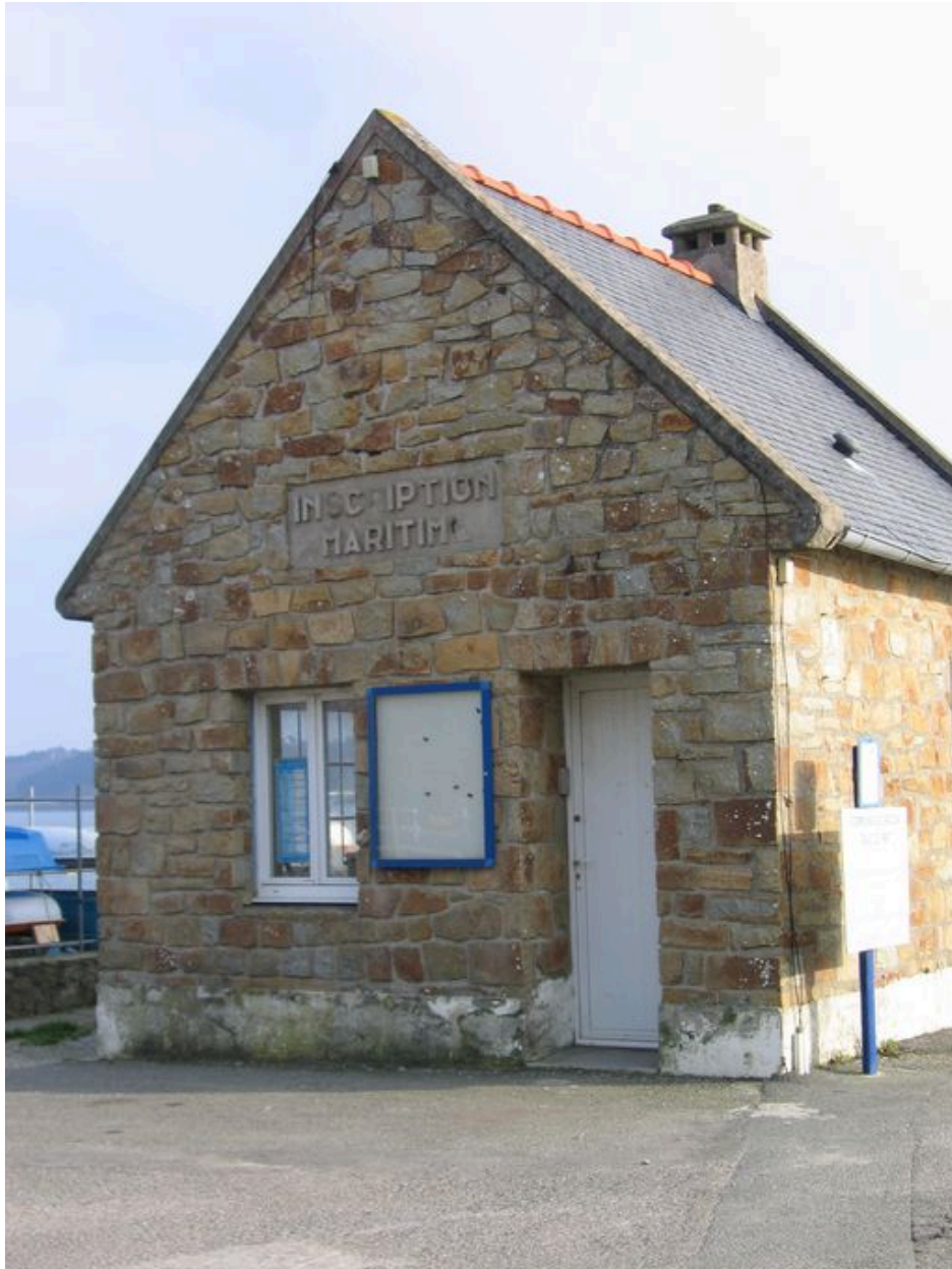
Vue générale de l'ancien bureau du garde maritime