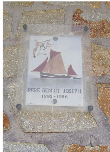
Plaque commémorative sur l'ancien bureau du garde maritime