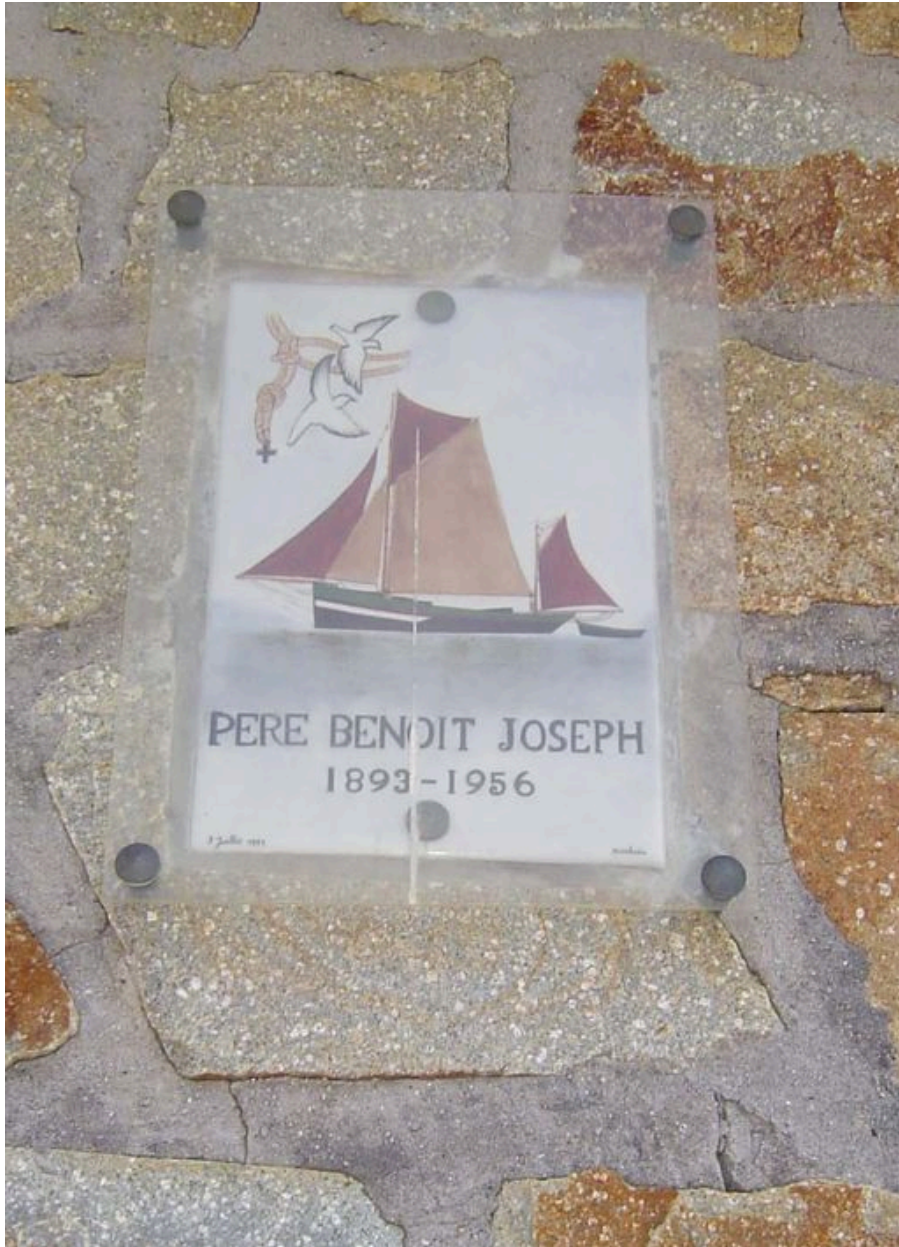
Plaque commémorative sur l'ancien bureau du garde maritime