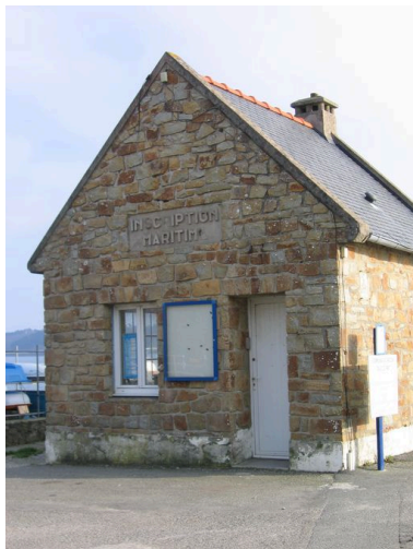
Vue générale de l'ancien bureau du garde maritime IVR53_20062908553NUCA