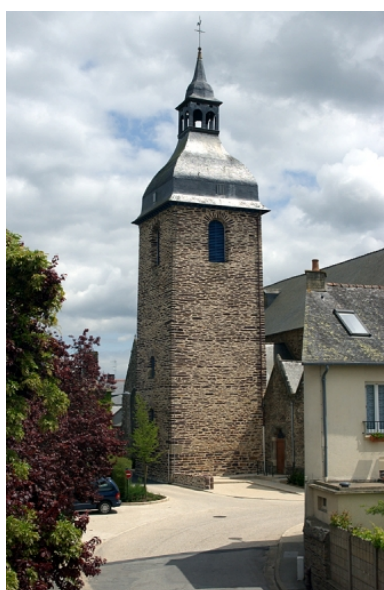
La tour nord bâtie en 1620, vestige de l'ancien édifice IVR53_20023502931NUCA