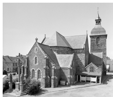
Vue générale est IVR53_19943501769X