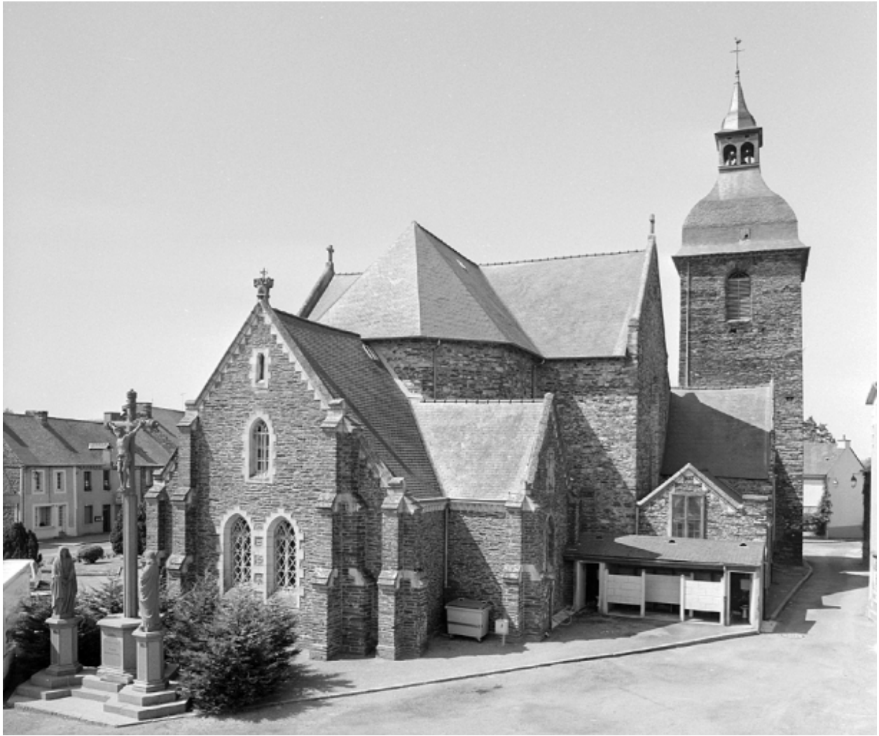
Vue générale est