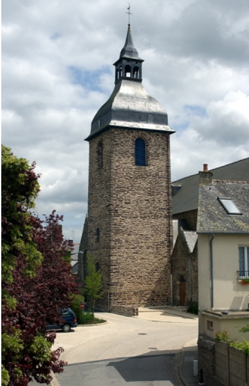
La tour nord bâtie en 1620, vestige de l'ancien édifice