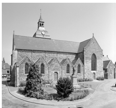
Vue générale sud IVR53_19943501768X