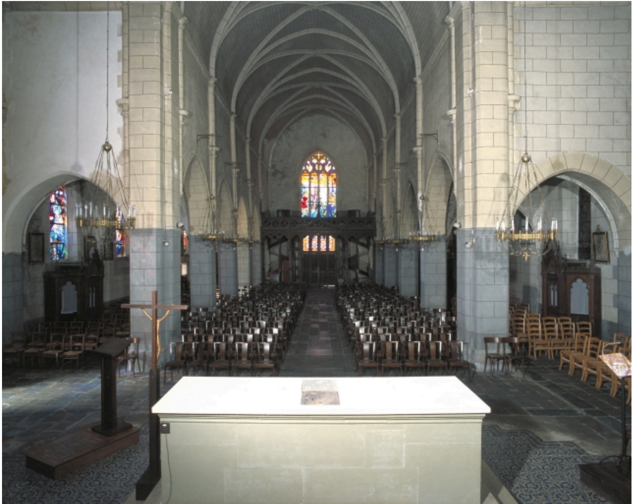
Vue intérieure prise du chœur vers la nef