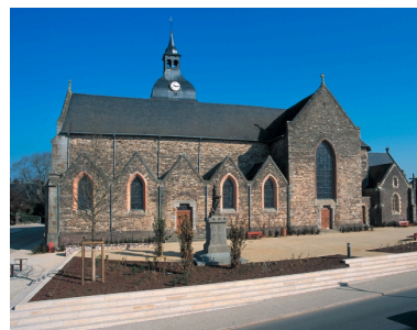
Vue générale sud IVR53_20023500887XA