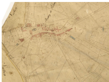
Extrait du cadastre de 1823 IVR53_20023514266NUC