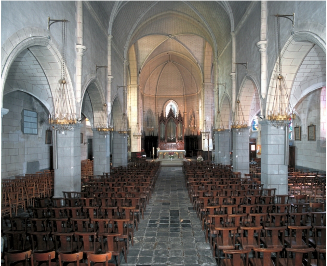
Vue intérieure prise de la nef vers le chœur