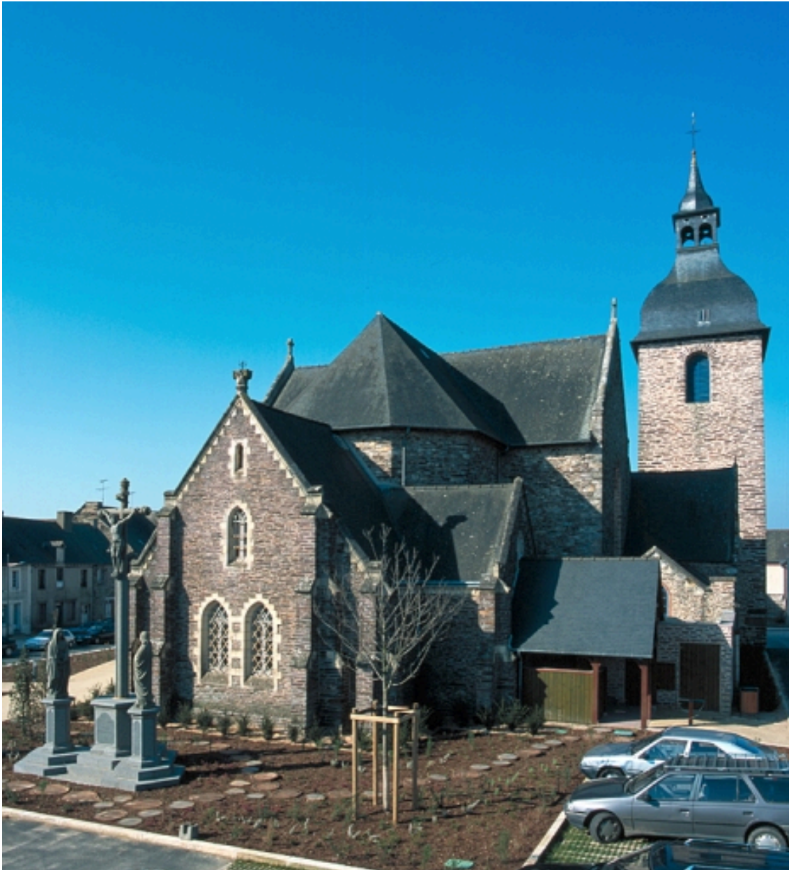
Vue générale est