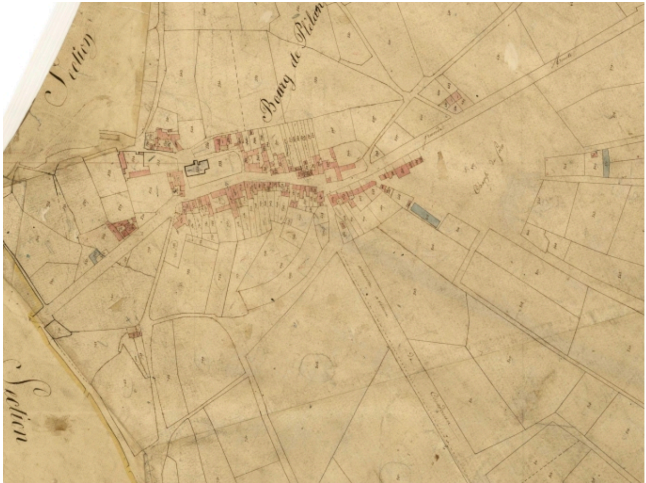
Extrait du cadastre de 1823