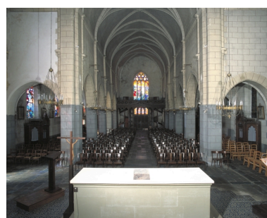
Vue intérieure prise du chœur vers la nef IVR53_20023501155XA