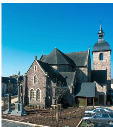
Vue générale est, IVR53_20023500886XA