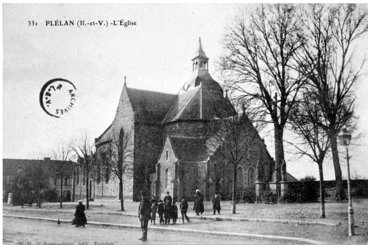
L'église au début du siècle