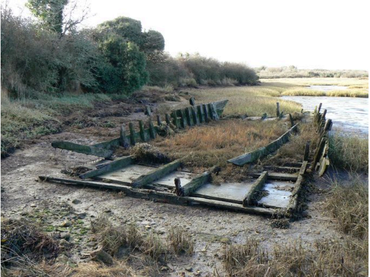
Cimetière de bateaux de Boëde