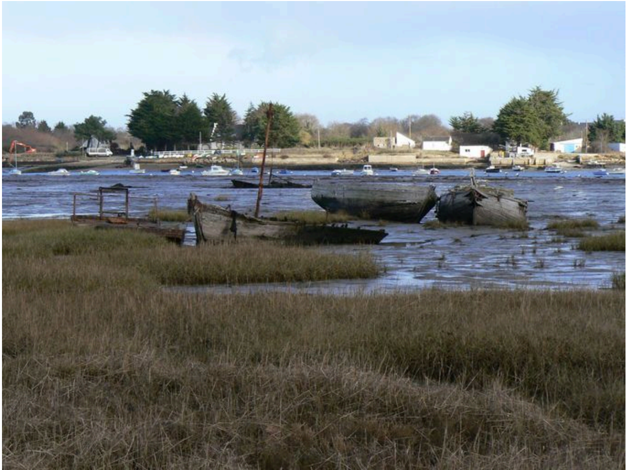
Cimetière de bateaux de Boëde