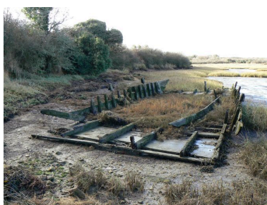
Cimetière de bateaux de Boëde