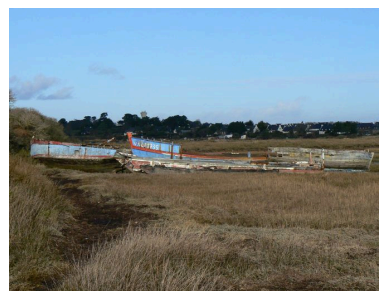
Cimetière de bateaux de Boëde IVR53_20085606094NUCA