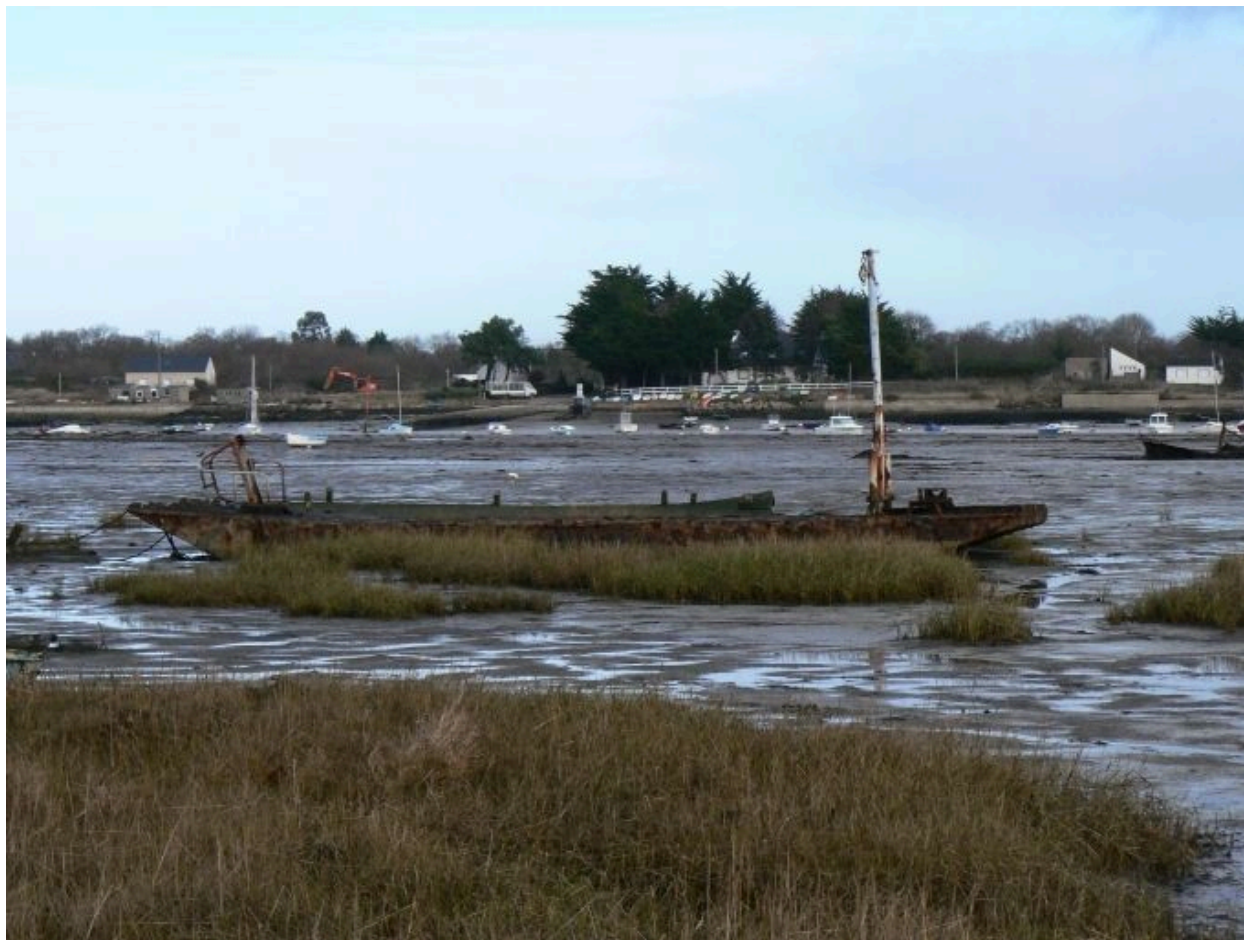
Cimetière de bateaux de Boëde