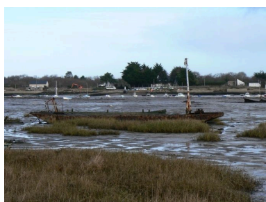
Cimetière de bateaux de Boëde