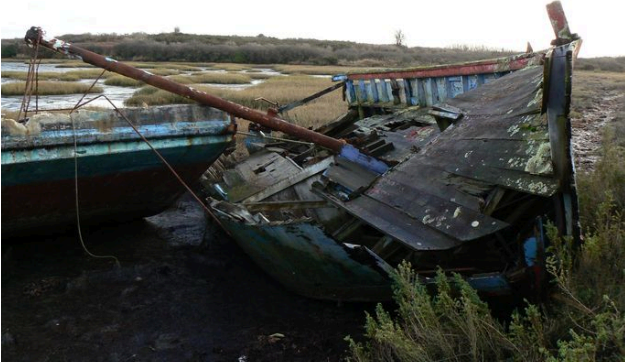
Cimetière de bateaux de Boëde