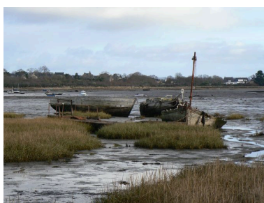
Cimetière de bateaux de Boëde