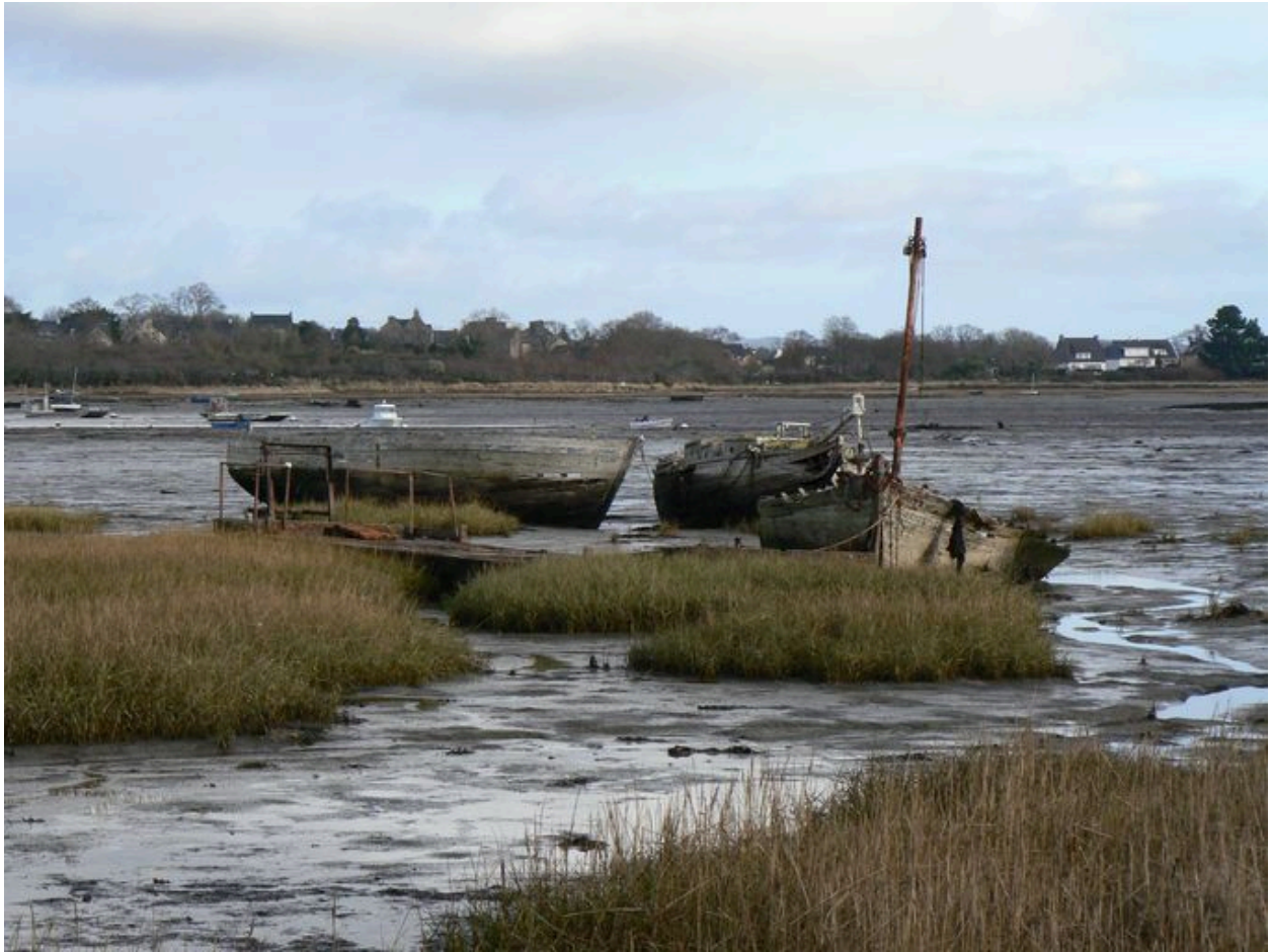
Cimetière de bateaux de Boëde