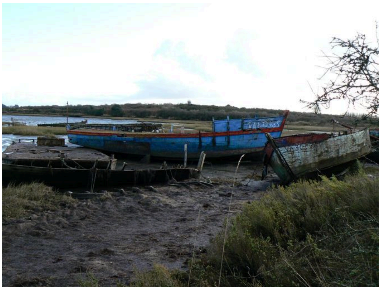
Cimetière de bateaux de Boëde