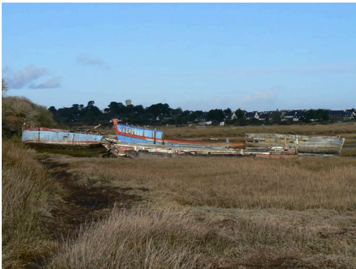
Cimetière de bateaux de Boëde