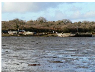
Vue générale du cimetière de bateaux de Boëde IVR53_20085606092NUCA