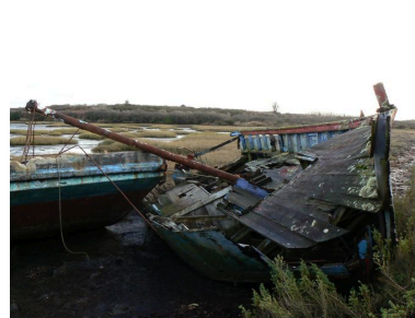
Cimetière de bateaux de Boëde IVR53_20085606097NUCA