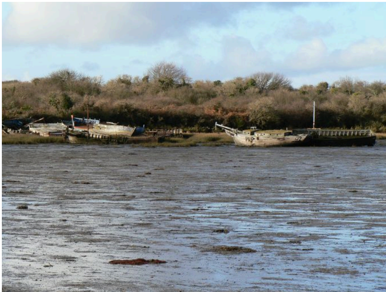
Vue générale du cimetière de bateaux de Boëde