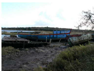
Cimetière de bateaux de Boëde