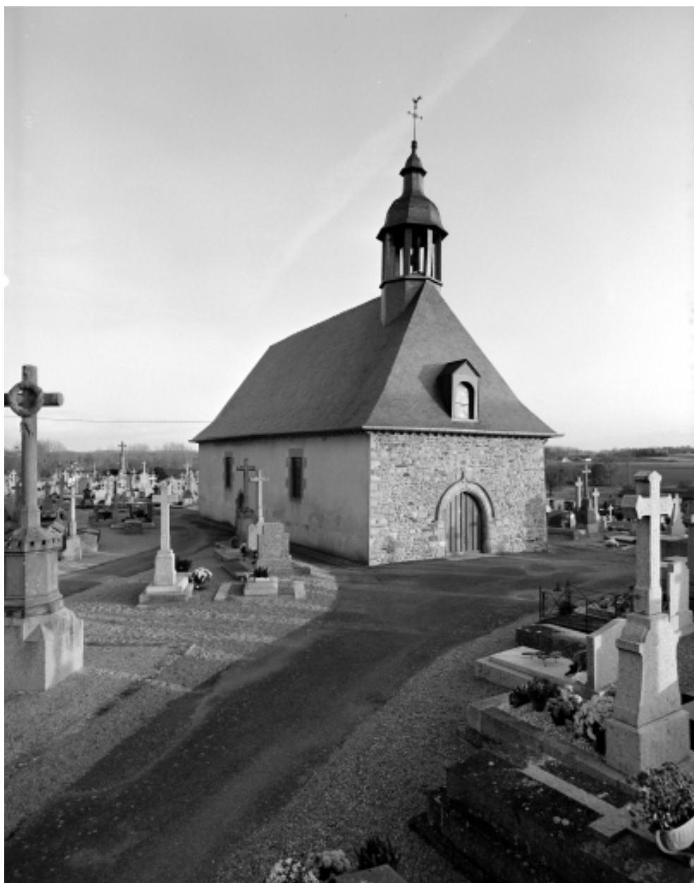
Elévation Nord-Ouest : vue générale