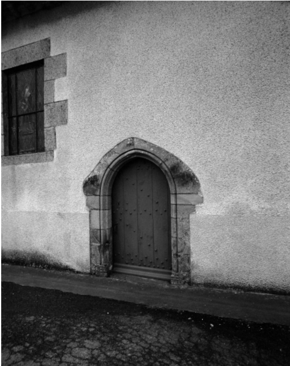
Elévation Nord, porte : vue générale