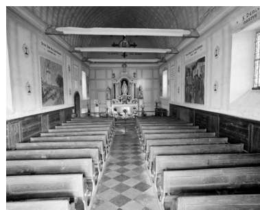
Intérieur : vue générale vers le chœur