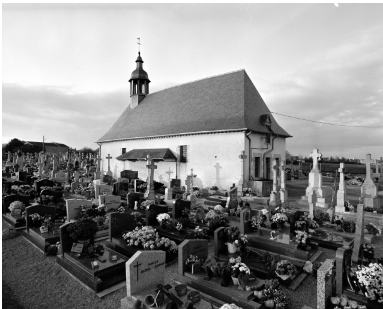
Elévation Sud-Est : vue générale