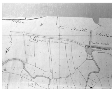
Extrait cadastral de 1837, section E1 n°3 (AD35 : 3 P 5446) IVR53_19933500290X