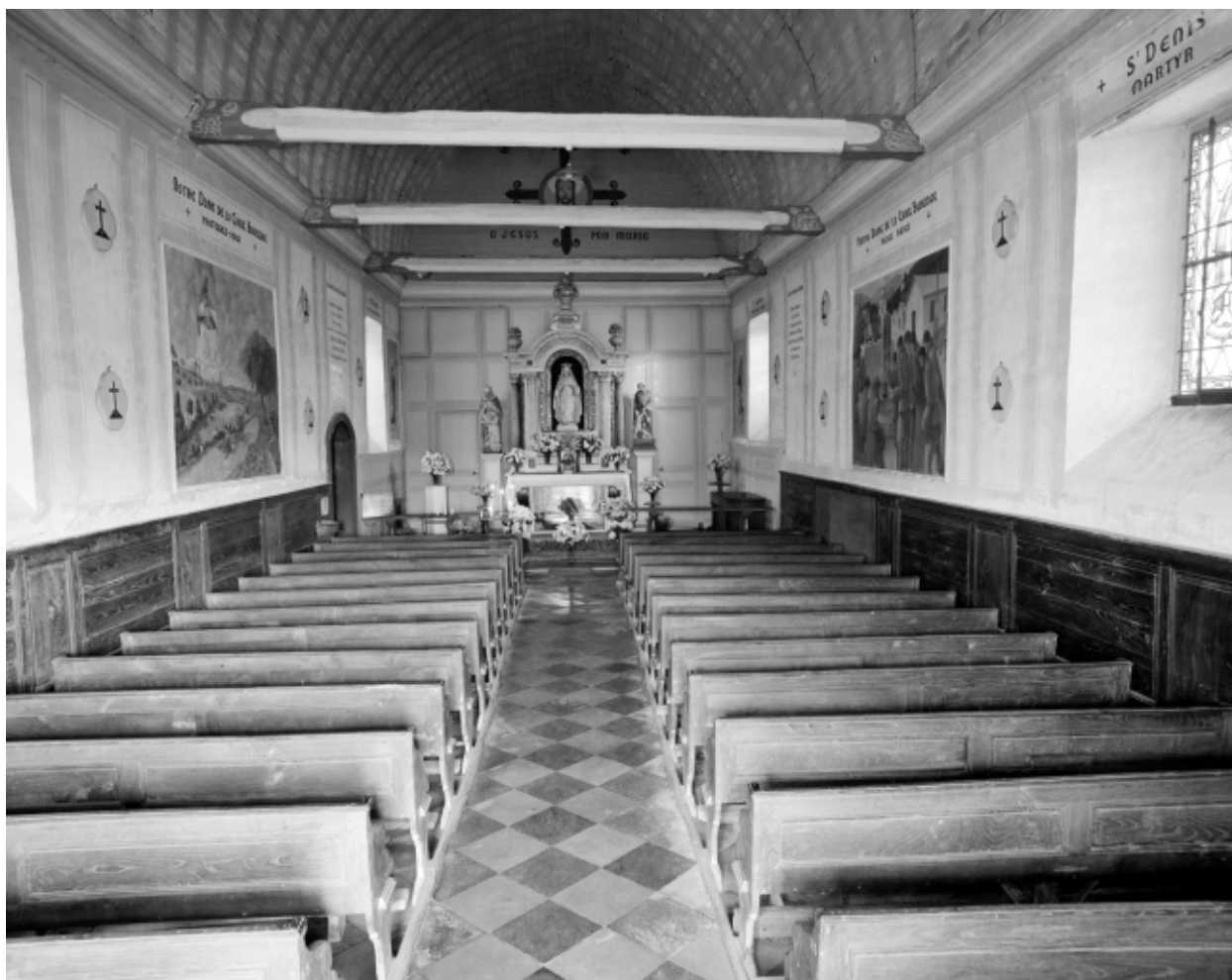
Intérieur : vue générale vers le chœur