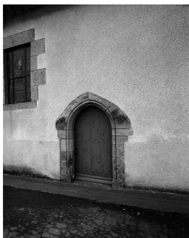
Elévation Nord, porte : vue générale IVR53_19933500187X