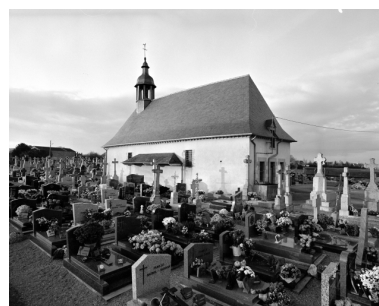
Elévation Sud-Est : vue générale, IVR53_19923500974X