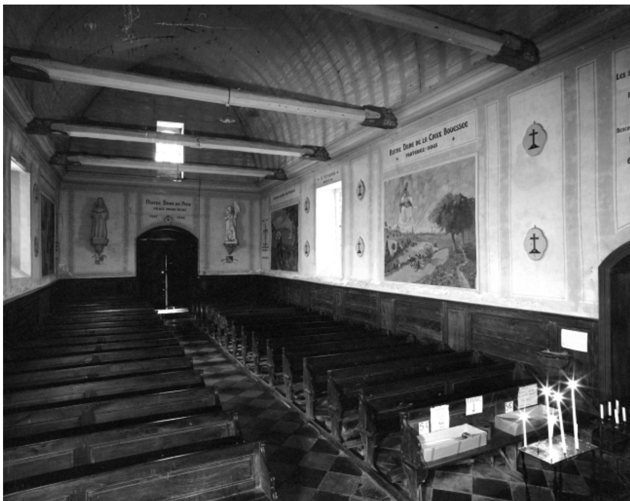
Intérieur, nef : vue générale.