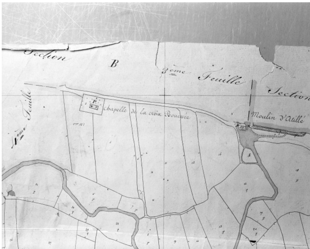
Extrait cadastral de 1837, section E1 n°3 (AD35 : 3 P 5446)