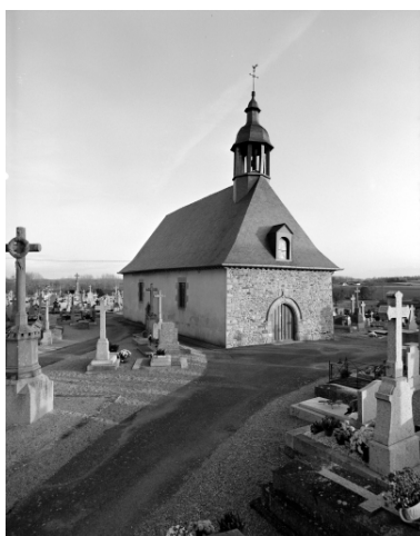
Elévation Nord-Ouest : vue générale IVR53_19923500973X