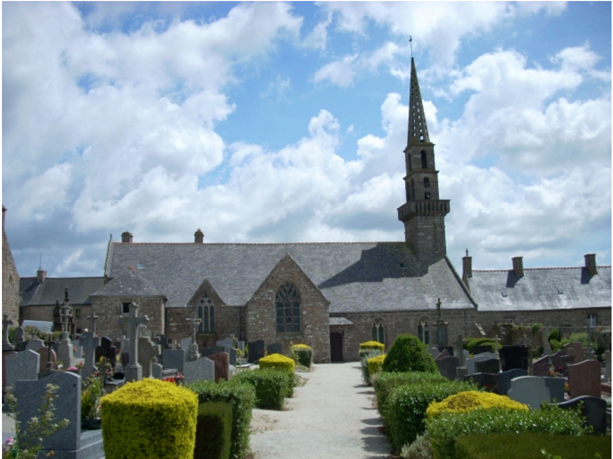
Brélès, église paroissiale : élévation nord