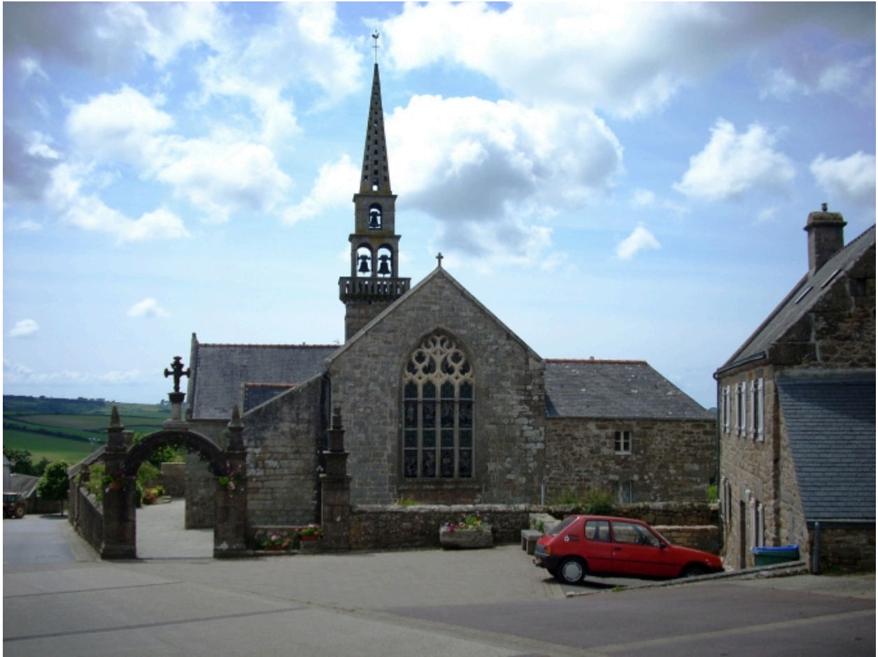
Brélès, église paroissiale : vue générale est