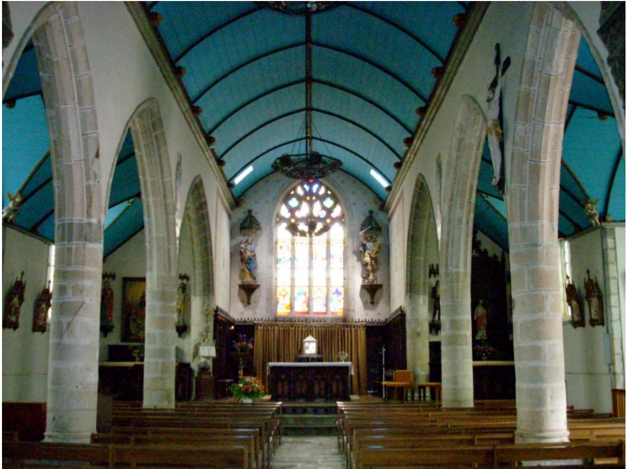
Brélès, église paroissiale : vue axiale est