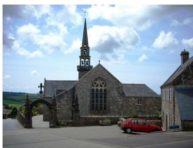
Brélès, église paroissiale : vue générale est IVR53_20082906221NUCA