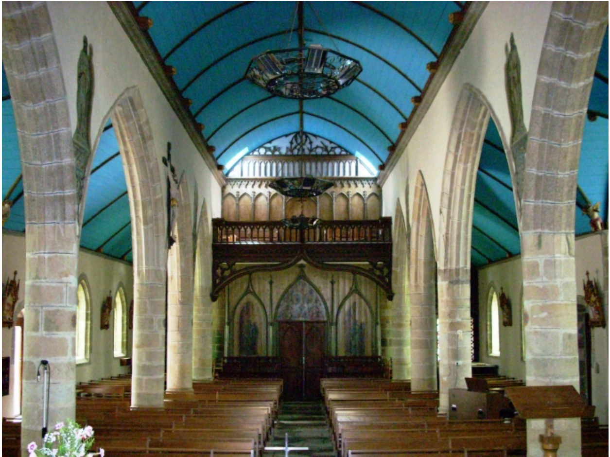
Brélès, église paroissiale : vue axiale ouest