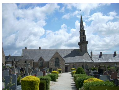
Brélès, église paroissiale : élévation nord IVR53_20082906220NUCA