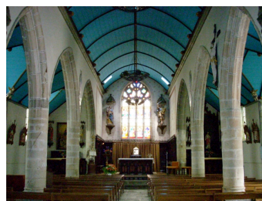
Brélès, église paroissiale : vue axiale est