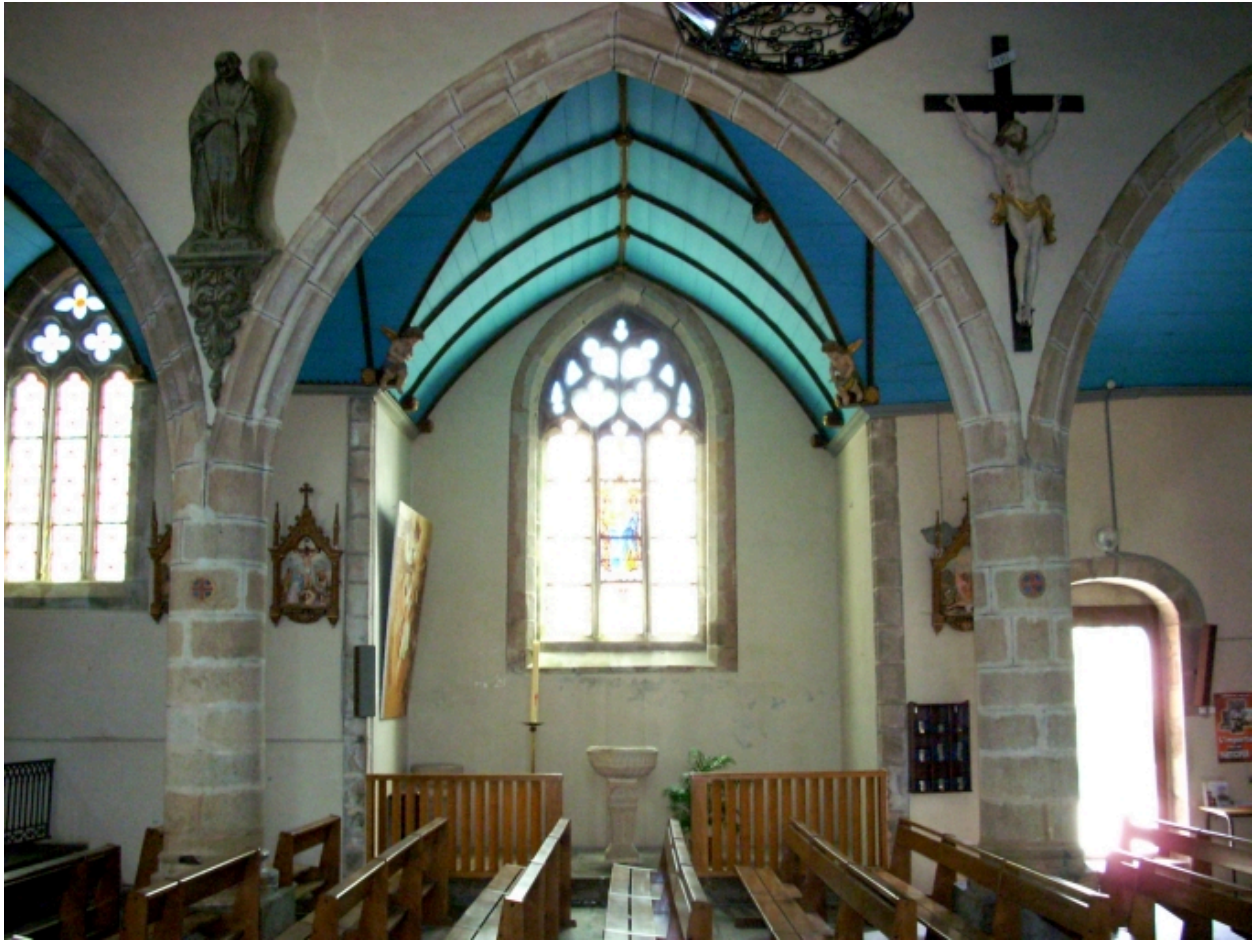
Brélès, église paroissiale : vue de la chapelle latérale depuis la nef